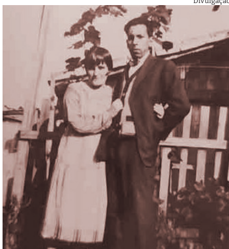
O poeta Baltazar de Godoy Moreira