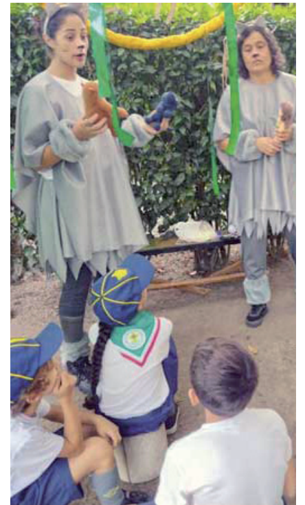
Os Lobinhos do Grupo Escoteiro Itapeva participam da Flipinda com uma Intervenção Artística