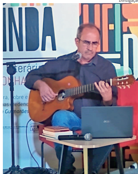
Momentos da 1ª edição da Flipinda