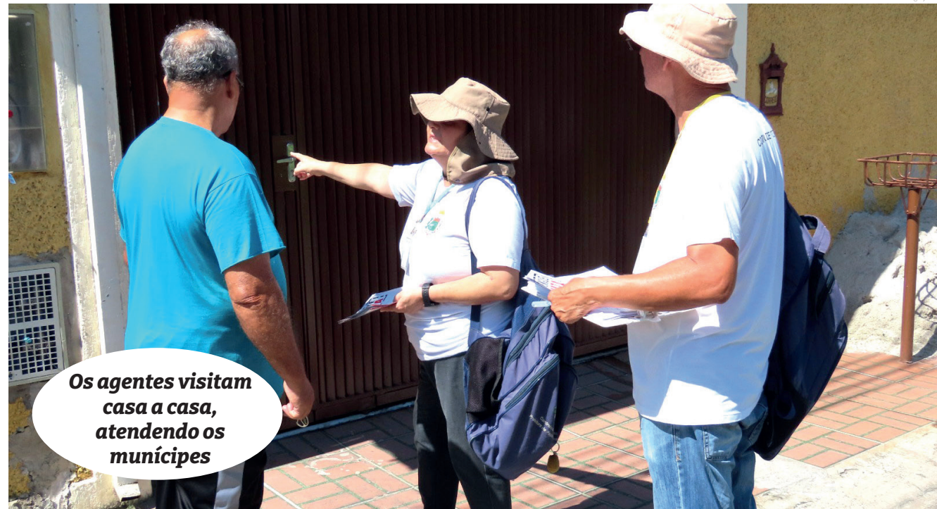
Os agentes visitam casa a casa, atendendo os munícipes

Além das visitas domiciliares, a Vigilância Epidemiológica planeja palestras em escolas e uma exposição na Praça Monsenhor Marcondes, com o objetivo de conscientizar a população sobre os riscos e formas de prevenção. A mobilização contará também com ações nas mídias sociais, visando engajar a comunidade no combate ao mosquito.