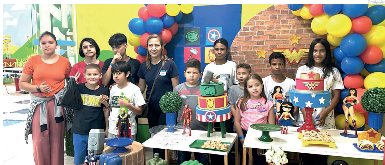
O Park Games foi um dos parceiros das atividades realizadas pelo CMDCA