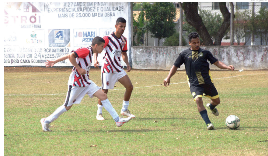
Os campeonatos vão chegando às partidas finais

Pelos jogos de ida da segunda fase, começando com um empate sem gols entre Inter de Vilão e Goiás, já no estádio do Maricá seis gols, definiram o empate em 3x3 entre Marica e Andrada, Atlético Crispim recebeu o Areião e saiu derrotado 2x1, já o Real esperança foi até ao Beta e