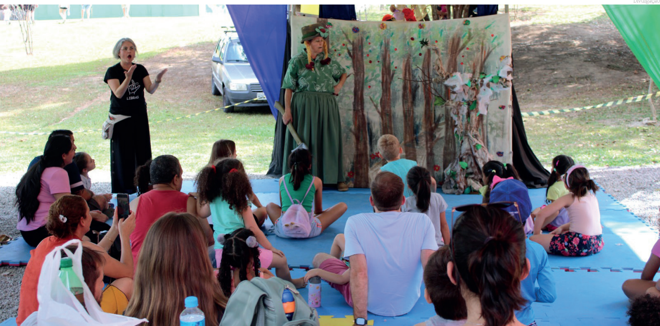
Todo o público que participou da Festa das Crianças pode se divertir e ainda aprender com as atividades que aconteceram

A Prefeitura de Pindamonhangaba realizou, no último sábado (12), um evento em comemoração ao Dia das Crianças no Parque da Cidade. Organizado pela Secretaria de Esportes e Lazer, a festa intitulada "No Mundo da Diversão" reuniu aproximadamente 8 mil pessoas, entre crianças e suas famílias, com uma programação repleta de atividades lúdicas, esportivas e culturais.