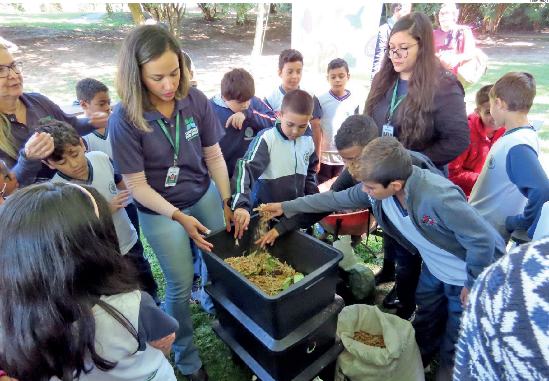
O 'Composta Pinda', da Secretaria de Meio Ambiente, está entre os 11 projetos da cidade que disputam o prêmio de gestão responsável

Com 11 projetos selecionados dentre 18 categorias, a Prefeitura de Pindamonhangaba é finalista do Prêmio AMVALE de Gestão Responsável. O anúncio dos finalistas ocorreu nesta semana, e o prêmio de gestão responsável engloba práticas que promovem a transparência, eficiência e sustentabilidade nas ações administrativas.