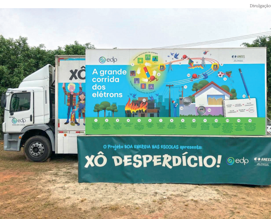
Laboratório itinerante leva conceitos sobre eficiência energética