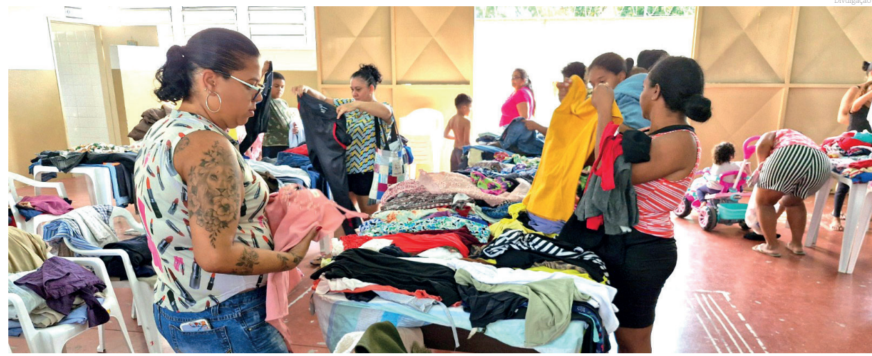
A ação busca atender às necessidades da comunidade, promovendo solidariedade e apoio

Nesta iniciativa, os participantes poderão escolher roupas dispostas em um varal montado especialmente para a ocasião. A ação busca atender às necessidades da comunidade, promovendo solidariedade e apoio mútuo. "Serão roupas em bom estado de conser-