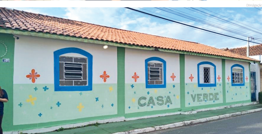
Os projetos concorrem a um prêmio que busca valorizar e estimular práticas de gestão responsável nos municípios da AMVALE