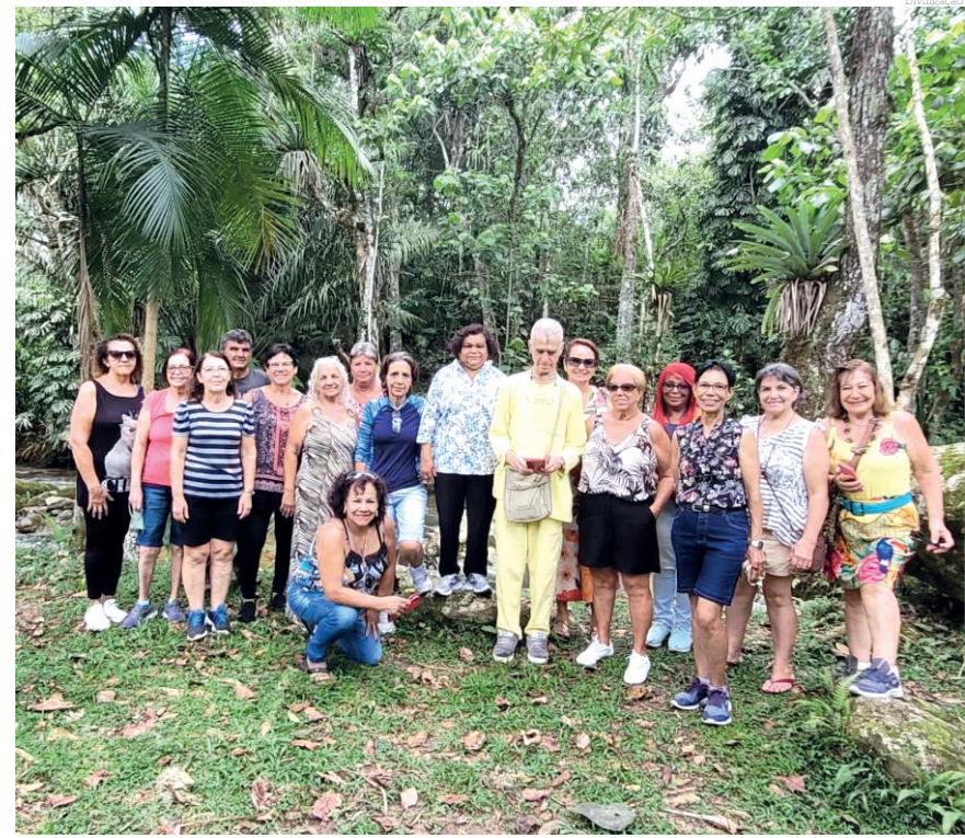
Os projetos destacam serviços de inclusão, entre outras ações

atrativos noturnos de Pindamonhangaba. É realizada uma visita em locais que são atrativos noturnos, com a produção de um evento e com isso promovemos o local e toda a cidade. Já o City Tour é uma visita monitorada e guiada aos pontos e atrativos do centro do município. Ele sempre acaba em um local distante, na zona rural, e também é um local de atrativo turístico. Ou seja, é a possibilidade do turista conhecer os atrativos do município e,