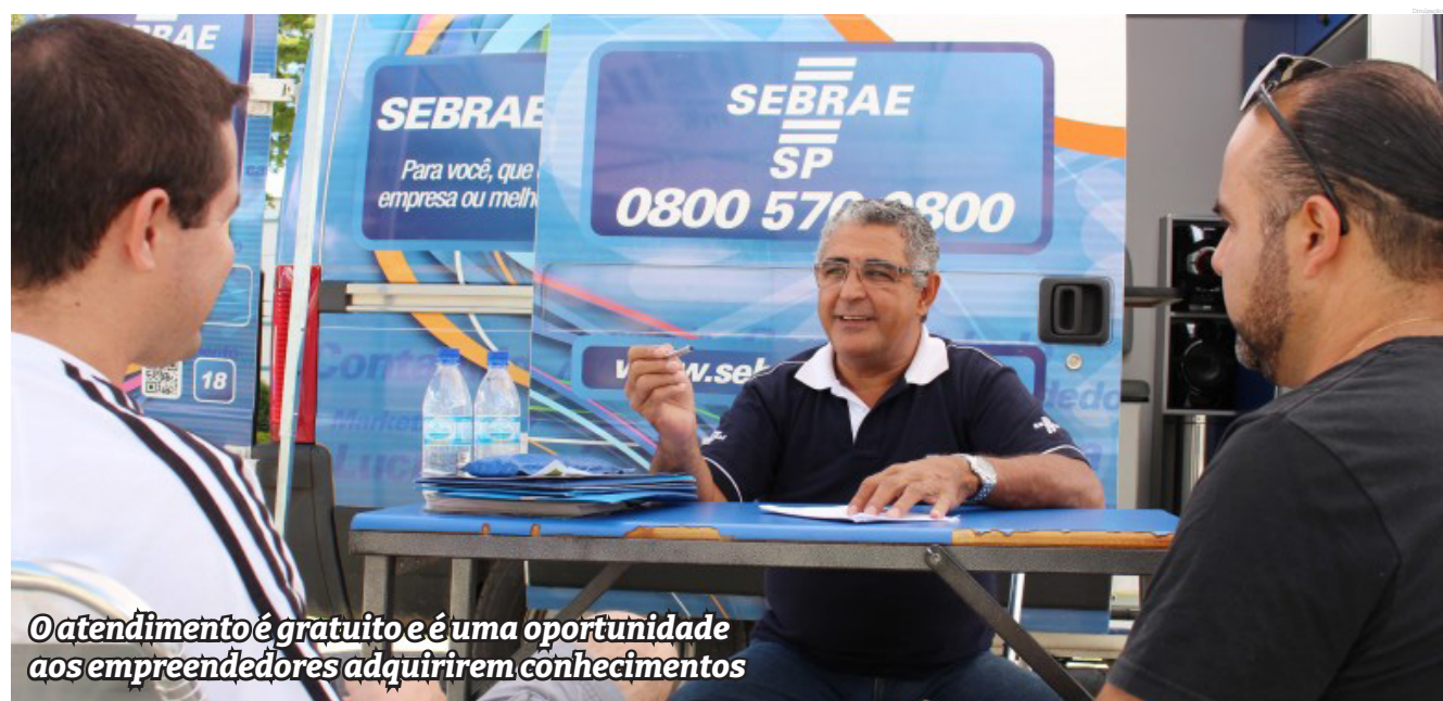
o atendimento é gratuito e é uma oportunidade aos empreendedores adquirirem conhecimentos

Além disso, o professor é um guia que, muitas vezes, marca a vida de seus alunos de forma indelével. A memória de um bom professor permanece viva na mente, seja pelo conhecimento transmitido, seja pela forma como acreditou no potencial de cada um. É por isso que a importância do professor transcende o papel acadêmico, tocando profundamente o desenvolvimento humano, social e emocional. Afinal, são eles que, dia após dia, plantam as sementes do futuro.