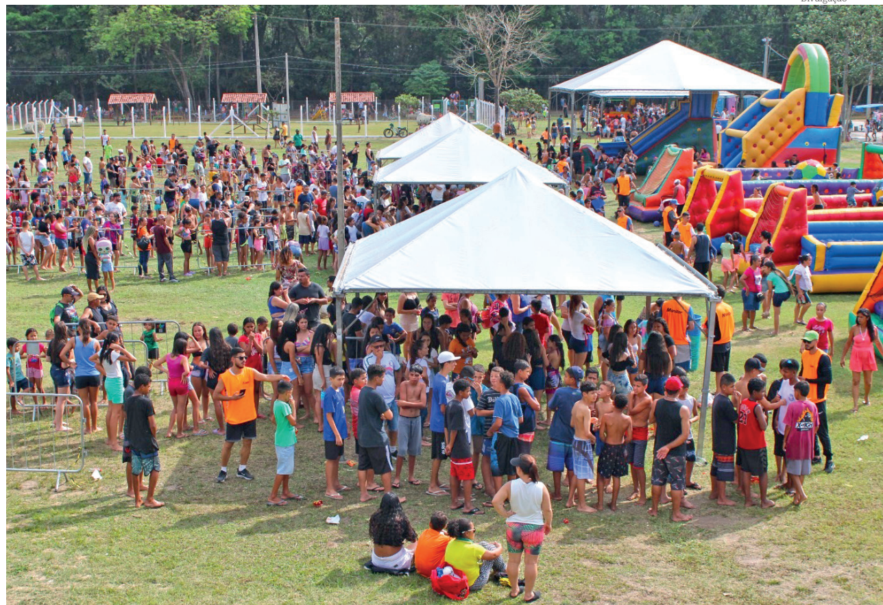
O Parque da Cidade recebeu um público estimado em 8 mil pessoas no Dia das Crianças

Receba as edições digitais da Tribuna do Norte DIARIAMENTE.