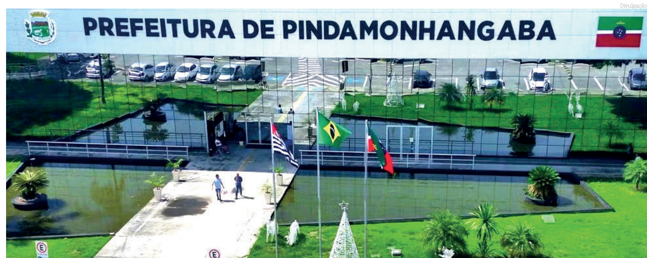
Os editais buscam fomentar a cultura em todo o município