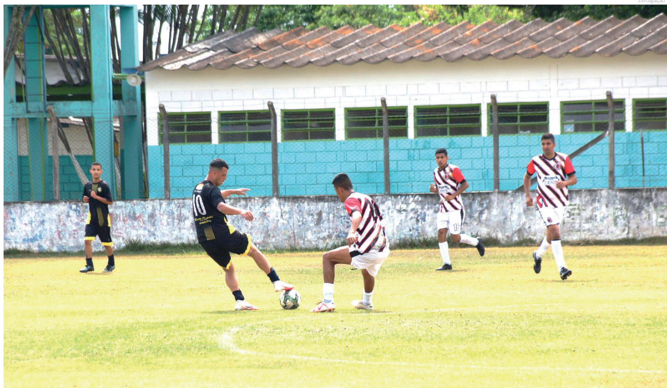
Os gramados de Pinda receberam os aletas de muitas partidas

Lembrando que os campeonatos são organizados pela Liga Pindamonhangabense de Futebol LPMF com o apoio da Secretaria de Esporte e Lazer SEMELP.