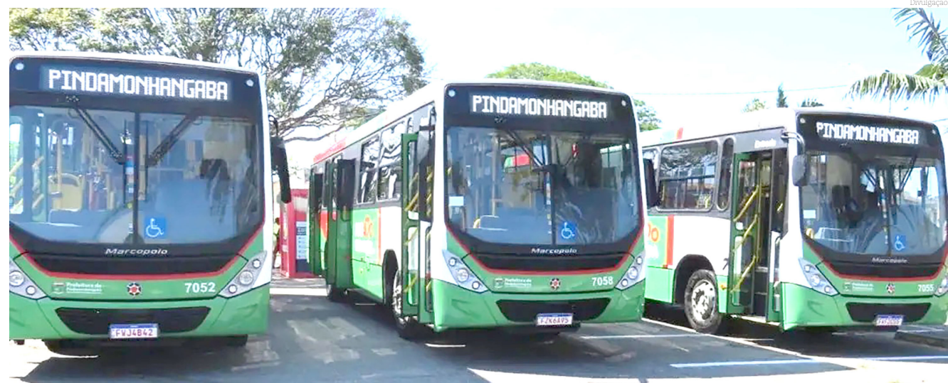
Os itinerários são os habitualmente praticados e acesso aos ônibus será pela porta traseira do veículo