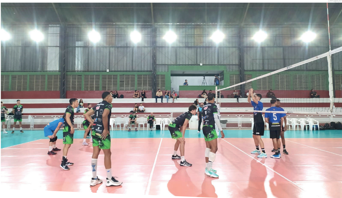
Equipe bateu Vedacit Vôlei Guarulhos fora de casa e agora espera definição do adversário nos play-offs

colocado, que poderá ser o Suzano vôlei ou o Esporte Clube Praia Grande. O importante é que o Instituto Transforma terá a vantagem de definir em casa em caso de empate. O início dos play-offs está previsto para a segunda quinzena de outubro.