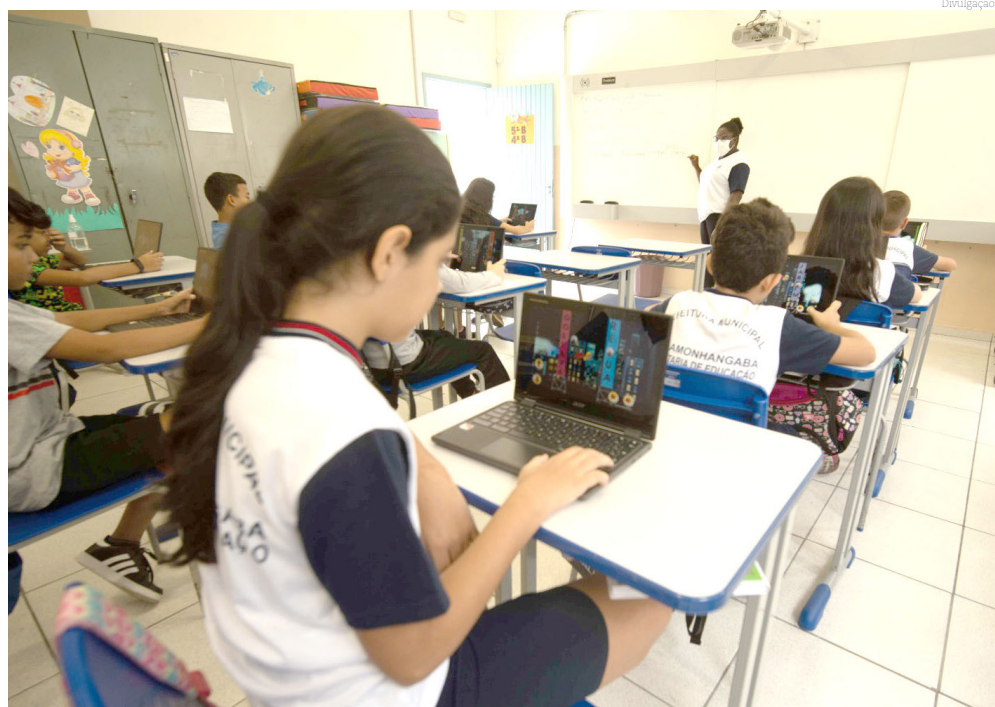
As vagas são para as crianças que tem entre 4 e 5 anos

A Secretaria de Educação de Pindamonhangaba vai abrir na segunda-feira (dia 7) as inscrições online para famílias interessadas em matricular suas crianças na rede municipal de ensino. As vagas serão para as crianças que se encontram na etapa obrigatória (pré-escola - 4 e 5 anos e 1º ano) e que atualmente frequentam escolas privadas ou ainda não pos-