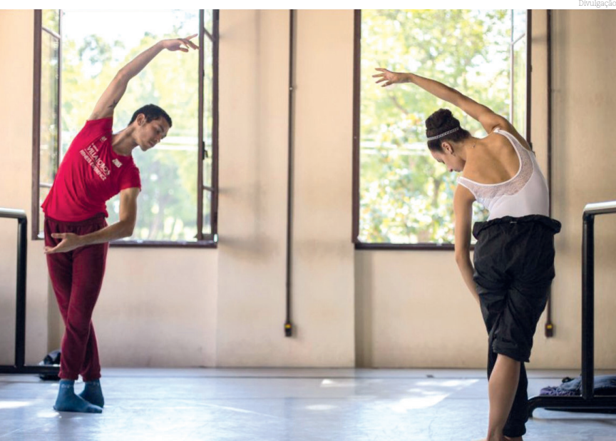
Os bailarinos e bailarinas interessados devem ter mais de 18 anos e DRT emitido

A São Paulo Companhia de Dança (SPCD) - corpo artístico da Secretaria da Cultura, Economia e Indústria Criativas do Governo do Estado de São Paulo, gerida pela Associação Pró-Dança - abre as inscrições para audição a fim de selecionar novos integrantes para seu elenco fixo.