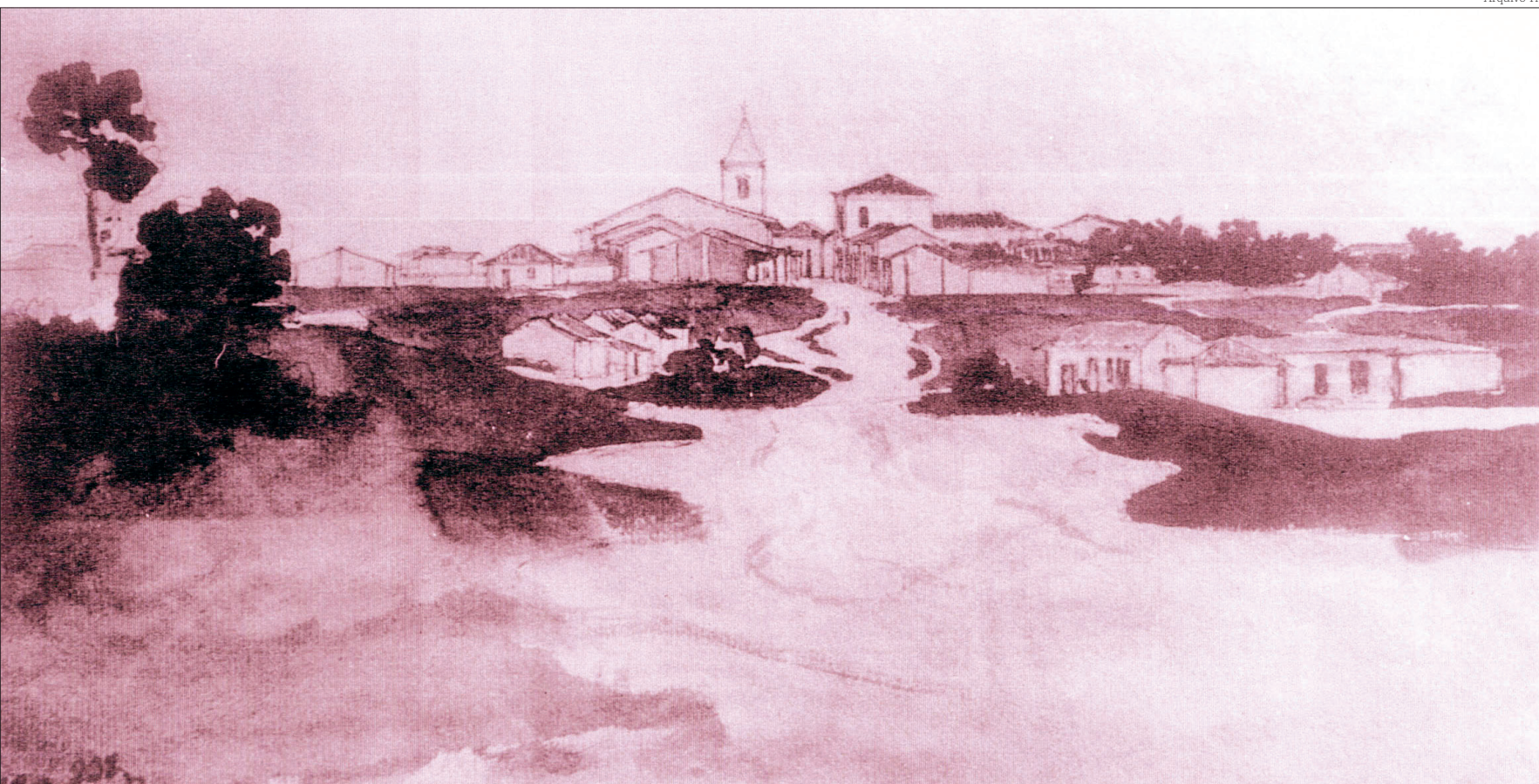
Vila de Pindamonhangaba no início do século XIX (desenho de Thomas Ender com lápis aquarelado - 1817)