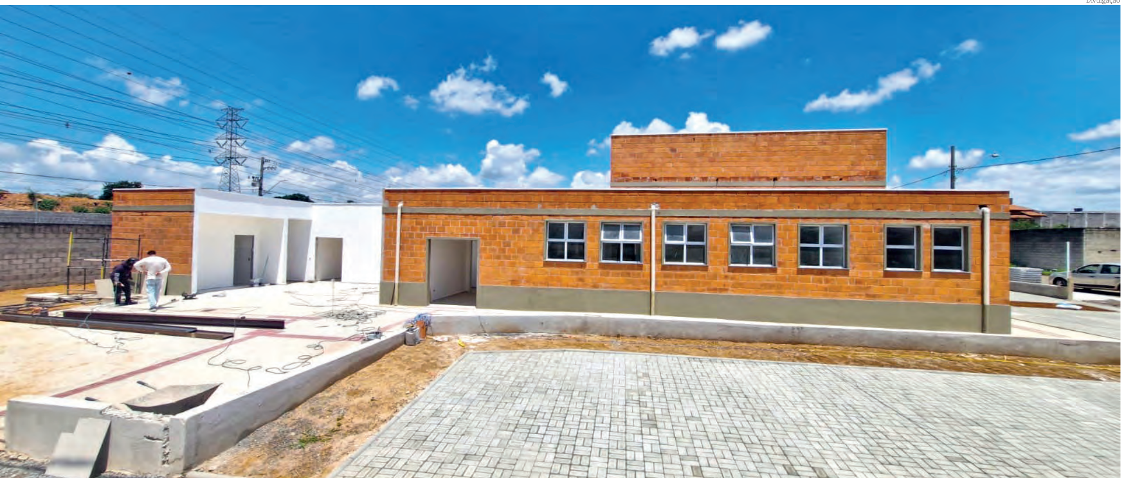
Novas unidades em construção beneficiarão diversos bairros; no Maricá, a unidade terá 347m 2 de área construída na Av. Girassol, no Residencial Laguna