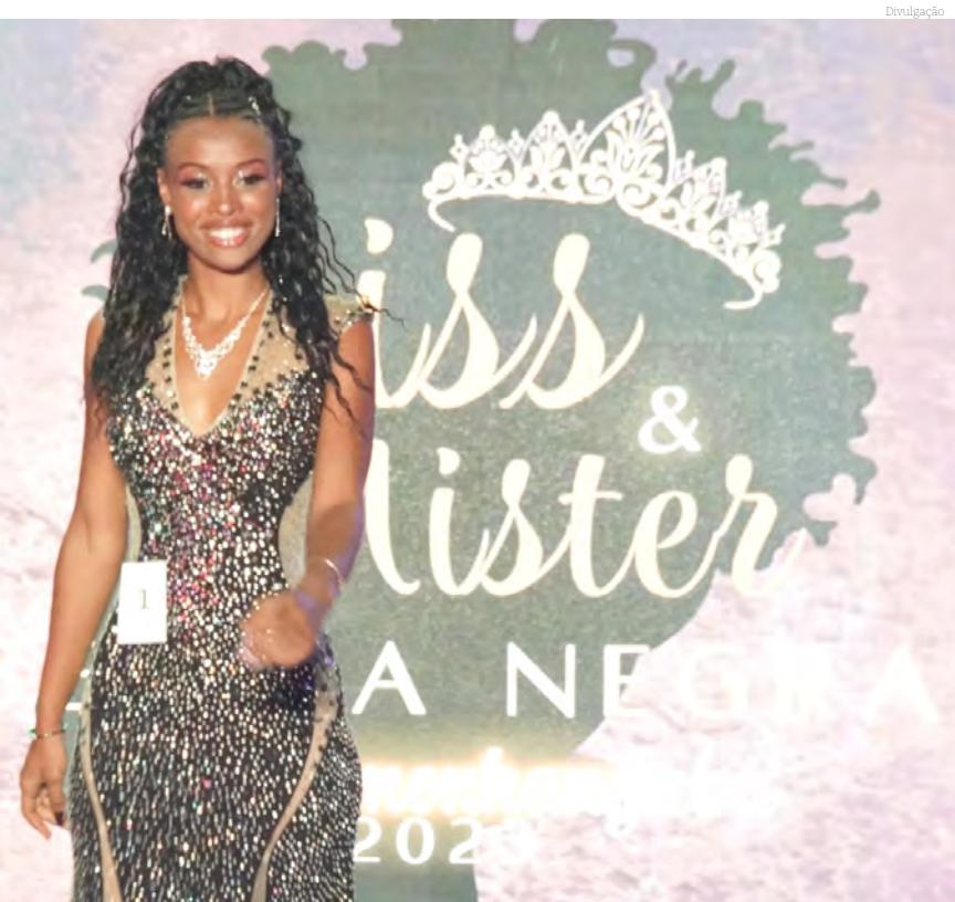
O concurso acontece nos dias 16 e 17 de novembro