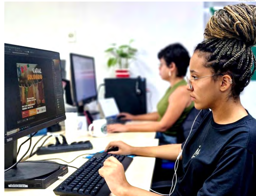
O estágio é uma oportunidade de crescimento profissional

Para se cadastrar, o estudante deve ter idade mínima de 16 anos até a data de término das inscrições, estar matriculado nos cursos e semestres indicados e residir em Pindamonhangaba.