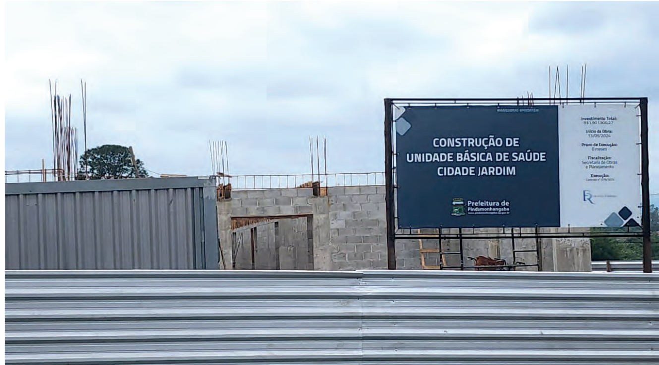
Unidade em fase de finalização no Cidade Jardim