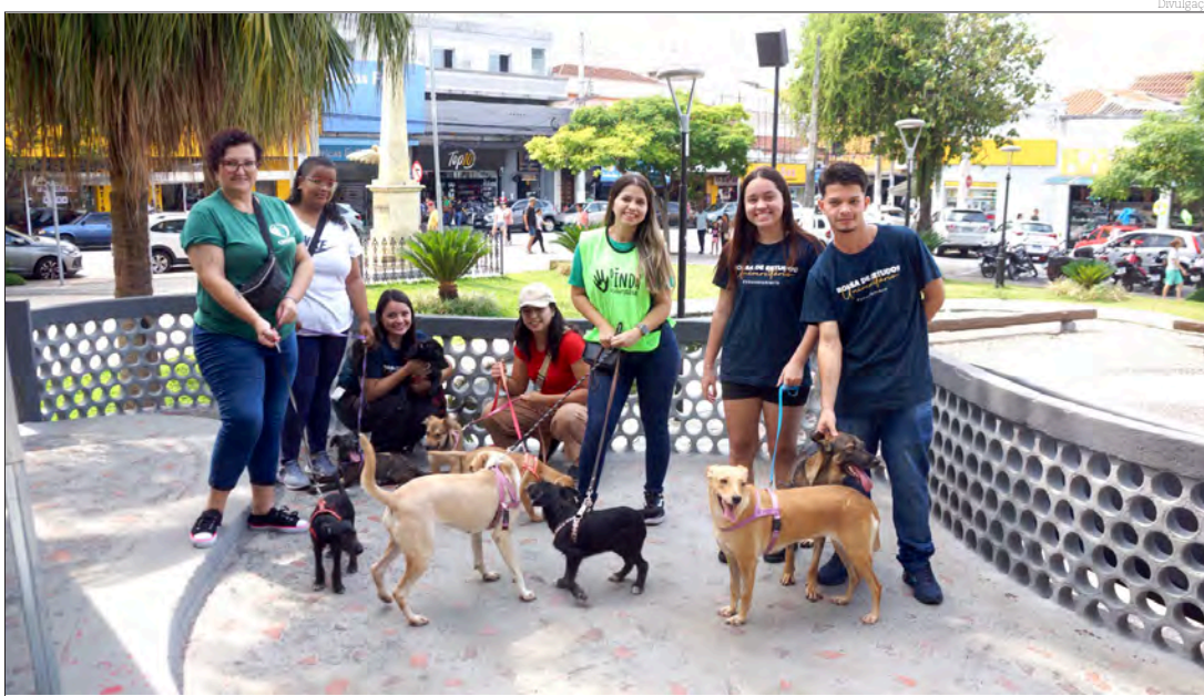
O Cepatas também esteve presente, realizando uma feira para adoção de animais