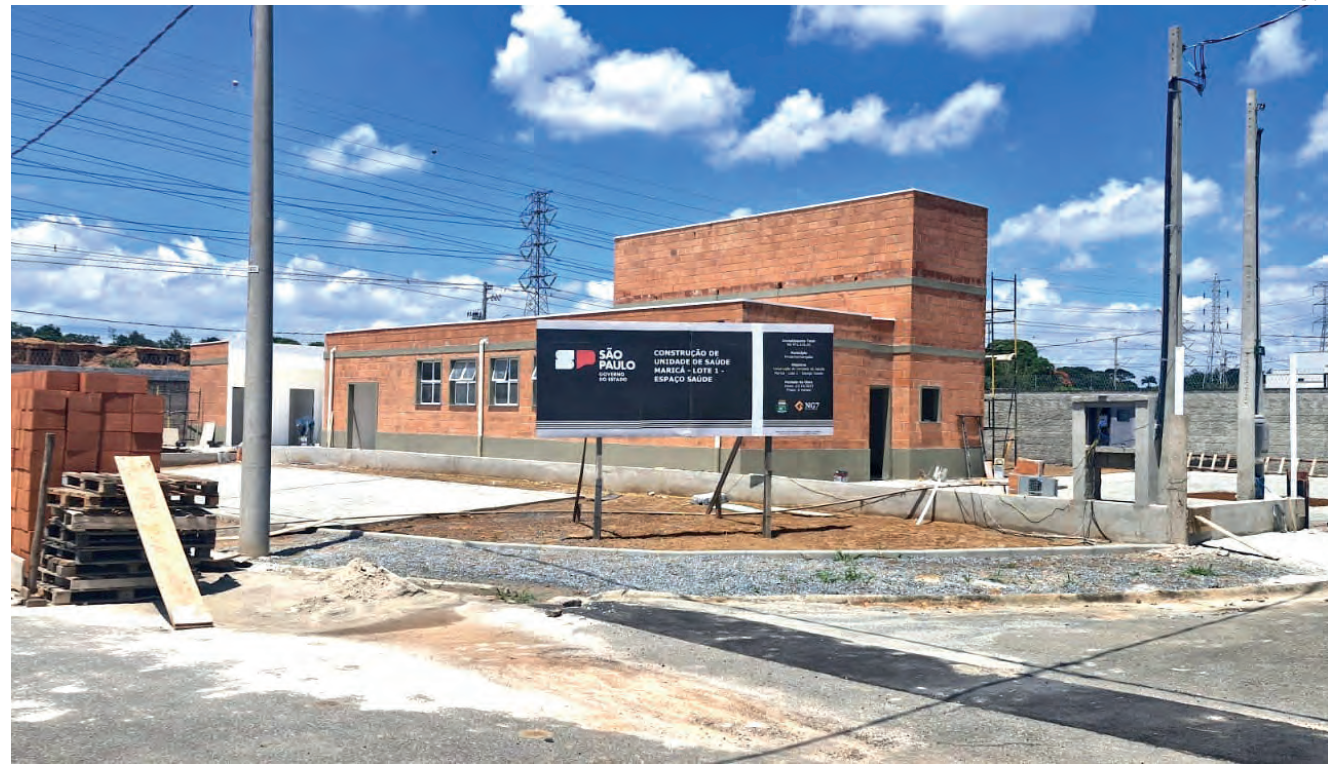
Unidade em construção no Maricá