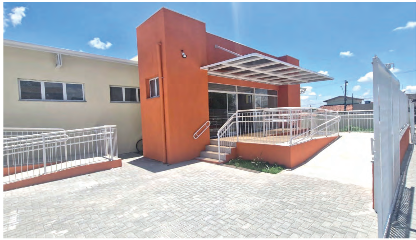
Unidade em fase de finalização no Mantiqueira