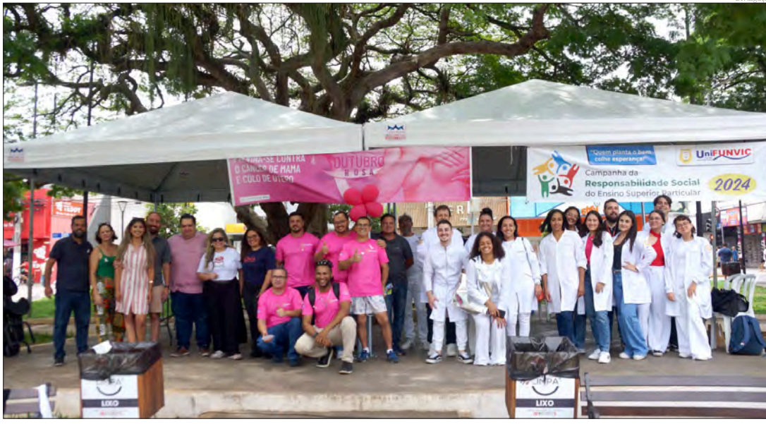
Muitas instituições se uniram nesta causa