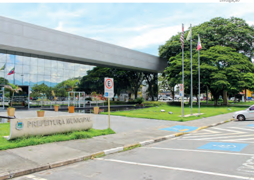
São vagas em nove áreas de nível superior e duas de nível técnico