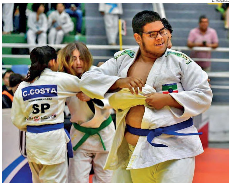
Parceria com a Prefeitura promove aulas de judô e taekwondo

O projeto acontece Jardim Regina em Pindamonhangaba e atende não apenas os alunos desta unidade escolar, estendendo-se aos alunos da rede municipal de ensino e demais moradores da comunidade e re-