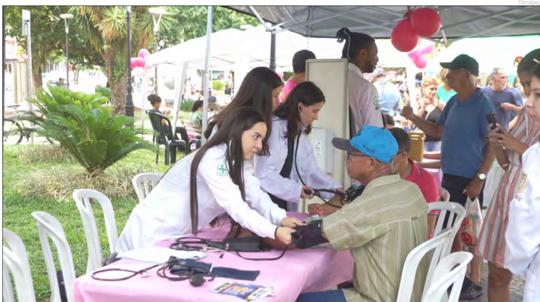
Vários exames foram realizados entre os participantes da campanha