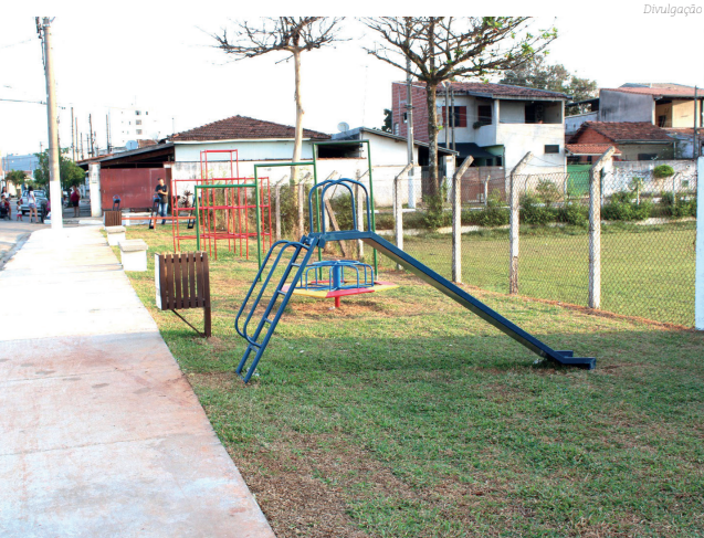
Área de lazer