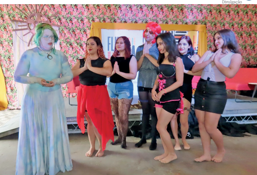
A programação contará com mesas de debate, palestras, lançamentos de livros, saraus, atividades lúdicas e musicais

'1º ENCONTRO DA REDE DE PROTEÇÃO À MULHER VÍTIMA É REALIZADO EM PINDA'