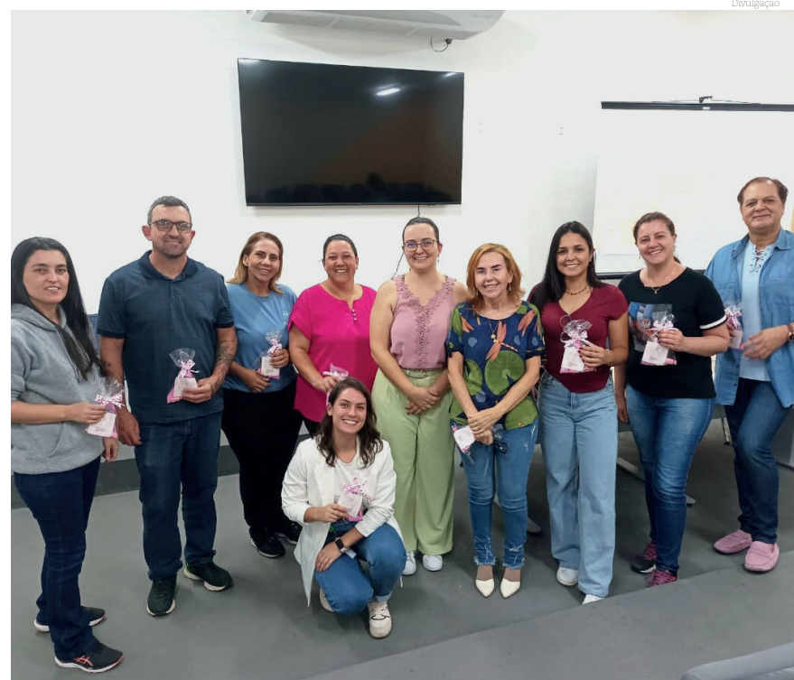
Os profissionais foram preparados para um atendimento mais especializado

Pindamonhangaba foi escolhida pelo Grupo de Vigilância Epidemiológica do Estado de São Paulo para sediar a capacitação por desenvolver um trabalho que é referência para municípios da região.