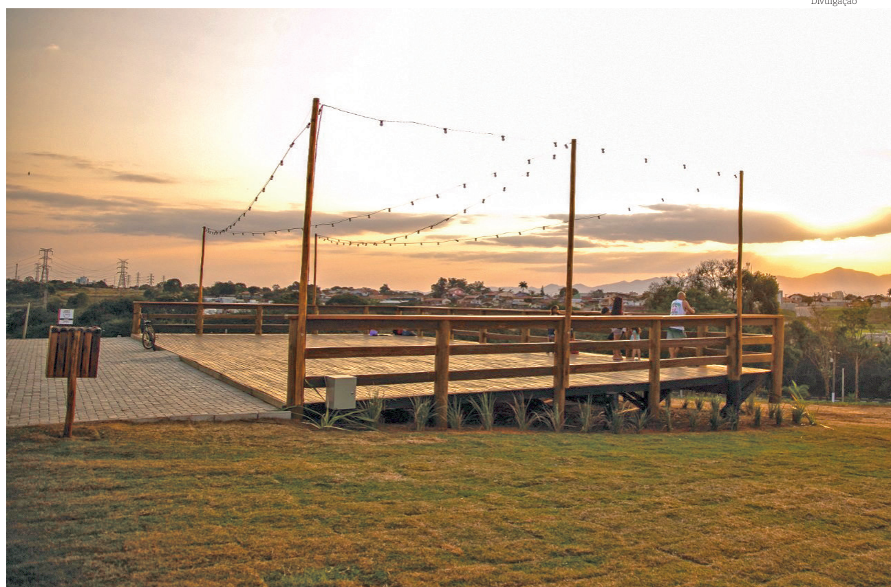
A série de inaugurações começou no dia 3 de julho com o Deck do Parque da Cidade