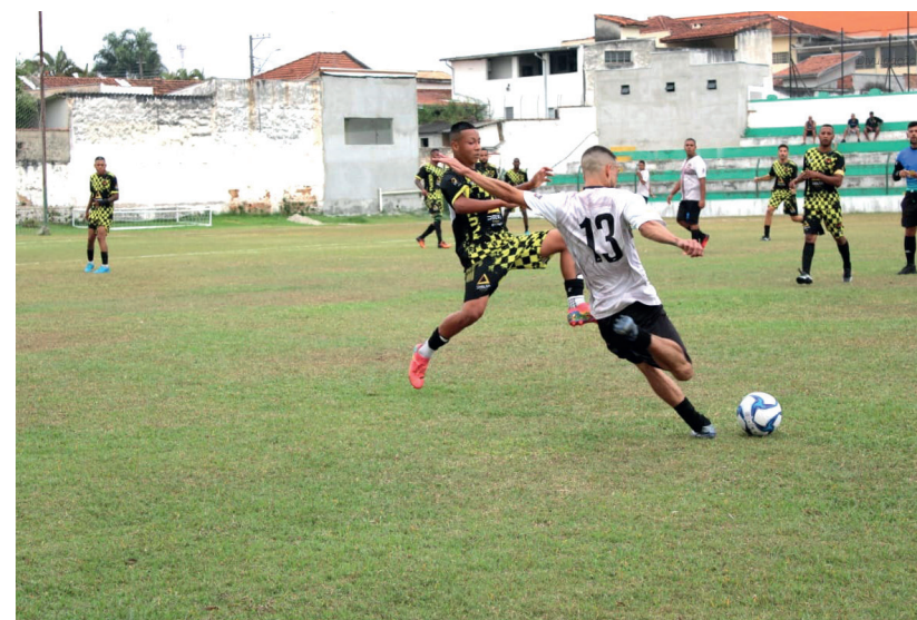
Mita movimentação nos campos de futebol neste fim de semana

Na sexta rodada da terceira divisão, Atlético Crispim enfrenta Moreira César às 10h30, no estádio do Estrela. As outras partidas são: Goiás x Inter de Vilão, às 10h30, no estádio do Cidade; União Pindense x Real Moreira, às 10h30, no estádio da AFIZP; Andrada x Real Mombaça, às 8h15, no estádio da AFIZP; Santa Luzia x Cruzeiro, às 8h, no estádio do Santa Luzia; Marca da Promessa x Real União Oliveira, às 10h30, no estádio do Moreira César; Beta x Ajax, às 10h30, no estádio do Bandeirante; Maricá x Galáticos, às 10h30, no estádio do Maricá; Independente x Areião, às 10h30, no estádio do Independente; União Nova Esperança x Milan, às 8h, no estádio do Fluminense; 100