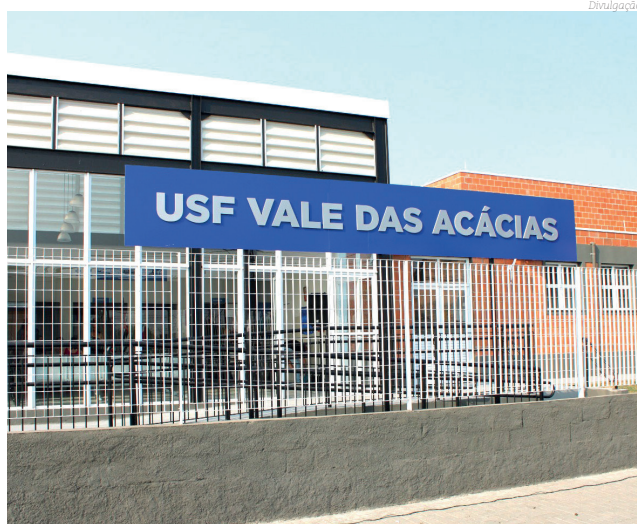
Vale das Acácias recebeu USF