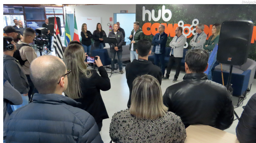
O Hub Coworking quer estimular o empreendedorismo inovador

As inscrições estão abertas e devem ser feitas através de formulário específico disponível em https://pindamonhangaba.1doc.com.br/atendimento . As startups interessadas devem atender a requisitos como possuir CNPJ, estar formalmente constituídas e apresentar soluções inovadoras aplicáveis à região. O edital completo com todas as informações pode ser encontrado no link https://pindamonhangaba.sp.gov.br/hub-coworking .