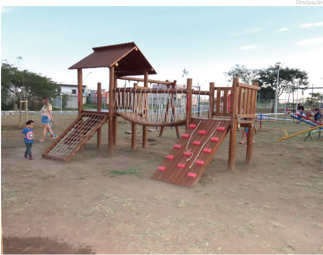
Equipamento reafirma compromisso da Prefeitura

Nos últimos meses, a Prefeitura de Pindamonhangaba entregou vários equipamentos públicos e espaços essenciais à população.