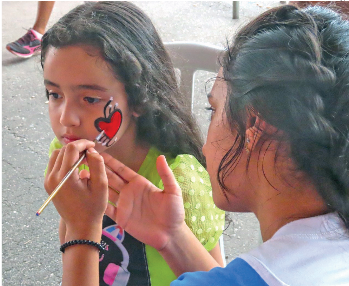
Futebol de sabão, tobogã, cama elástica, pintura facial, entre outras, são algumas das atrações

O Shopping Pátio Pinda recebe uma série de atividades especiais em comemoração ao Dia das Crianças. Atracões como Oficina de Laços e Pipas, Oficina Ovos Congelantes, teatro "A casa mágica da Gabby" e um Encontro de Miniaturas prometem trazer muita diversão para a criançada. PÁG. 8