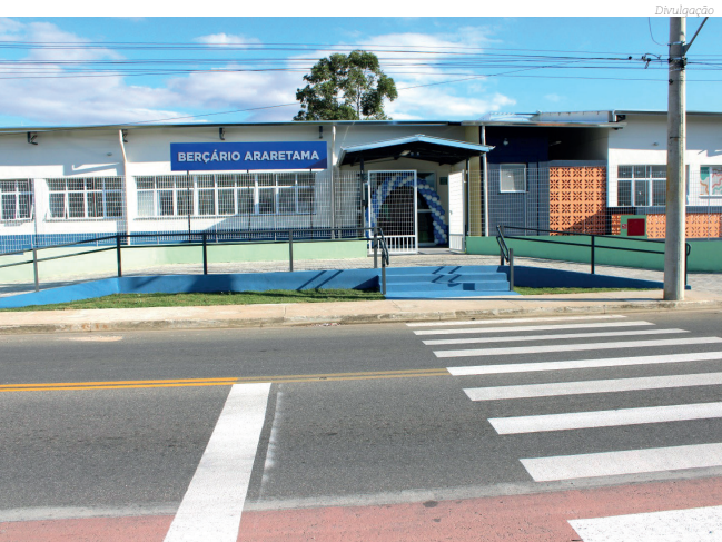
Novo equipamento no Araretama