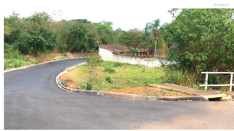
A obra oferece inúmeros benefícios à população