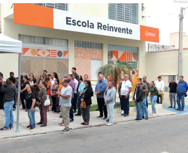
Escola Reinvente na região central