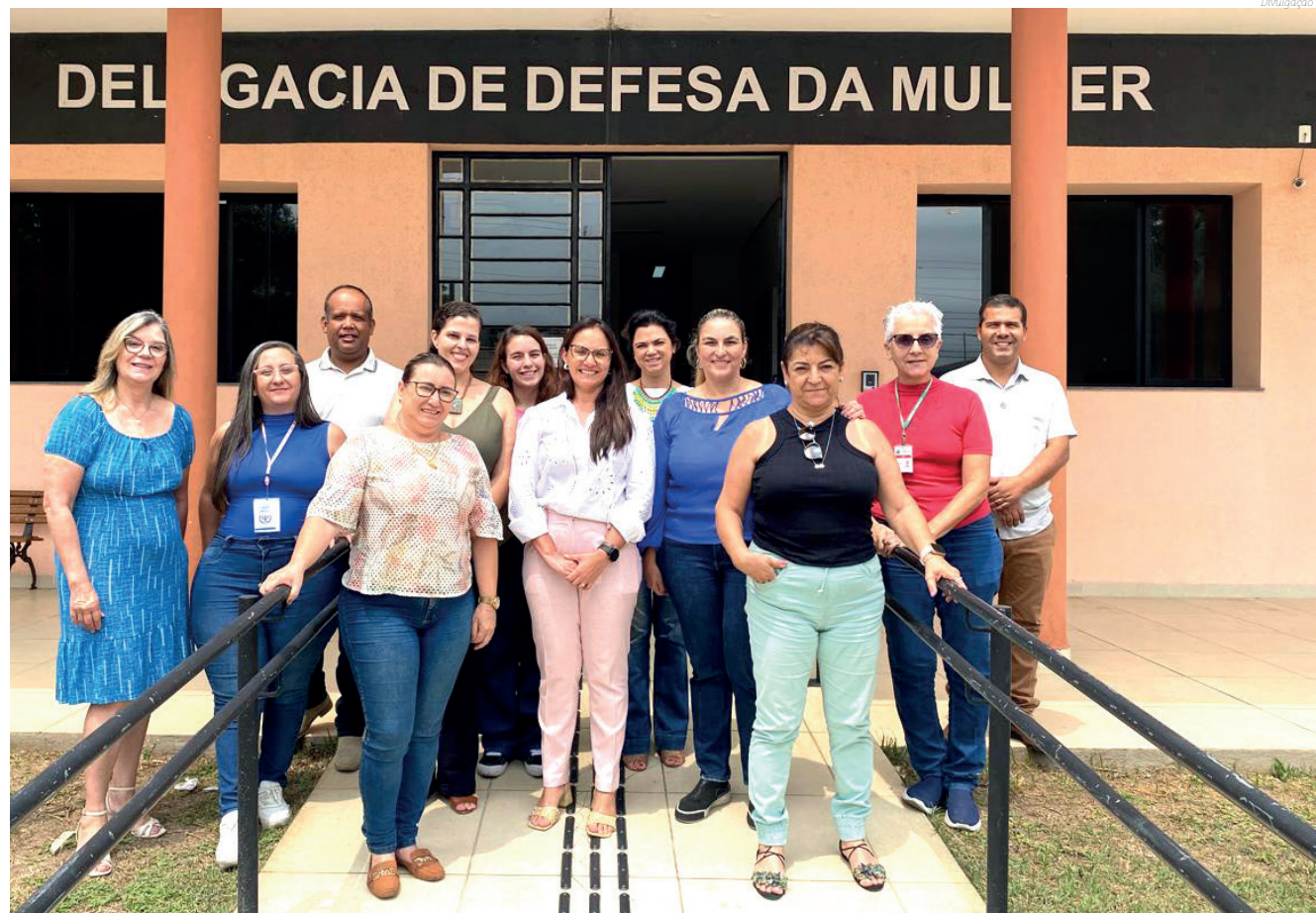
Vários órgãos participaram do encontro

Durante a reunião, foi concluído que no município há ofertas importantes, onde o desafio é articular as atividades buscando encerrar o ciclo de violência por meio do acolhimento humanizado, para que cada mulher seja ouvida, valorizada e apoiada em sua jornada de protagonismo e autonomia. Ressaltando-se que o apoio e as atividades também contemplarão os agressores, elemento fundamental e diferencial no combate à violência.