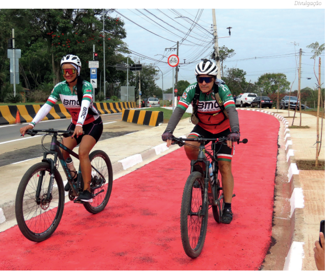
Ciclovía no Atanázio