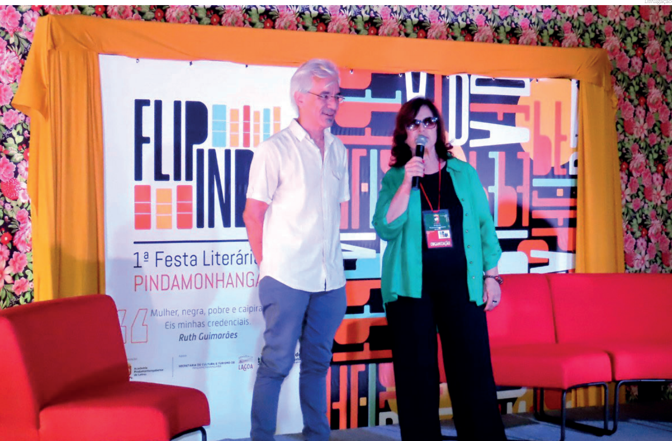
A Flipinda quer promover a produção literária e incentivar o hábito da leitura