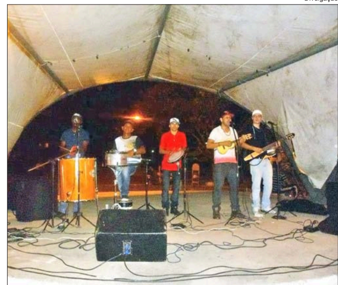
Palco montado na praça Pastor Ezequiel da Silva