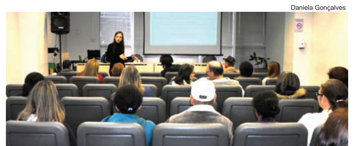
Cuidados com a saúde foram abordados no evento

O objetivo foi orientar sobre as corretas práticas de manipulação dos produtos, evitando os riscos