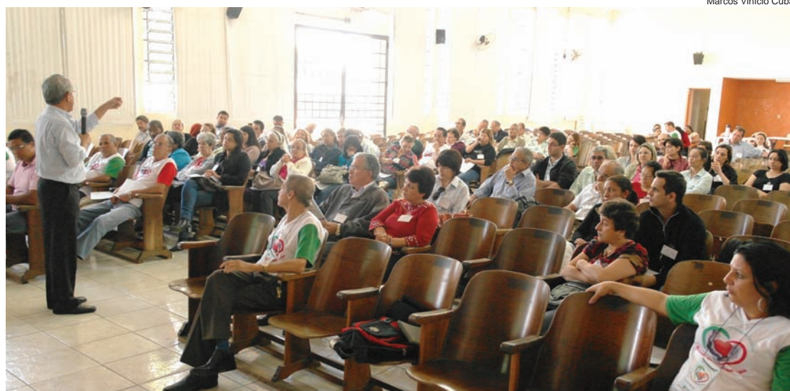
População pôde sugerir propostas para melhorias no sistema público de saúde