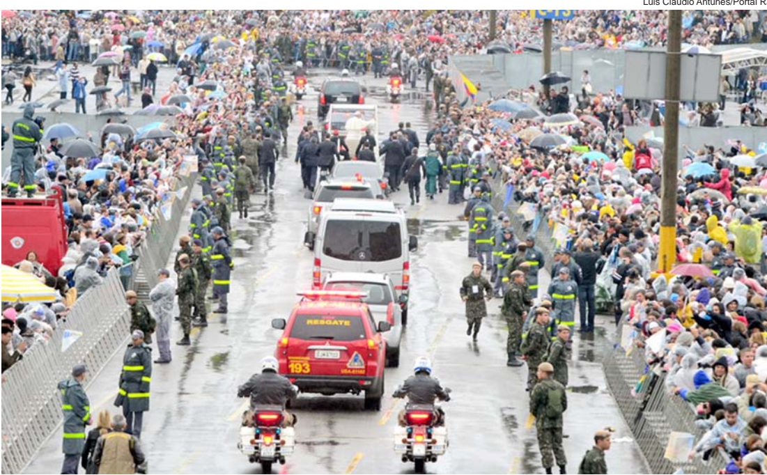
Milhares de fiéis acompanharam a trajetória do Papa pela cidade

Na ocasião, ele pediu que os fiéis rezassem por ele e prometeu voltar ao Brasil em 2017. Ele ainda almoçou na cidade e abençoou a imagem de Frei Galvão.