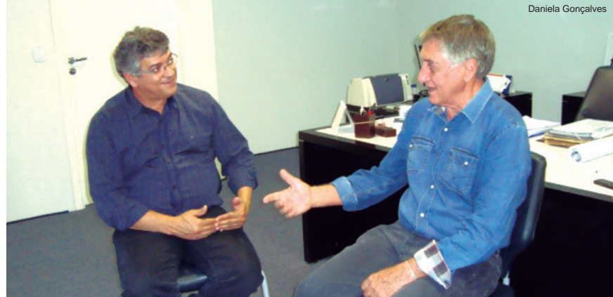
Deputado e prefeito conversam sobre aplicação dos recursos