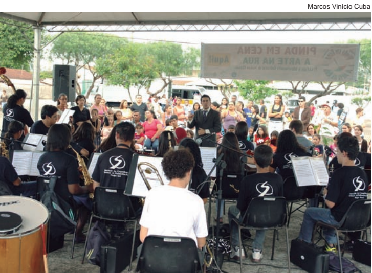
Jovens da Camerata durante apresentação no distrito