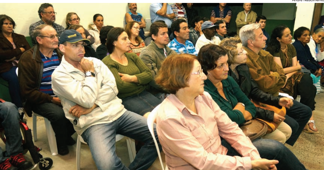
Moradores solicitaram construção de centro comunitário e gabinete odontológico