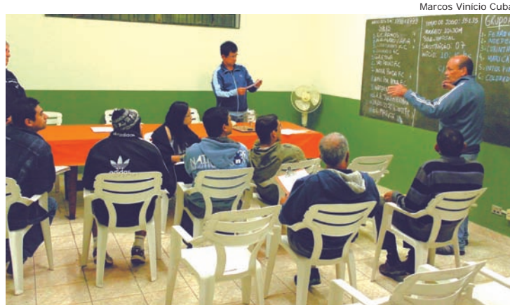
As competições terão início a partir do dia 17 de agosto

Na categoria Sub 11 são 7 equipes e os jogos serão em turno e retorno, o tempo de jogo definido é 25 x 25 e as partidas terão início às 8h30. Já na Sub 15 as equipes foram divididas nos grupos A e B, somando 12 clubes. O