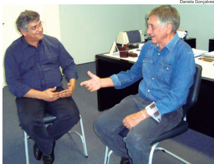
A melhora na saúde foi o principal tema do encontro

visa a compra de uma ambulância e de uma van para Secretaria de Saúde. Este in-