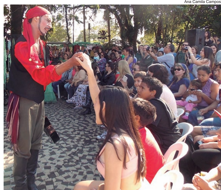
Ator de 'La Maldicion' interage com plateia