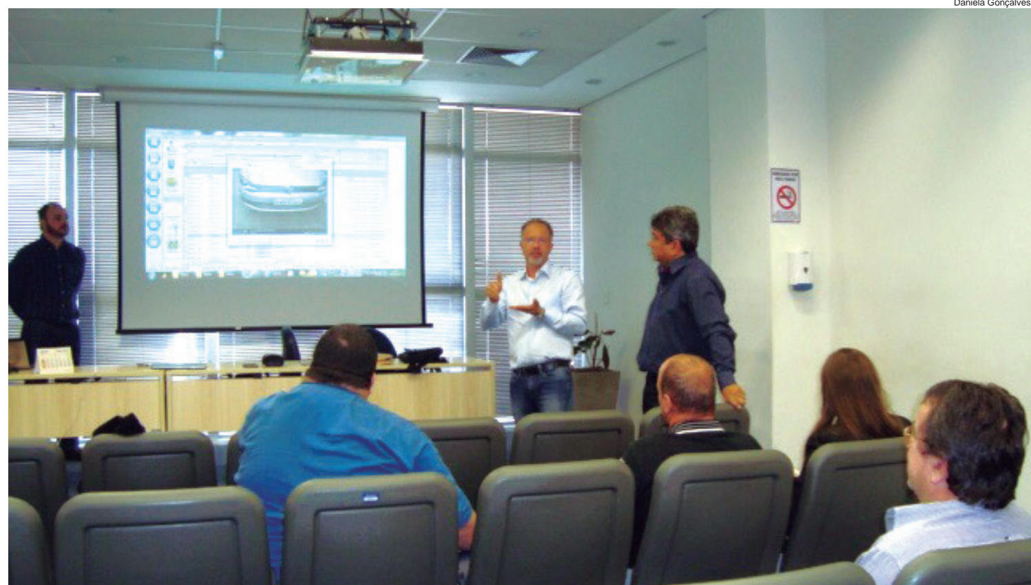
Com o serviço os tickets poderão ser pagos antecipadamente e o cliente terá a opção de adquiri-lo pelo celular

O sistema Vaga Inteligente deverá ser implantado na cidade dentro de alguns meses.