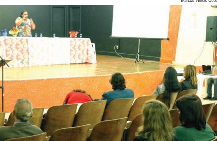
A conferência teve representante do Ministério da Saúde

Reforçar a implantação das UPAs na cidade; Implantação do CAPS AD - Centro Atenção Psicossocial Álcool e Drogas; Reavaliar o modelo de marcação de consultas no município; Implantação de Pronto-Socorro Infantil; Capacitação continuada dos profissionais de saúde (humanização e acolhimento).