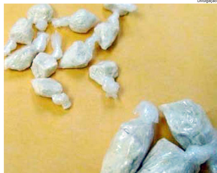
A polícia apreendeu 22 pedras de crack

Um adolescente de 15 anos admitiu que estava vendendo entorpecentes. O registro ocorreu por volta das 14 horas do dia 20, no bairro Arareta-ma. A PM, em patrulhamento de rotina, avistou dois indivíduos em frente uma residência e observou que um estava entregando a droga ao outro. Ao abordar o menor, encontrou R$ 50, em seu poder. Fazendo revista na casa do adolescente foi encontrada uma sacola na gaveta da pia, contendo 10 trouxinhas de maconha, 22 pedras de crack, 30 pinos de cocaína e mais R$ 292.