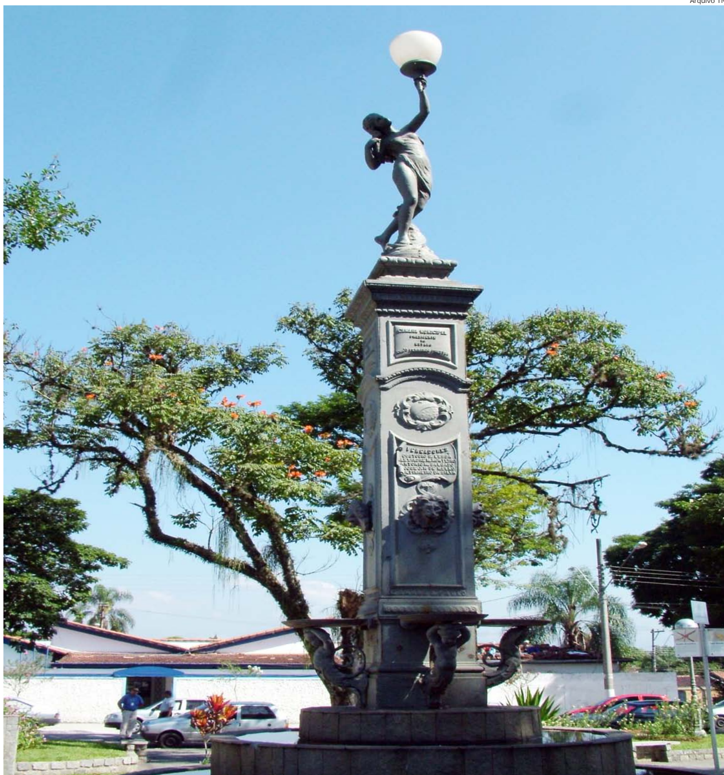
"...também temos uma Estátua da Liberdade" (marco histórico do primeiro serviço de abastecimento de água do município, instalado na praça Dr. Emílio Ribas desde 1959)