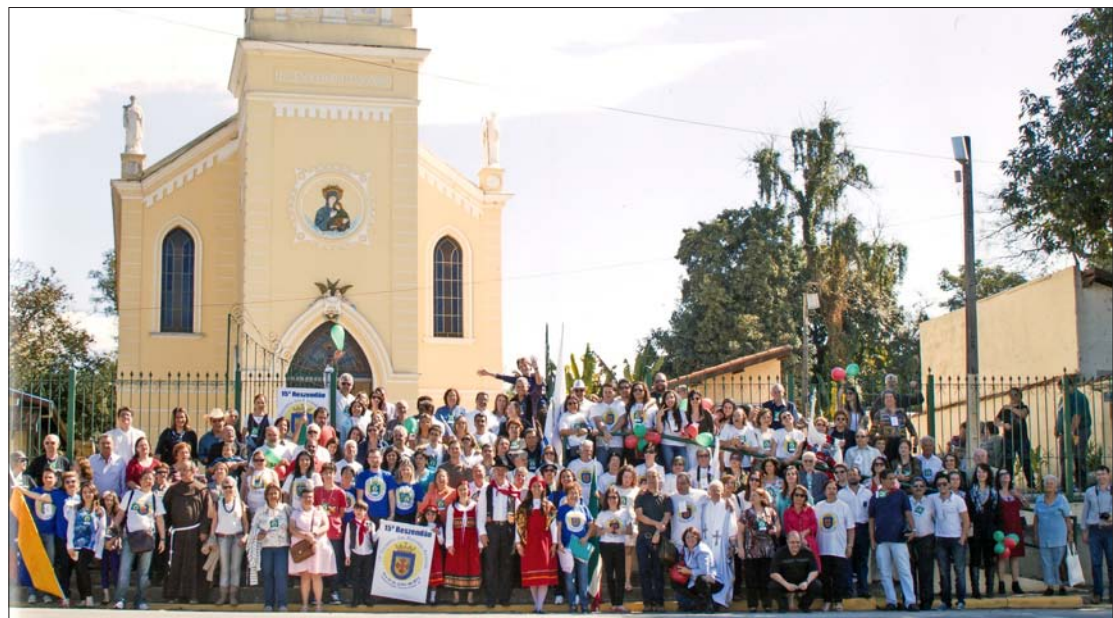
Os Rezende fazem parte da vida de Pindamonhangaba desde 13 de julho de 1946