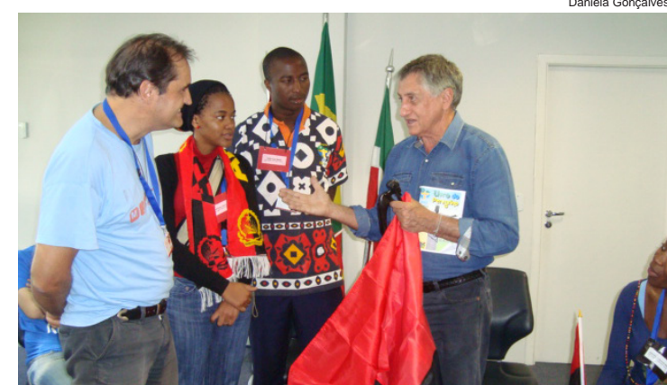
Prefeito recebe produtos da cultura angolana

Para eles, a estada na Princesa do Norte pôde fazê-los ir mais motivados em busca pela fé.