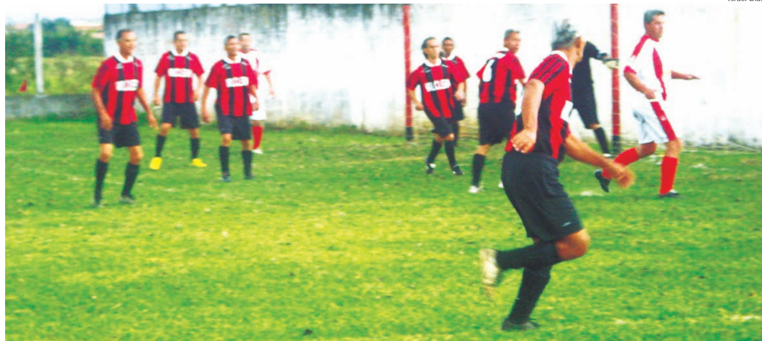
A defesa do Flamengo precisa jogar com atenção para evitar gols da equipe do Cidade Nova