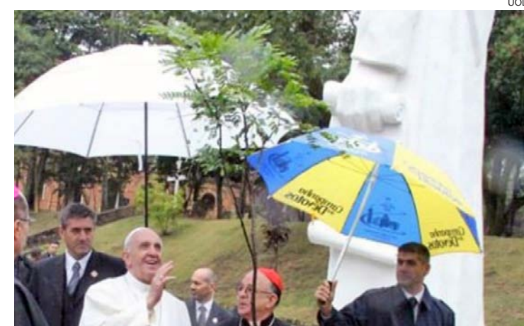
A imagem restaurada de Frei Galvão recebeu as bênçãos

Para receber a unção do pontífice, a peça, que mede oito metros e pesa mais de 1,6 tonelada, foi retirada de Guaratinguetá, onde estava instalada, e voltou para o ateliê do artista para passar por uma restauração completa.