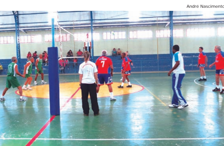
As equipes convidam a população para conferir o jogo