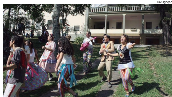
O espetáculo Giselle será apresentado em Três Lagoas