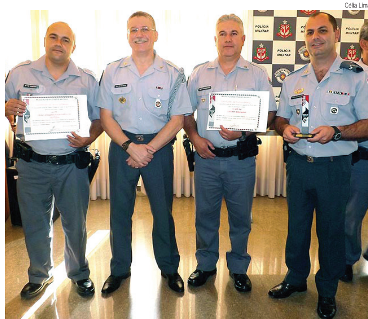
Cerimônia ocorreu no salão nobre da PM em São Paulo