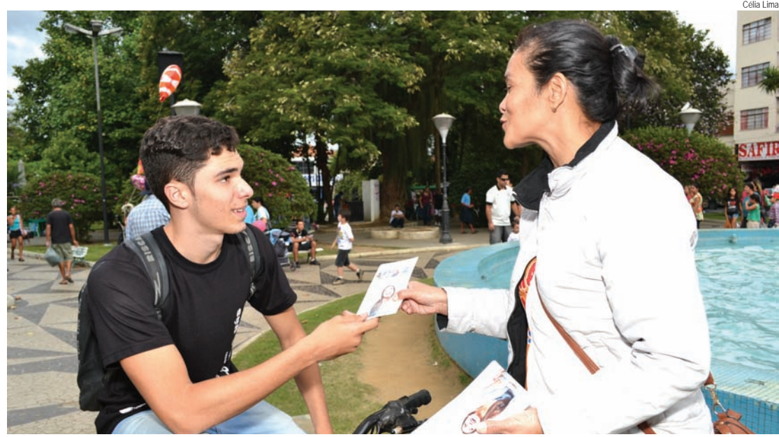
Jovem recebe orientação na praça Monsenhor Marcondes

Estiveram presentes instituições como o Amor Exigente, Alcoólicos Anônimos e Narcóticos Anônimos.