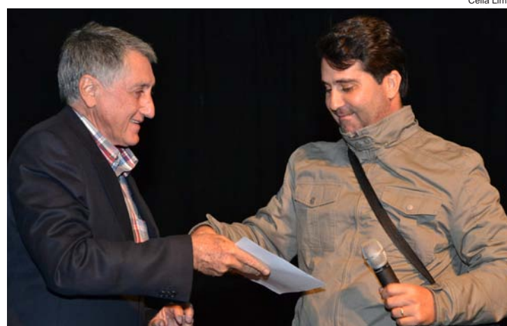
“A Farsa do Advogado Pathelin” será a representante de Pindamonhangaba na modalidade Teatro