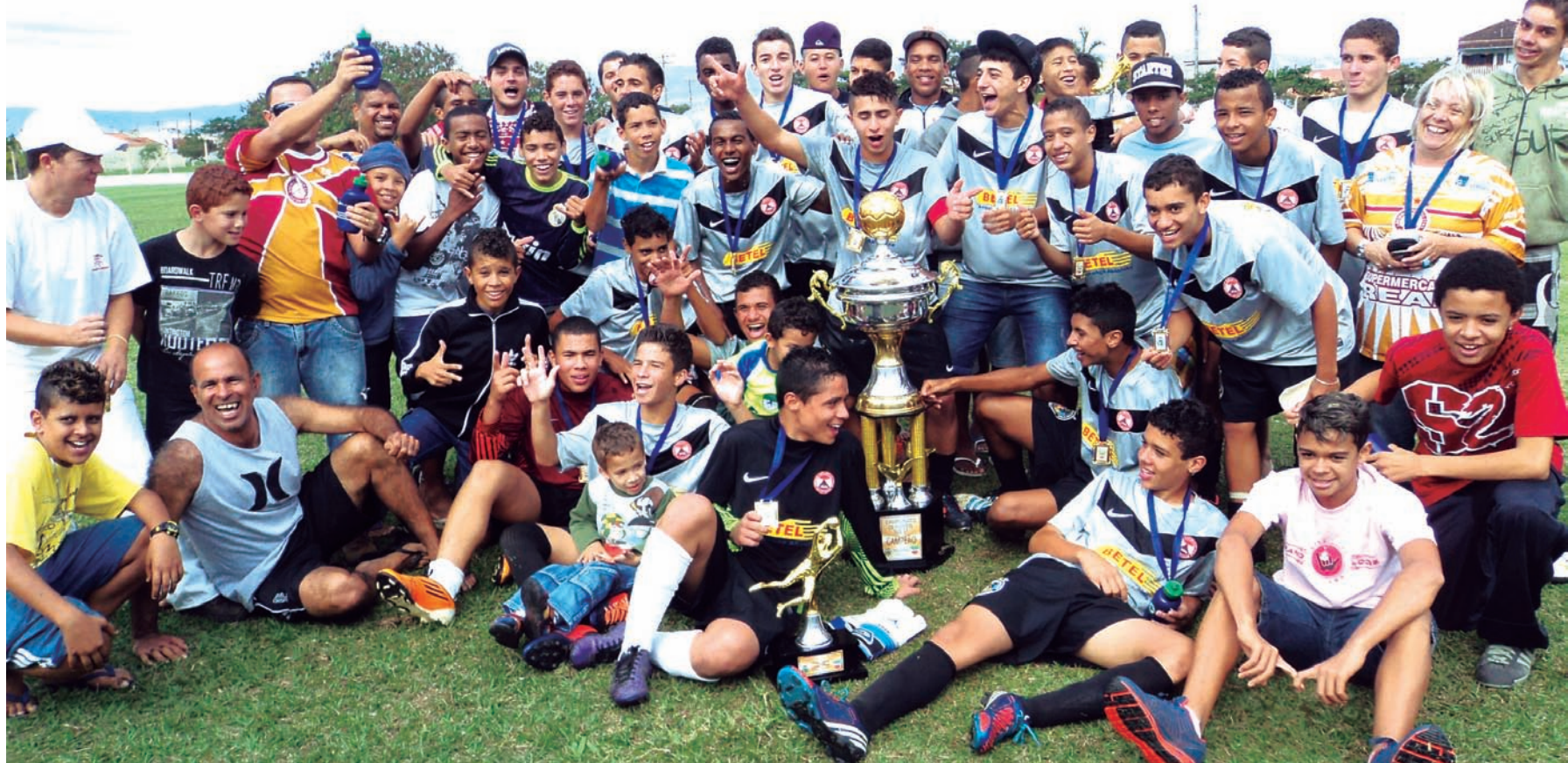
Jogadores e comissão técnica do Etna comemoram o título do Sub 17, após jogo emocionante contra o Ramos no sábado (22) no "Macedão"