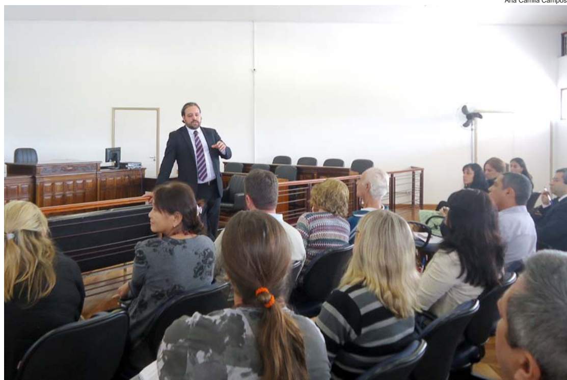
A intenção do trabalho é proteger as crianças e adolescentes da cidade

Nesta quarta-feira (26), será realizada uma reunião extraordinária exclusivamente destinada à composição formal da comissão.