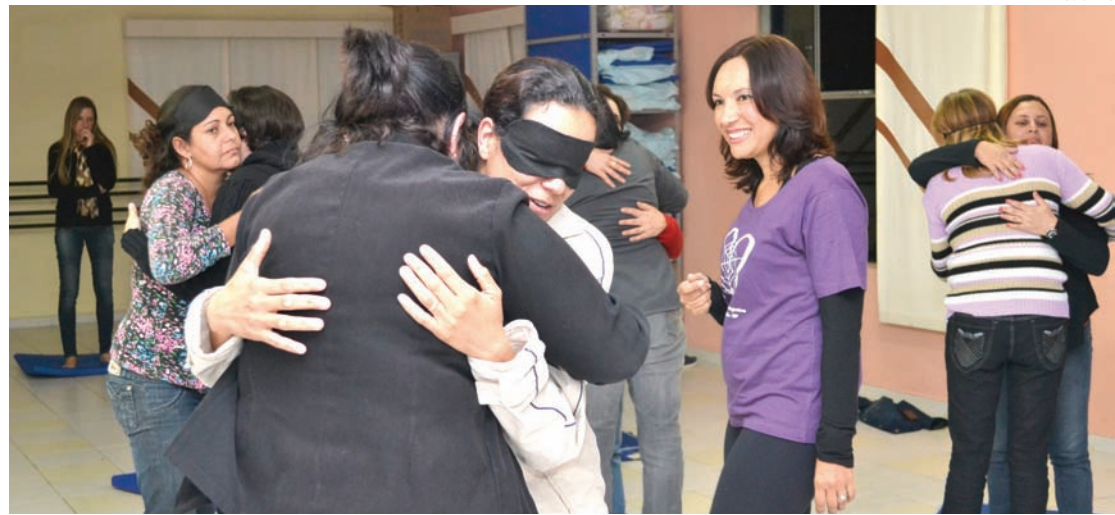
Vivência tem como objetivo ser um espaço para os educadores dividirem emoções

Aproximadamente, 200 educadores participaram de encontros como o de quarta-feira (19), no Espaço Anália Franco, Casa Transitória Fabiano de Cristo, tendo como responsáveis as terapeutas comu-