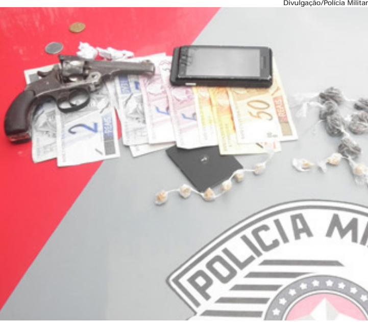
O material acima foi encontrado com a menor