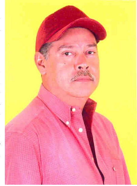
DIRETORIA DE COMUNICAÇÃO/CVP

O vereador pede a construção de casas populares principalmente nos bairros: Cruz Pequena, Ribeirão Grande, Mandu, Bonsucesso, Piracuaema, Pinhão do Borba, Goiabal,