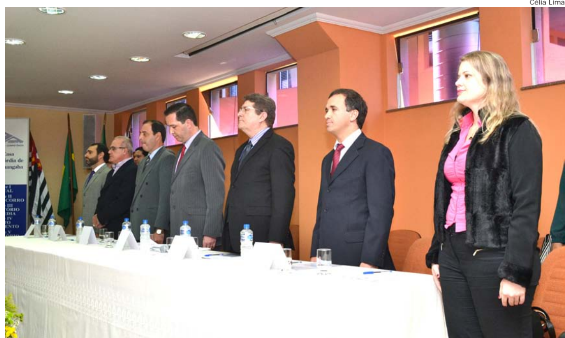
Representantes do Judiciário e autoridades compuseram a mesa dos trabalhos