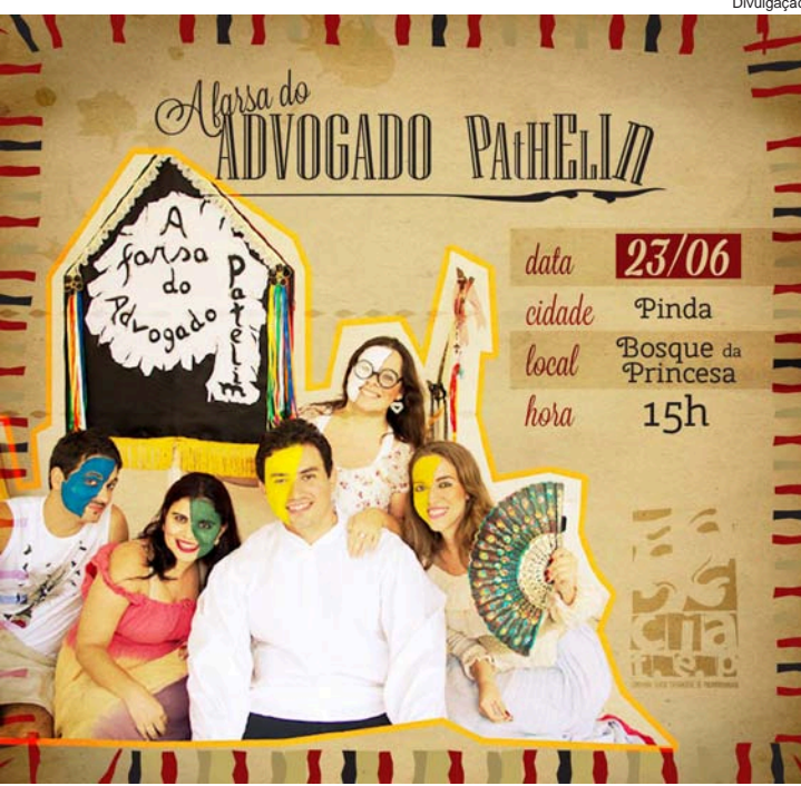
Espectáculo será apresentado no Bosque da Princesa

Toda a comunidade está convidada a conferir as apresentações. Além da opinião do público, os trabalhos serão analisados por uma comissão julgadora.