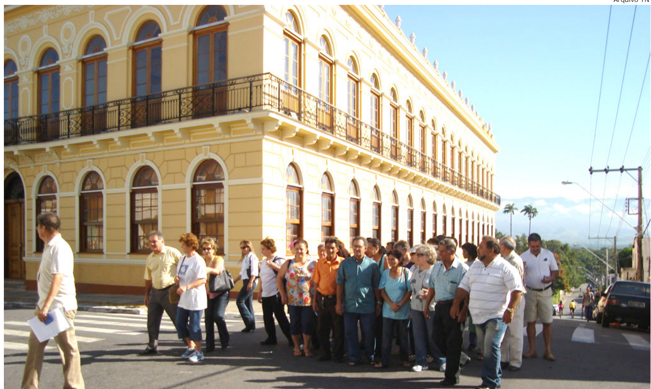
O museu é um dos roteiros do City Tour Histórico Cultural

Na oportunidade, os visitantes recebem os materiais de divulgação da cidade, compostos por uma cartilha do Circuito Mantiqueira e um cartão postal de Pindamonhangaba.