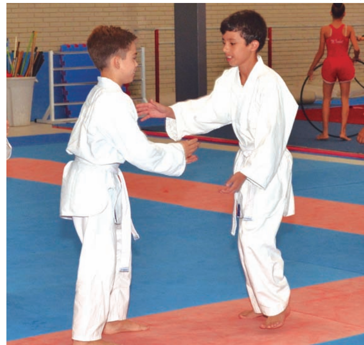
Atletas das categorias de base serão avaliados

A Secretaria destaca que a participação dos pais e familiares durante as avaliações têm feito a diferença e abrihantando o evento.