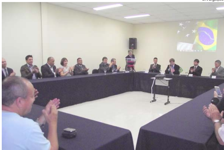
A assinatura do acordo contou com a presença de professores da instituição e de diversas personalidades