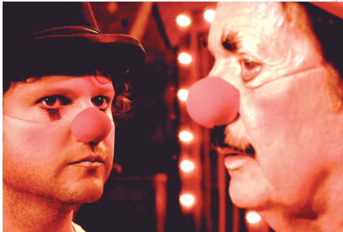
Filme O Palhaço, com Selton Mello, será exibido no Largo do Quartel durante Circuito Sesc de Artes

por meio de uma parceria com a Prefeitura de Pindamonhangaba. Cultura & Lazer 8