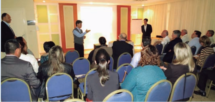
Representantes de prefeituras do Vale reunidos