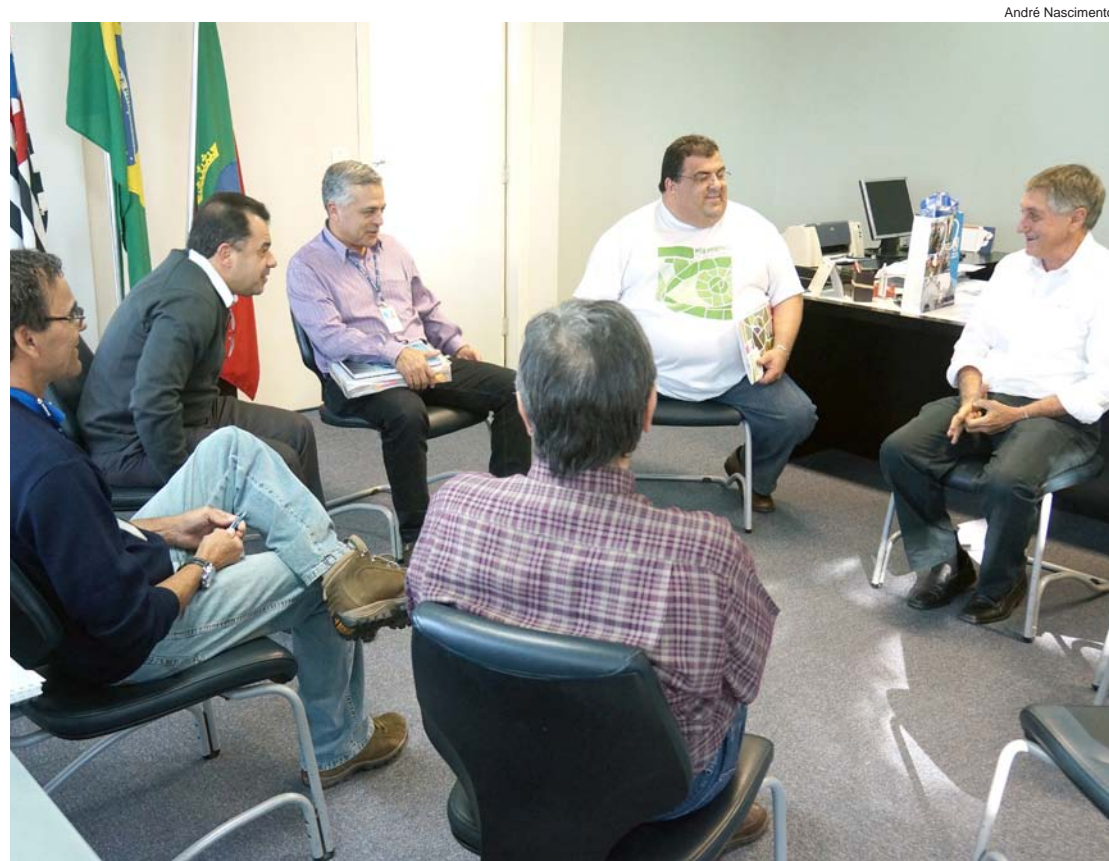
Prefeitura e Sabesp se reuniram para discutir prolongamento de redes de esgoto