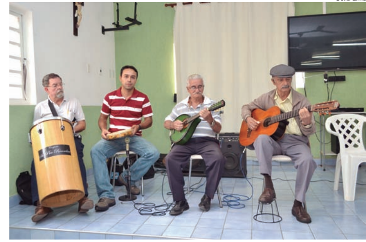
Grupo apresenta chorinho no Lar São Vicente de Paulo