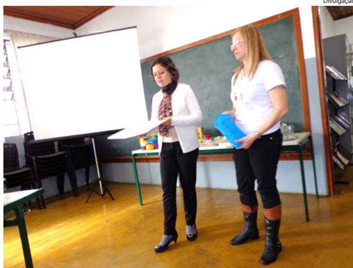
Pedagoga e fonoaudióloga do Nap durante palestra

Na próxima semana, de 24 a 28 de junho, o NAP realizará o momento de brincar e aprender com os pais e crianças do núcleo. Todos podem participar, pois será no horário dos atendimentos pedagógicos. Ao final da palestra houve vários sorteios de kits confeccionados pelos profissionais do NAP.