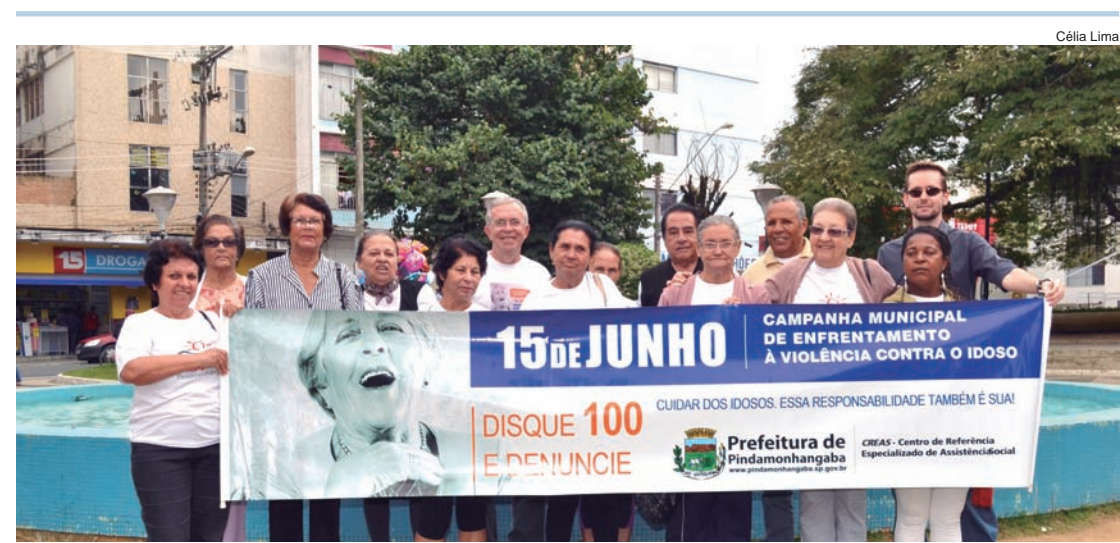
Grupo realizou uma caminhada pelo enfrentamento da violência contra idosos