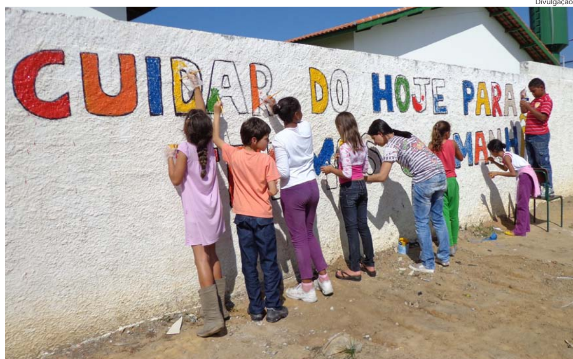
Juntos, escola e comunidade firmaram uma parceria para preservação do local

O caminhão da Subprefeitura retirou todo o lixo e, em seguida, os alunos mobilizaram pais e moradores, pedindo que cuidem do que é da comunidade e