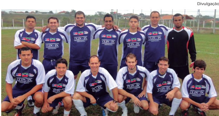
Time campeão da IV Copa Tiradentes

No sábado (15), a APCD, regional de Pindamonhangaba, realizou, conjuntamente com a OAB Seção Pindamonhangaba, a tradicional disputa futebolística Copa Tiradentes, que já está em seu quarto ano. A disputa foi realizada em dois campos de futebol vizinhos: Santa Luzia (gentilmente cedido) e Campo Alegre (Arena Carrapatão). Este ano, as equipes da APCD e OAB que estão contidas no grupo de futebol CFD - Carrapatão Futebol e Desportos, montaram três times para a disputa e receberam um