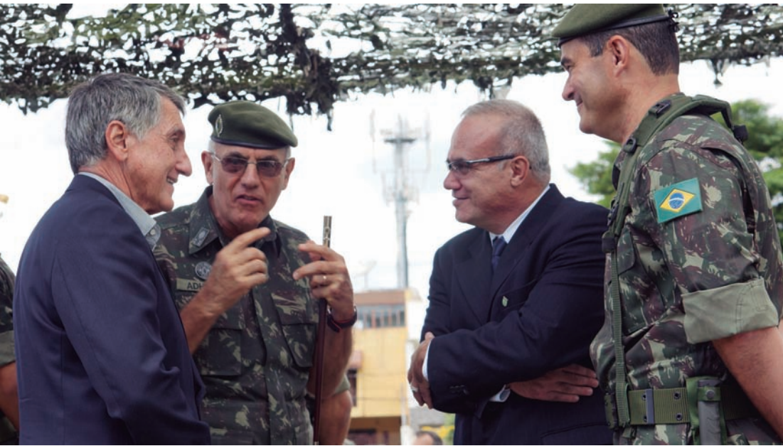
Prefeitura e Exército trabalham em parceria visando beneficiar a comunidade