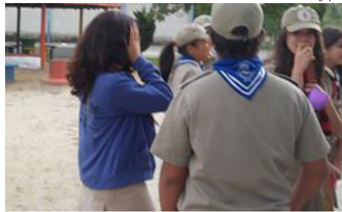
Evento de fundação será realizado no sábado (22)