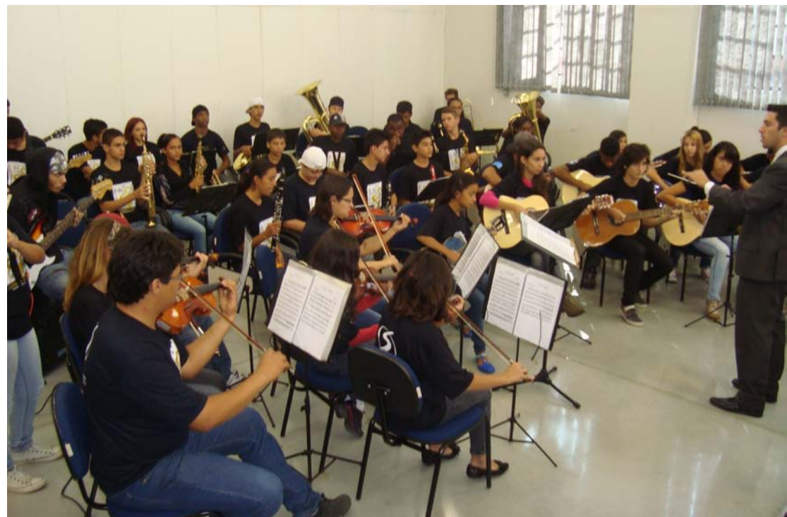
Camerata Orquestra Jovem de Pinda, representante de música instrumental

A categoria música instrumental tem como representante a Camerata Orquestra Jovem de Pindamonhangaba, que se apresenta no domingo (23), às 20 horas, também no centro comunitário do Bosque.