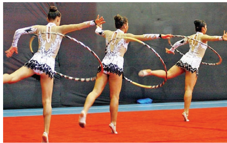
Modalidade encanta público com apresentações

A Secretaria de Esportes de Pinda conta atualmente com um total de 200 atletas na modalidade de ginástica rítmica entre turmas de escolinha e de treinamento.