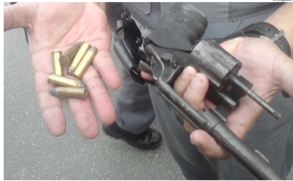
Revólver e munições foram retirados do bueiro pelos policiais

A polícia conseguiu recuperar também a arma que havia sido jogada na boca de lobo, um revólver que estava com munição. O infrator foi encaminhado ao 1º DP.