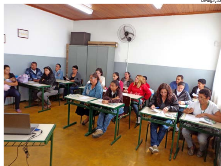
Ação foi voltada para pais e professores