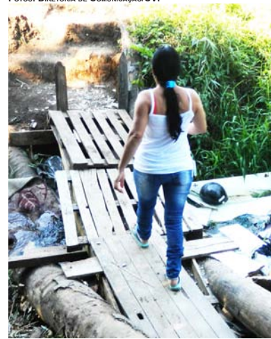
MORADORA DA TRAVESSA DOIS, NO BAIRRO DAS CAMPININHAS, ATRAVESSA PONTE DE MADEIRA EXISTENTE NO LOCAL