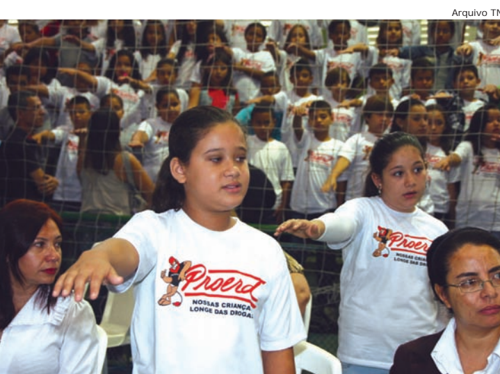
Mais de 500 alunos receberão o certificado de formação