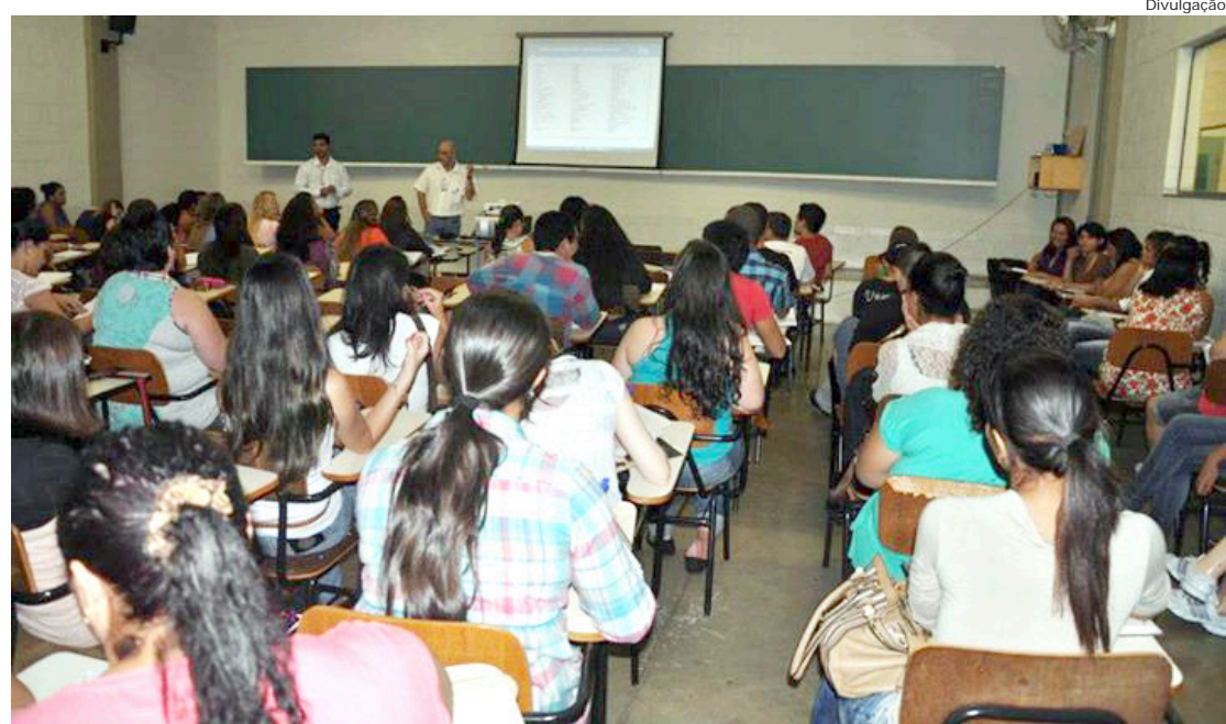
Sala de aula presencial da unidade da Anhanguera em Limeira. Pólo de Pinda agora também terá cursos presenciais

A oferta dos cursos presenciais visa ampliar o acesso ao ensino superior na região, oferecendo qualidade e uma base sólida de conhecimentos, competências e habi-