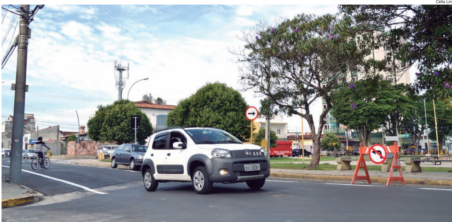
Trecho ao lado do Batalhão Borba Gato agora terá sentido de via somente centro-bairro

Além da alteração no sentido da via, foi feita uma ciclofaixa no lado direito da rua, indo da Deputado Claro César até a Francisco Glicério. A ciclofaixa foi necessária, principalmente,