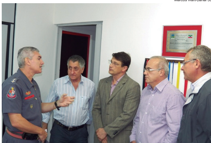
Marcos Ivan/Canal 39

O prefeito municipal ainda informou que a administração já está estudando a viabilidade de construir uma nova sede para abrigar o Corpo de Bombeiros, com capacidade para abrigar novos veículos e aumentar ainda mais o atendimento à população.