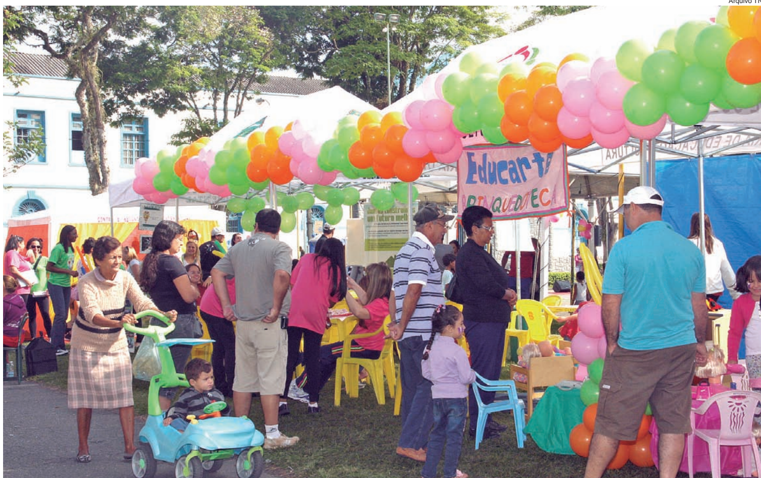
Evento é realizado todos os anos em Pindamonhangaba, com grande sucesso de público

Cantinhos lúdicos, jogos de mesa, brinquedos de encaixe, casa de bonecas, pintura na mão, jogos cooperativos, entre outras atrações estarão à disposição de quem quiser chegar e brincar. Para animar a criançada e seus familiares, além da