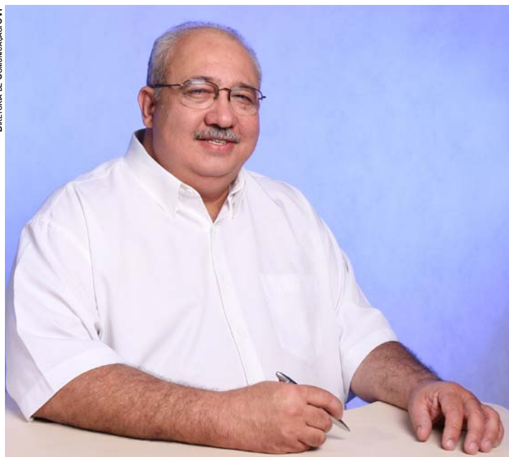
DIRETORIA DE COMUNICAÇÃO/CVP

elas interferem na qualidade de vida da população. A maioria dessas doenças é de fácil prevenção, mas causam muitas mortes, como o caso da diarreia entre crianças menores de 5 anos. Outras doenças relacionadas à falta de saneamento são: amebíase,