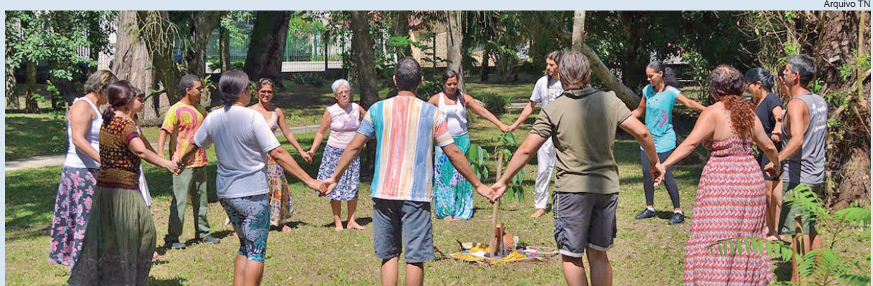
Todas as pessoas podem participar da dança circular gratuitamente

A intenção do projeto é levar essa arte tão inclusiva e simples, para o maior número possível de pessoas. Atualmente, a dança circular é realizada todo último domingo do mês, no Bosque da Princesa.