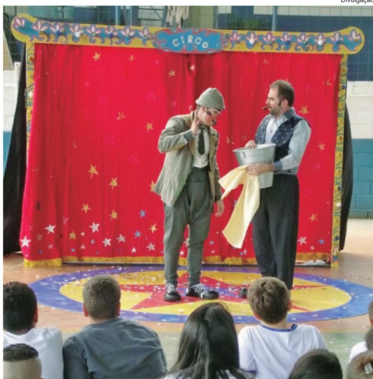
As apresentações de teatro seguem nas escolas municipais até meados de junho

As escolas que já receberam o espetáculo são: EE Eunice Bueno, EE Alzira Franco, EE Yolanda Bueno e EE Demétrio Badaró. No dia 3 de junho, a Etec da EE Rubens Zamith recebe a apresentação. Nos dias 4 e 5 é a vez da Etec João Gomes Araujo.