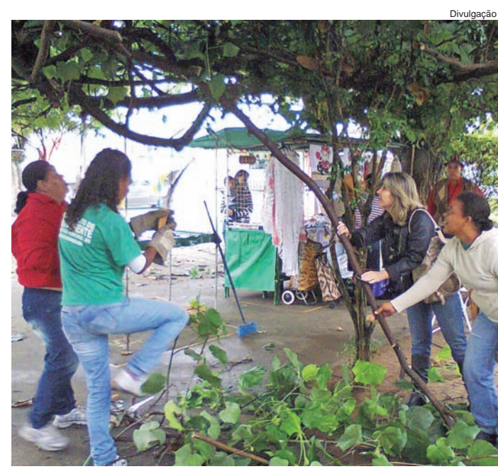
Equipes durante poda das árvores

Mudanças começam a acontecer! A equipe do Departamento de Cultura da Prefeitura esteve, nesta semana, acompanhando a equipe do Departamento de Meio Ambiente na praça Monsenhor Marcondes, fazendo as podas das árvores. Essa ação dá início ao projeto de reformulação da Feira de Artesanato, que acontece no local. A realização é da Prefeitura, por meio da união entre as secretarias de Educação e Cultura, de Governo (Meio Ambiente) e de Planejamento.