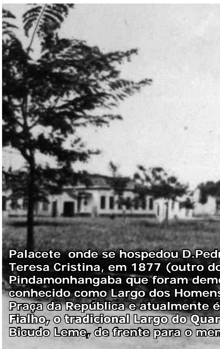
Palacete onde se hospedou D. Pedro II e a imperatriz Teresa Cristina, em 1877 (outro dos sobrados históricos de Pindamonhangaba que foram demolidos). Logradouro que já foi conhecido como Largo dos Homens, Largo da Princesa Imperial, Praça da República e atualmente é a Praça Padre João de Faria Fialho, o tradicional Largo do Quartel. O sobrado ficava na rua Bicudo Leme, de frente para o mencionado logradouro

Sobre este parágrafo tornam-se necessários os seguintes esclarecimentos: o autor não completa o ano em que Isabel e o conde estiveram por aqui pela segunda