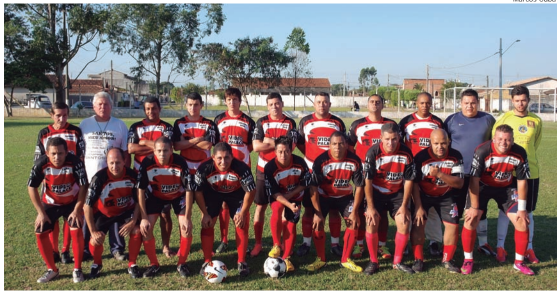
O jogo amistoso entre Rio Verde e Tipês foi definido nos pênaltis

A equipe do Rio Verde, de Tremembé, existente há 50 anos, enfrentou os jogadores da categoria amador do Tipês e conquistou o troféu da partida, nos pênaltis. No tempo normal o jogo ficou em 1 a 1. O primeiro a balançar a rede foram os donos da casa, numa cobrança de falta, mas não demorou muito para o adversário empatar. Nos pênaltis o Tipês mandou a bola na trave e o Rio Verde levantou a taça marcando 3 x 2.