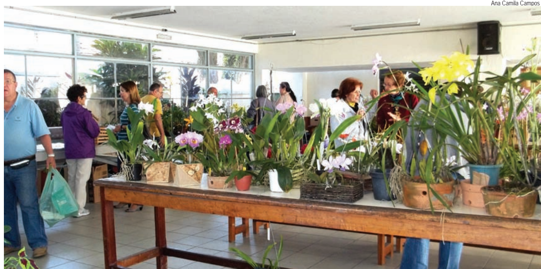
Muitas pessoas prestigiaram a mostra e levaram orquídeas para presentear as mães