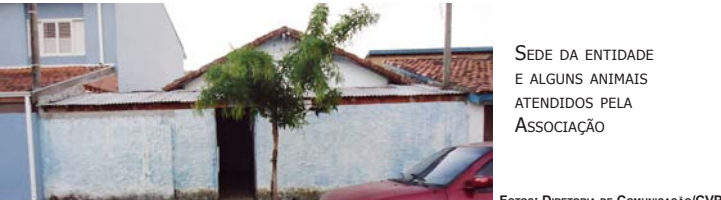
SEDE DA ENTIDADE E ALGUNS ANIMAIS ATENDIDOS PELA ASSOCIAÇÃO