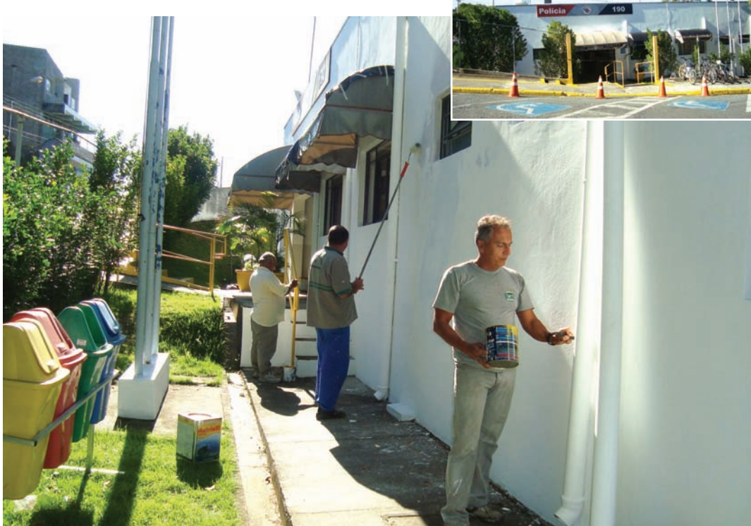
A Prefeitura de Pindamonhangaba, por meio da Secretaria de Obras, está realizando o serviço de pintura da fachada da sede da Polícia Militar, na avenida Manoel César Ribeiro, próximo ao anel viário. A pintura deve ser finalizada nos próximos dias.