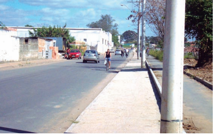
A nova avenida facilitará acesso ao shopping

A Secretaria de Obras está realizando, ainda, um estudo para a viabilidade de implantação de mão única tanto na avenida projetada quanto na rodovia SP-62, que passa na frente do clube Paineiras e segue até a rotatória Mazzaropi. A intenção é que a SP-62 tenha sentido somente para o centro da cidade, enquanto que a avenida projetada teria mão somente sentido para Taubaté.