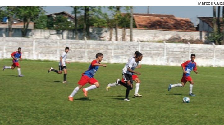
Corinthians promete balançar a rede neste sábado (18)

Durante as manhãs de sábados são realizados os jogos das categorias Sub 13 e Sub 17. No sábado (11), a Ferrovária goleou o Inter Pinda por 7 a 0; o Corinthians emplacou 5 a 0 no Etna; o São Paulo não deixou o Terra dos Ipês abrir vantagem e perdeu para os