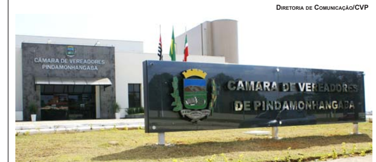
DIRETORIA DE COMUNICAÇÃO/CVP

A Câmara de Vereadores de Pindamonhangaba em busca de aprimorar a comunicação com os munícipes criou o e-mail: ouvidoria@camarapinda.sp.gov.br , no qual a população poderá entrar em contato direto com os servidores da Casa. O intuito do novo canal é criar mais um espaço para estreitar a relação com a população, pois a participação dos munícipes nas ações do Legislativo é fundamental para melhorar, cada vez mais, os serviços em prol da comunidade.