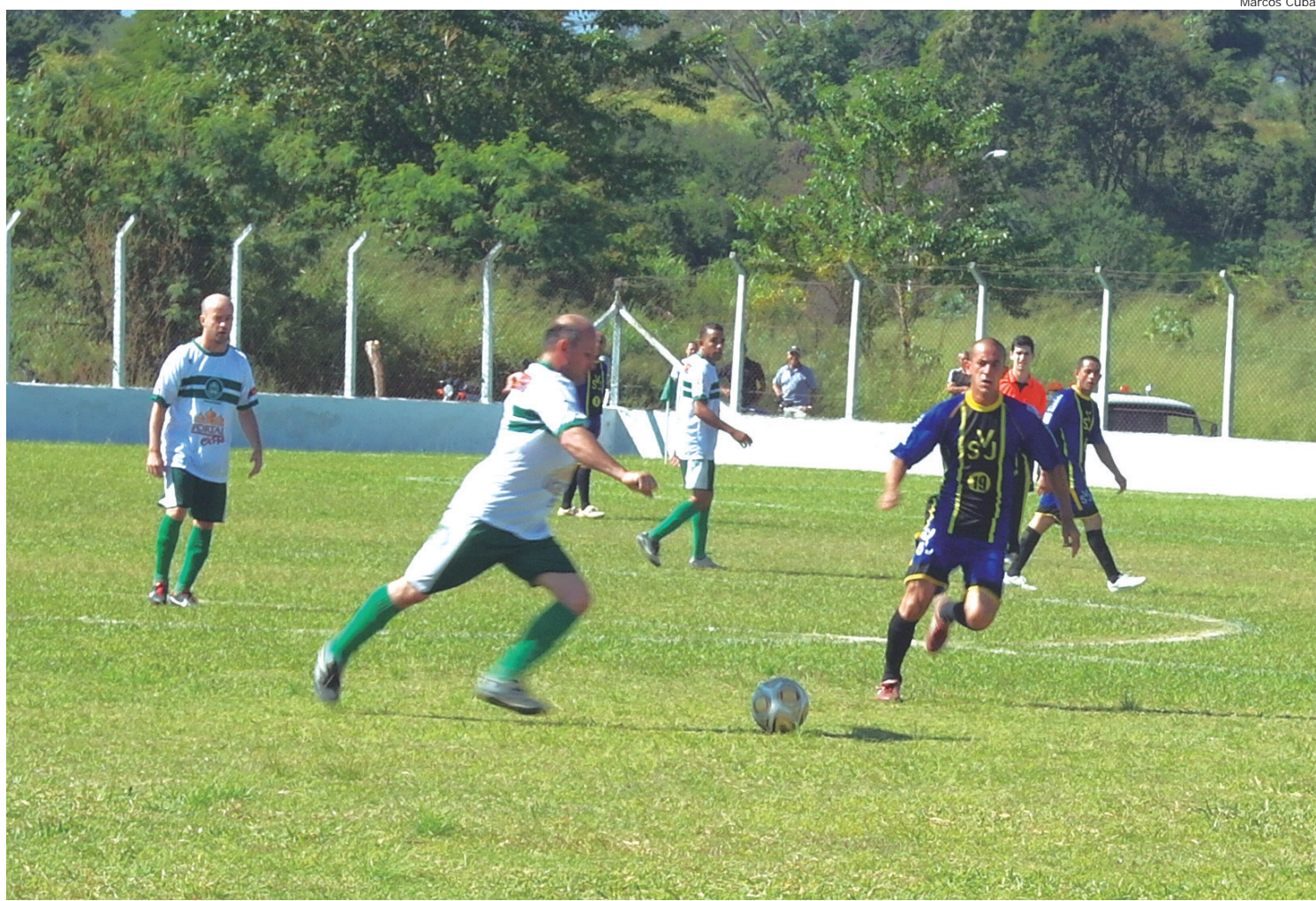
O time da Vila São José reclamou da arbitragem e após o apito final ainda teve um de seus jogadores expulso

A diretoria informa que a categoria Sub 13 será formada por jogadores nascidos nos seguintes anos: 2000 e 2001, e na Sub 20 será os nascidos entre 1993 e 1995. A intenção da Liga é realizar no mínimo três reuniões