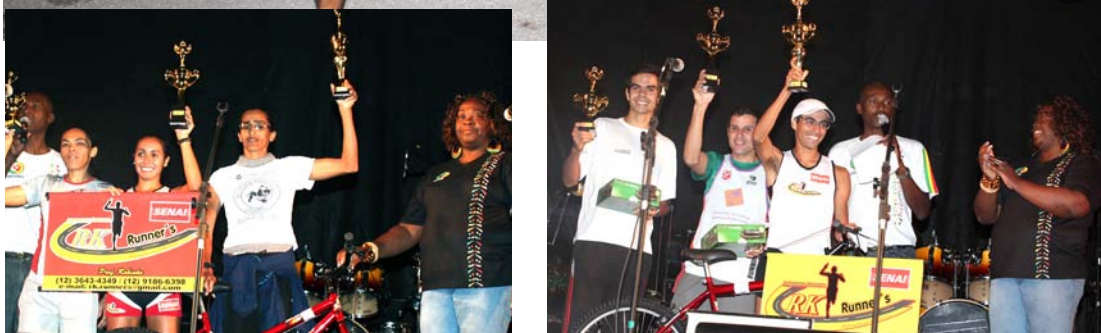
A Corrida da Liberdade reuniu cerca de 130 competidores da cidade e região