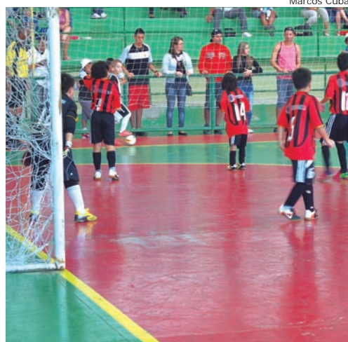
As mães tiveram como presente os gols dos filhos e receberam rosas dos atletas

Na categoria Sub 9, os pindenses venceram por 6 a 1; Sub 11 por 3 a 0; Sub 13 foi 5 x 1; Sub 17 foi 3 x 0. Apenas na Sub 15 o Grêmio União perdeu, pois com menos de dois minutos para o fim da partida os adversários marcaram o quarto gol, placar final foi 4 x 3. Os atletas homenagearam as mães entregando-lhes rosas.