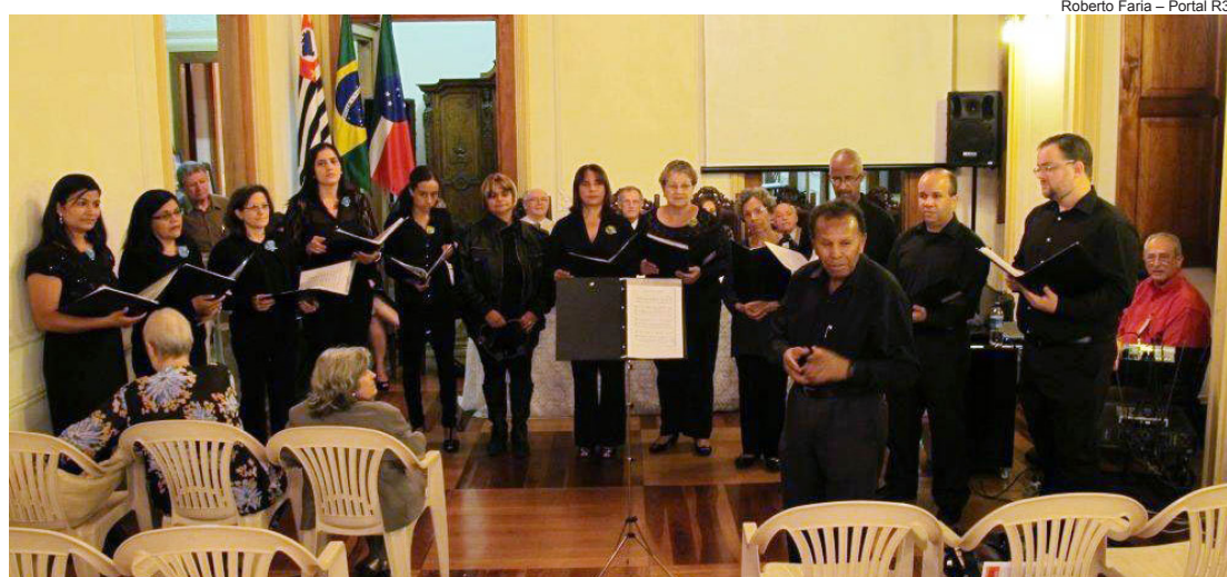
A animação ficou por conta do Madrigal Metodista, de Moreira César