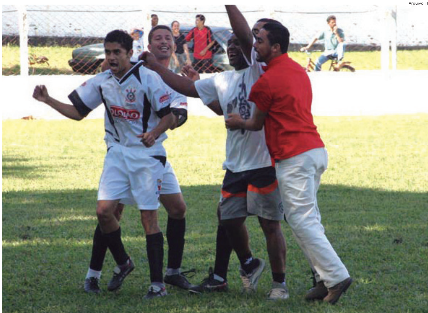
Os associados e jogadores do clube estão convidados a comparecer no aniversário do Corinthians

Na última rodada, o GER Santa Luzia goleou o Tipês por 6 a 0, no grupo A. No B, o chocolate foi da Vila São José em cima do Fim de Carreira, 6 a 1.