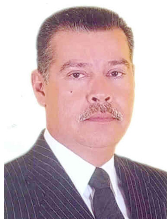
DIRETORIA DE COMUNICAÇÃO/CVP