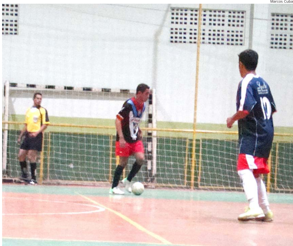
Os jogos da categoria principal do Salonão iniciam sempre às 20 horas

Atlética Ferroviária vai receber mais uma rodada do Sub 11. Os jogos terão início às 19 horas. O primeiro confronto da noite vai ser entre EC Agenor e Alviverde, seguido de OS Grêmio União contra o Projeto Viva, Família Futsal Lorena e Grêmio União. Os times Nova Esperança e Ferroviária encerram a noite de jogos.