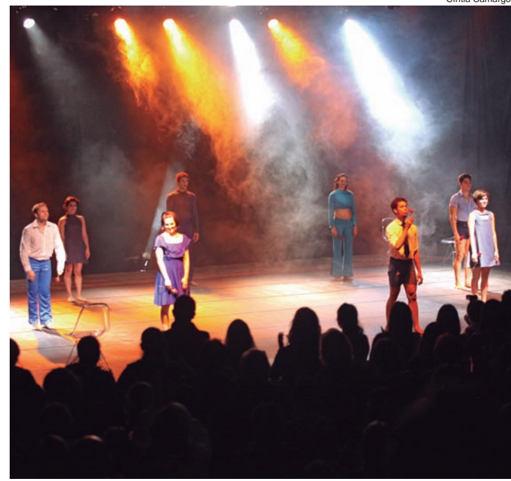
Ao final, a plateia ganhou rosas dos bailarinos