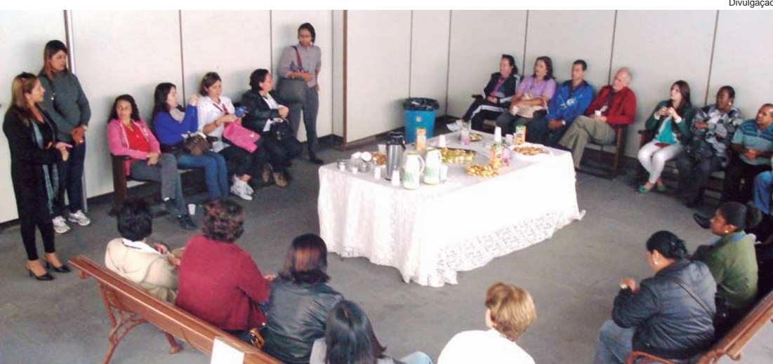
Os alunos foram recepcionados no museu e conheceram também o Circuito Mantiqueira

O grupo seguiu em um passeio pelo Circuito Turístico Mantiqueira, roteiro este que engloba o município de Pindamonhangaba. A visita técnica foi organizada pela Agctur - Associação dos Guias do Circuito Turístico Mantiqueira.