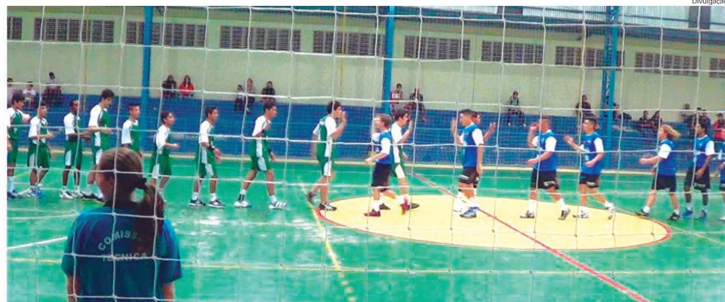
Os atletas de handebol convidam a população para prestigiar a próxima partida e torcer por Pinda