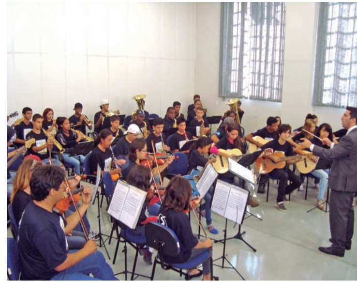
Camerata Jovem, representante na categoria música

As inscrições podem ser feitas no Departamento de Cultura da Prefeitura, onde também pode ser retirado o regulamento completo. O departamento fica na rua Dr. Campos Salles, 530, São Benedito. Telefones 3642-1080 e 3643-2690.