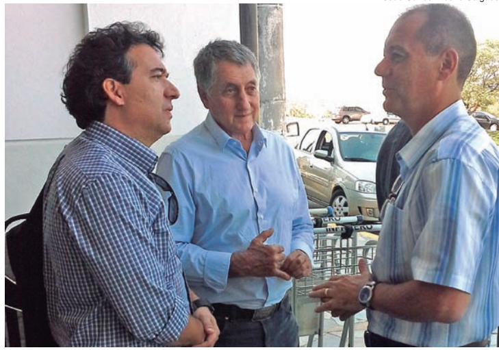
A comitiva de Pinda esteve em Presidente Prudente

da cidade em várias ações, e se colocou à disposição para a construção.