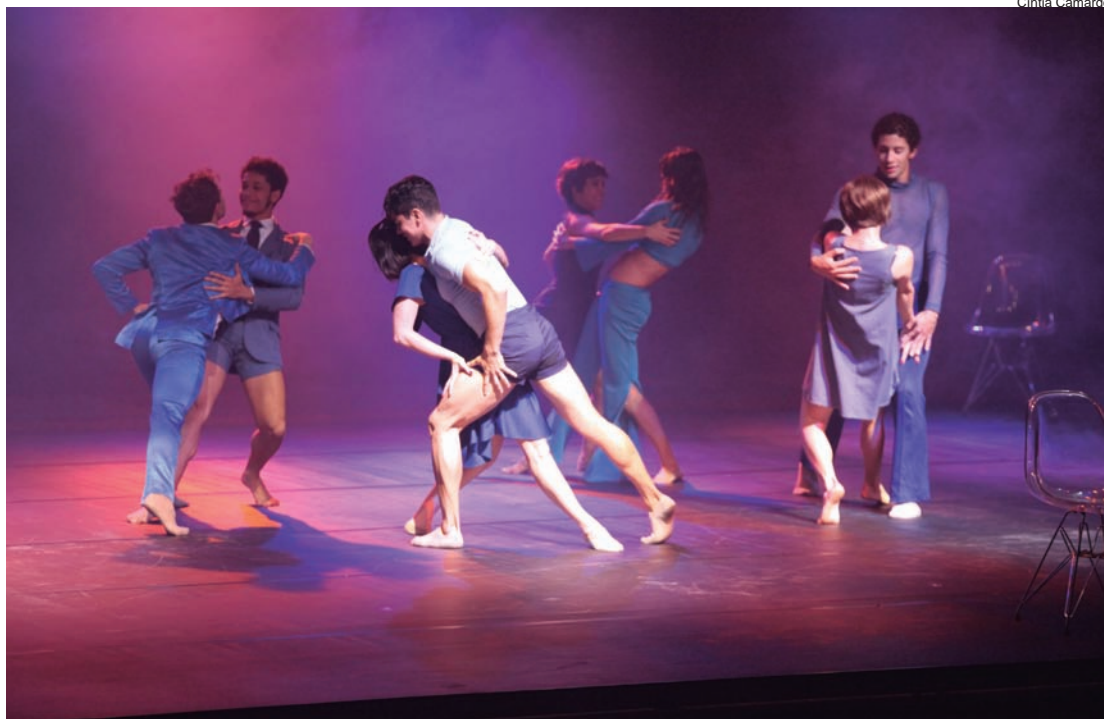
Quatro casais de bailarinos se revezaram no palco dançando músicas de Roberto Carlos

A apresentação da Cia Focus foi um desafio aceito pela Prefeitura de Pindamonhangaba. Primeiro, pela necessidade de adaptação do espaço físico para receber um evento tecnicamente elaborado