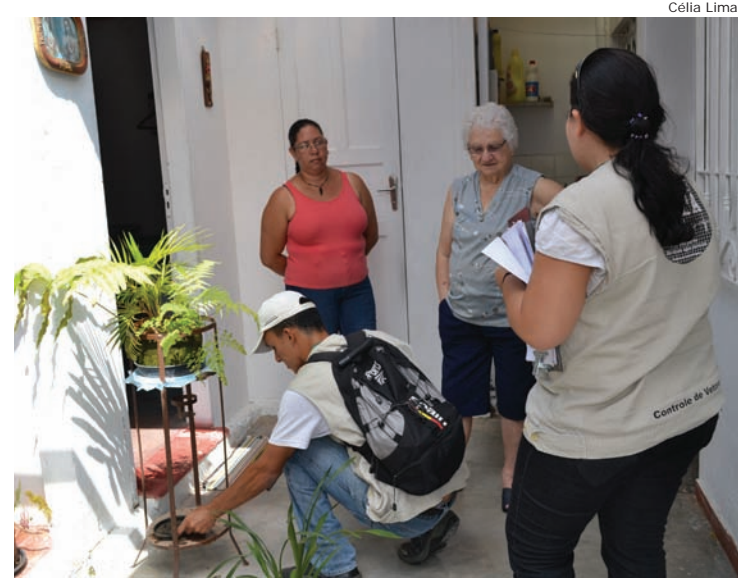
Casa da região central é vistoriada por equipe de Saúde