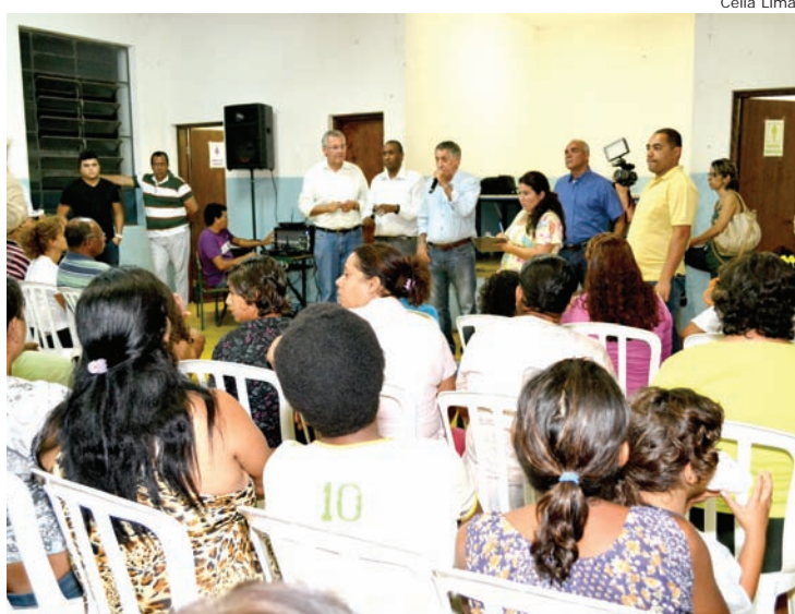
Prefeito comentou sobre a realização das obras

Além das obras definidas por meio da votação dos munícipes presentes, a administração municipal ainda fará a instalação de um semáforo