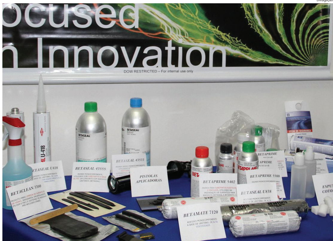
Parte dos produtos desenvolvidos pela Dow em Pindamonhangaba

Os selecionados começam a trabalhar em julho de 2013 e os interessados podem se inscrever até o dia 30 de abril pelo site www.dowbrasil.com/carreiras .