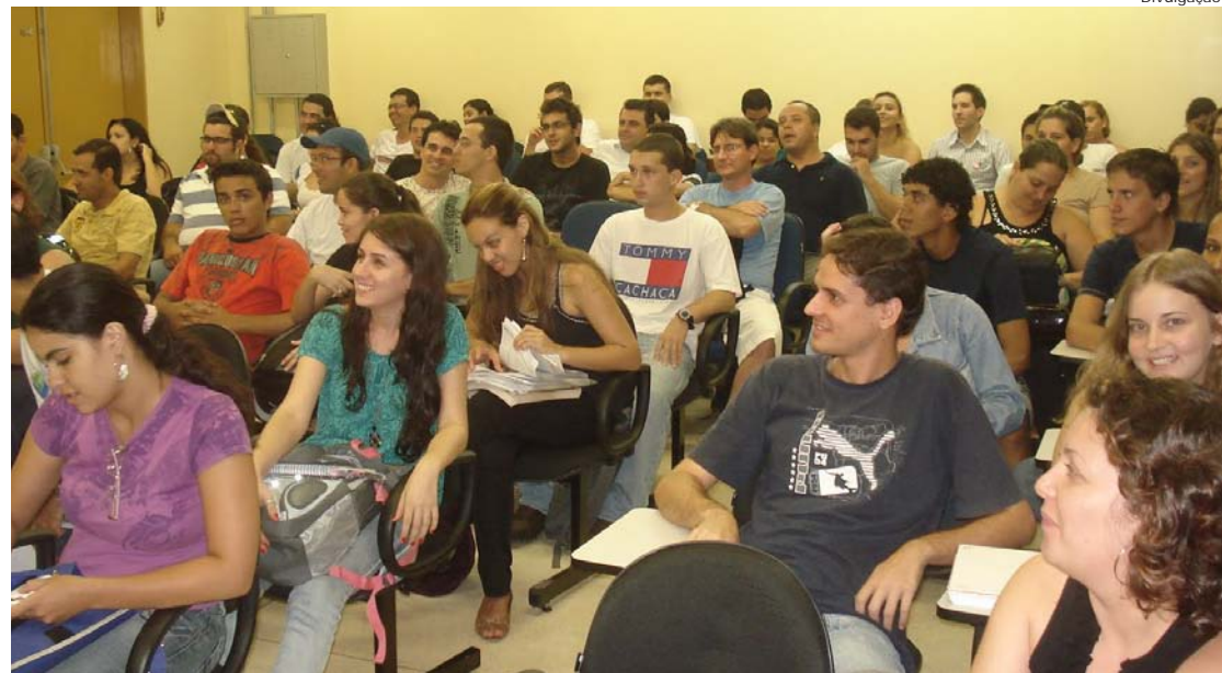
Os cursos de tecnologia da Fatec têm duração de três anos

O período de inscrição para o processo seletivo da Fatec vai de 30 de abril a 11 de junho. A inscrição será, exclusivamente, pela internet. O Manual do Candidato também estará disponível no site. O valor da taxa de inscrição para o vestibular é R$ 70.