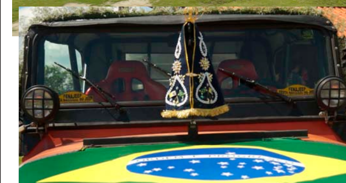
Acima parte dos jipes que fazem parte da Romaria Nacional. Ao lado, Jeep com imagem de Nossa Senhora Aparecida, que é o primeiro dos 150 veículos que participam do ato de fé e aventura