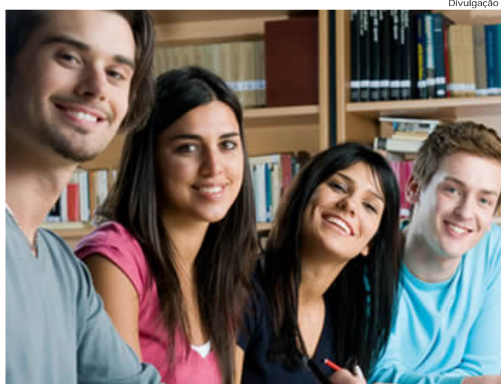
Candidatos selecionados iniciarão as atividades em maio

Os candidatos selecionados iniciarão as atividades em maio. O estudante receberá bolsa integral de seu curso,