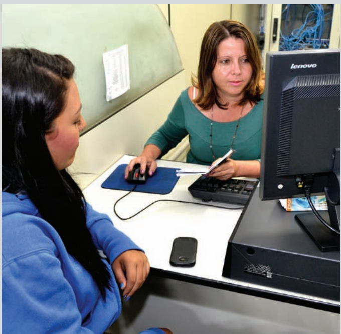
Órgão oficial é local de cadastro para emprego