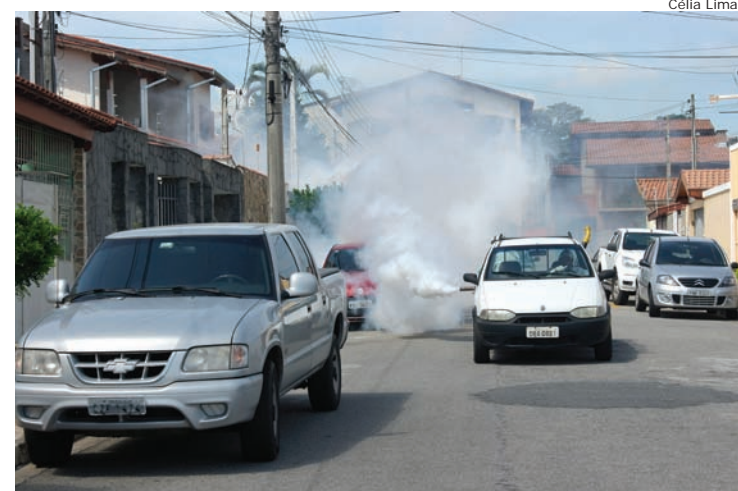
Equipamentos no carro lançam inseticida nas ruas

A Vigilância Epidemiológica informou que o último mutirão, realizado no sábado (6), constou de visitas a 453 residências do Ipê I, Ipê II e Vale das Acácias.