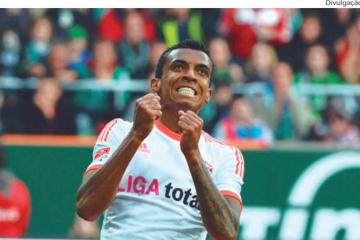
O atleta foi revelado nos campos de futebol de Pinda

O jogador brasileiro, pindense, Luiz Gustavo, sagrou-se campeão pelo Bayern de Munique na Bundesliga, Campeonato Alemão, no último sábado (6). A equipe de Munique conquistou o título por ter 20 pontos de vantagem sobre o segundo colocado, o Borussia Dortmund. O gol da vitória foi marcado pelo meia Schweinsteiger, com o placar final 1 x 0.