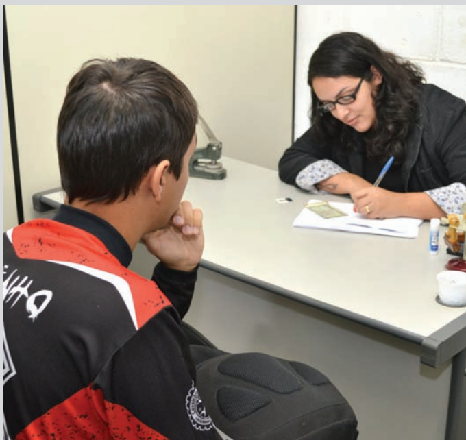
PAT atende pessoas que buscam emprego e estágio