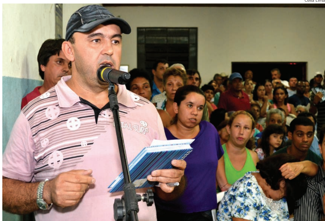
Moradores apresentaram à Prefeitura as reivindicações em vários setores

A reunião teve a presença de 300 pessoas, que fizeram outras reivindicações, todas encaminhadas aos diversos setores da Prefeitura.