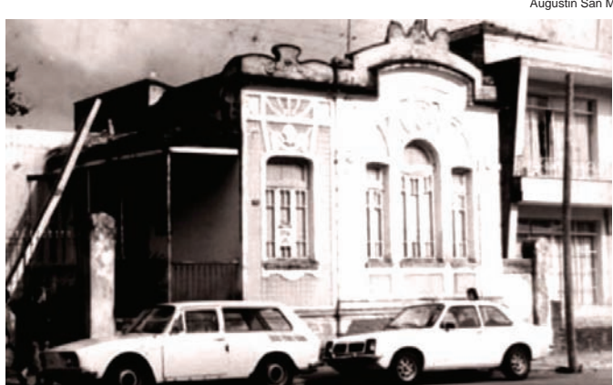
Ontem... Residência do jovem Geraldo Alckmin quando ganhou a Prefeitura em 1972