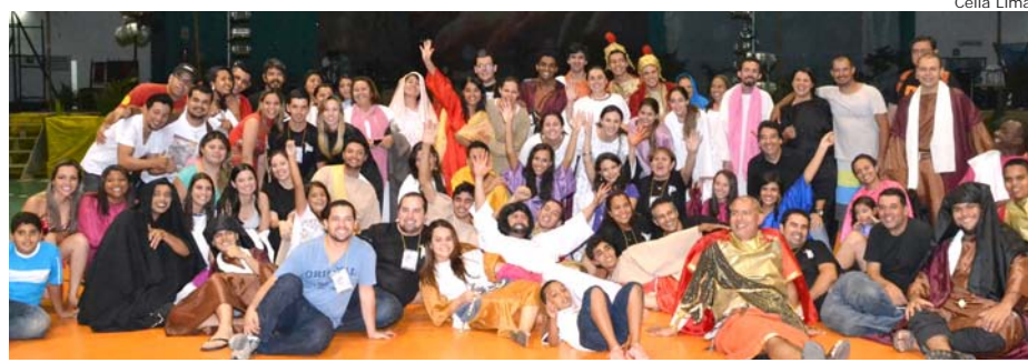
Participantes da encenação após o evento