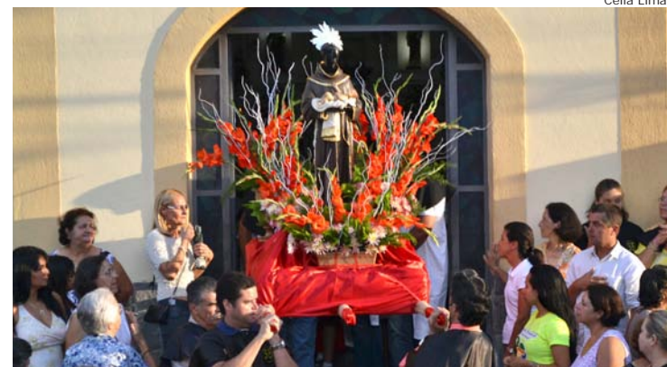
Saída da procissão de São Benedito

Além das cerimônias em louvor a São Benedito, a festa contou com atrações musicais, barracas de comida e artesanato etc.