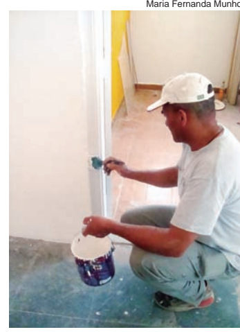
Pintura da parte interna

De acordo com informações da Secretaria de Obras da Prefeitura, um próximo passo da obra será a execução de projeto de fachada.