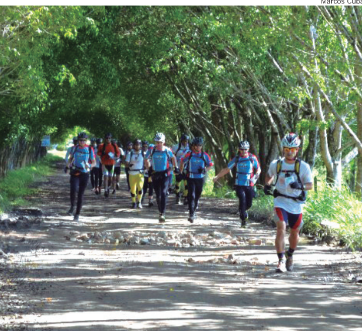
Pinda sediou primeira etapa do circuito de aventura