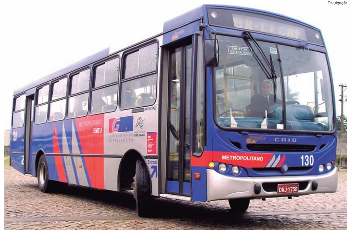
Modelo de ônibus utilizado para transporte intermunicipal em regiões metropolitanas