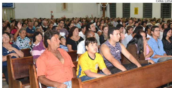
Fieis presentes na Igreja São Vicente de Paulo