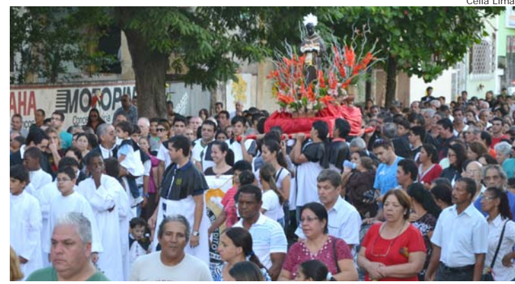
Imagem de São Benedito sendo conduzida por fieis