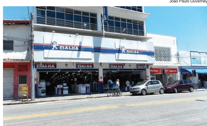
Hoje... A antiga casa de Alckmin e outras vizinhas, deram lugar a um moderno prédio com várias lojas