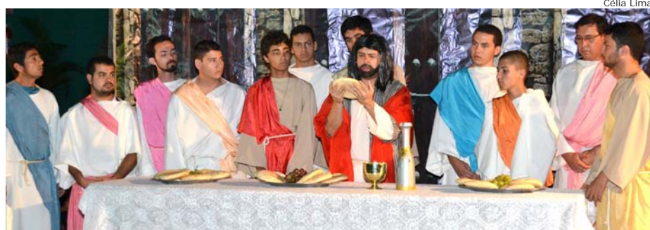
Jesus e os apóstolos durante a última ceia

A apresentação foi feita pela Comunidade Aliança Jesus Agora (CAJA), com a participação de mais de oitenta jovens.