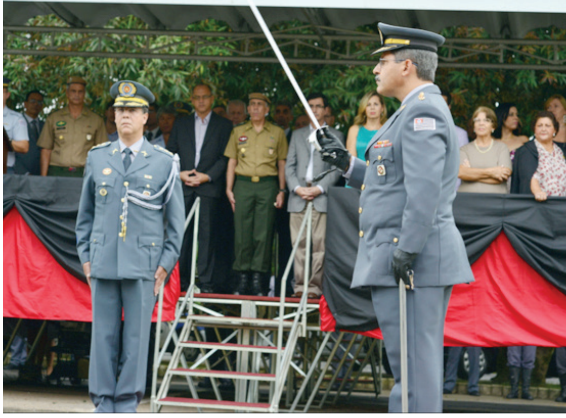
Novo comandante durante cerimônia de posse

rança Pública, trabalhando de forma coesa com as polícias Civil e Científica, e procurando intensificar algumas atuações na região, principalmente nos momentos, horários e locais de maior incidência de crimes e na época de operações especiais...”