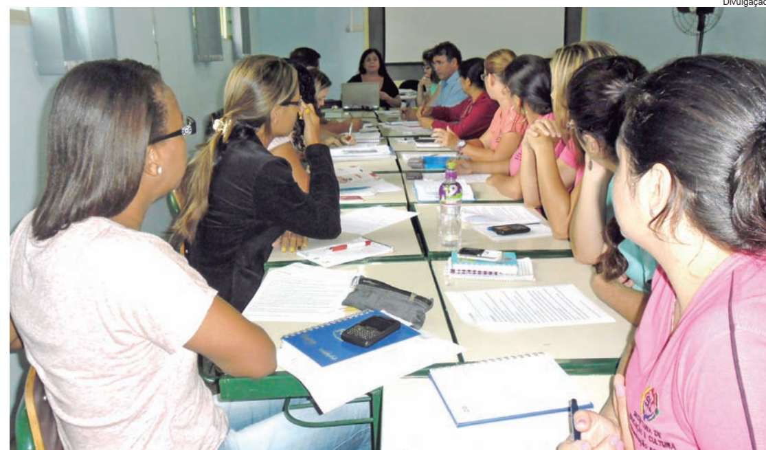
Grupos de diversas áreas da Educação vão apresentar propostas de trabalho

Nas reuniões, os funcionários participam, dando sugestões produtivas de quem vivencia o cotidiano de trabalho. A intenção é que essa seja uma oportunidade democrática de colaboração. O objetivo da Secretaria de Educação é dar prosseguimento à rodada de reuniões, realizando-a uma vez por mês.