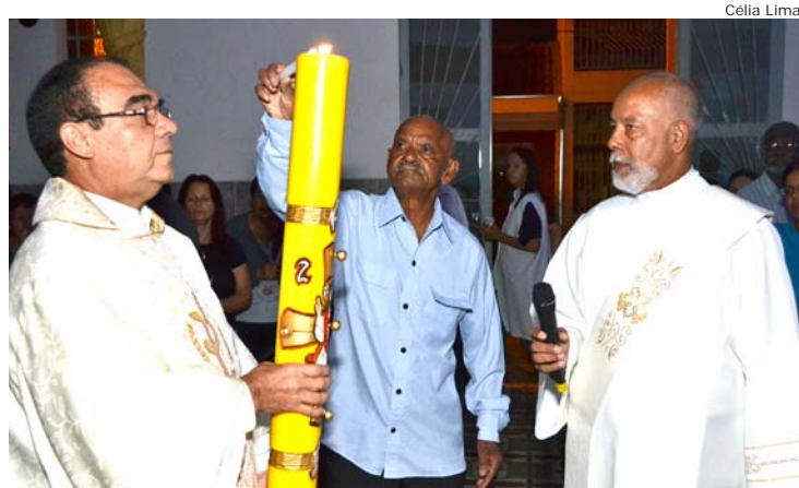
Bênção do Fogo Novo em Moreira César

No domingo, além das missas rotineiras, ocorreu uma celebração especial no Sítio Quatro Milhas e, em seguida, saiu a tradicional Cavalgada de São Benedito, dando início às festividades em louvor ao santo.