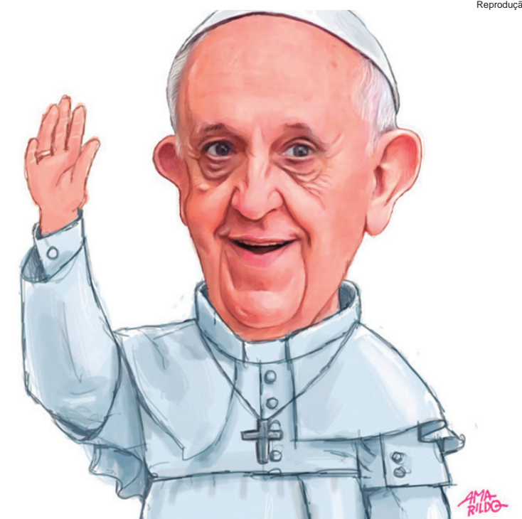
Exemplo de caricatura, uma das modalidades do Mapa