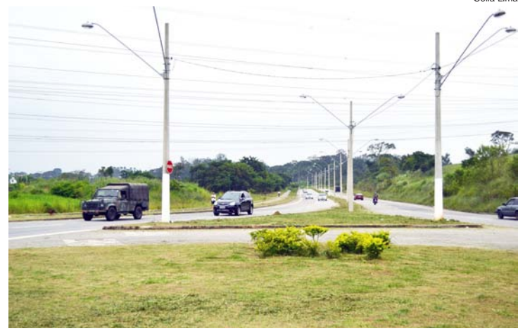
O local recebeu serviços de limpeza e capina