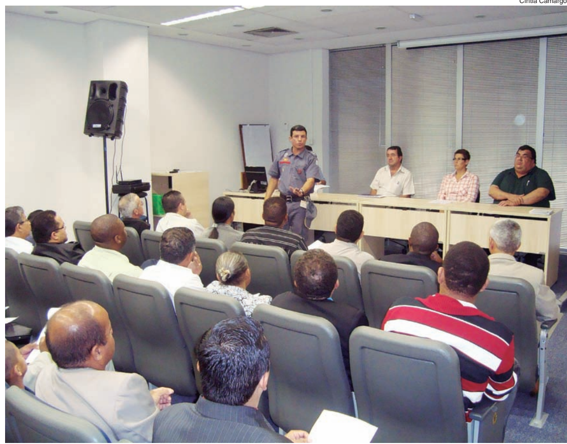
Reuniões visam regularizar templos religiosos para obtenção do alvará

sobre a regularização da documentação das igrejas podem ser obtidas na secretaria de Planejamento, no prédio da Prefeitura, na avenida Nossa Senhora do Bom Sucesso, 1400.