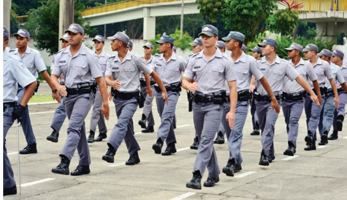
Soldados desfilam durante a solenidade

de inteligência para detecção, para localização e para trabalhos em cima de crimes que já foram cometidos. Nosso objetivo sempre é o de prevenir, mas quando eles (os crimes) acontecem, nós precisamos contar com o apoio da população. Não há polícia no mundo que trabalhe sozinha!”, concluiu.