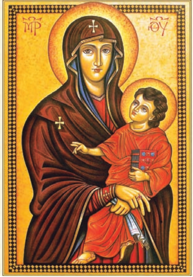
Ícone de Nossa Senhora