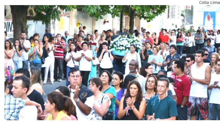
Católicos levando imagem de Nossa Senhora