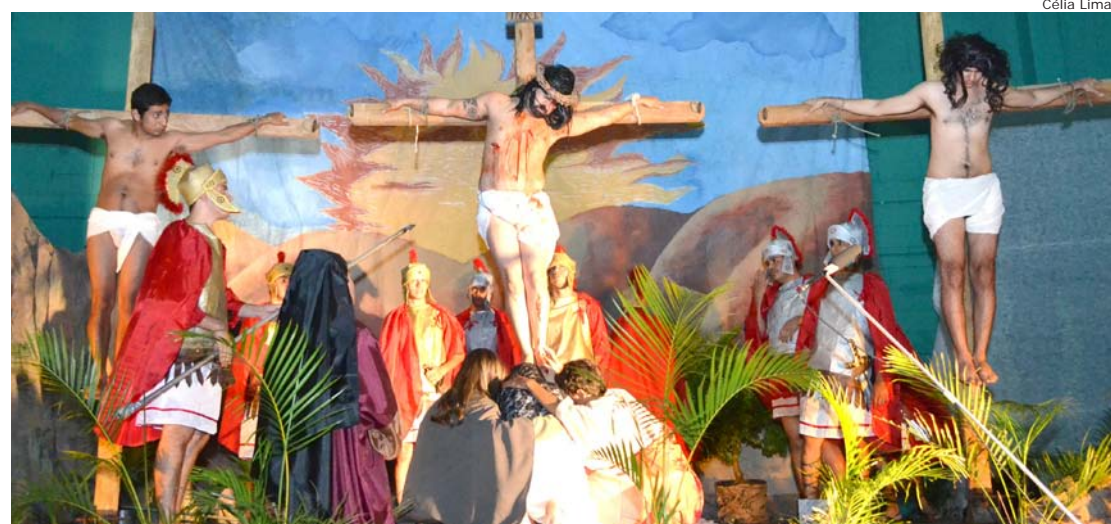
A cena mais emocionante foi a da Crucificação