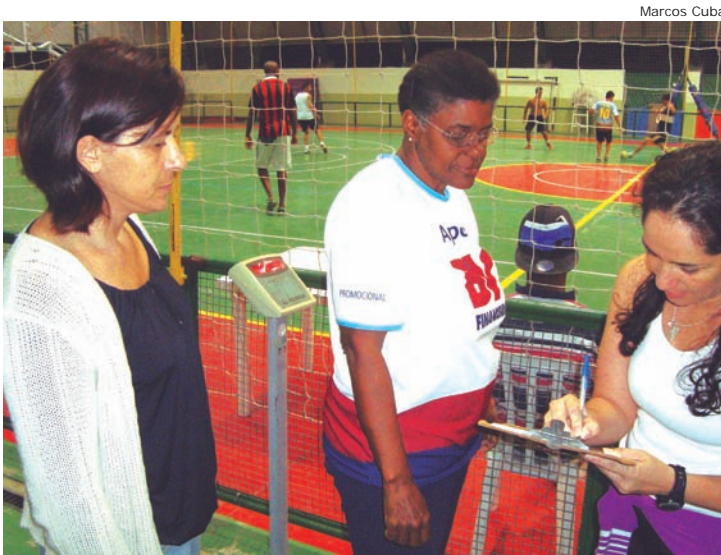
Professores orientam sobre prática de atividade física