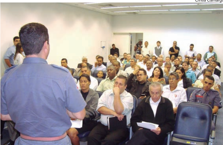
Dezenas de pastores ouviram orientações dos bombeiros

das igrejas evangélicas de Pindamonhangaba quanto à segurança em seus prédios,