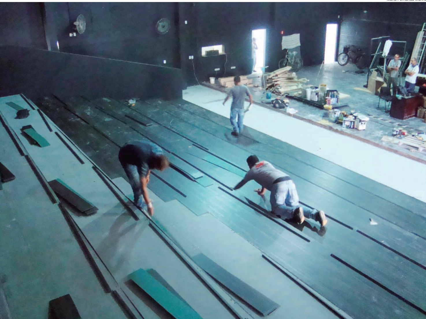
Colocação de piso na área da antiga arquibancada; novas poltronas serão instaladas nesta semana