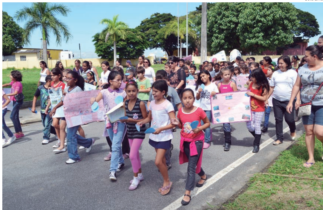
Crianças do Cidade Nova participam de passeata pelas ruas do bairro