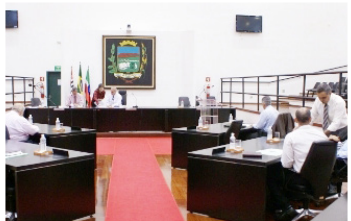
VEREADORES APROVARAM AUMENTO PARA TODO O FUNCIONALISMO PÚBLICO MUNICIPAL

Os Vereadores da Câmara de Pindamonhangaba aprovaram na Sessão Ordinária do último dia 18, o Projeto de Lei do Executivo, que majora os salários dos funcionários públicos municipais em 7%, retroativo ao dia 1º.