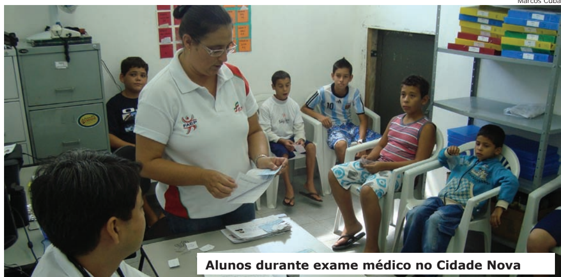
Alunos durante exame médico no Cidade Nova