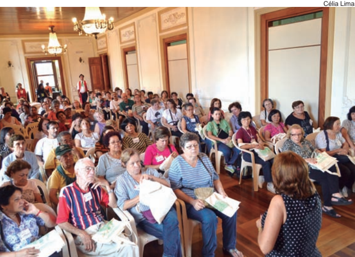
Grupo de São Paulo foi recebido no Museu Histórico

A Praça de Eventos fica na avenida Nicanor Ramos Nogueira, sem número, no Araretama.