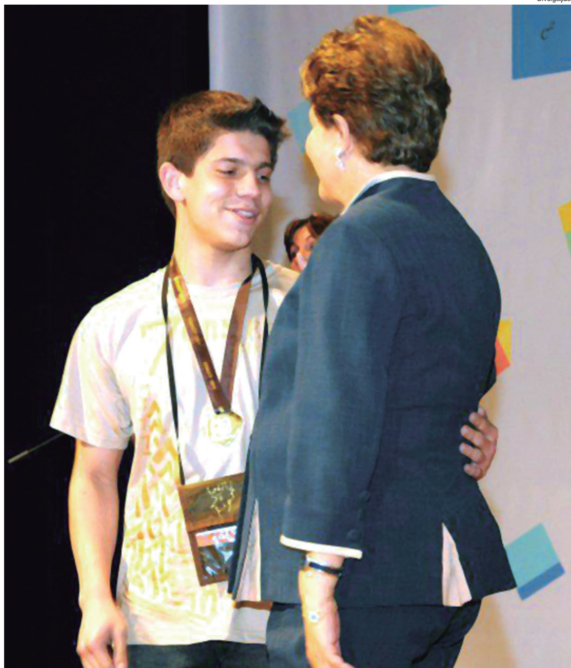
O estudante de Pindamonhangaba é premiado pela presidente Dilma Roussef

Concluindo, o jovem afirma: "Geometria, aritmética e combinatória caem nas provas, mas o principal é usar a lógica para responder as questões, não basta necessariamente estudar a matéria em si, mas olhando o problema já sei onde ir para chegar ao resultado. Havia questões que nunca havia estudado, mas eu já sabia resolver espontaneamente".