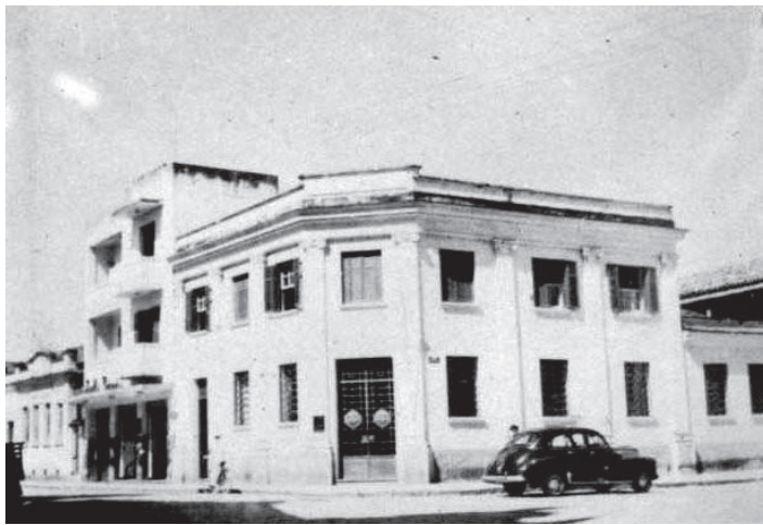
Ontem... neste local funcionou o Banco Mercantil de São Paulo