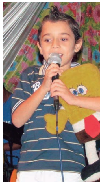
Um dos vencedores mirins do Festival de Marchinhas

O Festival de Marchinhas é organizado pelo Departamento de Cultura, da Prefeitura de Pindamonhangaba. A entrada é gratuita.