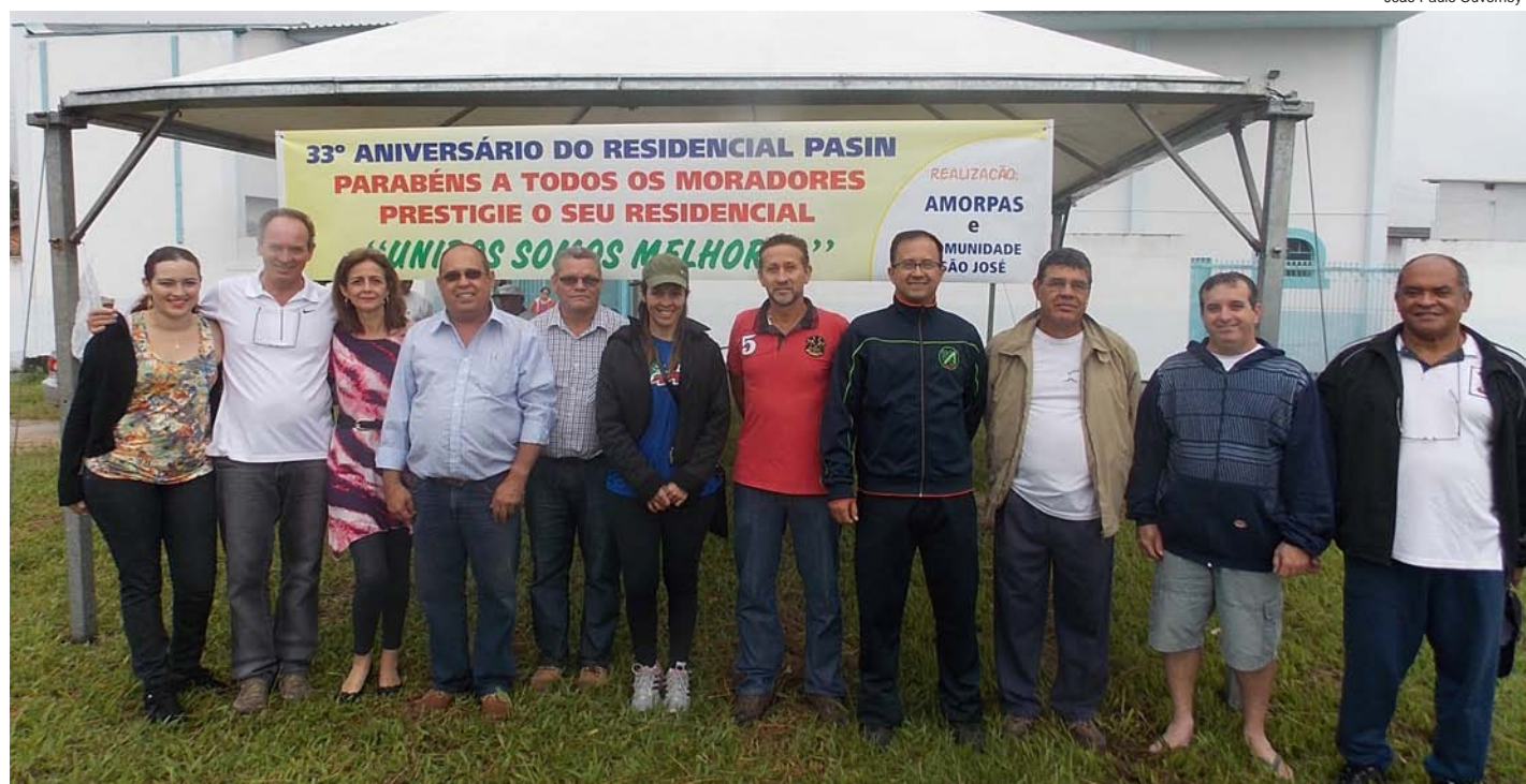
Diretoria da Associação com autoridades e convidados

Passeio ciclístico foi adiado devido à chuva no período da manhã