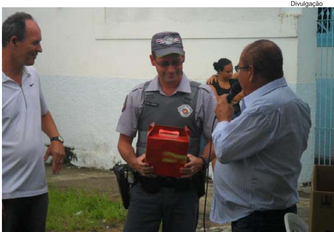
Polícia Militar recebeu homenagem