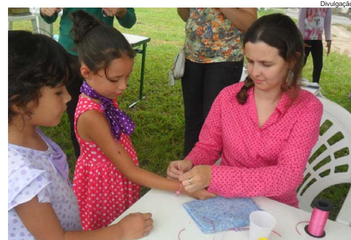
Crianças participando da atividade de recreação