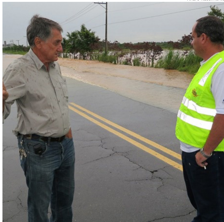
Prefeito Vito Ardito em vistoria na estrada SP- 62, após enchente que encobriu a via

ficar atentos às enchentes. A Defesa Civil está sempre em alerta e segue fazendo o trabalho de orientação aos munícipes”, afirmou o prefeito.