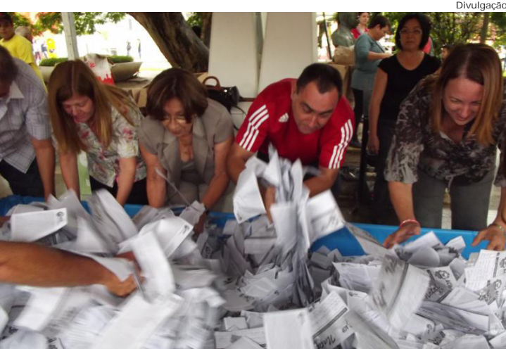
Momento do sorteio na praça Monsenhor Marcondes

Associação Comercial realiza sorteio de seis caminhões de prêmios referentes à Campanha de Natal