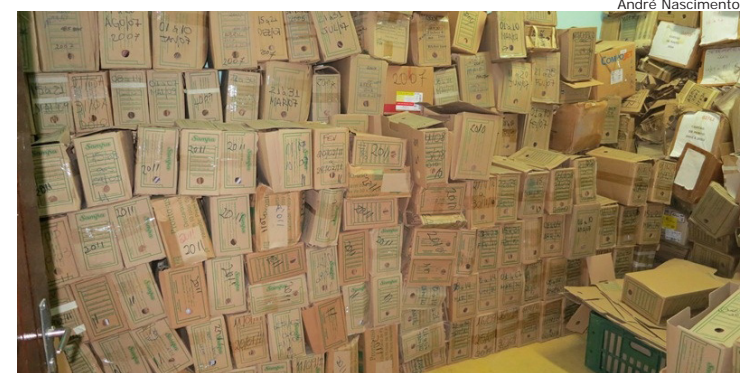
Sala de arquivos de prontuários médicos do P.A.