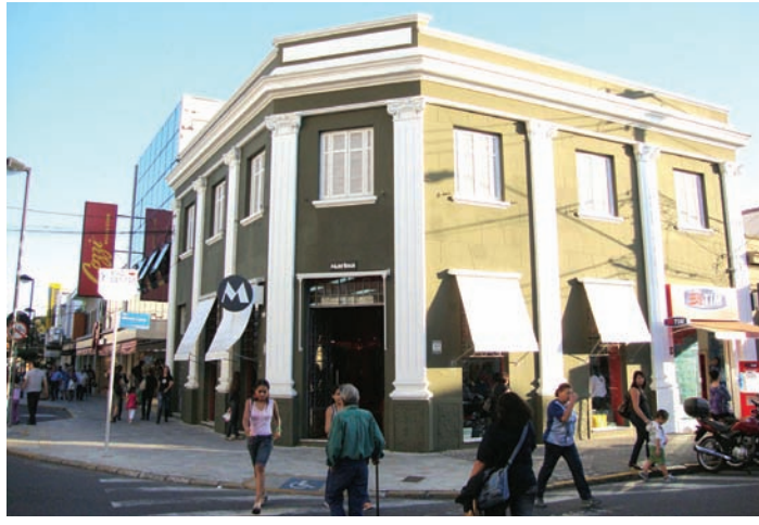
Hoje... atualmente é a Loja Marina Calçados