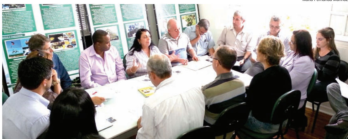
Reunião na segunda-feira (14) definiu a programação final do Carnaval 2013