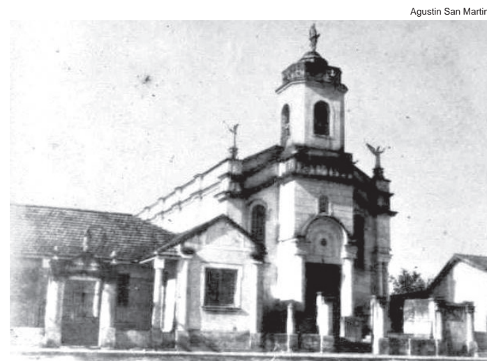
Ontem... Antiga igreja de São Benedito