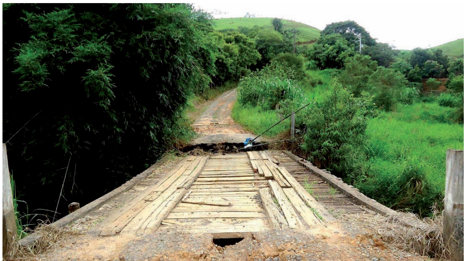
Ponte de madeira será substituída por construção de concreto. Estrada é utilizada por dezenas de famílias

para conseguir a licença e executar a obra o mais rápido possível. A nova ponte será de concreto e oferecerá mais segurança a dezenas de famílias que passam pelo local diariamente. Pindamonhangaba é uma das cidades da região com maior número de estradas rurais, compreendendo mais de 700 km de vias.