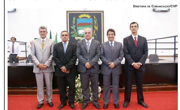
DIRETORIA DE COMUNICAÇÃO/CVP

ALÉM DA NOVA MESA DIRETORA PARA O BIÊNIO 2013-2014, PARLAMENTARES TAMBÉM ELEGERAM OS INTEGRANTES DAS 7 COMISSÕES PERMANENTES