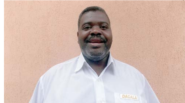
Pelé presidente do Bloco Esquenta