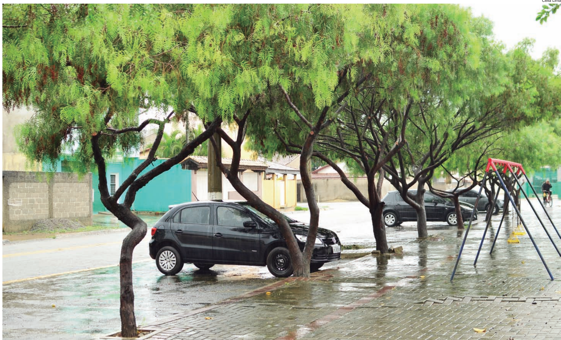
Com podas nas árvores, praça do Cisas teve ganho na luminosidade, o que gera mais segurança às pessoas