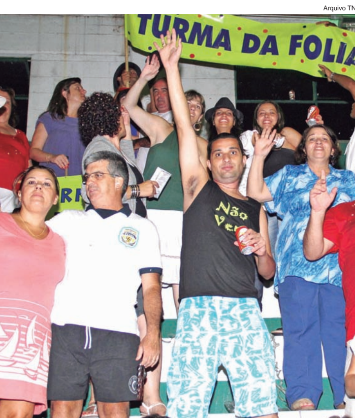
Foliões "curtem" Festival de Marchinhas

As obras selecionadas para este evento são de compositores de Pindamonhangaba, Taubaté e Ubatuba. Quem passar pela praça poderá conferir canções como "Rainha Nhá Nhá", "Jogo de Azar", "Marcha da Escada", "Marcha do Zé Sambinha", "Cabeça Virada", entre outras, e brincar de carnaval até o "Fim do Mundo".