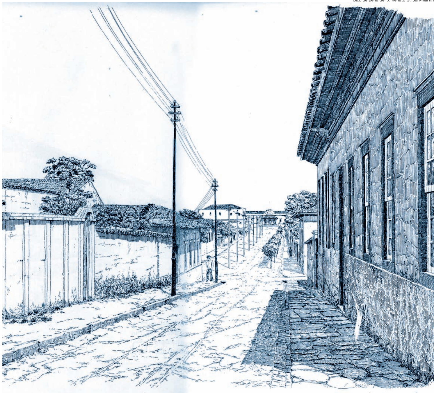
"...a avenida Fernando Prestes chegava então só até a rua dos Andradas. Ai estreitava numa casa baixa de beiral, com rótulas nas quatro janelas; era uma das casas mais típicas da cidade..."

1 Encilhamento foi a forma como ficou conhecida a crise financeira ocorrida no Brasil a partir de 1890 decorrente da política econômica do governo provisório do Marechal Deodoro da Fonseca. Essa política, conduzida pelo Ministro da Fazenda Rui Barbosa, tinha por objetivo o incentivo à industrialização e se baseou na liberação de créditos bancários garantida pelas emissões de moeda destinadas ao financiamento de projetos industriais. O fracasso do projeto governamental deveu-se ao boicote promovido por especuladores ligados aos latifundiários, importadores e investidores estrangeiros que, por meio de empresas-fantasma inundaram o mercado financeiro com ações sem lastro de capital. As consequências como inflação dos preços, falências e a desconfiança nas instituições financeiras se arrastaram por anos configurando a crise do Encilhamento. (guiadoestudante.abril.com.br - professor Marcus Batista). Explicando o porquê da denominação "...o nome é devido ao grande movimento especulativo que eclodiu na Bolsa de Valores do Rio de Janeiro, chamado assim por conta do encilhamento dos cavalos antes do páreo no Hipódromo, quando a agitação da atividade dos apostadores fica frenética, (atualmente seria o efeito manada na bolsa, que faz todos venderem ou comprarem, enlouquecendo os índices)". (www.genealogia.historia.com.br - Anibal de Almeida Fernandes).