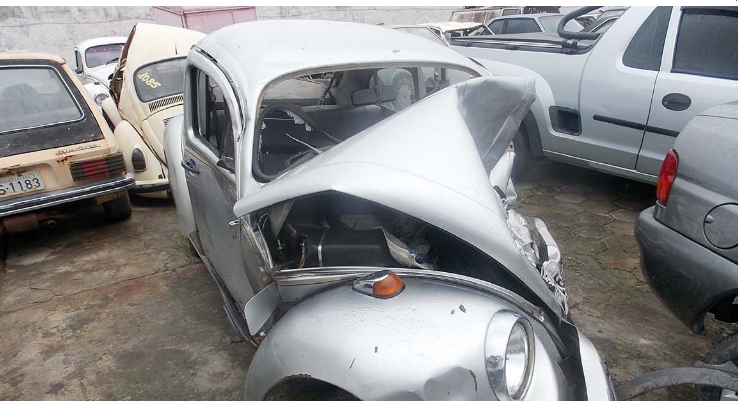
O Fusca teve a frente totalmente destruída

Uma criança morreu e dois adultos ficaram feridos em um acidente ocorrido nessa quarta-feira (9), por volta das 15h15, no bairro Colmeia. Segundo o Corpo de bombeiros, houve uma colisão frontal entre dois carros de passeio na estrada municipal Jesus Antônio de Miranda, conhecida como estrada do Ribeirão Grande.