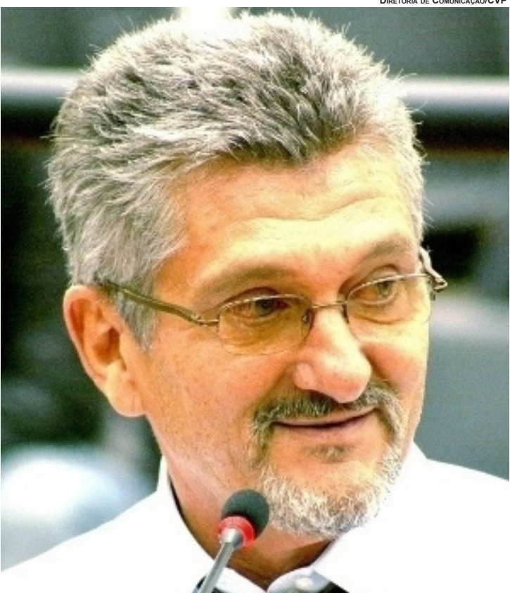
DIRETORIA DE COMUNICAÇÃO/CVP