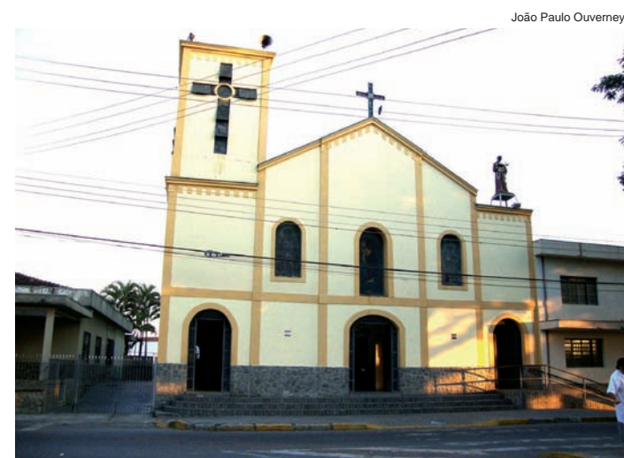
Hoje... Atual fachada da igreja na praça Emílio Ribas