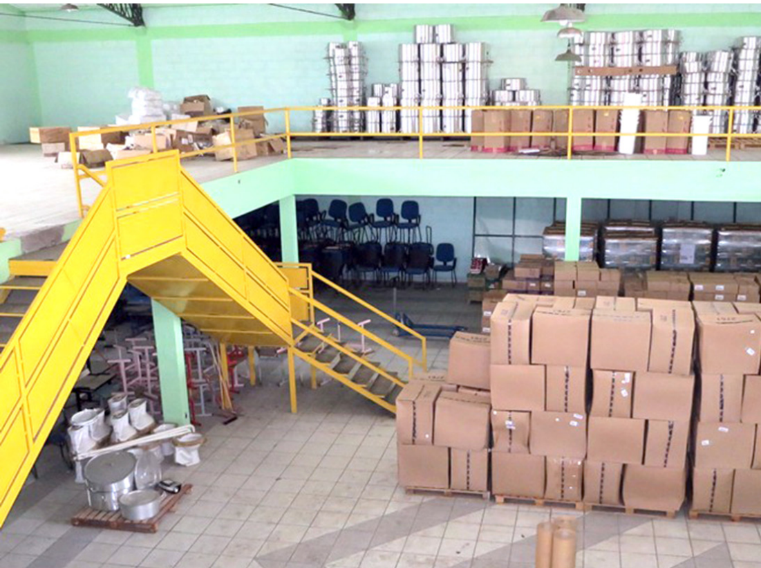
Galpão atualmente utilizado como depósito de materiais da Prefeitura