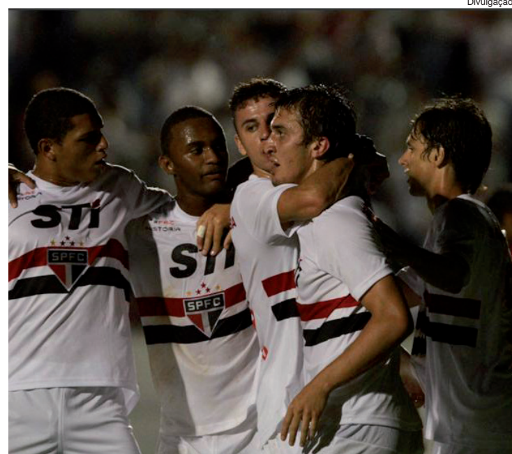
São Paulo possui melhor ataque da competição