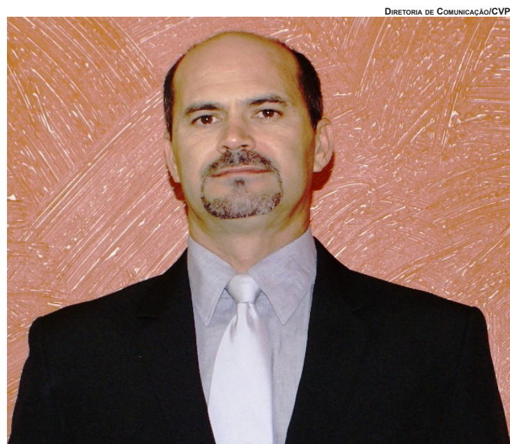
DIRETORIA DE COMUNICAÇÃO/CVP