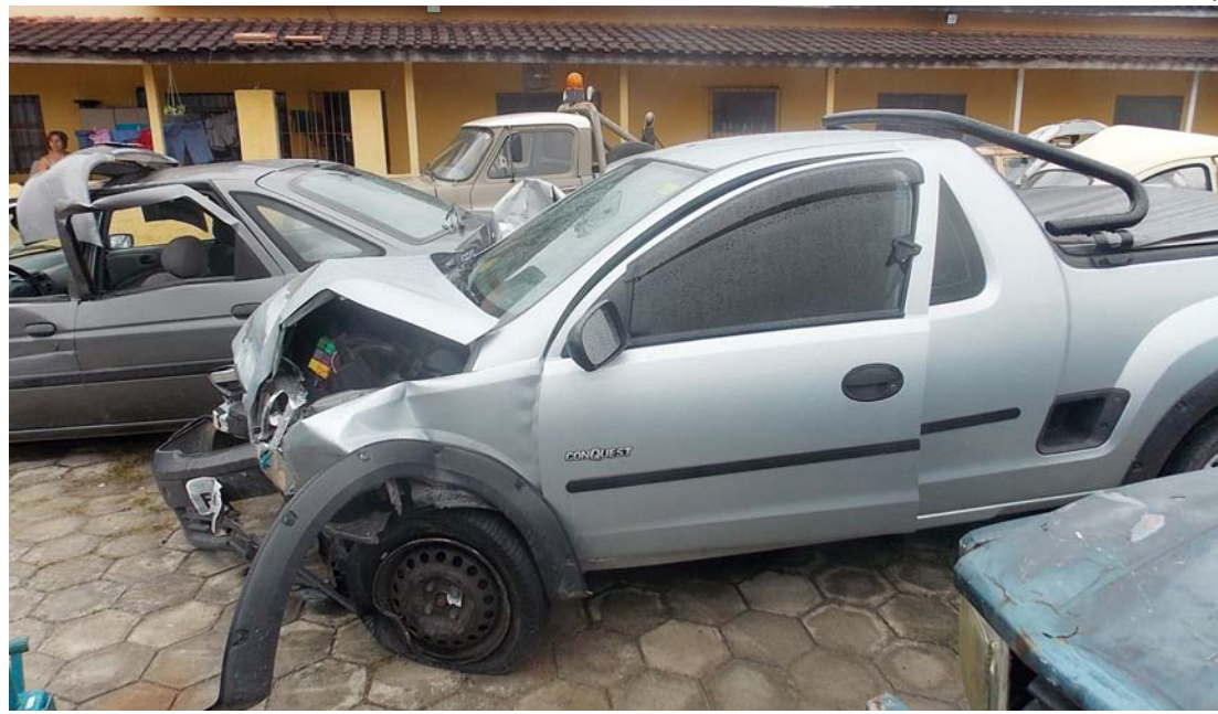
A Montana, de São José dos Campos, também sofreu grande danos

Na hora do acidente chovia muito, o que pode