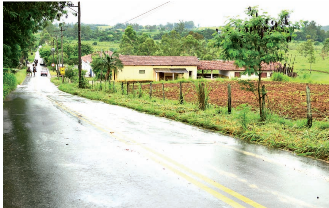
Manutenção na “Jesus Antônio de Miranda” melhora visibilidade da via

tamento de Serviços Municipais, é possível que em outros pontos da cidade apareçam situações semelhantes, pois o volume de chuvas