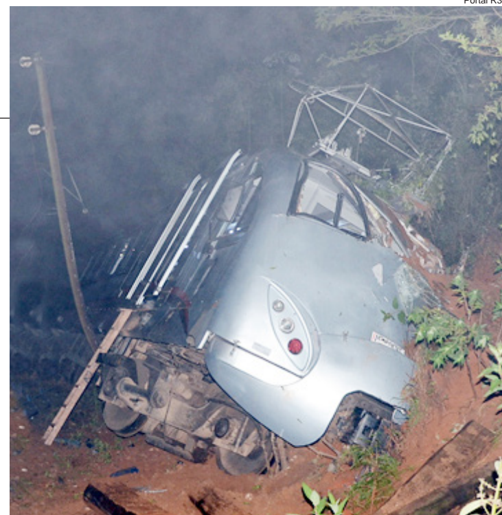
O bonde em foto tirada na noite do acidente

A Polícia Florestal apreendeu no último fim de semana duas gaiolas com pássaros silvestres, além de rede, cartuchos e uma espingarda calibre 36. O fato ocorreu na estrada do bairro dos Oliveiras. O acusado do crime ambiental não foi encontrado em sua casa, mas todos os objetos foram encaminhados à Delegacia de Polícia Civil. Caçar pássaros e outros animais é considerado crime ambiental.