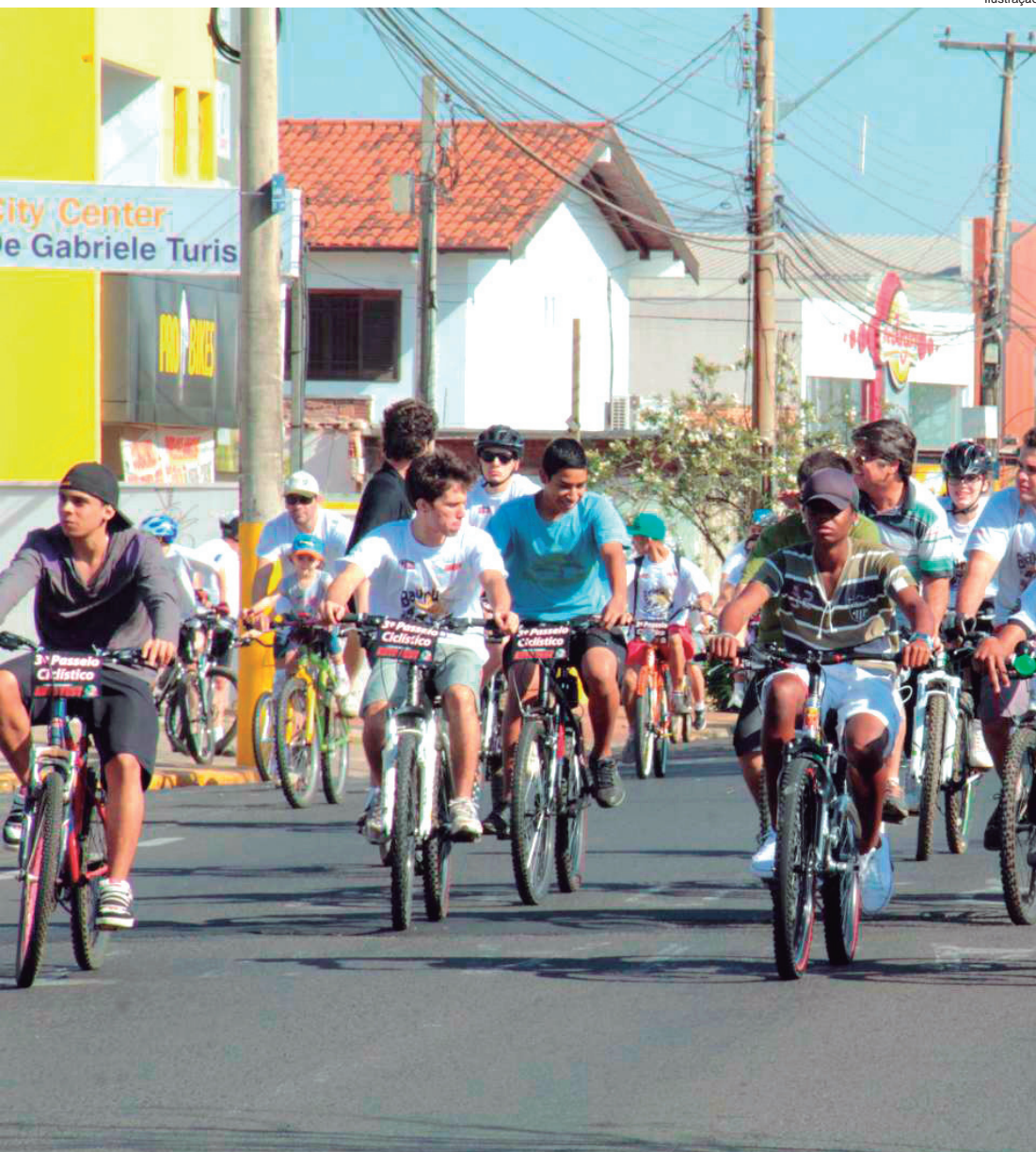
Passeio ciclístico será uma das atrações na festa do aniversário do Pasin