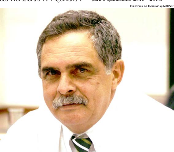
DIRETORIA DE COMUNICAÇÃO/CVP

Reeleito vereador para seu quinto mandato com 1274 votos, pelo DEM, para o quadriênio 2013 - 2016.