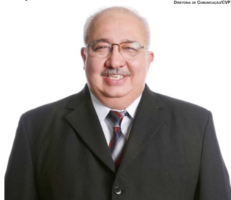
DIRETORIA DE COMUNICAÇÃO/CVP