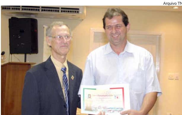
Jornal O Lince, da cidade de Aparecida (Alexandre Marcos Lourenço Barbosa)