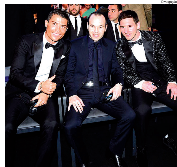
Cristiano Ronaldo, Iniesta e Messi

Autor do gol mais bonito no ano passado, o santista Neymar desta vez não levou nada.