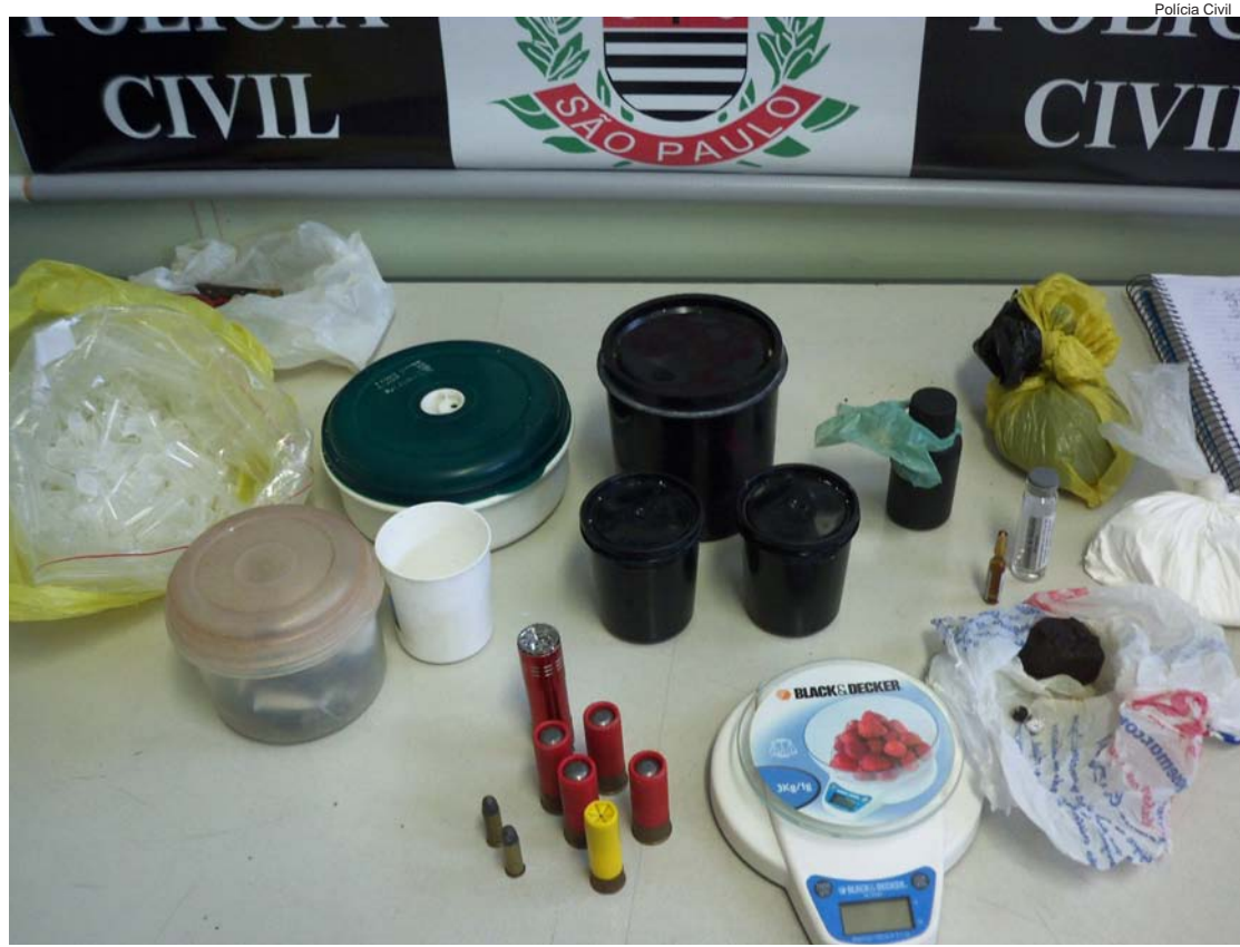
Objetos apreendidos pelos policiais na residência do indiciado

Na última sexta-feira, os policiais do SIG de Pindamonhangaba efetuaram diligências, visando cumprimento de cinco mandados de buscas domiciliares, com a finalidade de locali-