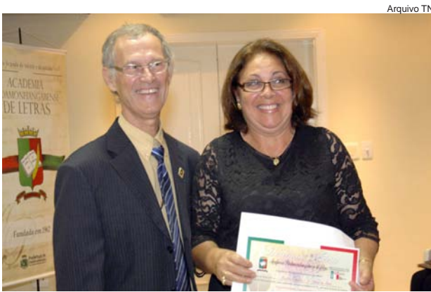
Revista Exemplar (Edmar de Souza)