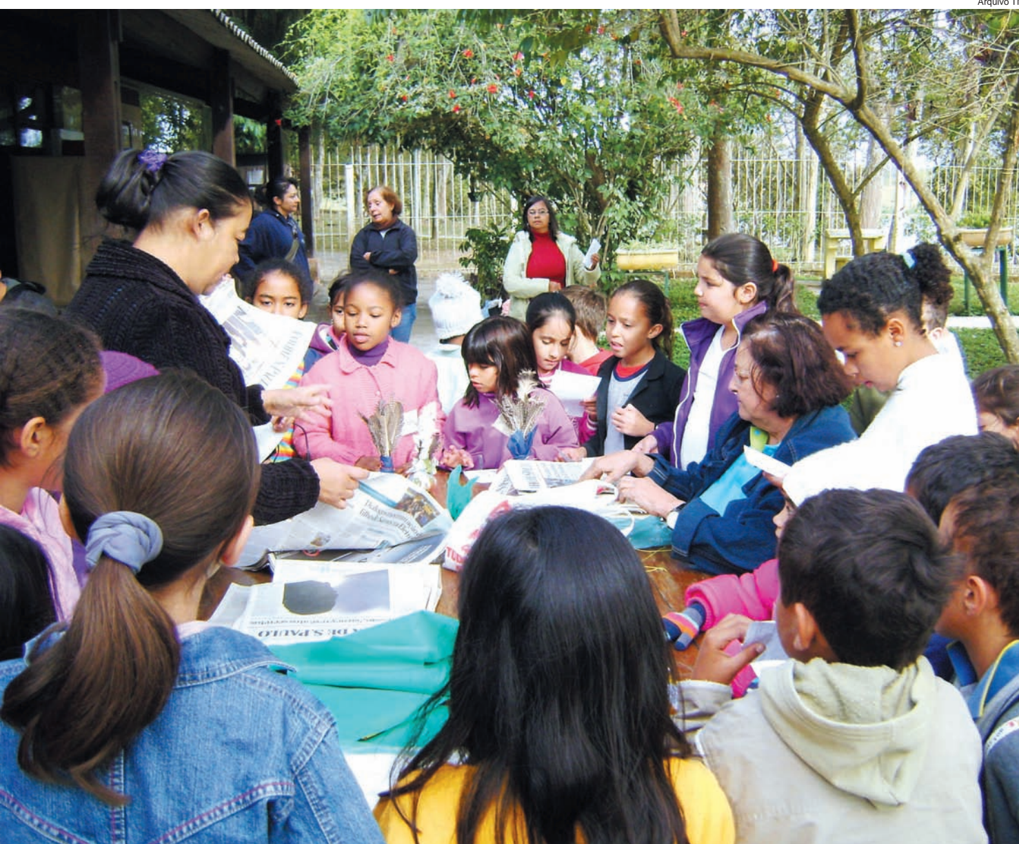
Alunos na Semana de Cultura Popular, promovida na Biblioteca Vereador Rômulo Campos D'Arace, no Bosque

As bibliotecas públicas municipais estão com horários diferenciados no início deste ano, devido ao número inferior de leitores e também ao período de férias dos estudantes. Assim, por hora, as bibliotecas funcionarão de segunda a sexta-feira, das 7h30 às 11h30 e das 13 às 17horas.