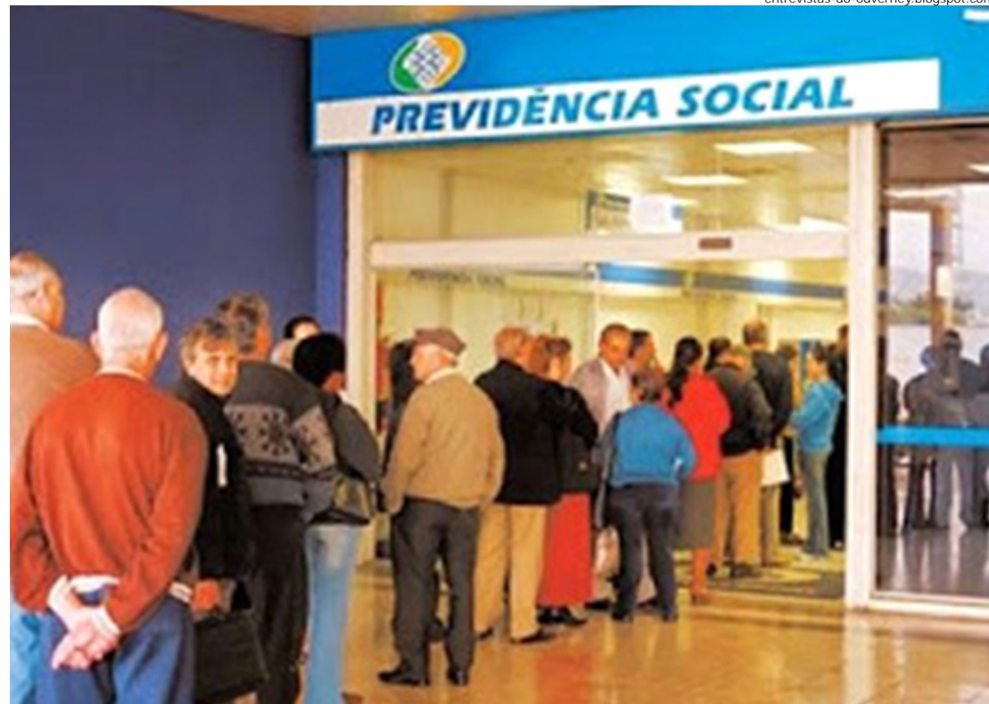
Quase três milhões de segurados do INSS deverão receber um dinheiro extra