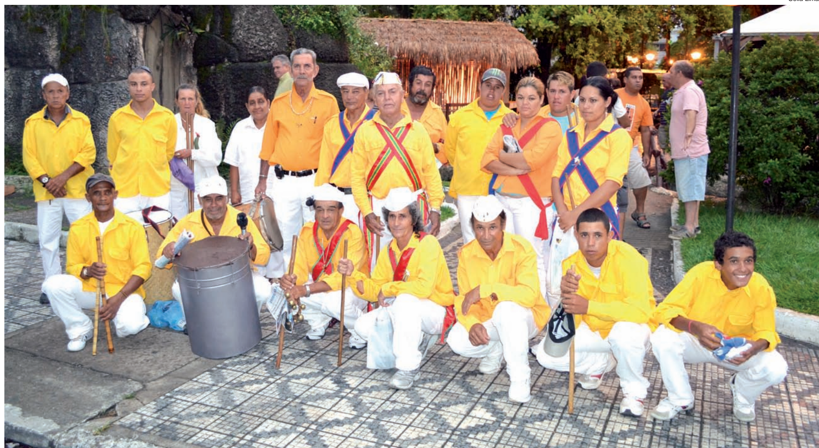
Componentes do grupo São Benedito, uma das mais tradicionais expressões da cultura popular em Pindamonhangaba