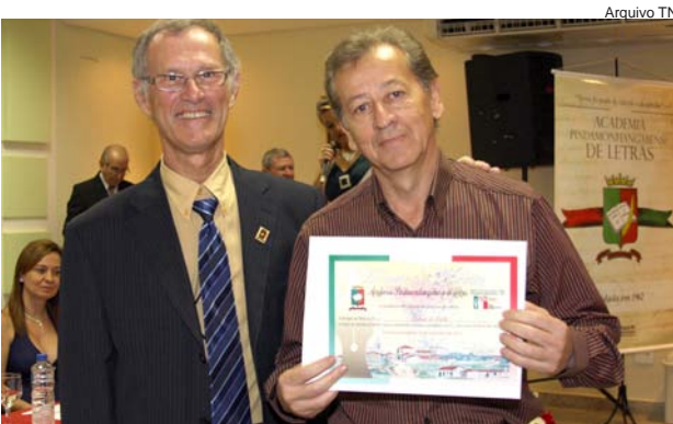
Jornal Tribuna do Norte (Fundação Dr. João Romeiro)