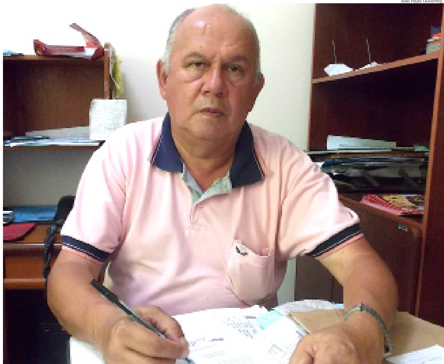
Uma das metas do “Cardosão” é a construção de um campo de futebol

Sobre o relacionamento com o prefeito Vito Ardito, Cardosão diz: “convivemos muito bem com ele