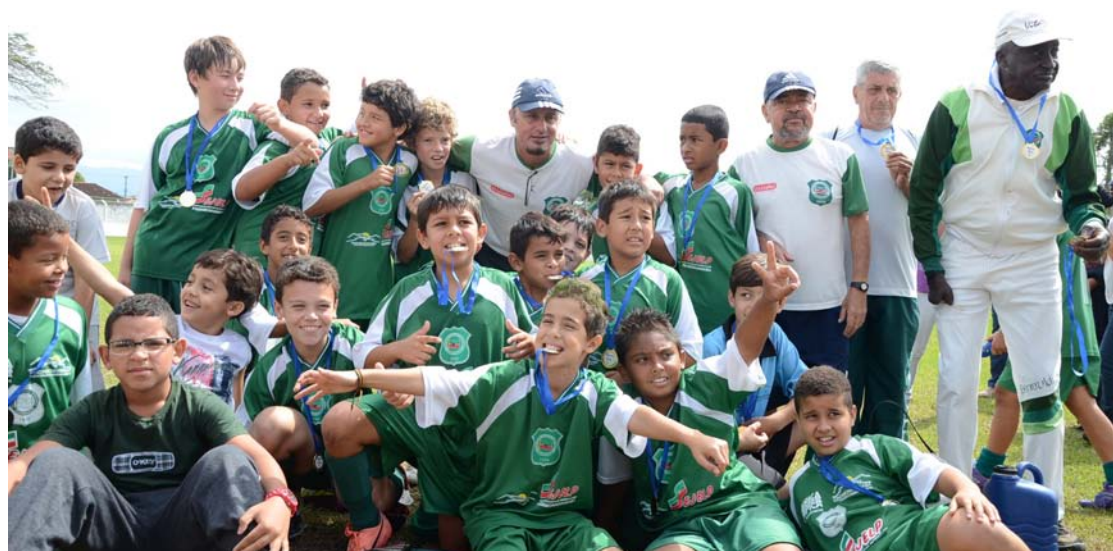
Uma das equipes da Ferroviária, que esteve presente em todas as finais de 2012

O título do Sub11 foi conquistado pela Ferroviária após vencer a decisão con-