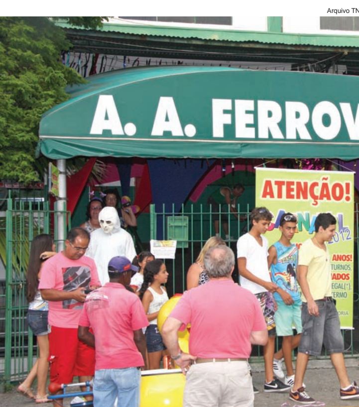
Sócios devem estar com mensalidade em dia para aproveitar os próximos eventos de carnaval