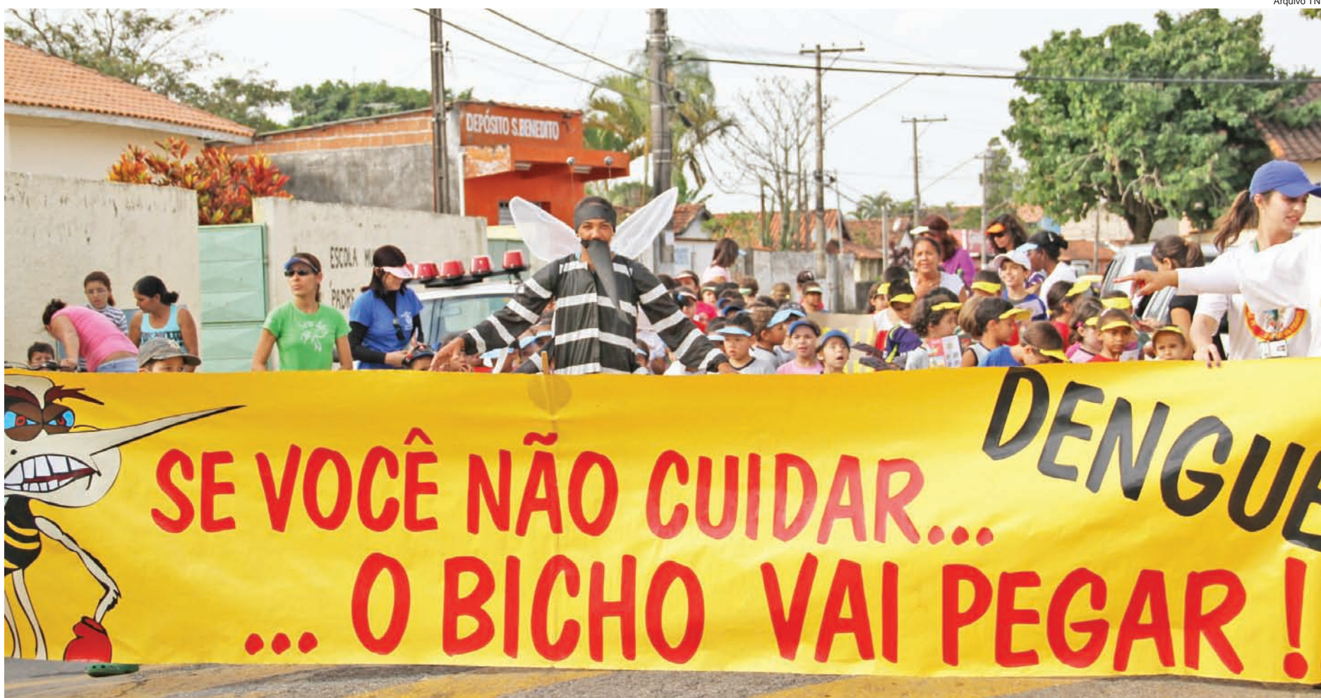
A equipe de Controle de Vetores da Secretaria de Saúde está realizando um trabalho de avaliação de infestação do mosquito da dengue