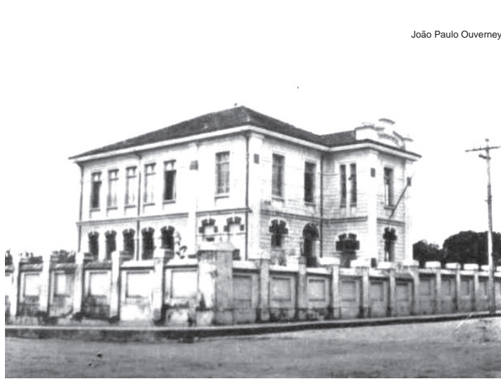
Ontem... prédio da antiga cadeia e fórum

A partir desta edição a Tribuna passa a publicar esta seção, mostrando uma foto antiga de uma localidade de Pindamonhangaba e como está hoje. Abrimos com a esquina em frente à estação da Estrada de Ferro Campos do Jordão, onde atualmente é a Praça da Liberdade, confira: