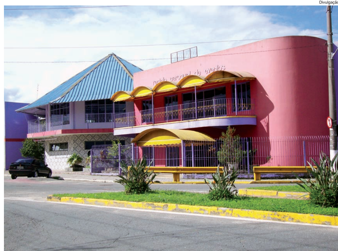
Fachada do Recinto São Vito, localizado no centro do Distrito de Moreira César