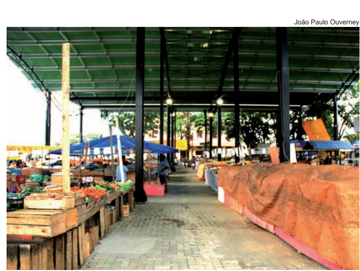
Hoje... Praça da Liberdade