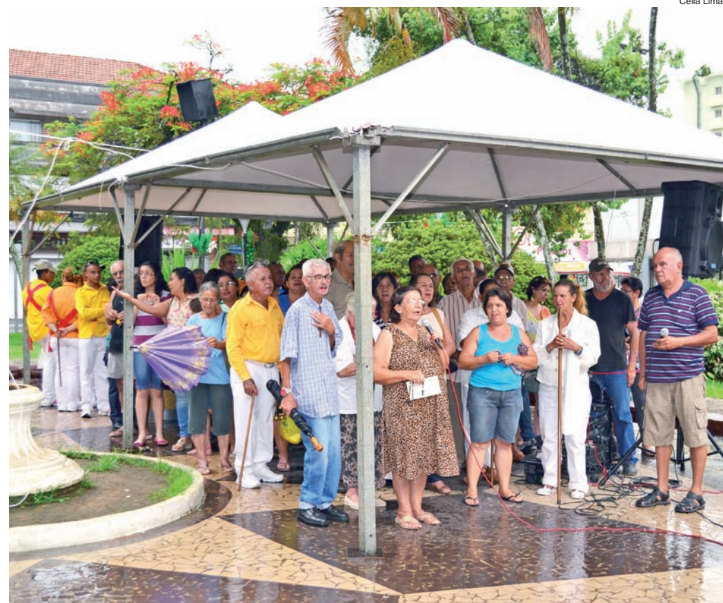
A chuva não foi capaz de afastar o público que compareceu às apresentações