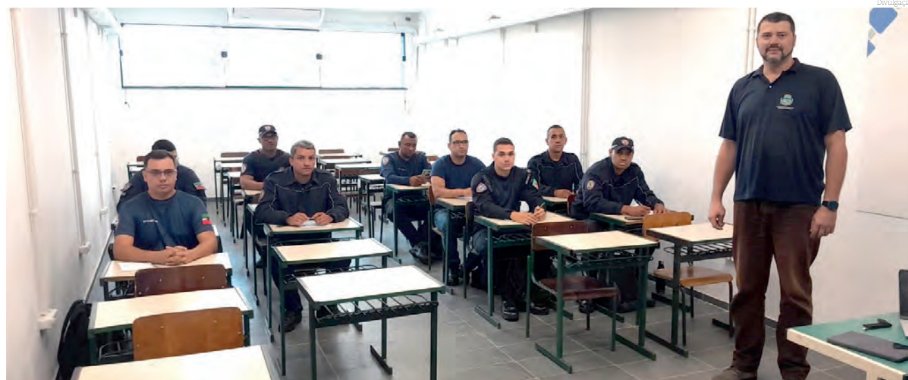
O treinamento tem também uma avaliação psicológica, além de outros aspectos

Parte da capacitação é realizada por autoridades de segurança instrutores e parte por autoridades de diversas áreas, como