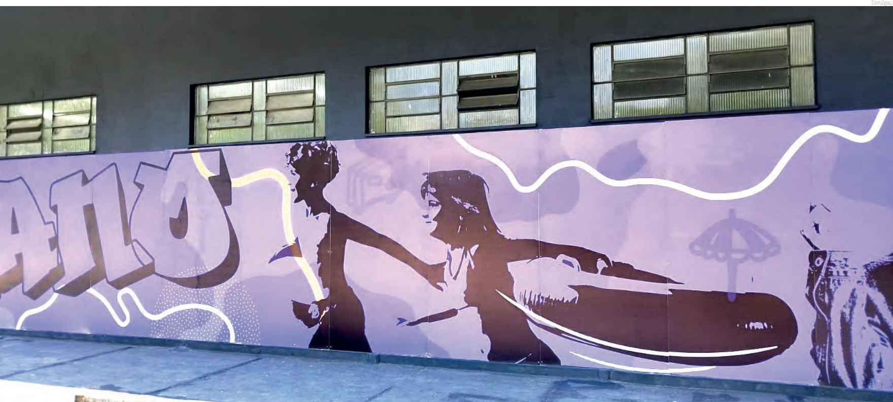
O local será uma central de serviços de direitos humanos para a promoção de cultura, direitos e cidadania

Nesta terça-feira, dia 24 de setembro, às 14h30, a Prefeitura de Pindamonhangaba irá inaugurar o Espaço Humano, uma central de serviços de direitos humanos para promover cultura, direitos e cidadania. Moderno e acessível, o local estará aberto a todos para ensaios, debates, formações e exposições, oferecendo um ambiente de pertencimento público.