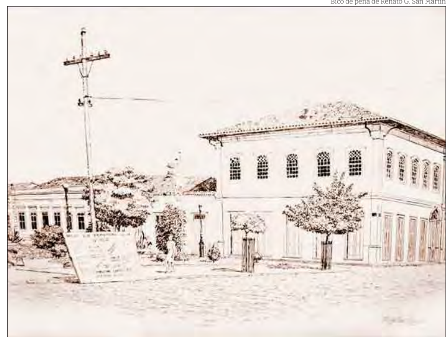
Os filmes do Eden Cinema eram anunciados em cartaz posicionado na calçada da praça Monsenhor Marcondes

“Como forma de homenagear os músicos que se formaram acompanhando as ações cinematográficas e como forma de reviver os tempos áureos do cinema mudo, muitos pianistas têm se dedicado a reconstituir essa época.