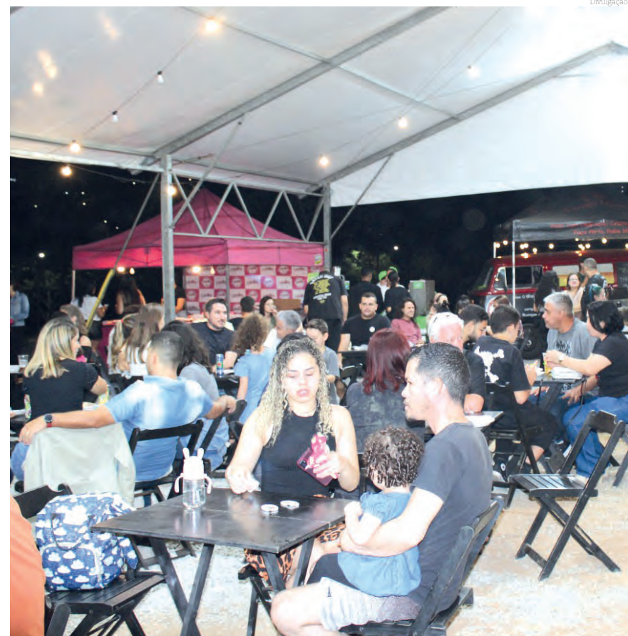
O evento teve uma excelente aprovação por todos que conferiram os shows e ótima gastronomia

A primeira edição do ROCK NO DECK, realizado no Parque da Cidade entre os dias 20 e 22 de setembro foi um grande sucesso, reunindo milhares de pessoas no espaço. Os participantes elogiaram o formato do evento, o estilo musical, a seleção de artistas, bem como o layout do local, decoração, espaço gourmet, e a gastronomia. Com balanço positivo do evento, a Secretaria de Cultura e Turismo vai criar outras edições da ação, com possibilidade de um evento a cada três meses com variação dos estilos musicais.