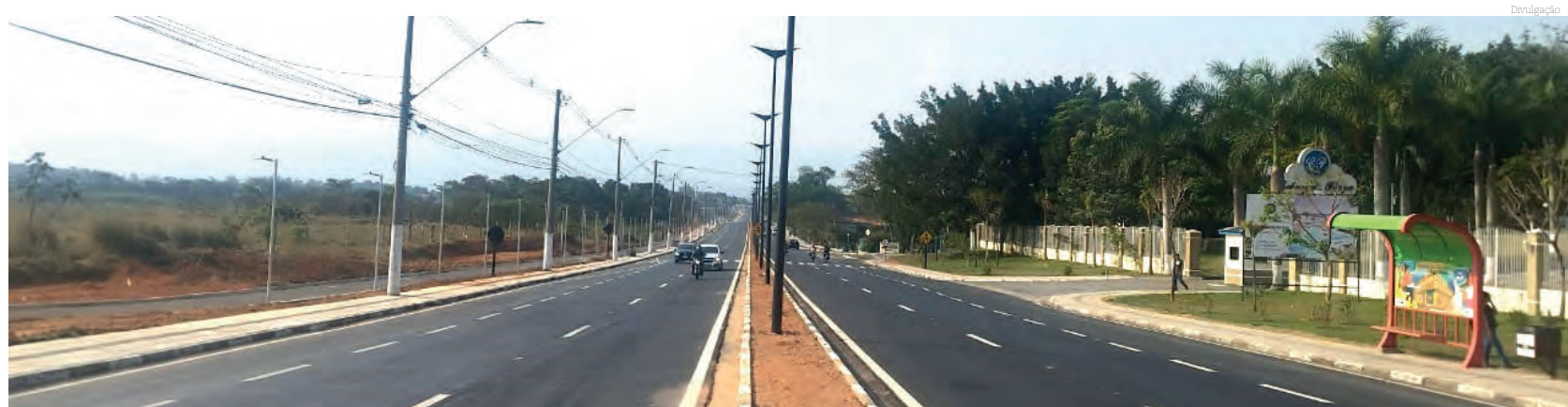
As obras de melhorias incluem outros serviços de revitalização na avenida

Após a finalização de todos os serviços, de todas as etapas da obra, a ciclovia ainda receberá pintura e sinalização vertical e horizontal.