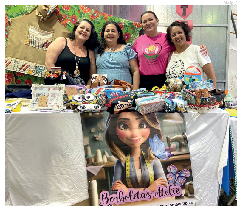
O trabalho voluntário foi essencial para o sucesso da feira