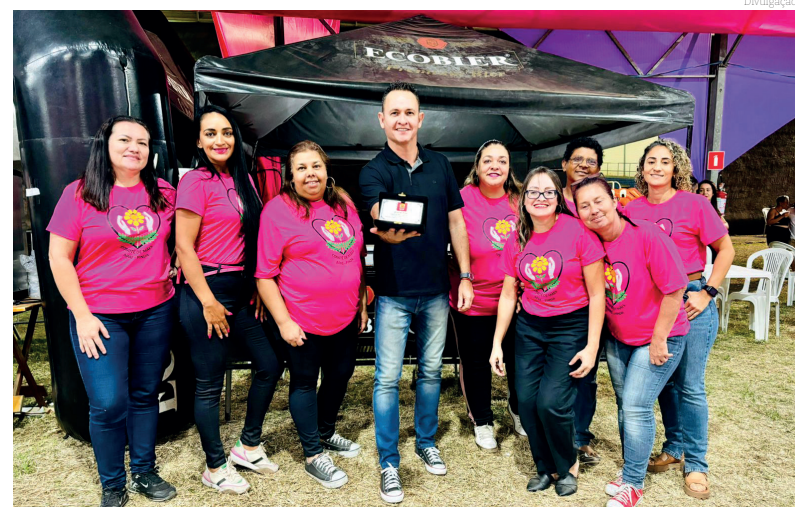
Equipe da Feira da Fraternidade

A organização da feira ainda agradeceu a todos que contribuíram para o sucesso da festa, seja com doações, parcerias, ou ainda com o trabalho incansável de quem esteve presente durante todo o evento, bem como a Prefeitura de Pindamonhangaba.