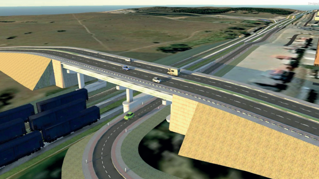
Projeto do viaduto criado pela MRS