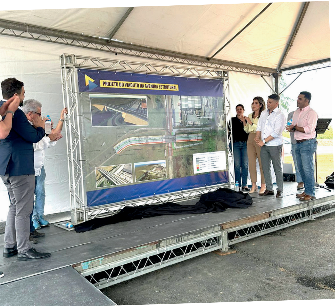
Projeto demonstra como será o viaduto