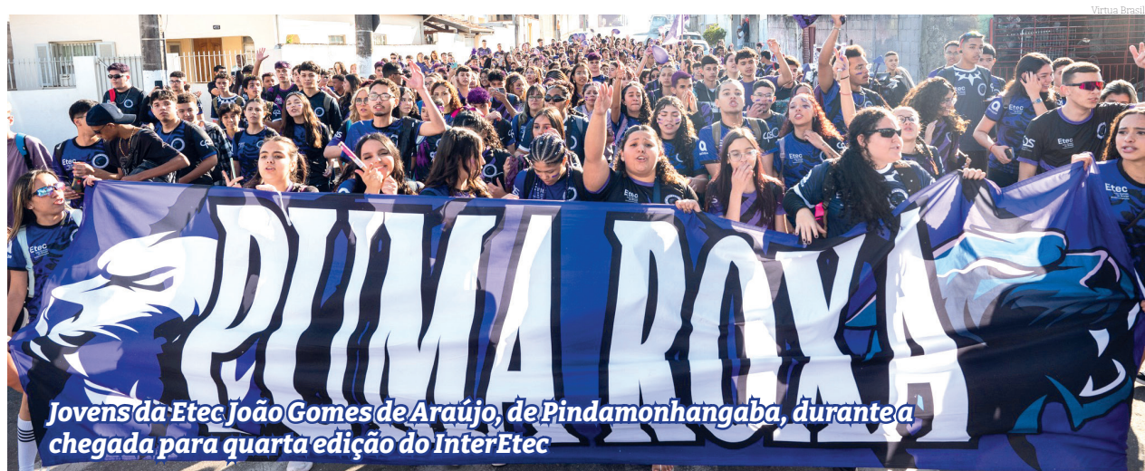
Jovens da Etec João Gomes de Araújo, de Pindamonhangaba, durante a chegada para quarta edição do InterEtec