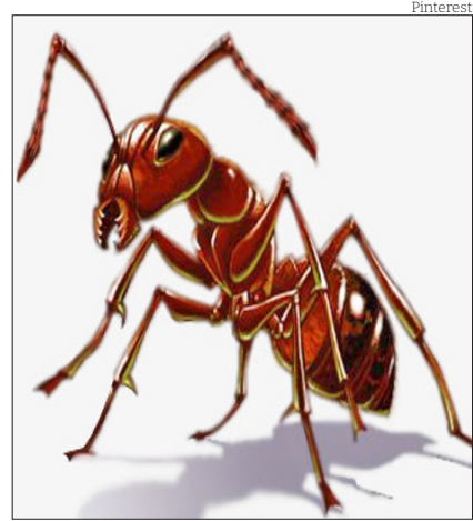
Formigueiros x arborização

“Lembre-se que seu serviço é muito bem pago; por mês recebe 500$000. Quando foi que ganhou tanto dinheiro? É preciso, pois, que trabalhe. Tenha sempre em vista que o intendente do município de Taubaté, três vezes maior do que o nosso, contenta-se com 300$00 por mês, enquanto por cá por casa recebe o intendente municipal 500$000”.