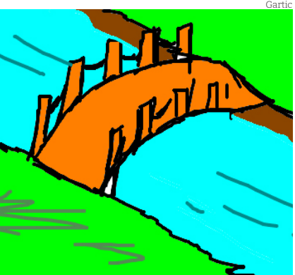
Ponte do Paraíba

Nesta edição, a página de História recorda passagens relacionadas a críticas publicadas no jornal Tribuna do Norte quanto ao desempenho do governo municipal frente às deficiências verificadas na região central da cidade na primeira década de 1900.