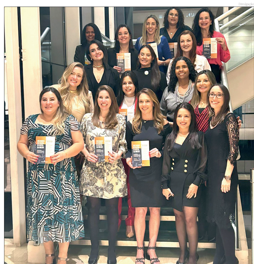
Delegadas de Defesa da Mulher, autoras do livro, durante o lançamento