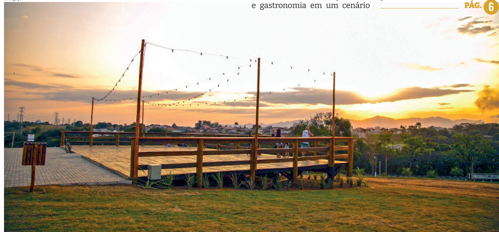
Primeira edição do evento de rock acontece em meio ao belo cenário do deck recém-inaugurado no Parque da Cidade

A Prefeitura de Pindamonhangaba promoverá, de 20 a 22 de setembro, a 1ª edição do 'Rock no Deck', um evento que combina música de qualidade e gastronomia em um cenário