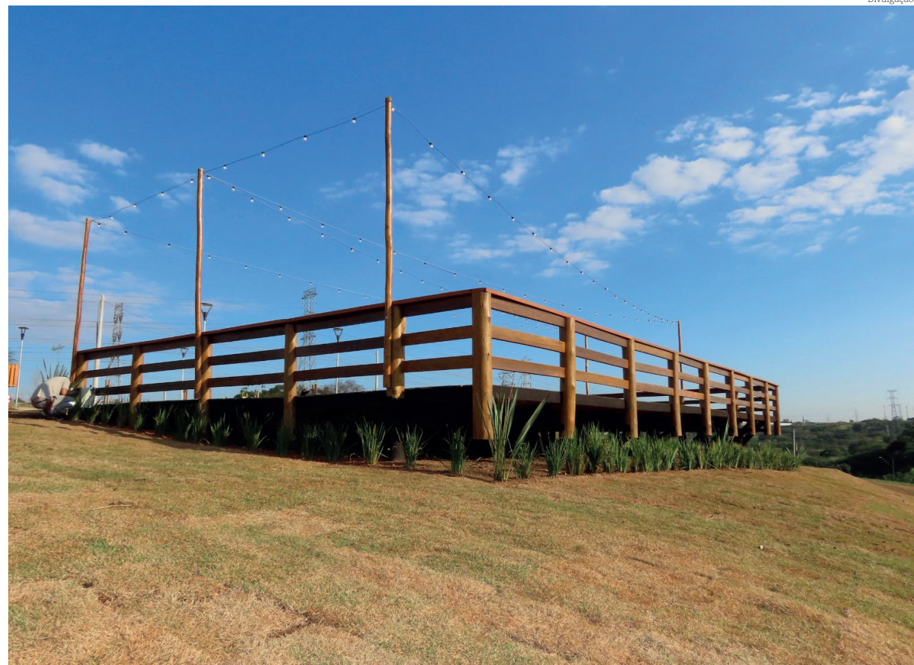
O Deck do Parque da Cidade já se tornou um ponto de encontro popular para fotos e lazer

“Este é um evento inovador que estamos organizando para aproveitar o belo cenário do deck recém-inaugurado no Parque da Cidade. O local já se tornou um ponto de encontro popular para fotos e lazer, e nada melhor do que adicionar música de qualidade e gastronomia à experiência”, destaca Ricardo Flores, secretário adjunto de Turismo de Pinda.