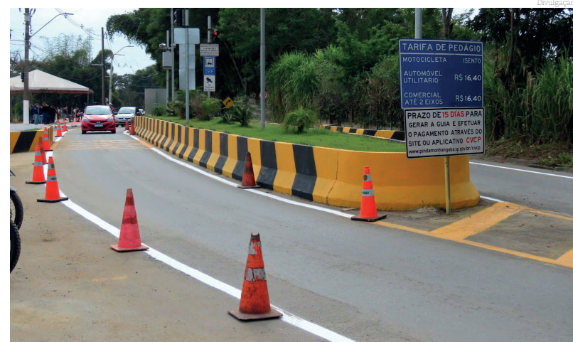
Pedágio isenta veículos de Pinda

Com a autorização da Agência Nacional de Transportes Terrestres (ANTT) para alteração no valor dos pedágios da Rodovia Presidente Dutra, o pedágio da estrada do Atanázio também será reajustado a partir da 0 hora de hoje, dia 3 de setembro, passando a ser de R$ 16,40 – mesmo valor praticado na praça de Moreira César.