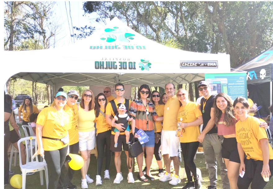
Alguns dos participantes do ‘Agosto Dourado’

A programação da manhã começou com um animado alongamento seguido por um aula de zumba. Em seguida, os participantes realizaram uma ca-