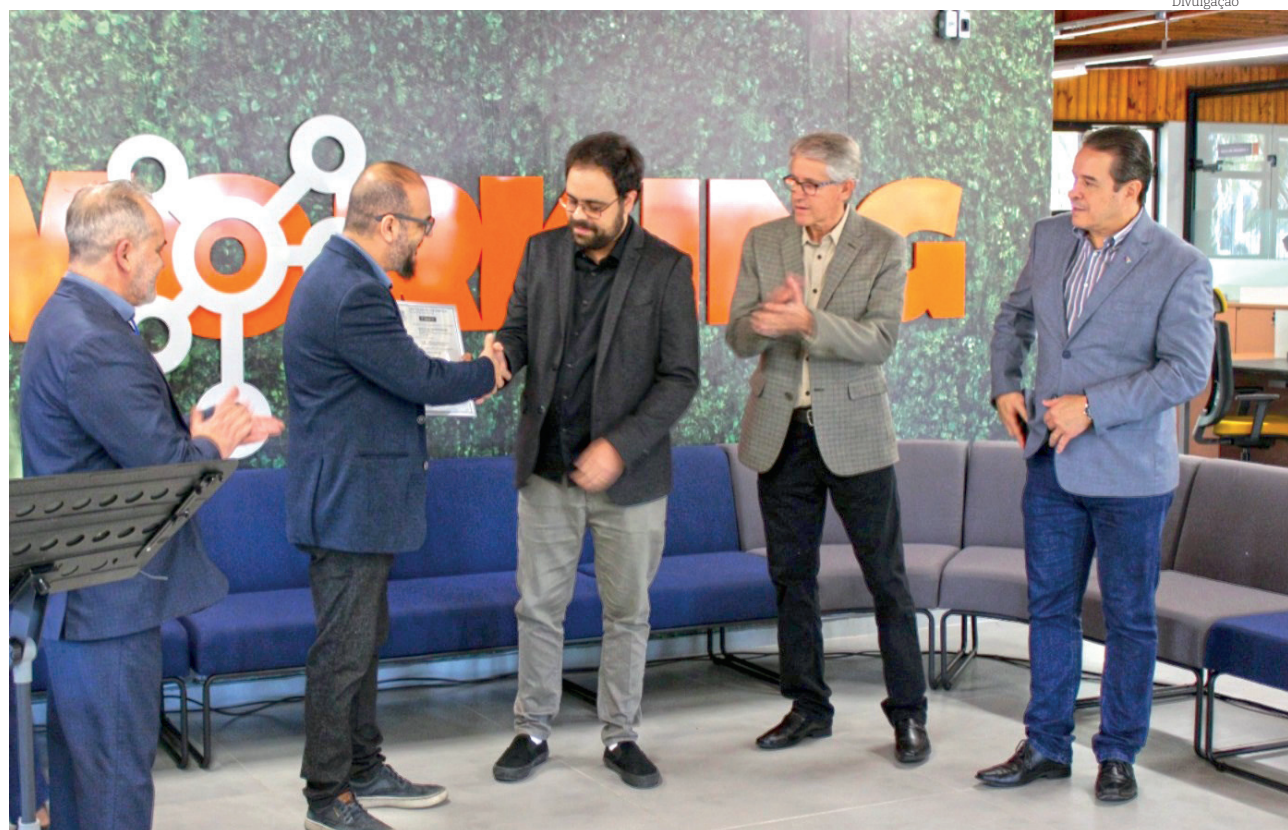
A renovação da certificação 'Cidade Inteligente' traz benefícios importantes para o município