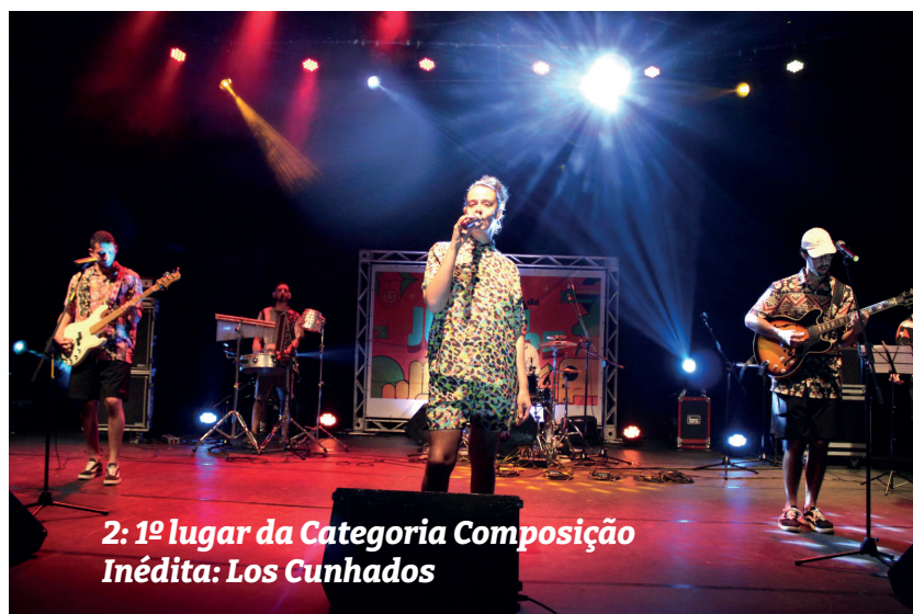
2º lugar da Categoria Composição Inédita: Los Cunhados

Salgado - "Tar e Quar", além do prêmio no valor de R$ 916,10.