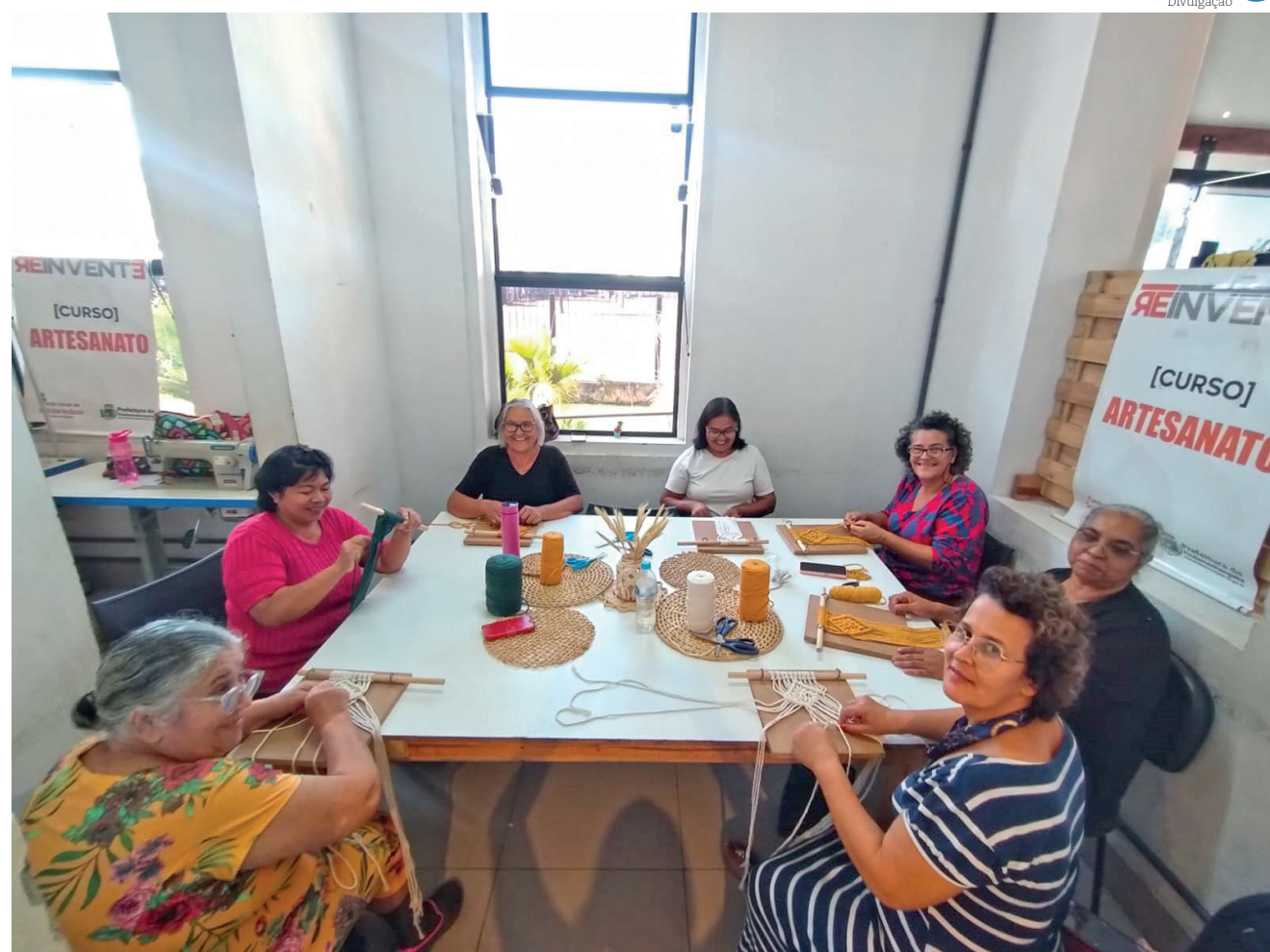
O Curso de Artesanato é uma das opções oferecidas gratuitamente pelo 'Programa Reinvente'