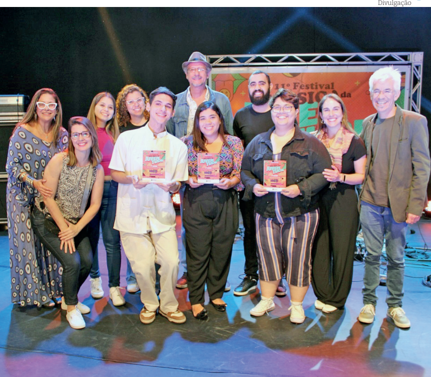
Ao todo, 24 jovens se inscreveram, dos quais 20 foram habilitados para se apresentar no festival: 11 concorrentes na categoria Interpretação e 9 na categoria Composição Inédita