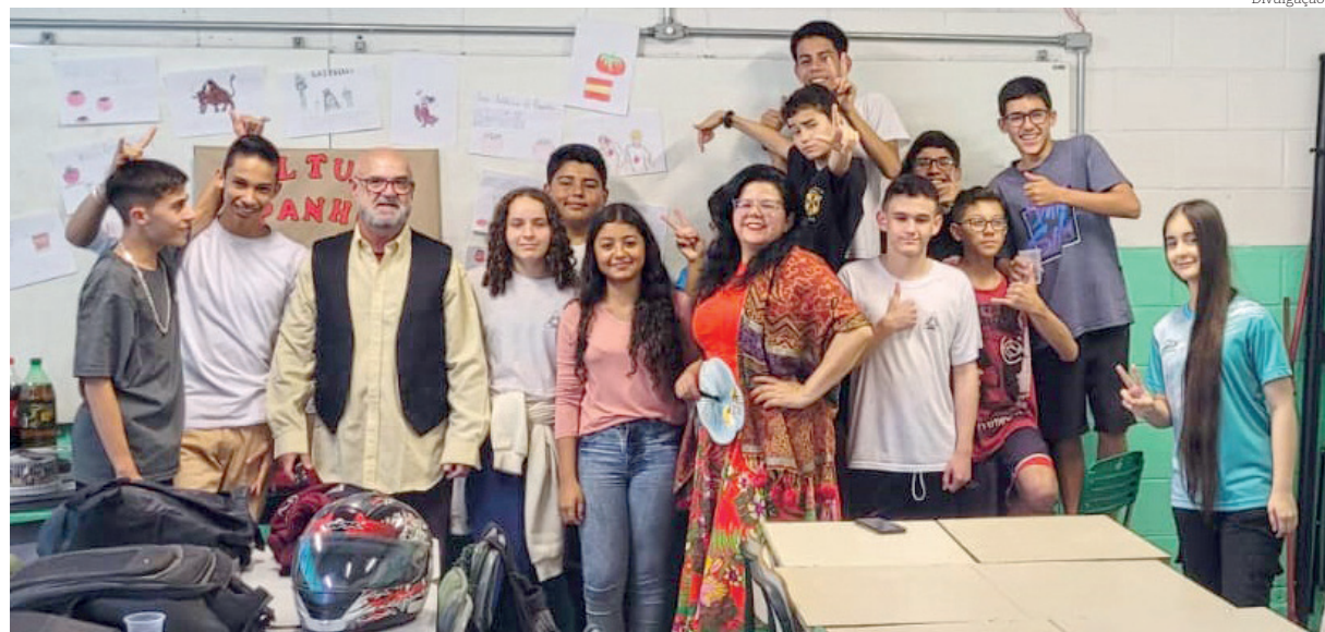
Aula combina elementos tradicionais do Espanhol com influências contemporâneas

"E isto não seria possível sem o trabalho de todos os envolvidos neste processo, buscando sempre extrair e desenvolver o melhor em cada aluno", enfatizou a coordenadora.