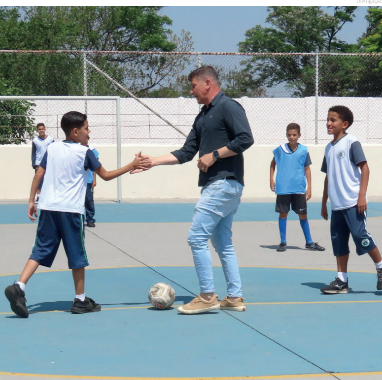
A nova quadra será utilizada pelos alunos e comunidade

A Prefeitura de Pindamonhangaba entregou a quadra esportiva para a Escola Municipal Raquel de Aguiar Loberto, no Vale das Acácias, dia 25 (quarta-feira), às 10 horas.