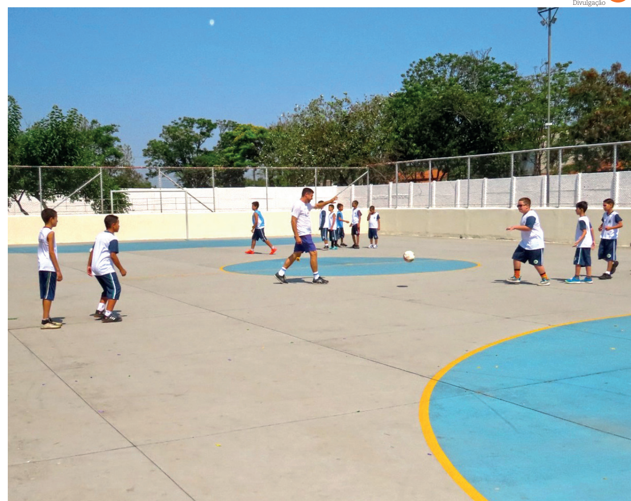
Alunos da escola fizeram um jogo para a estreia do novo equipamento público na unidade