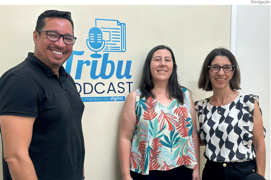
Web Rádio abordou projetos da Secretaria Estadual de Educação