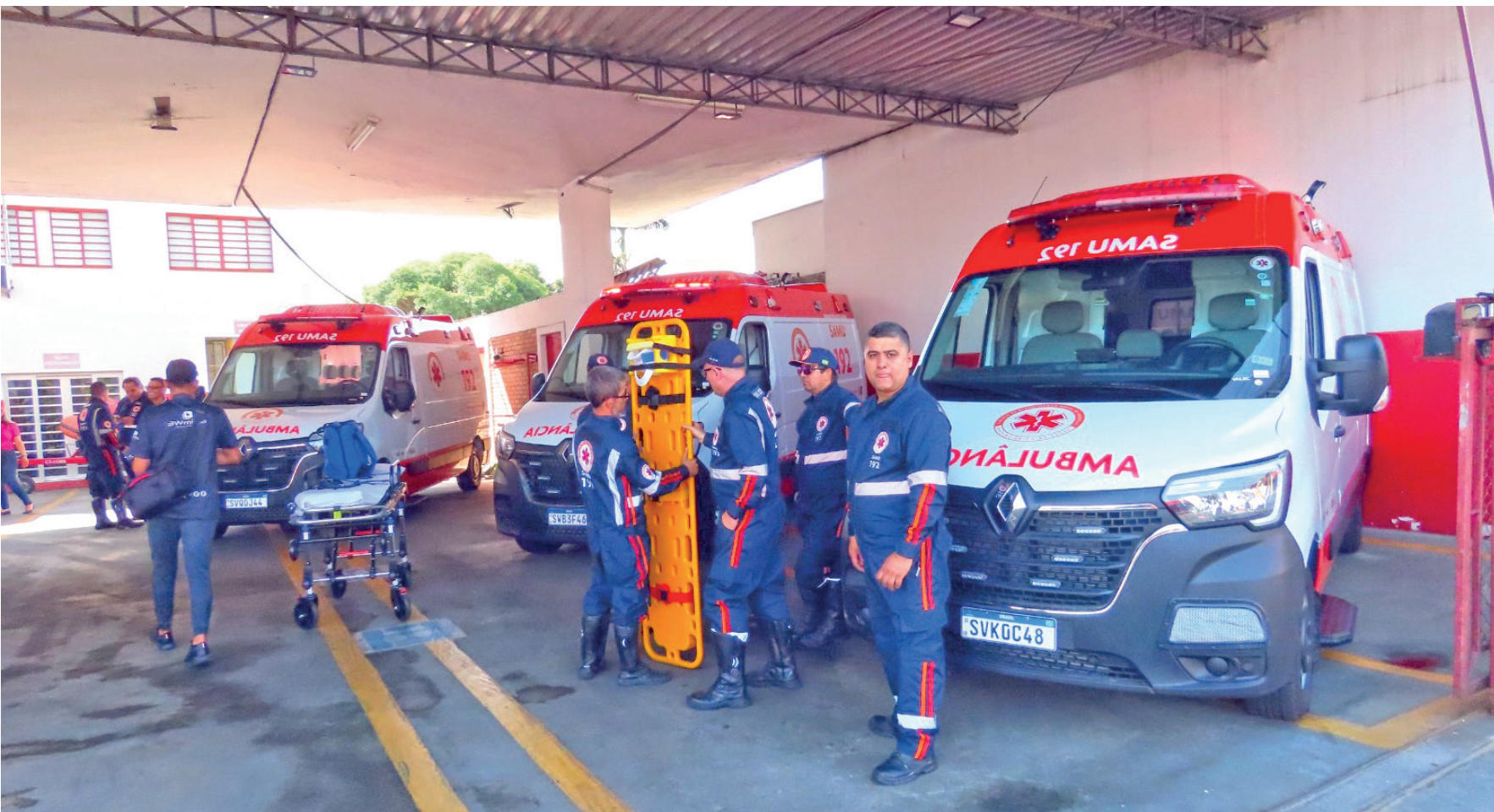
As ambulâncias fazem parte do Projeto Diagnóstico e Reestruturação da frota do Serviço de Atendimento Móvel de Urgência (SAMU)

A Prefeitura e Pinda fez a entrega das novas ambulâncias para as equipes do SAMU. Uma ambulância para a base do SAMU de Moreira César, de modelo básico, e duas para a Base do SAMU de Pindamonhangaba, uma básica e uma avançada.