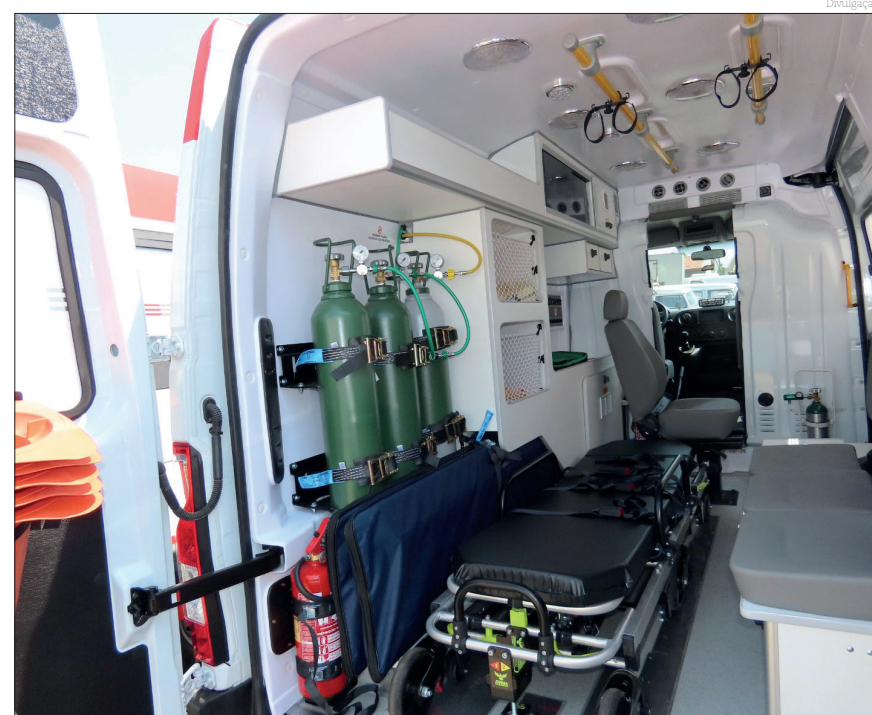
Os novos veículos foram adaptados e fazem parte da estruturação da frota do SAMU...

Para mais informações siga o Instagram do festival: instagram.com/elasfestival .