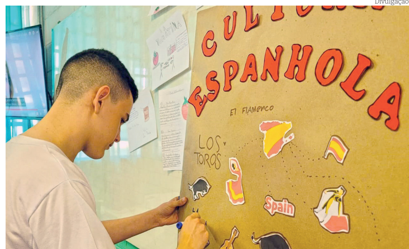
Os alunos responderam com entusiasmo à proposta

Com essa iniciativa, a Escola Antonia Carlota reafirma seu compromisso com uma educação de qualidade e com a preparação de seus alunos para um mundo cada vez mais interconectado.