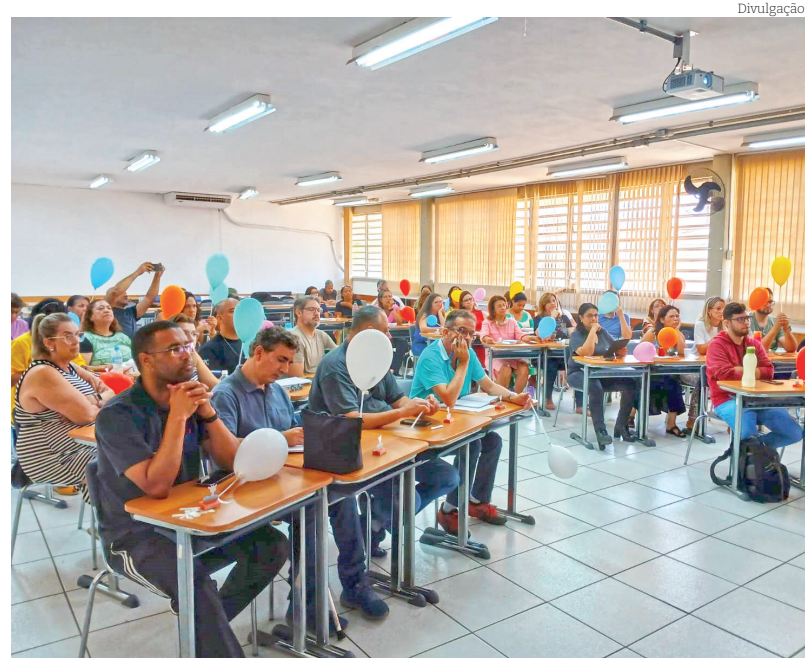
Ponto central foram as questões ligadas à saúde mental

A formação faz parte também das ações do 'Setembro Amarelo' e valorização da vida. Neste sentido contribuir para que a escola pública possa contribuir com uma educação de qualidade e equânime, contudo, toda a sociedade é corresponsável neste processo de valorização da educação pública como um dos valores latentes de nosso tempo.