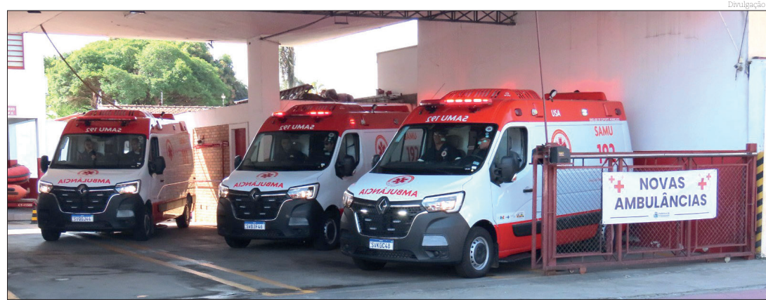
As novas ambulâncias darão atendimento ao SAMU

A Prefeitura e Pindamonhangaba fez a entrega das novas ambulâncias para as equipes do SAMU. Uma ambulância para a base do SAMU de Moreira César, de modelo básico, e duas para a Base do SAMU de Pindamonhangaba, uma básica e uma avançada.