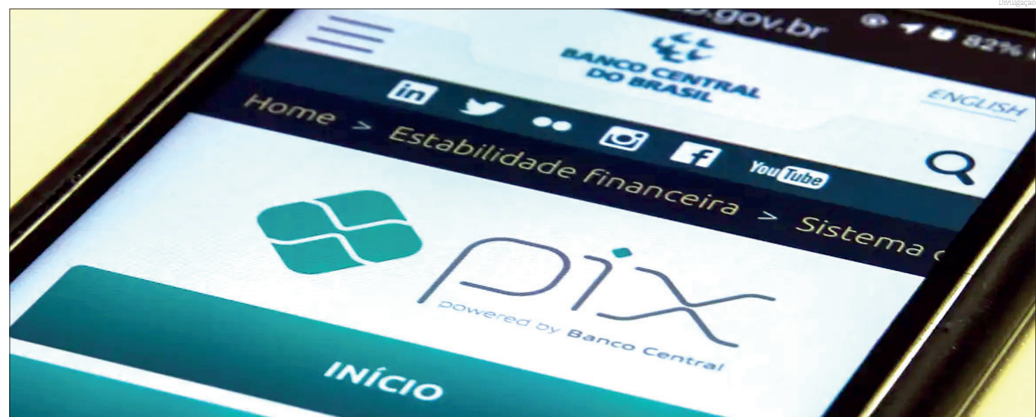
A modalidade superou a marca de 227 milhões de transações em 24 horas