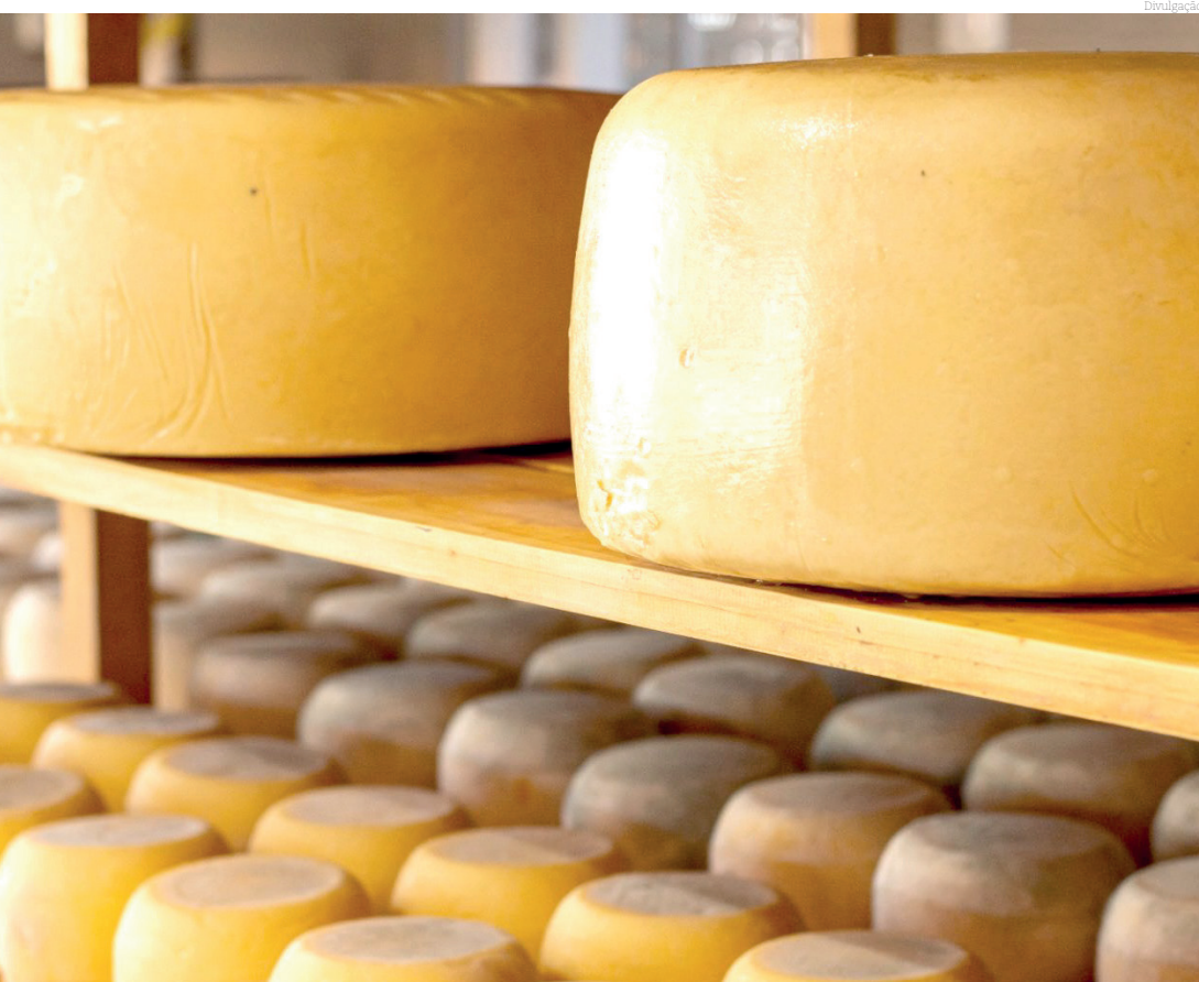
O Selo de Qualidade dos Produtos Artesanais de São Paulo será composto por quatro dígitos

A cadeia de produtos artesanais do Estado de São Paulo ganhou um selo de certificação que garante, para além da segurança de consumo, o alto valor agregado dos produtos artesanais.