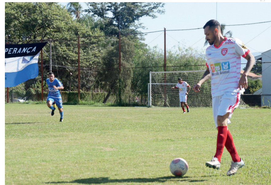
Os campos da cidade ficaram repletos de atletas

Primeirona conhece seus finalistas em dois jogos muito equilibrados