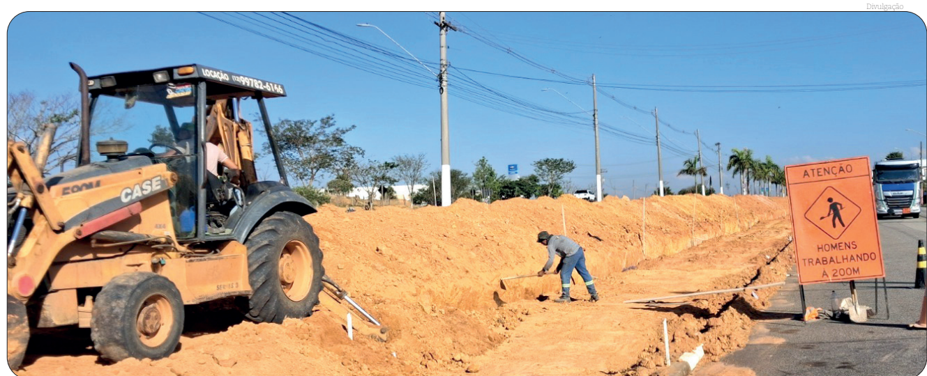
As obras de revitalização estão ainda mais avançadas, após estas fotos realizadas em agosto deste ano

As obras de revitalização que estão acontecendo entre a rotatória do João do Pulo e a região do Distrito Empresarial Dutra em uma extensão de 2,7 km, contemplam a implantação de uma ciclovia, reforma no canteiro central com infraestrutura para iluminação central com fios subterrâneos, revitalização das calçadas nos dois sentidos com piso podotátil, sinalização viária vertical e horizontal, dentre outras melhorias.