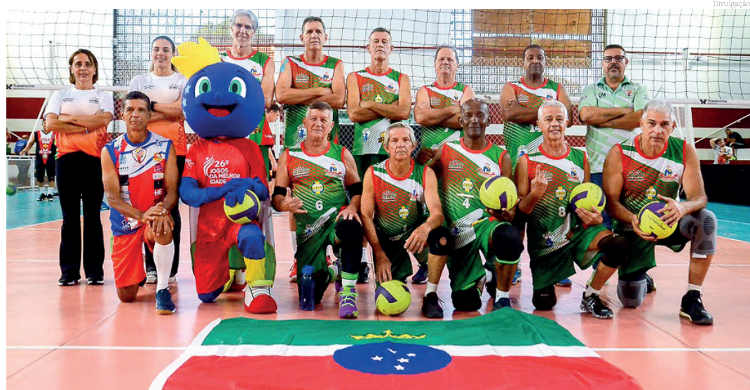
As competições incentivam a atividade física e a interação entre todos os participantes