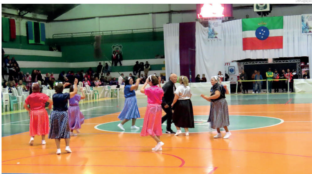
A nova edição dos Jogos Municipais do Idoso prometem movimentar a cidade

As provas serão realizadas em diversos locais da cidade, incluindo a Quadra Coberta, CE João do Pulo e o CE Zito, e os eventos serão abertos ao público.