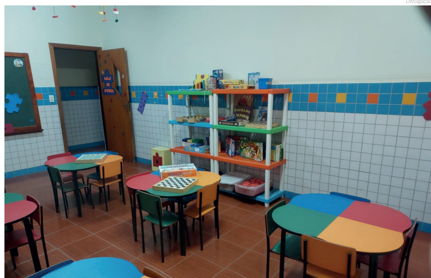
As atividades no contra turno desenvolvem novas habilidades e a participação ativa dos familiares

As inscrições estão abertas. Entre em contato com a Instituição via telefone: (12) 3522-1350 ou pessoalmente: Rua São João Bosco, 49, Santana (ao lado do Posto de Gasolina).