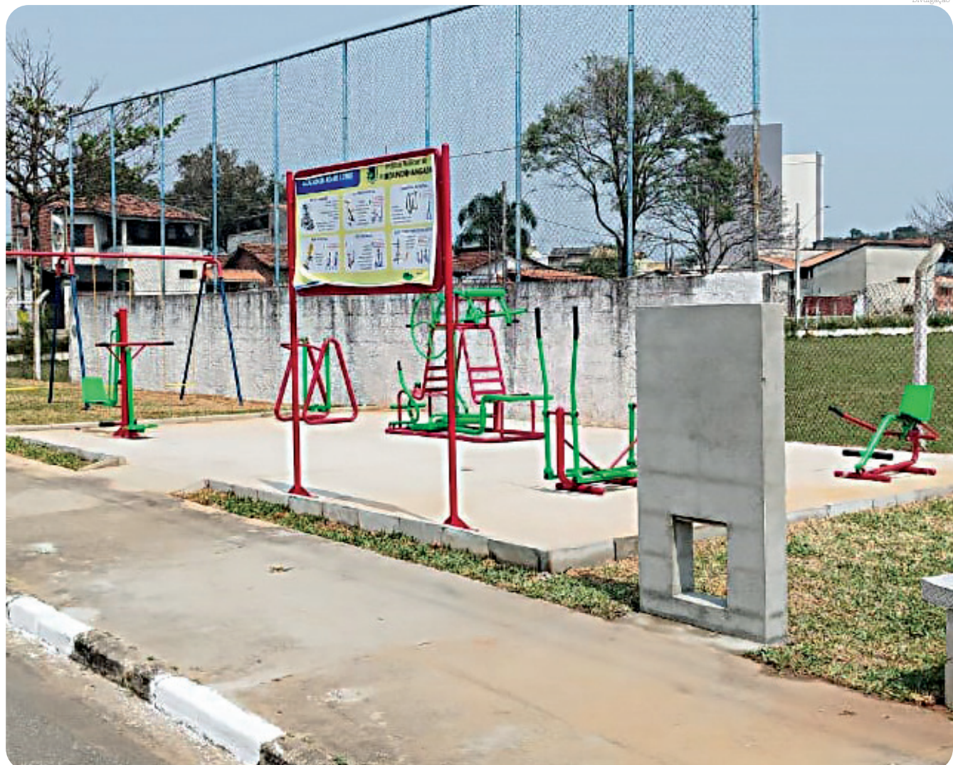
O local vai oferecer lazer para as famílias da região