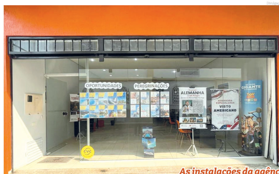
As instalações da agência no Pinda Boulevard

Para mais informações sobre os roteiros e pacotes da agência, além de outras informações, confira tudo no Instagram da agência: @agenciaveroicone.