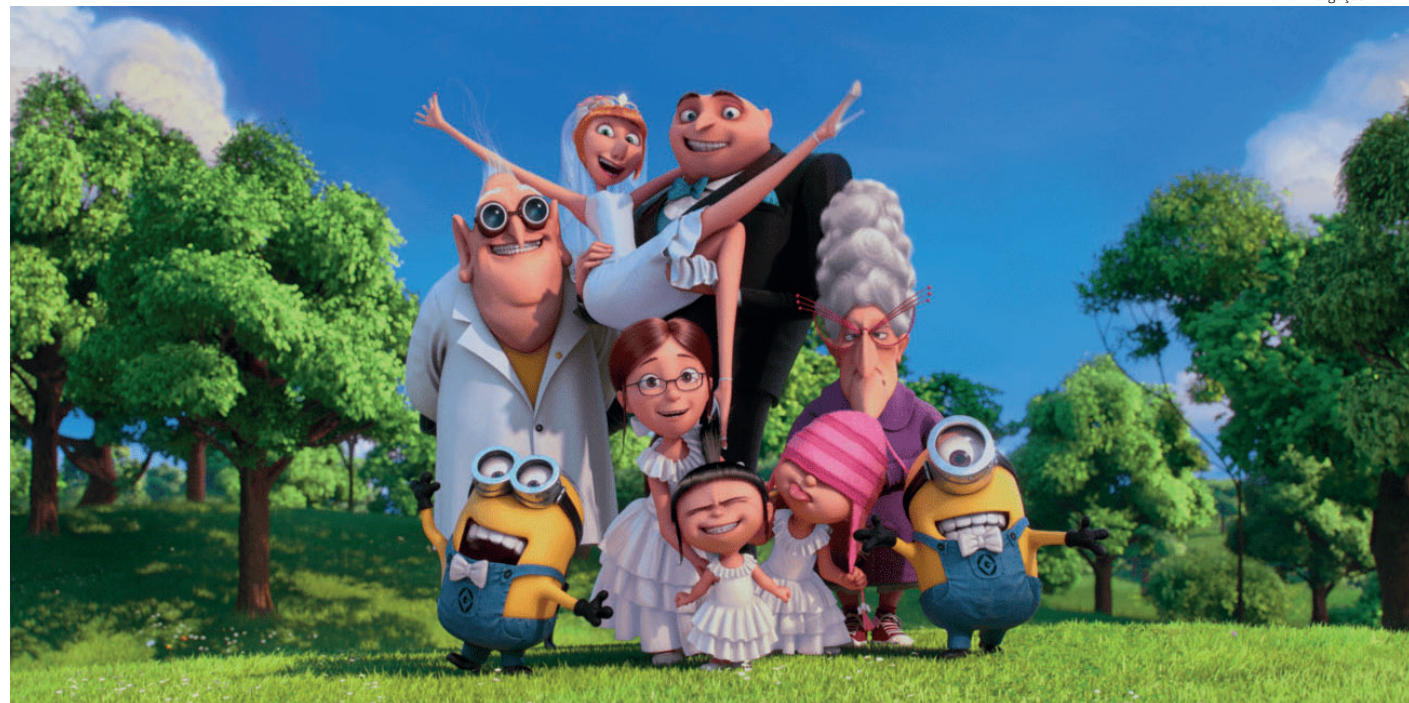
Gru, o supervilão favorito de todo mundo, está de volta para uma nova e ousada aventura com seus minions