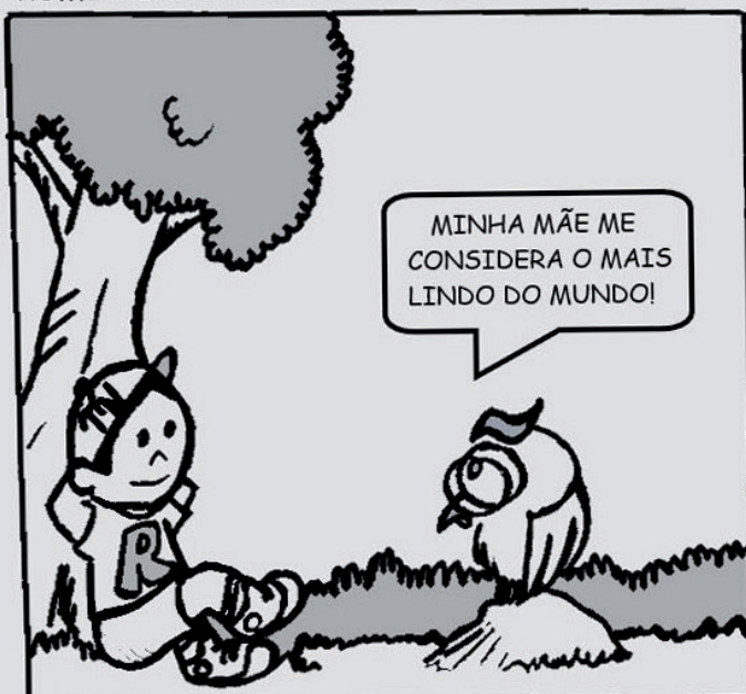
ROMEIRINHO E A CORUJA - Maurício Cavalheiro

Romeirinho brinca com o sentido literal e figurado das palavras. Percebeu? Use a criatividade e pinte os quadrinhos