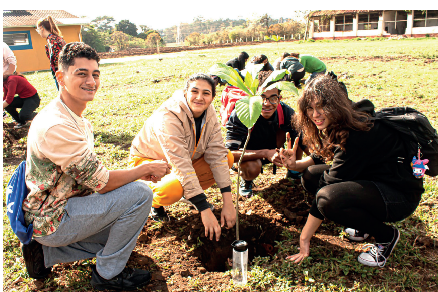
O projeto "Frutos do Amanhã" quer conscientizar seus alunos quanto ao futuro do meio ambiente