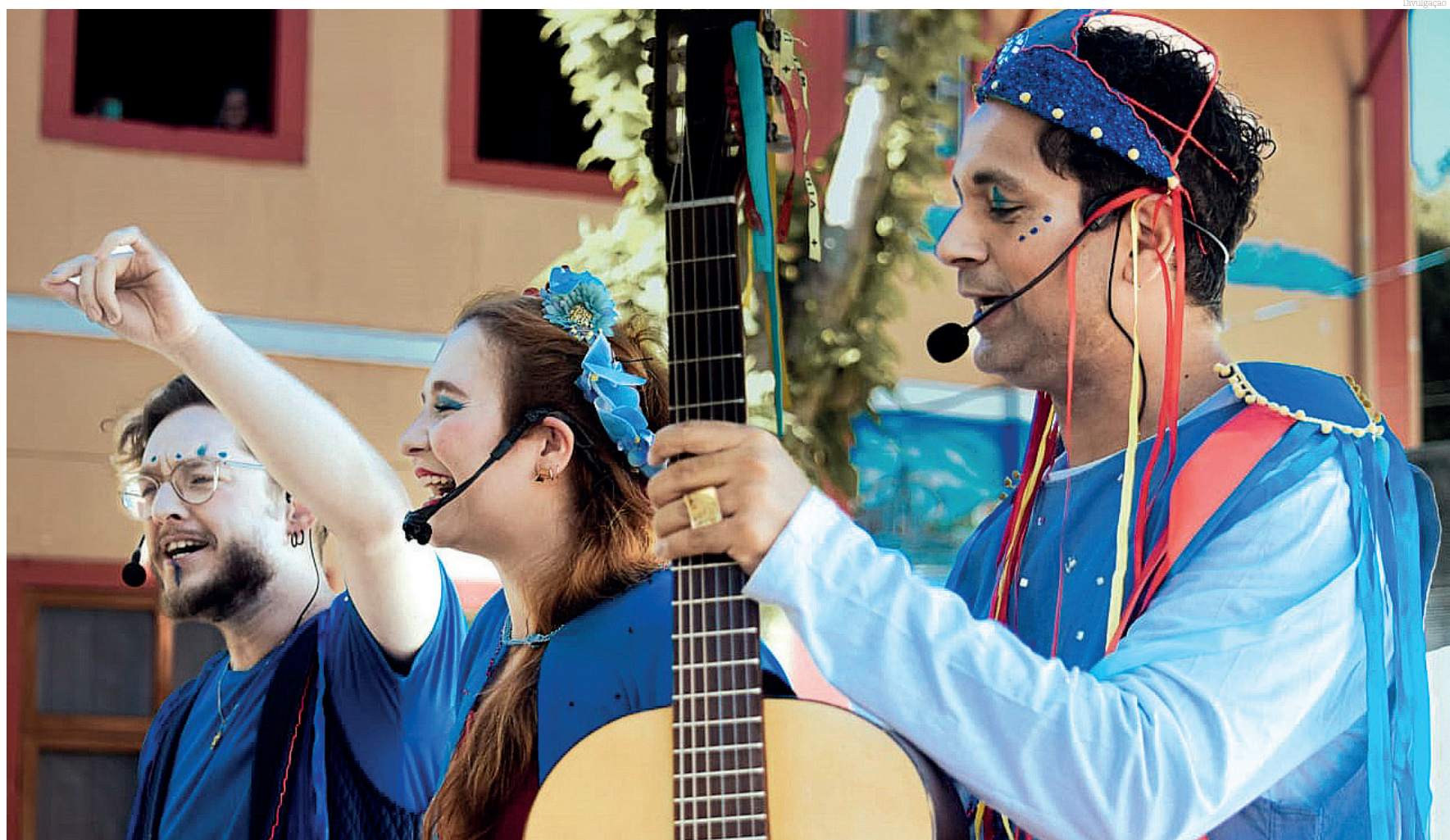
O 'Teatro nos Parques' comemora 15 anos e se apresenta em Pinda com muitas atrações