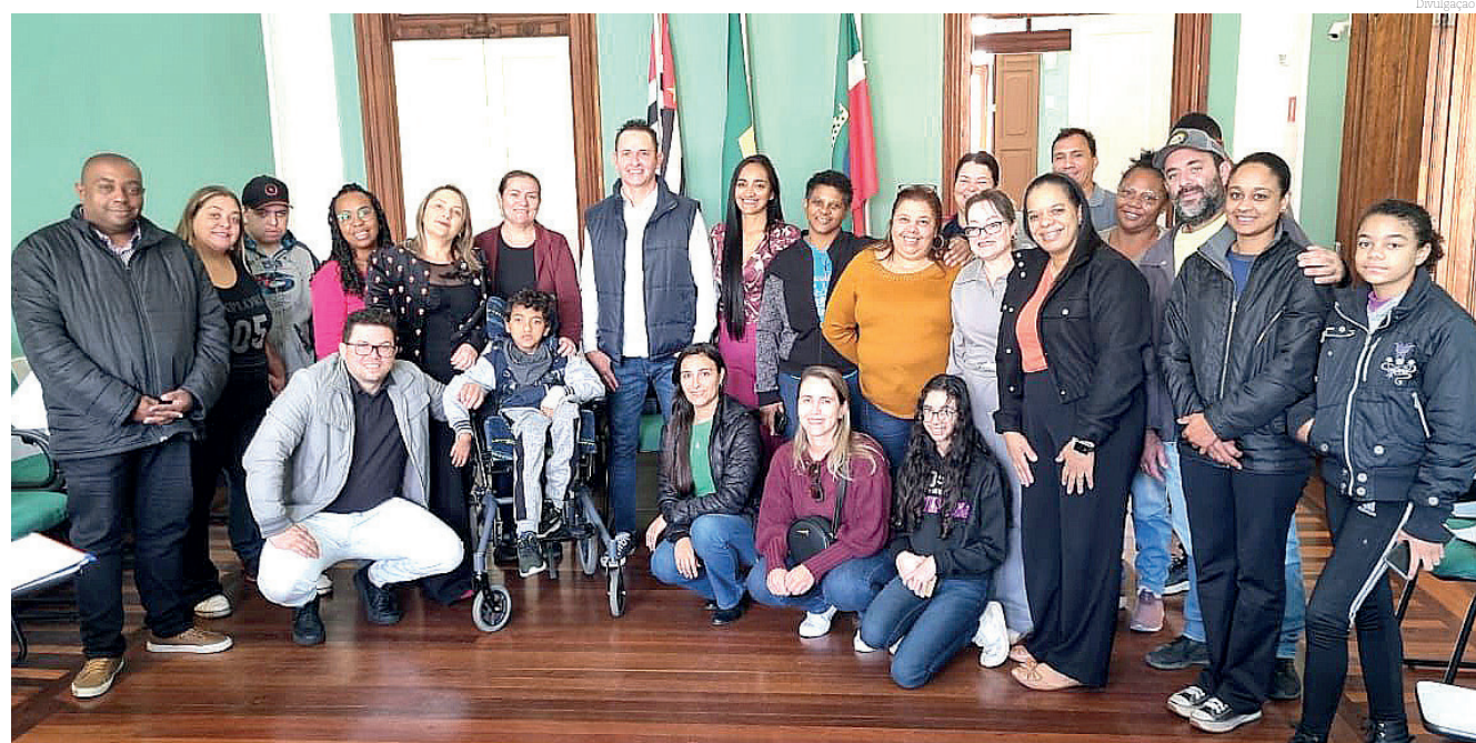
Uma reunião entre os organizadores da Feira da Fraternidade foi realizada para discutir detalhes

Tradicional em nossa cidade, a Feira da Fraternidade estará acontecendo em 46ª edição na sede da entidade, entre os dias 13 e 15 de setembro.