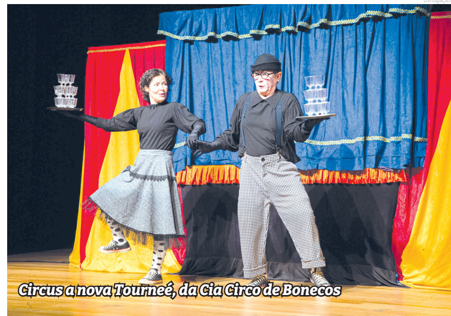
Circus a nova Tournée, da Cia Circo de Bonecos