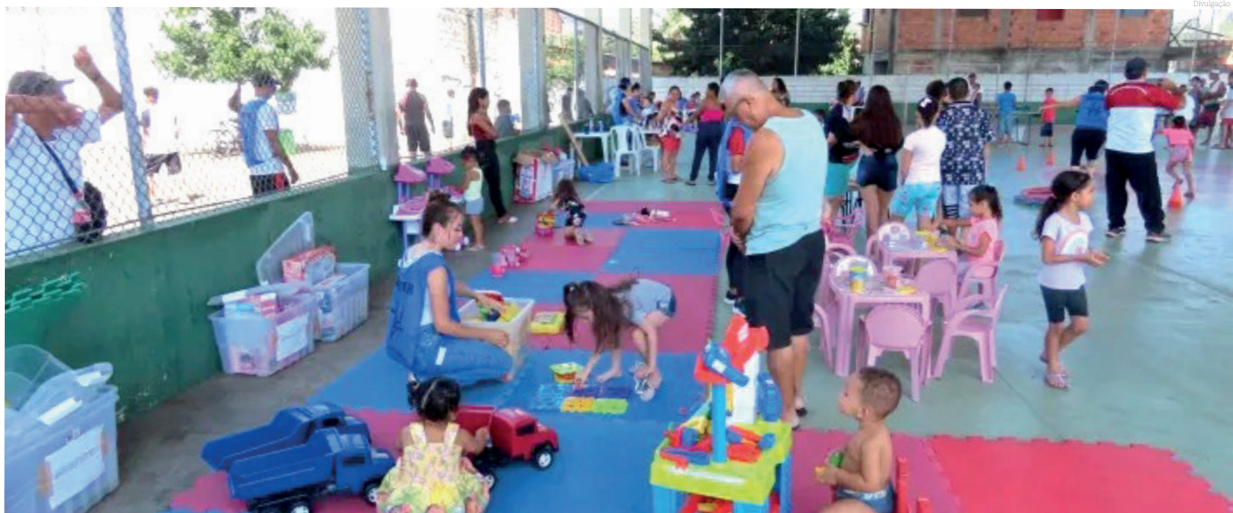
São muitas as atividades para proporcionar o lazer e entretenimento à todos que participam do 'Rua de Lazer'

O projeto 'Rua de Lazer' é uma excelente oportunidade para os moradores de Pindamonhangaba aproveitarem momentos de descontração e interação social em um ambiente seguro e acolhedor.