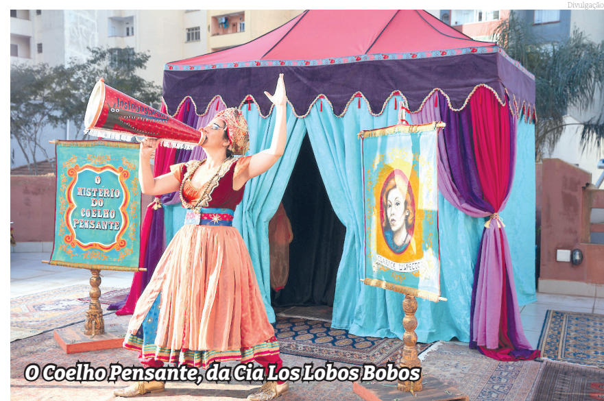
O Coelho Pensante, da Cia Los Lobos Bobos