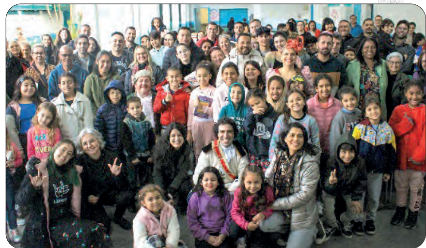
Projeto que leva espetáculos de ópera para crianças e adolescentes em escolas da rede pública está na 11ª edição e se reafirma como estímulo a novas perspectivas de vida aos jovens