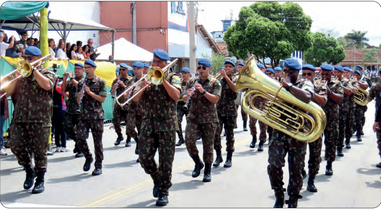
Diversas instituições já confirmaram presença nos desfiles, incluindo o Exército Brasileiro, que promete ser o ponto alto

* Link para inscrição: https://forms.gle/eyznyjK7i633dGZs6