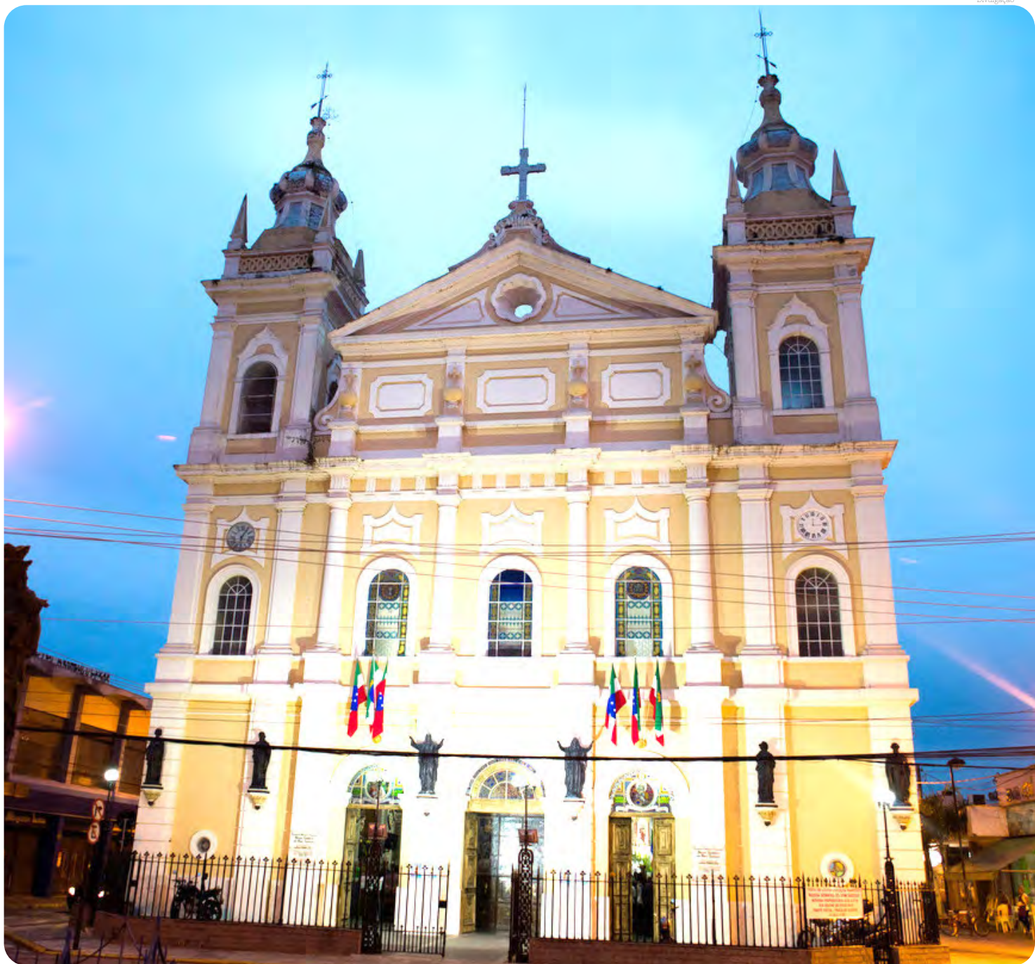
A novena litúrgica contará com missas diariamente no Santuário Nossa Bom Sucesso (Igreja Matriz – foto), sempre às 19h30 durante a semana e às 18h aos sábados e domingos