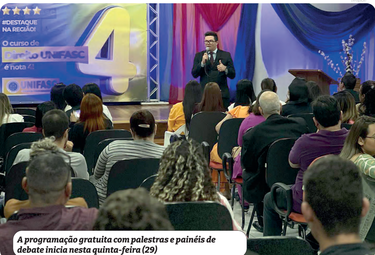
A programação gratuita com palestras e painéis de debate inicia nesta quinta-feira (29)