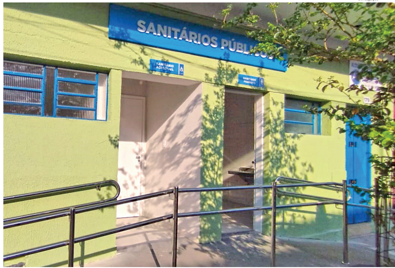
Espaço do mercado recentemente também recebeu a cobertura do Camelódromo Municipal