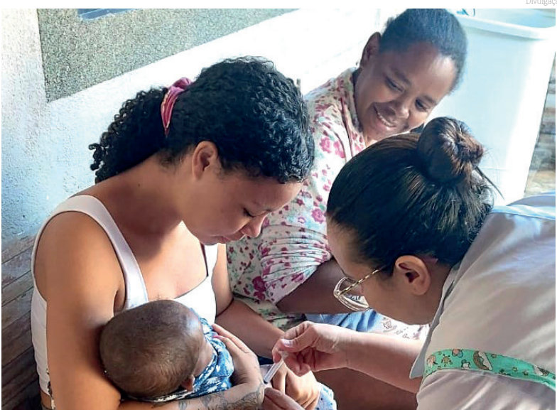
O levantamento foi uma determinação do Ministério da Saúde, para avaliar a campanha contra poliomielite, que aconteceu em maio e junho

No total foram atendidas 289 pessoas, por equipes da sala de vacina das Unidades Básicas de Saúde do município.