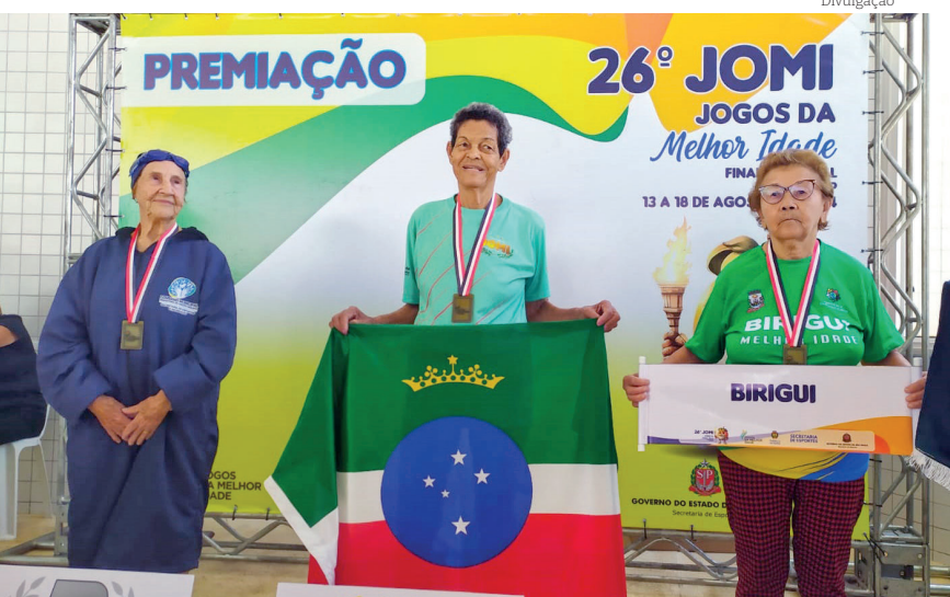
Pindamonhangaba no lugar mais alto do pódio em Itatiba