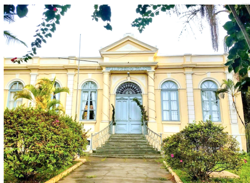
O Pujol é lugar de muitas histórias

Em 1909, um fato curioso marca o sucesso do trabalho