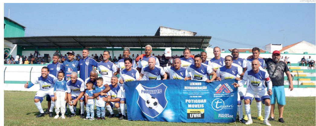
Equipe do Potiguar - campeão do Cinquentão 2024

Ferroviária e Potiguar fizeram, no domingo (18), a grande final do futebol amador Sênior 50. Os dois times entraram em campo decididos a levar o título de 2024.