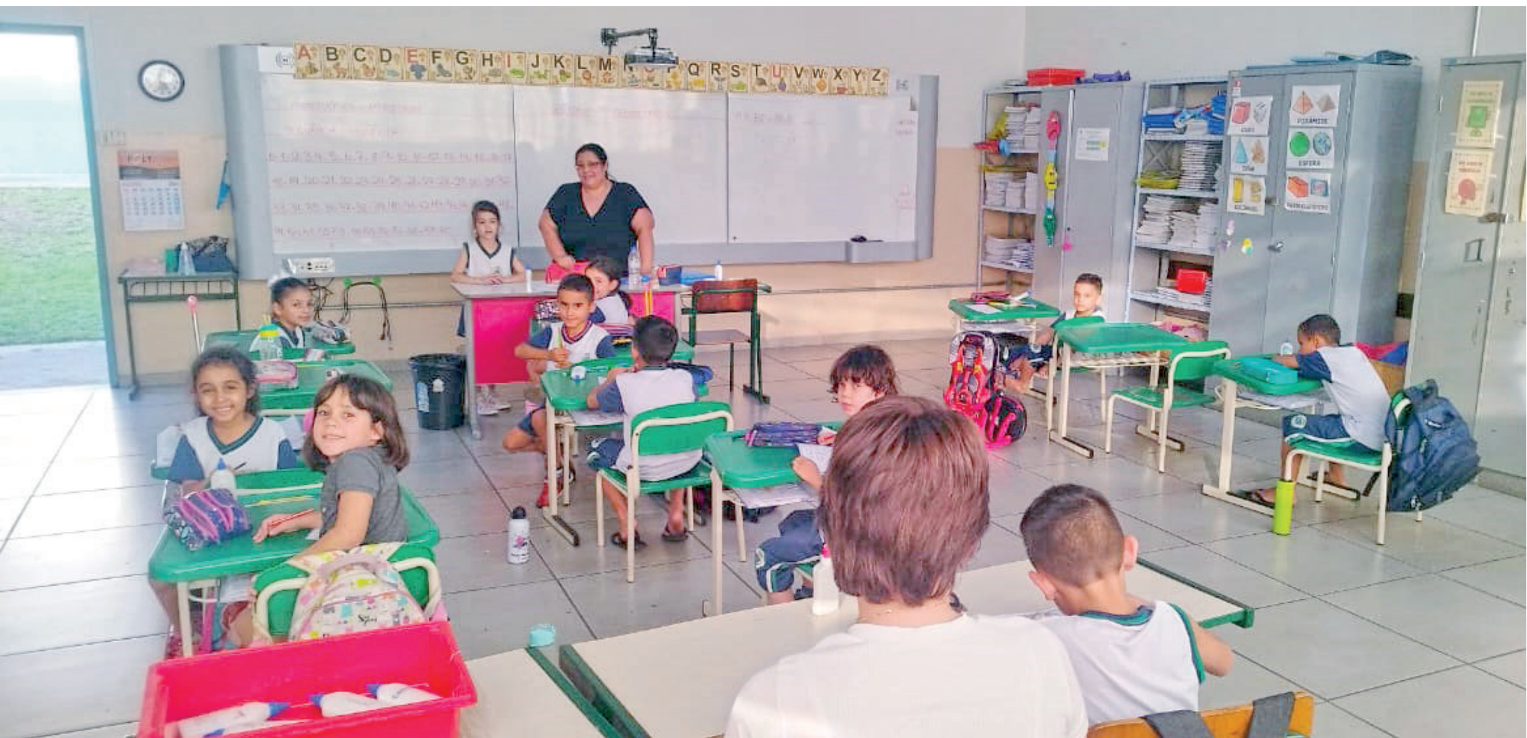
A Escola Municipal Maria Aparecida Arantes Vasques (Mombaça) foi a que obteve a maior média entre as 41 escolas da rede municipal, atingindo 7,6 de pontuação