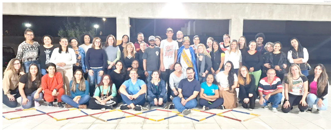
Grupo de educadores durante a formação especial

Com cuidado e responsabilidade, a atividade física é uma grande aliada na melhora das qualidade de vida de todos, inclusive da população da melhor idade!