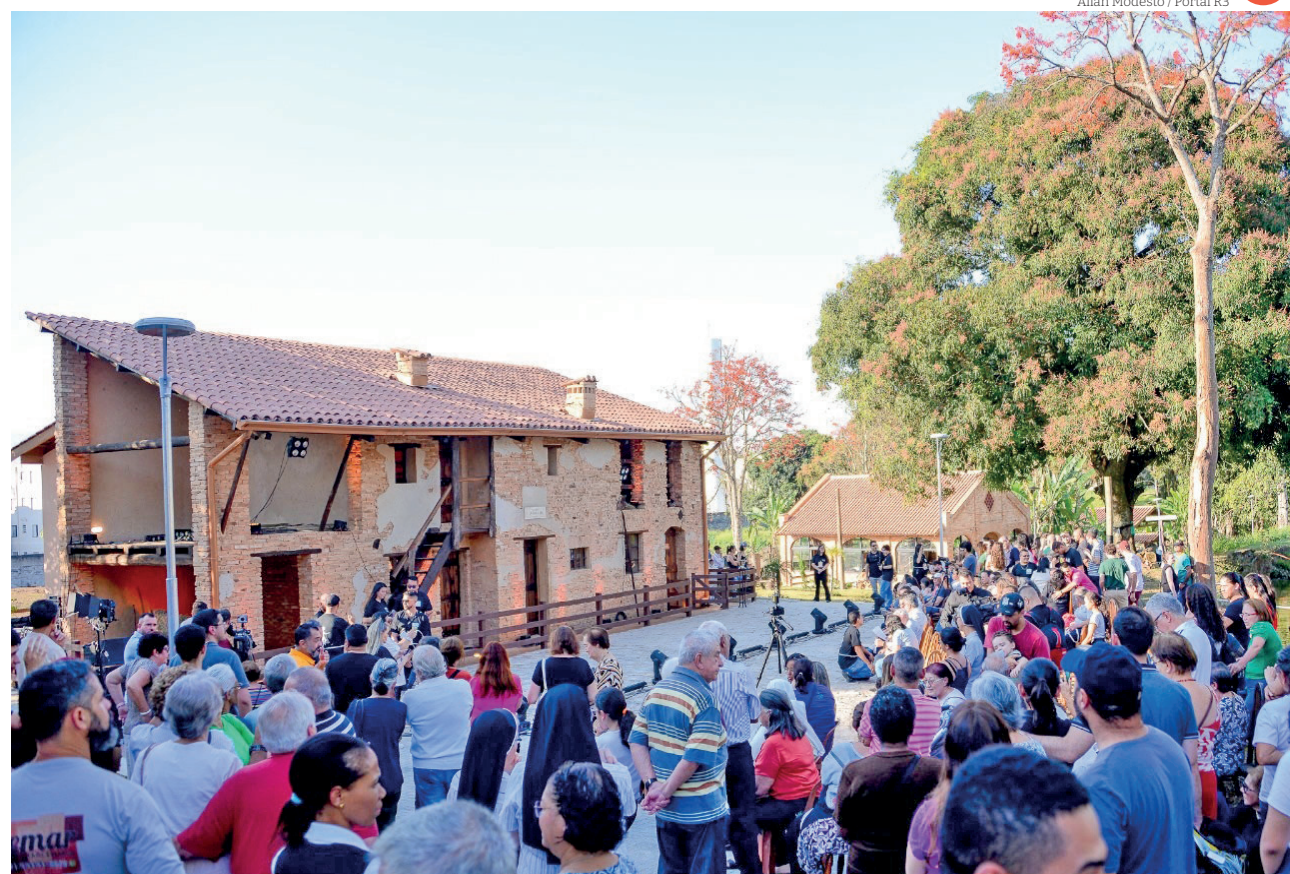
Cada detalhe da construção foi tratado com extremo cuidado em relação à casa original