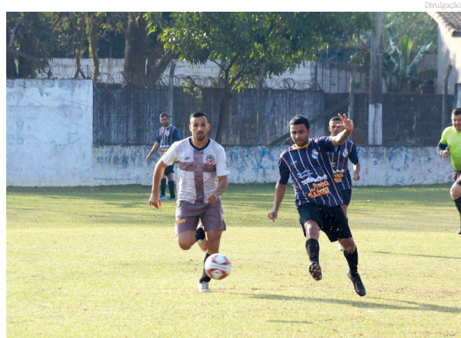
Futebol da cidade em momentos de definições

Já no SUB 15 primeira rodada das quartas de finais, Paulista foi goleado pelo FFDEF por 4x0, Minicraque foi derrotado pelo Gerizim por 3x2, Tipês perdeu para o Fluminense por 2x0 e, fechando, Jardim Rezende ganhou de 3x1