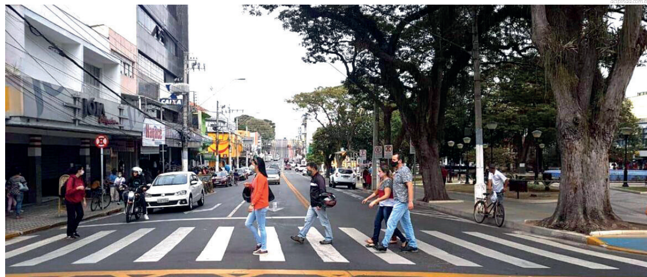
O comércio de Pinda também prevê um bom movimento no próximo domingo

Novas empresas também podem se associar à ACIP pelo aplicativo da entidade ou ainda pelo telefone 3644-7100, obtendo mais informações.