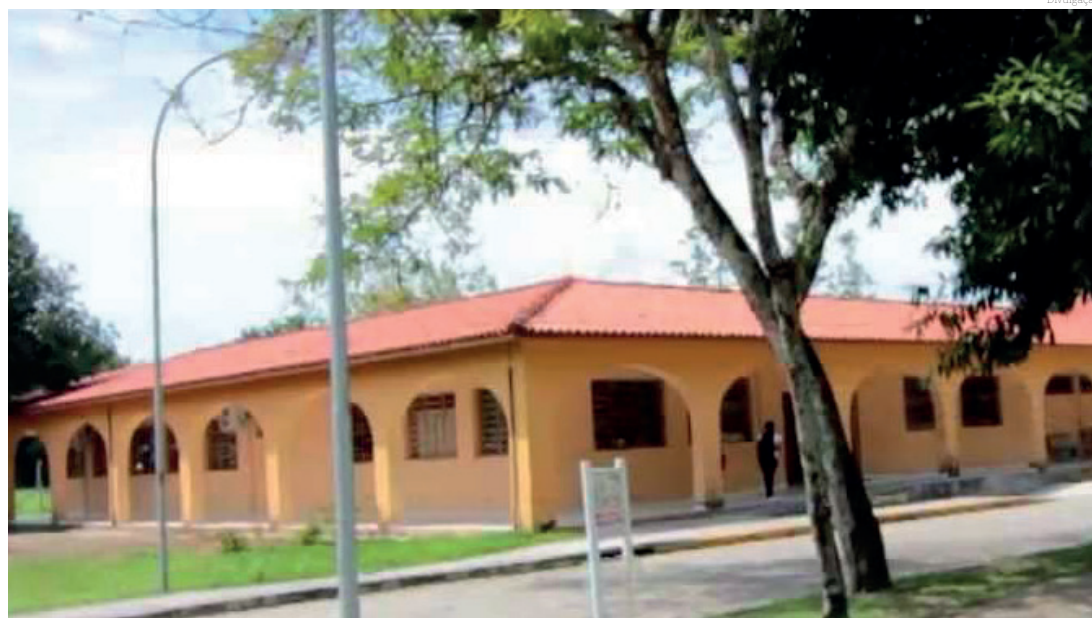
A vaga é para lecionar a disciplina de Siderurgia, no curso de Processos Metalúrgicos

Mais informações no site da instituição.