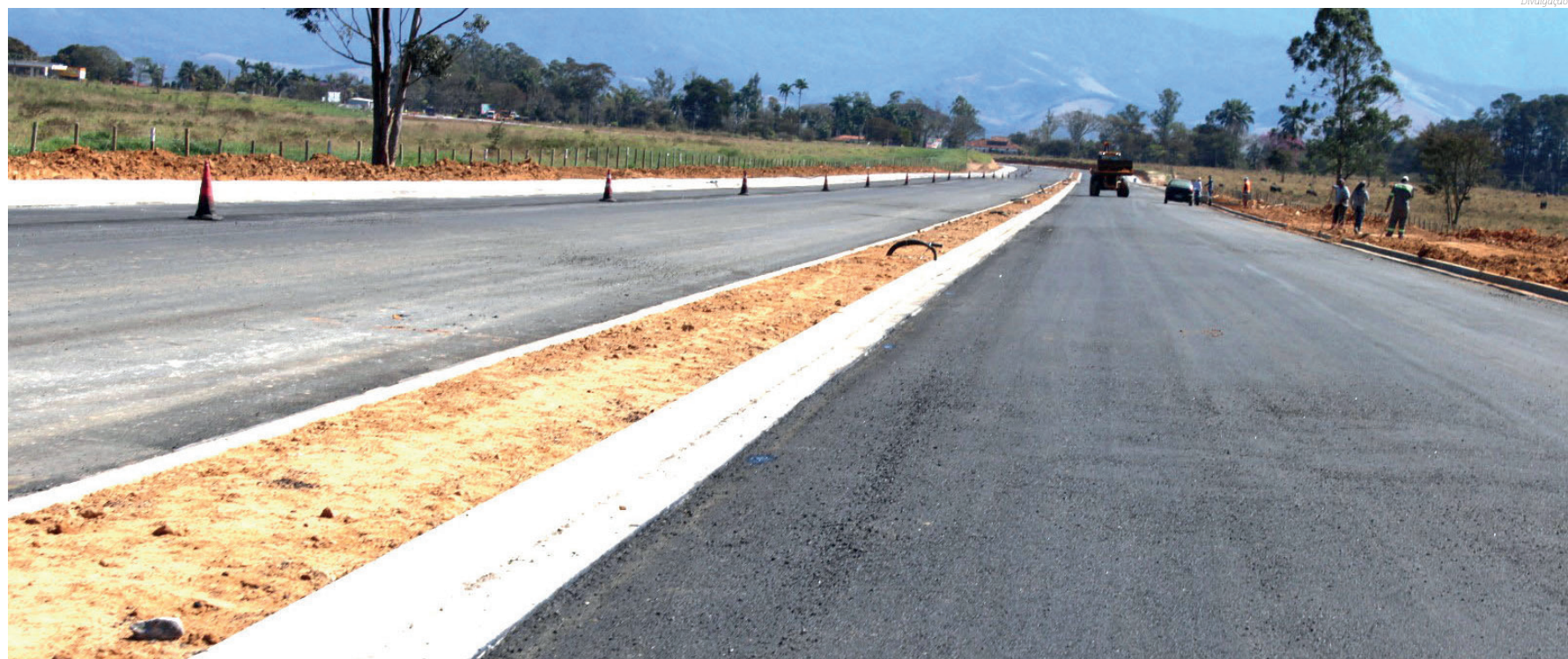
Obras da via estrutural chegam a 45% nesta semana

Outra novidade da via estrutural é a construção do viaduto sobre os trilhos da linha férrea na região da Novelis, o que deve ter início entre o fim de setembro e início de outubro. De acordo com o contrato da MRS com o Governo Federal, o viaduto deve ser entregue até julho de 2025.