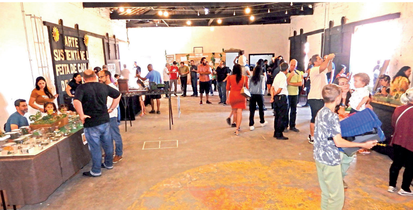
Evento aconteceu no último sábado, no Armazém da Lagoa, e reuniu diversos apaixonados por este hobby