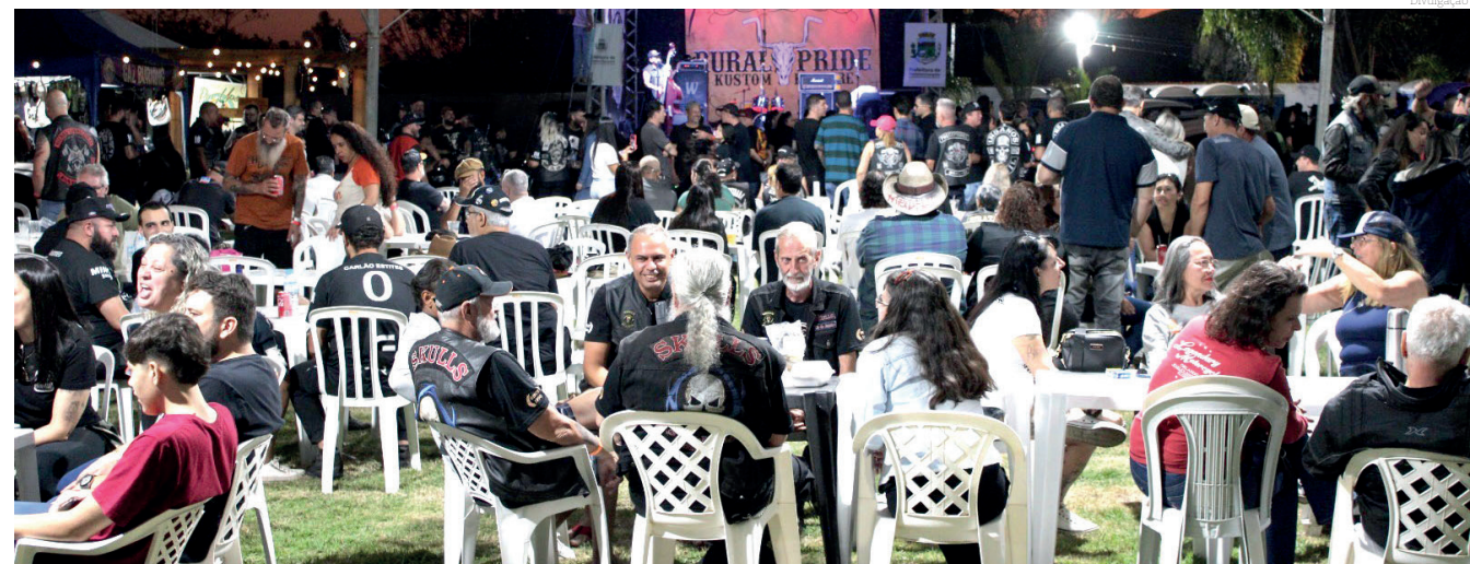
O Rural Pride trouxe uma programação diversificada para o público presente

O domingo, 4 de agosto, seguiu o mesmo ritmo, com a abertura dos portões e início da corrida de arena às 10h. A banda Caverna se apresentou ao meio-dia, seguida pela Bellator às 15h. O evento foi encerrado com chave de ouro pela banda A Tropa, que subiu ao palco às 18h.