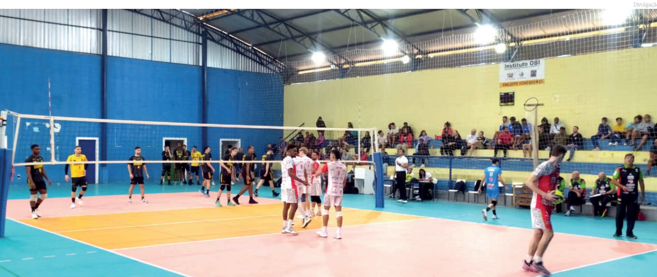
O objetivo é contribuir para a renovação do voleibol brasileiro, com o surgimento de novos atletas para as equipes de alto rendimento

O projeto esportivo busca a renovação do voleibol brasileiro. A equipe, agora com sede em Pindamonhangaba, possui dezenas de parceiros e, nas temporadas 2022 e 2023, conquistou o vice-campeonato paulista masculino Sub-21. A equipe de base colabora diretamente com o fortalecimento e com a representatividade do esporte no Vale do Paraíba, revelando atletas para os times de alto rendimento, bem como servindo de exemplo para as crianças assistidas pelo projeto social.