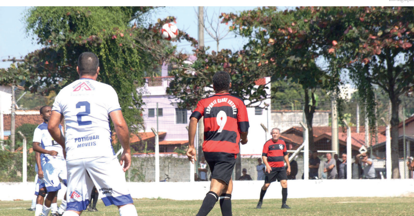
Um dos lances das partidas do fim de semana

No domingo (04), a cidade conheceu seus finalistas do Campeonato Sênior 50