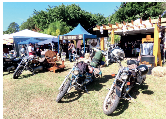
O Hotel Fazenda Pé da Serra recebeu cerca de 7 mil pessoas durante o evento