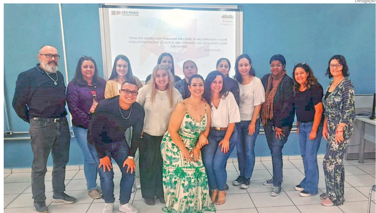
Equipe de Educação Especial se organizou para receber os professores especializados