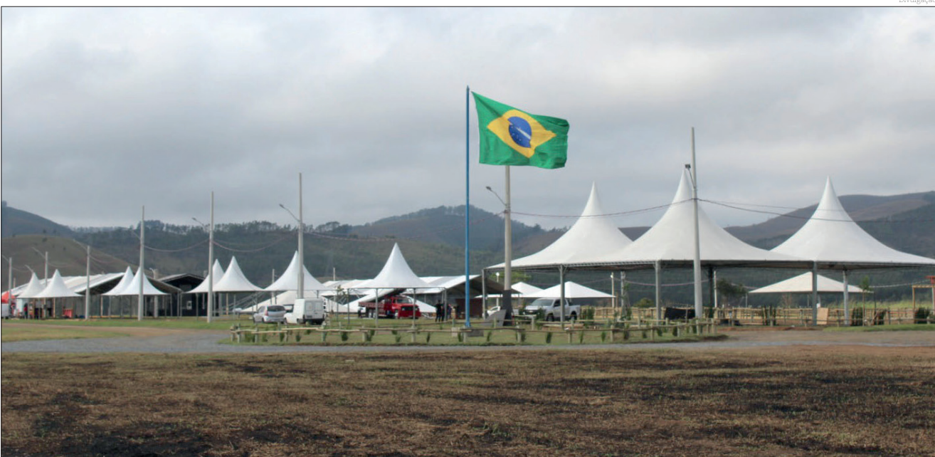
Tudo pronto para a abertura da Expopinda nesta quinta-feira, um evento que terá...