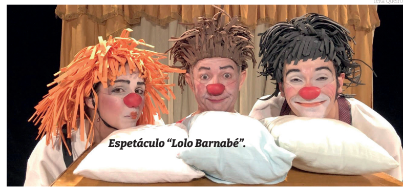
Espectáculo "Lolo Barnabé".

Peças teatrais infantis são gratuitas e acontecem aos domingos, a partir das 16h30