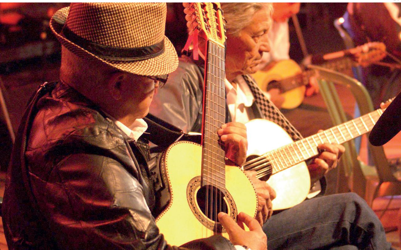
O Prêmio busca o fortalecimento da identidade e ancestralidade do povo brasileiro

Além da entrega dos certificados, a programação especial inclui a Premiação Paulo Gustavo, show musical, palestra e roda de conversa.