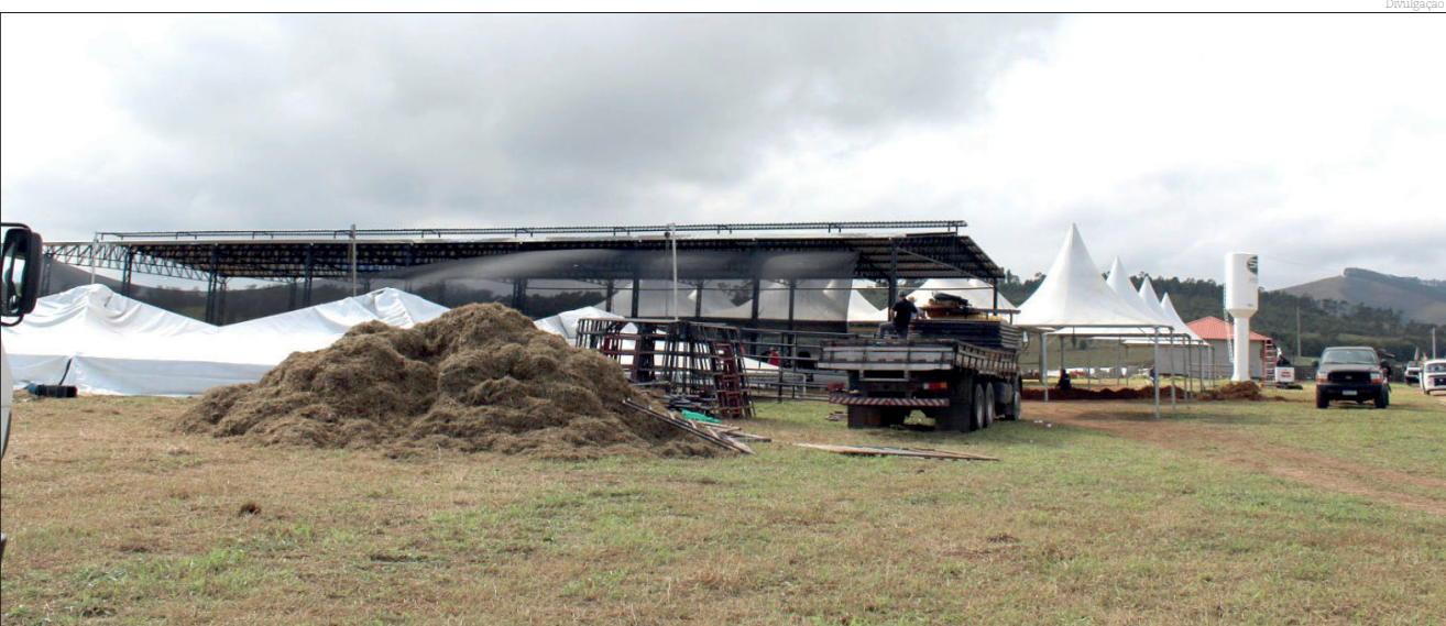
exposições e muitas atividades para os produtores de toda a região do vale do Paraíba