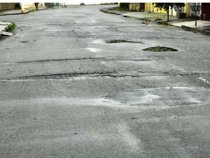
TRECHO DA RUA ALFREDO MOLINARI, NO RESIDENCIAL ANDRADE, COM BURACOS