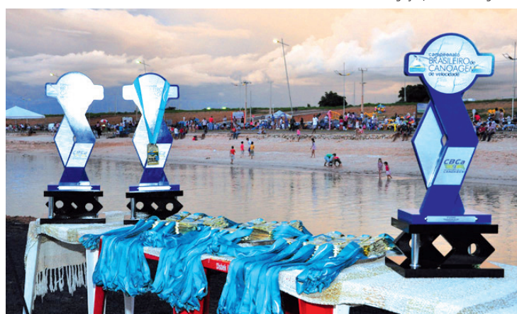
Canoístas pindenses fazem bonito em Mato Grosso

Foi disputado no último final de semana, entre os dias 14 e 16, o Campeonato Brasileiro de Canoagem Velocidade 2012, válido pelas categorias: Infantil, Menor, Cadete, Júnior, Sênior, Master e Paracanoagem. A competição foi realizada no município de Primavera do Leste, no Estado do Mato Grosso, e reuniu mais de 350 competidores. Representada pelo total de 37 atletas da Acanompi (Associação de Canoagem Maggi de Pindamonhangaba), a Princesa do Norte volta para a casa consagrada, com o vice-campeonato garantido. Durante os três dias de competição, foram disputadas 224 provas, sendo 102 entre as finais A e B. A delegação de Pindamonhangaba somou 156 pontos, ficando atrás apenas da Apen - Associação Pirajuense de Esportes Náuticos, que