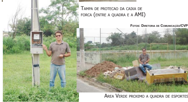
TAMPA DE PROTEÇÃO DA CAIXA DE FORÇA (ENTRE A QUADRA E A AMI)