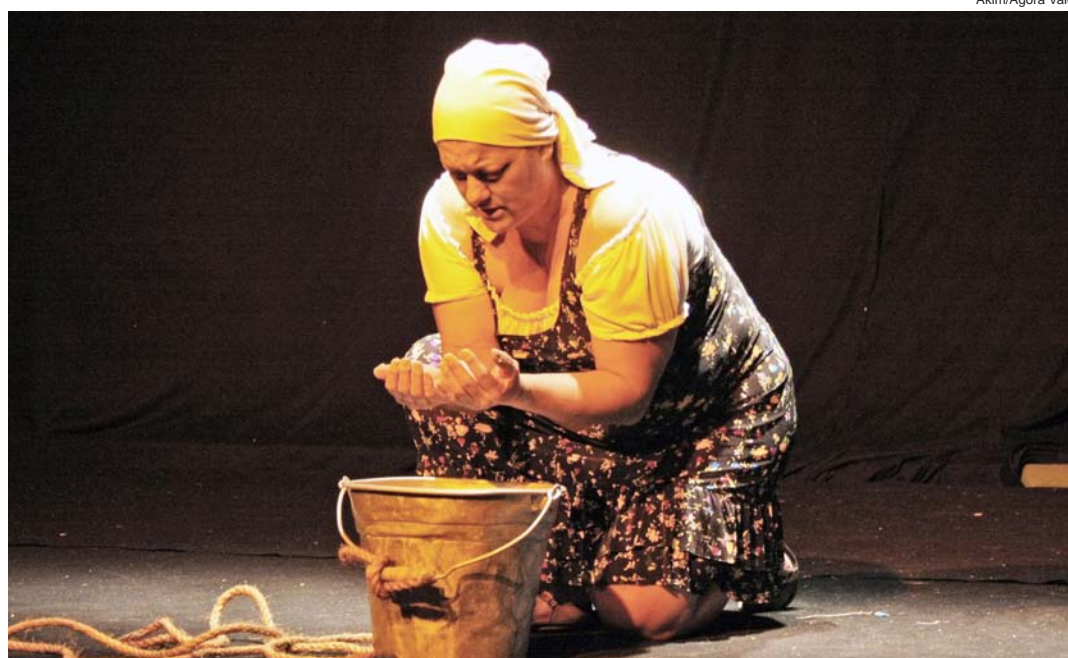
O Centro Comunitário do Bosque sediou a apresentação do VI Festipoema

Já quem passou pela praça Monsenhor Mar-