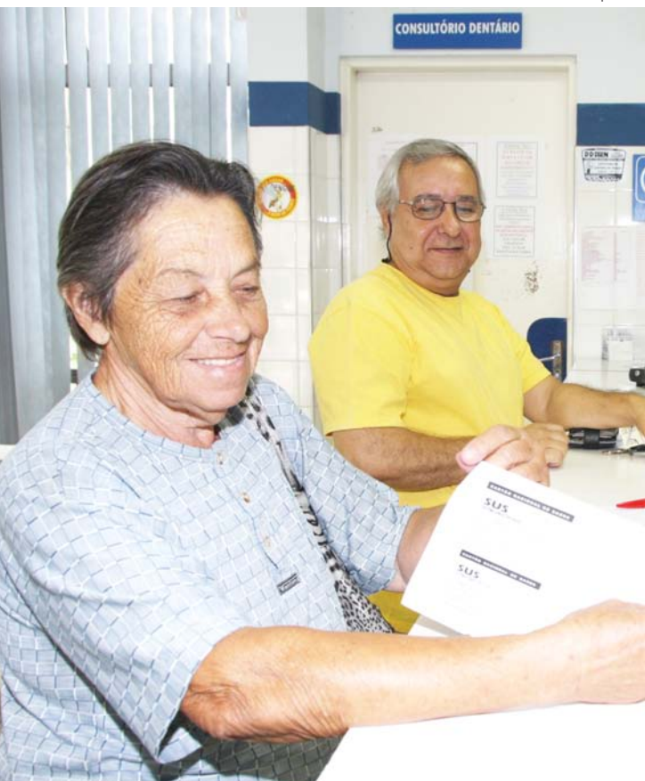
Moradora exhibe cartão do SUS durante cadastramento