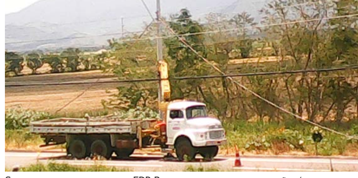
START – EMPRESA TERCEIRIZADA DA EDP BANDEIRANTE, INSTALANDO ILUMINAÇÃO PÚBLICA EM VIA DO MOMBANÇA I.