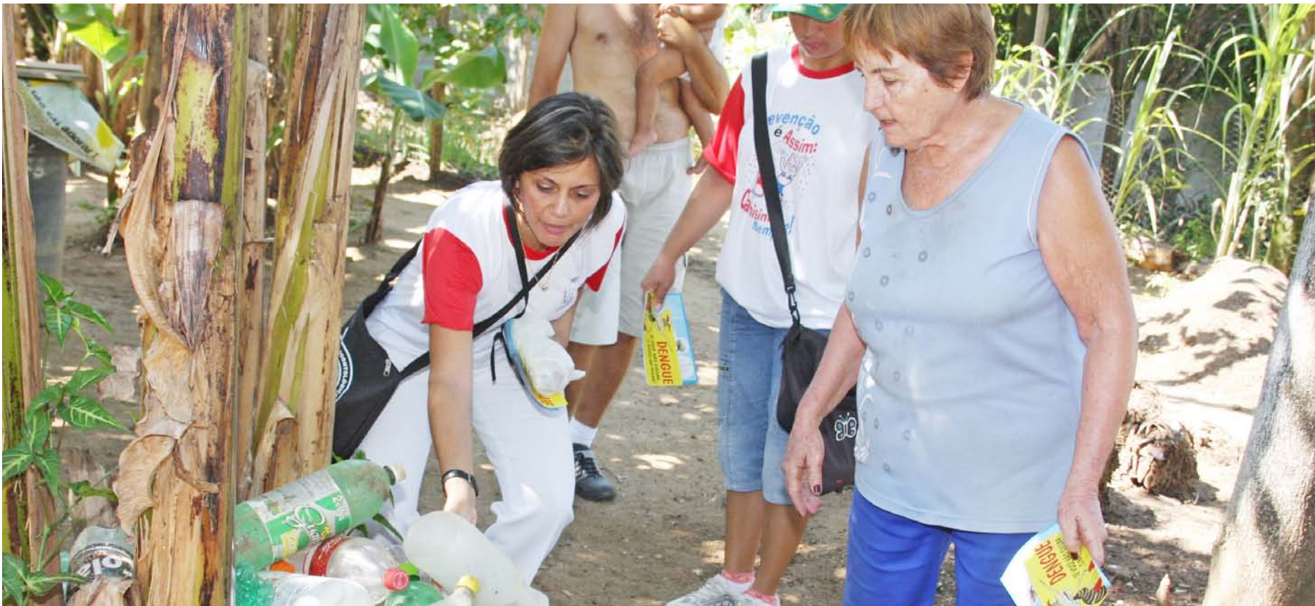
A equipe de Controles de Vetores realiza visitas de casa em casa orientando moradores sobre focos potenciais de proliferação do mosquito

Em Pindamonhangaba, a prevenção contra a dengue