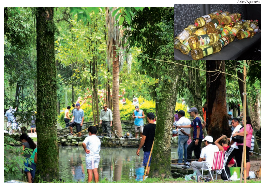
Os lagos ficaram lotados de pescadores, que doaram um litro de óleo de cozinha