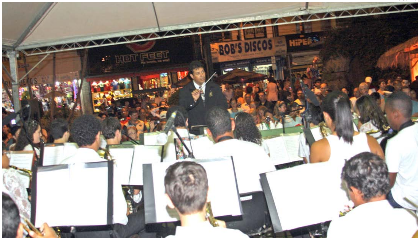
A Camerata e Banda de Aprendizes da Euterpe se apresentaram na praça Monsenhor Marcondes