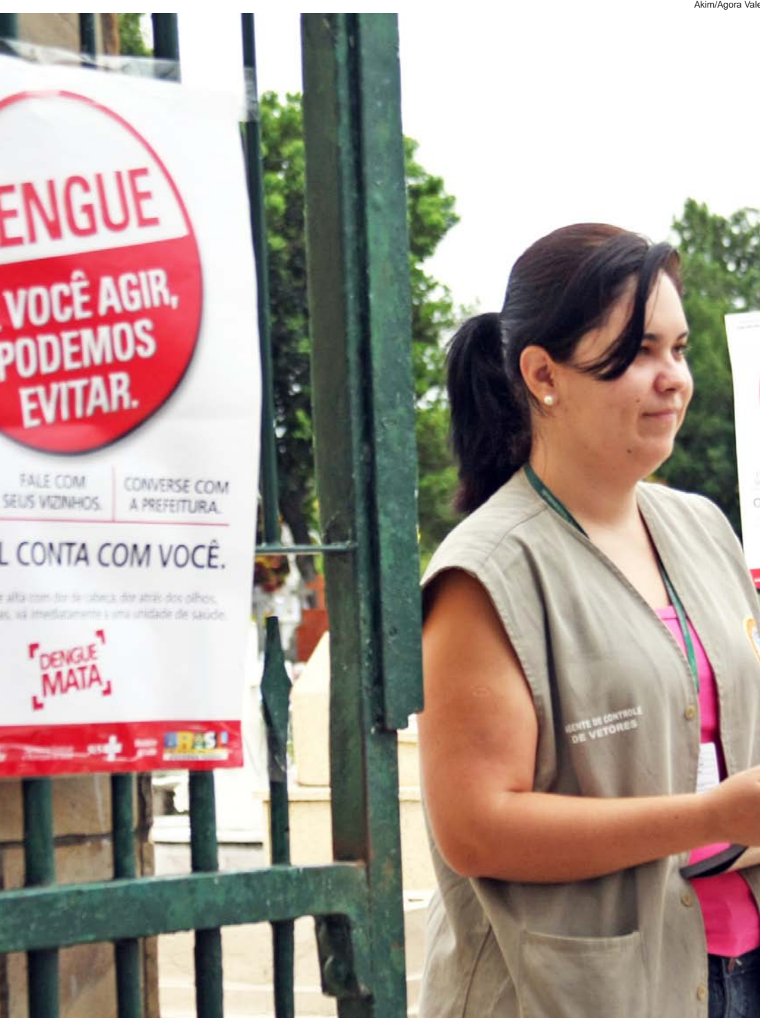
Agente orienta os munícipes sobre os perigos da dengue

Mais de 2 mil panfletos foram entregues para a população de Pinda no Dia de Finados