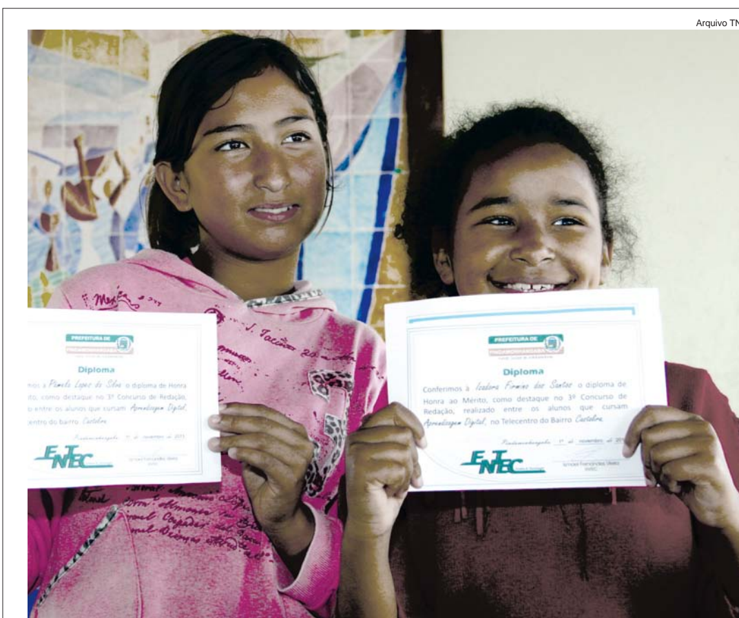
Alunas do Castolira mostram certificados de cursos realizados pelo Telecentro