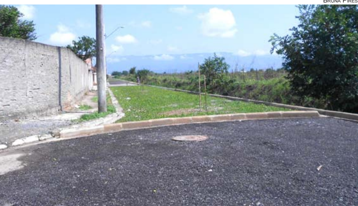
Canteiros feitos na avenida das Rosas permitem somente o tráfego de veículos do bairro

A Prefeitura de Pindamonhangaba, por meio da Subprefeitura, atendeu à reivindicação dos moradores e realizou diversas melhorias na avenida das Rosas, no Vale das Acácias, em Moreira César.