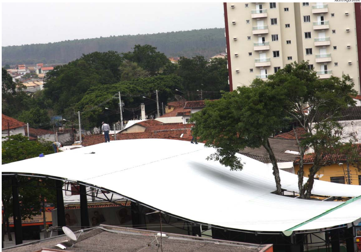
As telhas termoacústicas, com design moderno, cobrem aproximadamente 1.700m 2

A obra na avenida das Rosas foi finalizada em 90 dias.