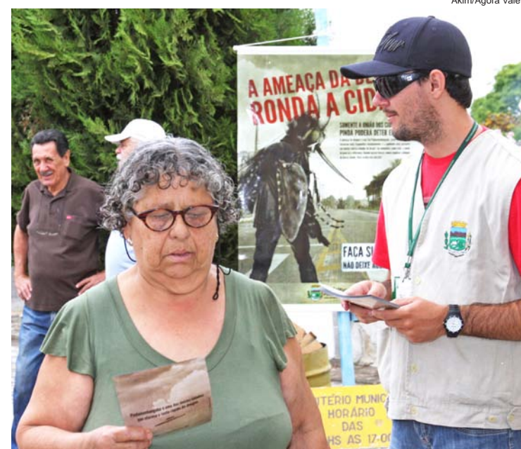
Munícipe recebe um panfleto informativo