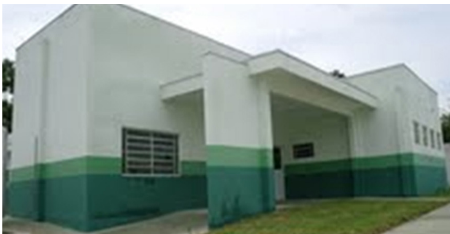
A UBS terá 340.000m 2 e contará com consultório de odontologia, dois consultórios médicos, entre outras especialidades

A unidade, que já está toda equipada e contará com uma equipe especializada, e apta a atender a população no local, será formada por: oito agentes comunitários da saúde, três auxiliares de enfermagem, auxiliar de odontologia, dentista, médico, enfermeiro e dois agentes de limpeza.