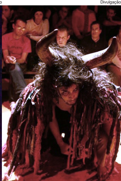
“Folia do homem diabo”