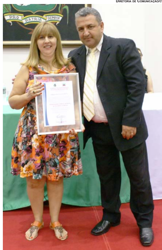
DIRETORIA DE COMUNICAÇÃO/CVP

No último dia 30 de outubro, foi realizado na Câmara Municipal, a Sessão Solene em Comemoração ao Dia dos Professores. O vereador Alexandre Faria aproveitou a oportunidade para homenagear os professores do município, na