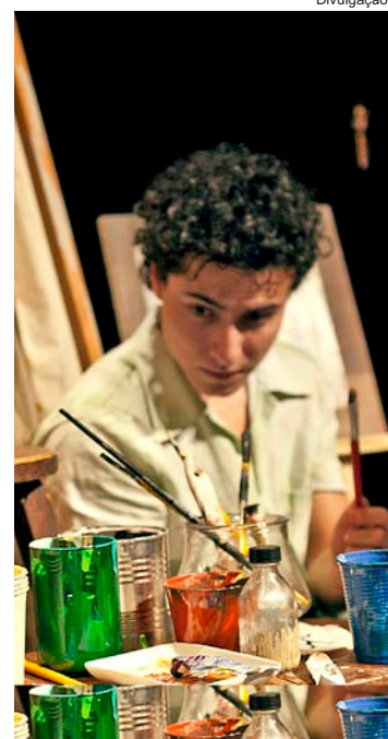
“O menino que mordeu Picasso”