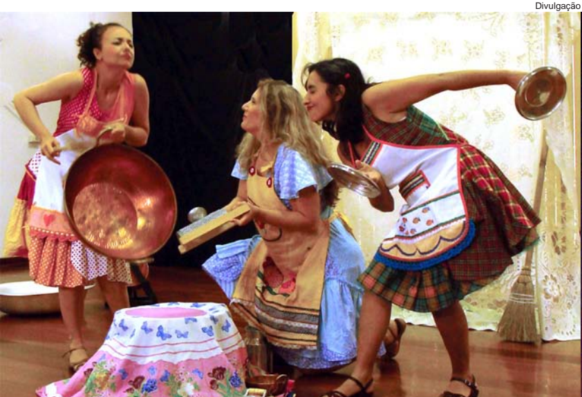
“A casa de dentro da gente”, do grupo Caixa de História