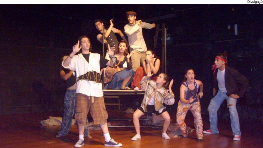
“Além da palavra”, da Cia TEP-Teatro Experimental de Pindamonhangaba