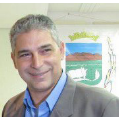
DIRETORIA DE COMUNICAÇÃO/CVP