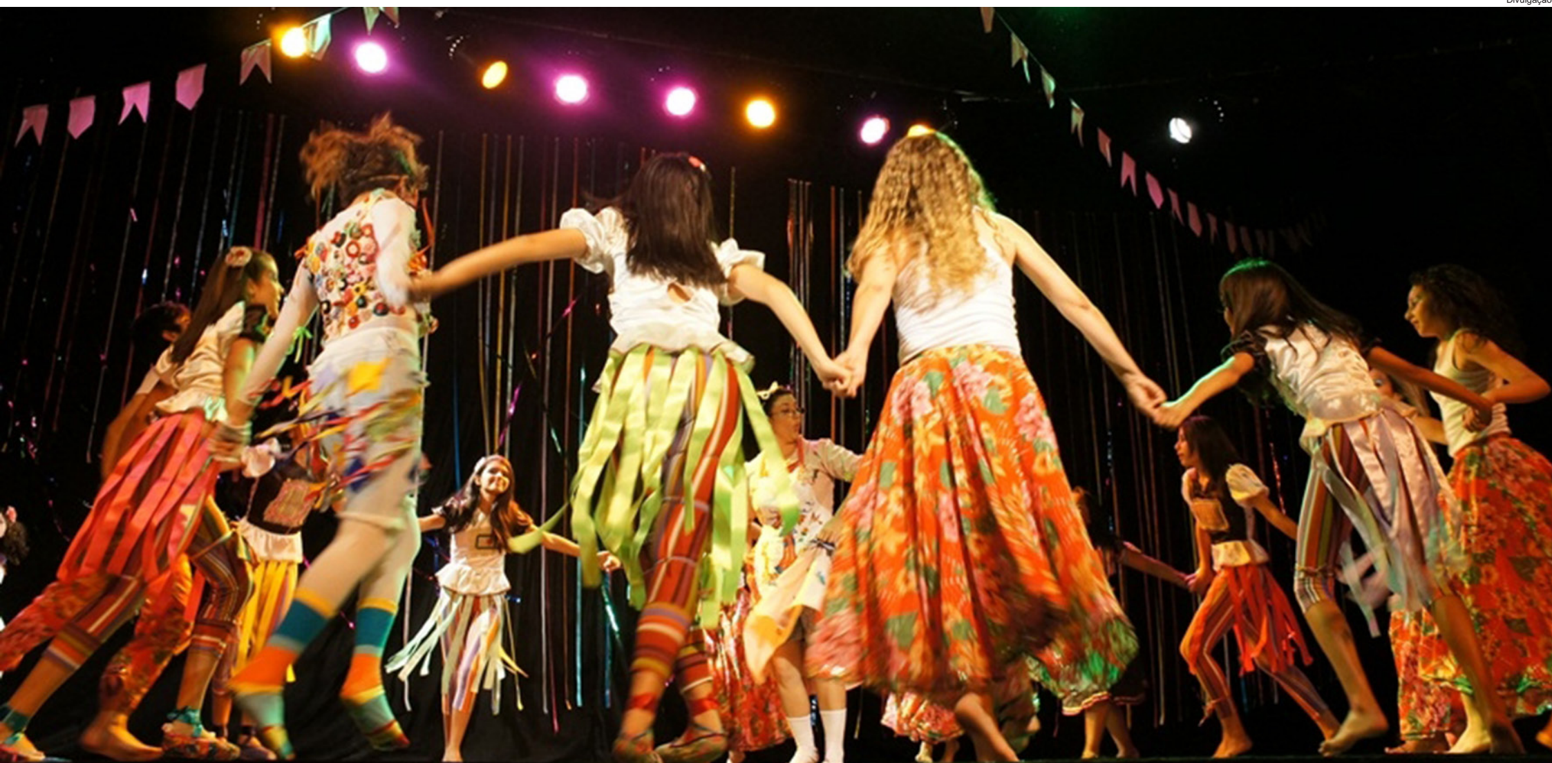
Cena do espetáculo Giselle, da Cia Cênica de Dança-Teatro Mônica Alvarenga, inscrita na categoria Espetáculo Adulto local, exclusivo para grupos de Pindamonhangaba