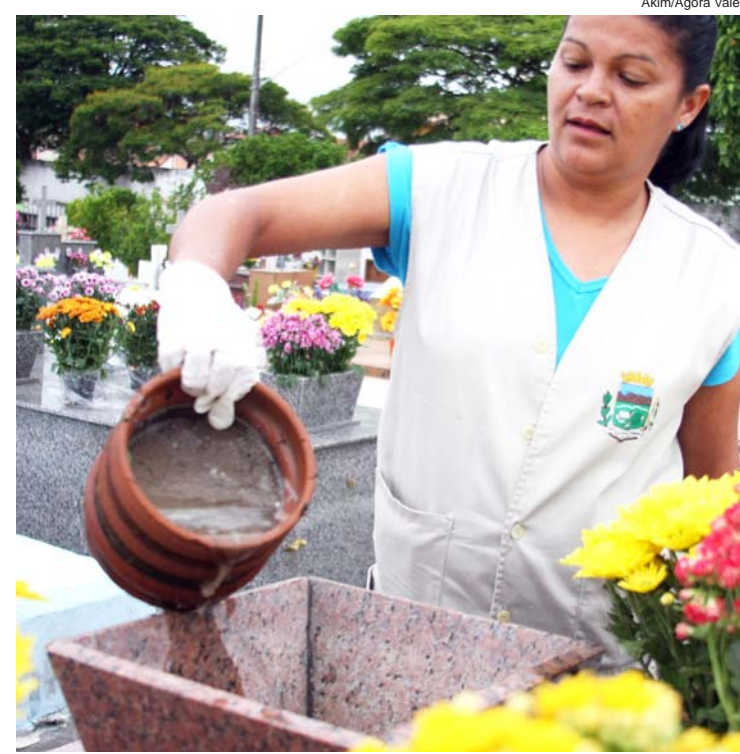
Os vasos não devem conter água

Os munícipes gostaram da iniciativa e utilizaram as orientações dos agentes nos túmulos que foram visitar. O cemitério passa por um trabalho quinzenal de monitoramento e saneamento ambiental, para evitar que o local seja um foco de transmissão da dengue e de acidentes com animais peçonhentos.