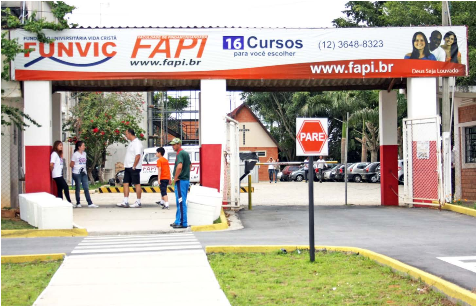
As comemorações pelo 10º aniversário da Fapi-Faculdade de Pindamonhangaba se estenderão até o mês de junho de 2013

O Fórum será realizado para o lançamento do programa de educação executiva e empresarial continuada, o "Funvic Soluções".