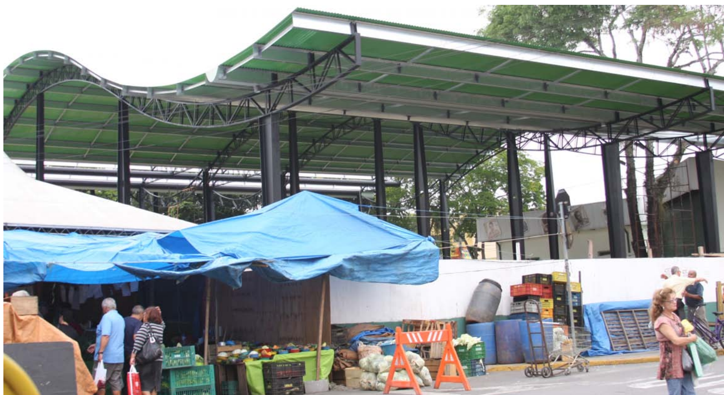
Usuários aprovaram a nova cobertura em fase final de instalação

Enquanto os trabalhos ocorrem no Parque da Cidade, o 35º Feste, tradicional festival de teatro da região, acontecerá no local. As estruturas já estão sendo montadas para o evento, que começa no domingo (11) e prossegue até o dia 25 de novembro.