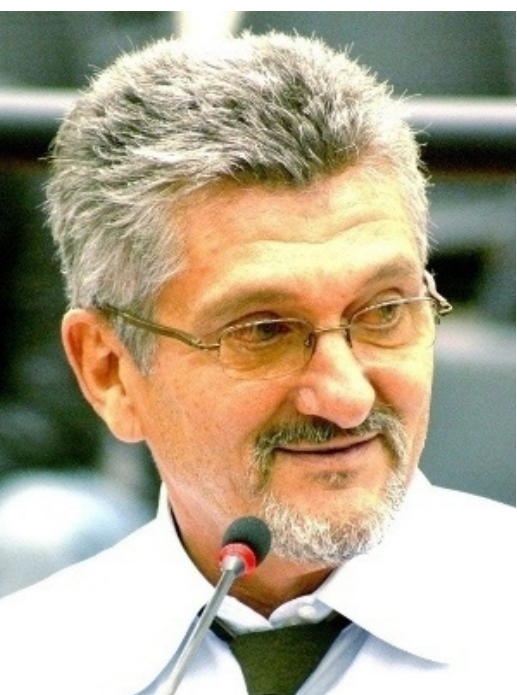
DIRETORIA DE COMUNICAÇÃO/CVP