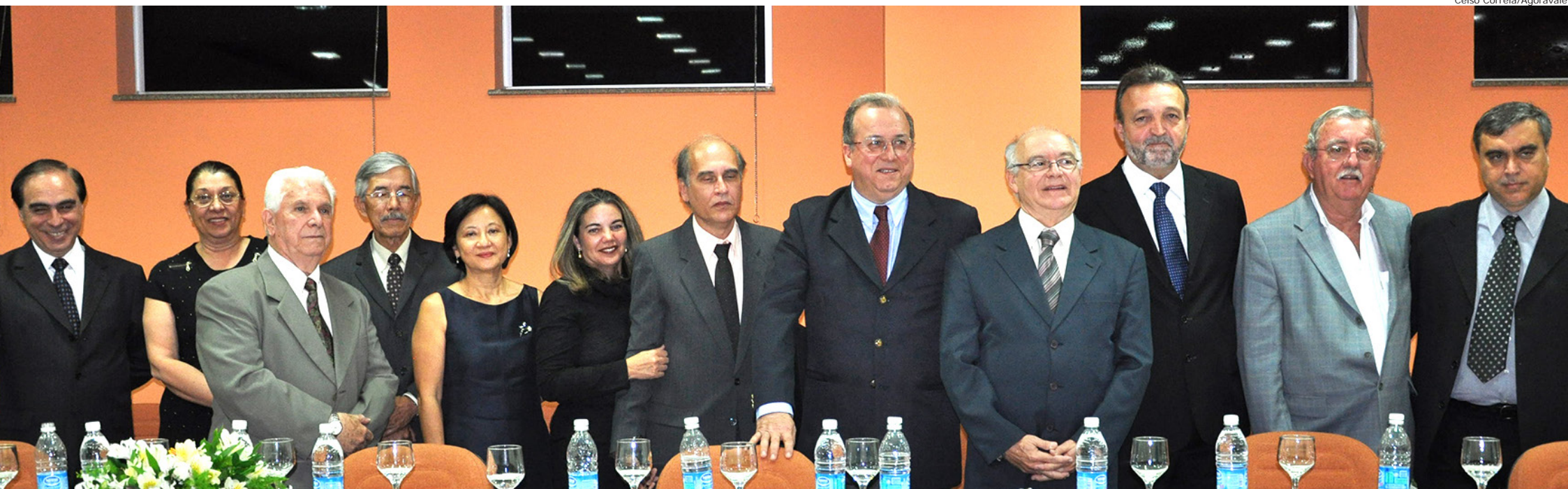
Composição da mesa de autoridades e homenageados durante evento de aniversário da importante instituição de saúde