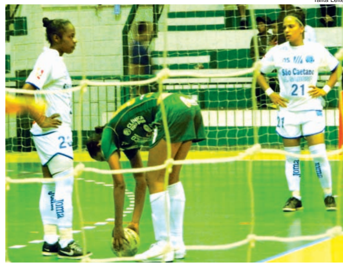
Páreo duro: Pinda pega São Caetano na semifinal