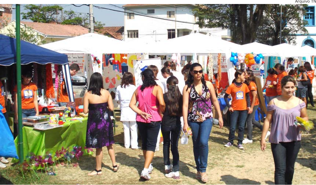
O trabalho do "Escola da Família" é reconhecido pela comunidade