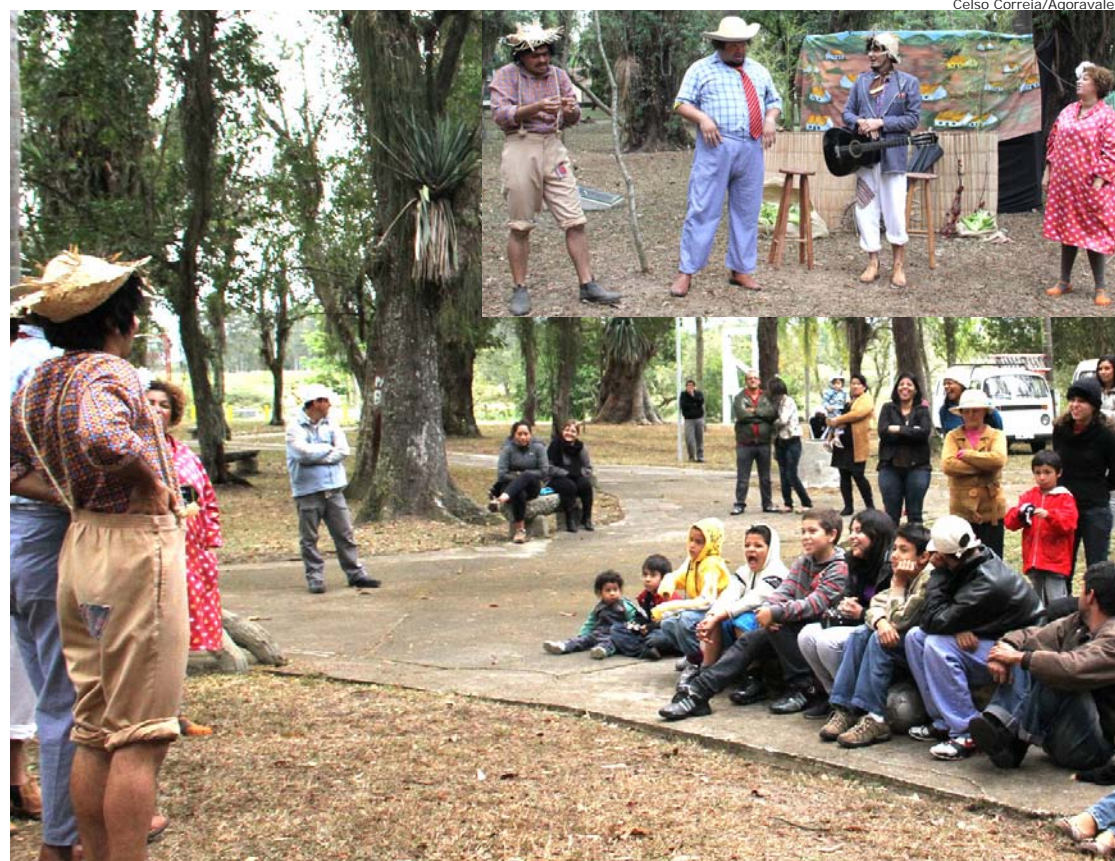
Público e atores em evento no Bosque da Princesa