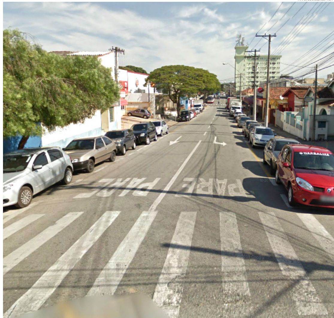
Ruas terão visual moderno

O secretário alertou que durante o andamento da obra o trânsito e as paradas de ônibus deste local poderão ser modificados, temporariamente.