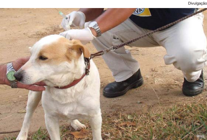
Objetivo é vacinar maior número de cães e gatos

A campanha vai até o dia 2 de setembro e acontecerá das 8 às 16h30.