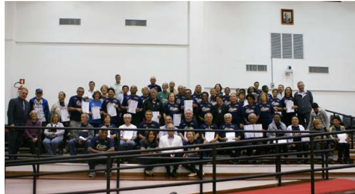
HOMENAGEADOS NA SESSÃO SOLENE DA MELHOR IDADE

Câmara de Vereadores de Pindamonhangaba lembrou da Melhor Idade, com a realização de uma Sessão Solene Comemorativa, no último dia 09, na sede do Legislativo.