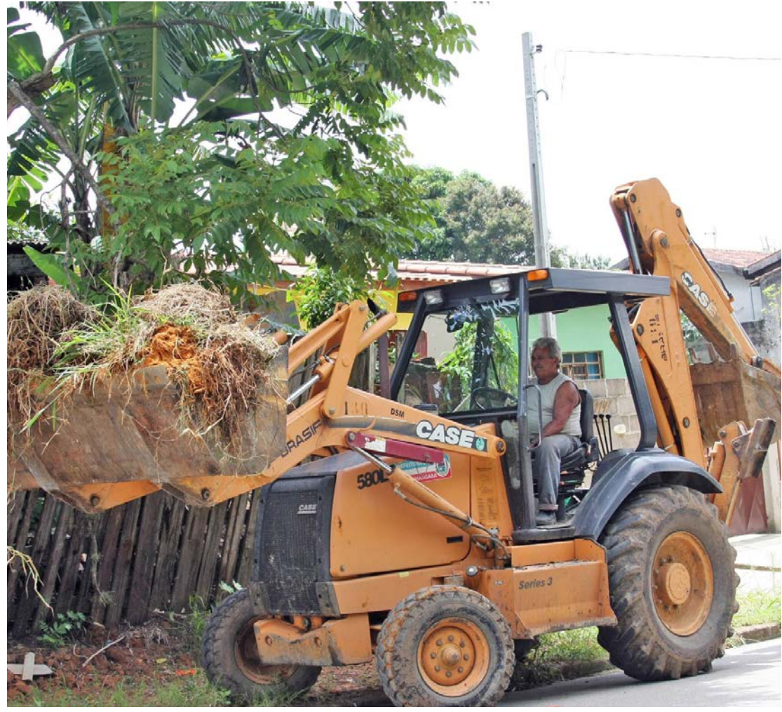
Cata-treco existe há muitos anos e ajuda a população na remoção de entulho acumulado nos quintais, evitando a proliferação do mosquito da dengue

Até quinta-feira (23), o caminhão do Cata treco irá percorrer os bairros Abílio Flores e Alto Cardoso. Após este prazo, os moradores que colocarem materiais inservíveis em frente às casas poderão ser multados.