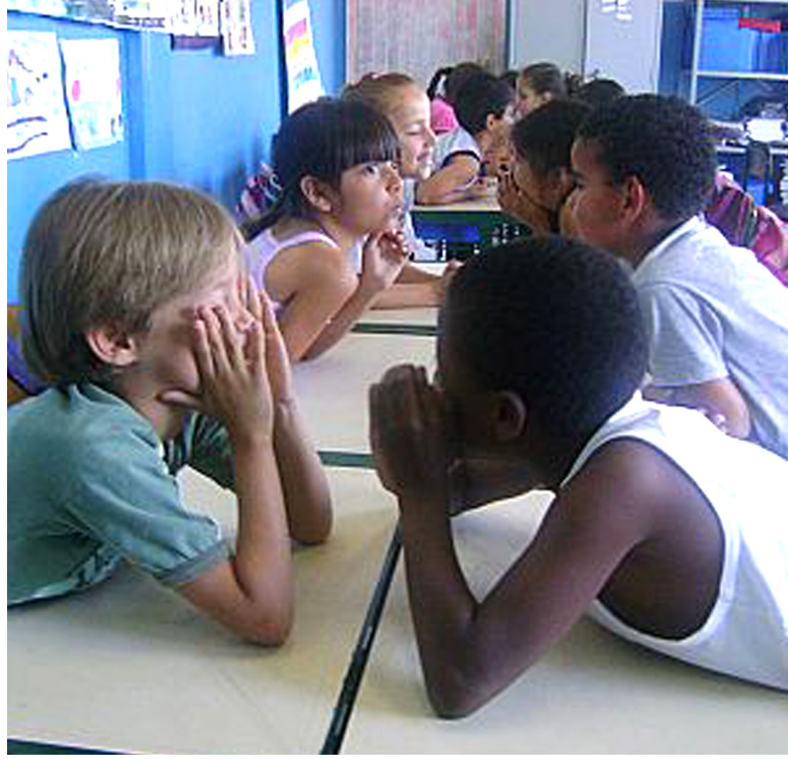
Os projetos desenvolvidos na educação têm melhorado os resultados no setor

A apresentação foi realizada pelos monitores da empresa Evoluir. O próximo encontro será no dia 17 de setembro, na Secretaria de Educação.