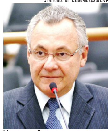
DIRETORIA DE COMUNICAÇÃO/CVP VEREADOR CAL

O vereador destaca que, em resposta ao requerimento nº 982/2012, foi informado que, “por meio do projeto ‘Pró-Infância’, do Governo Federal, o município foi contemplado com 05 unidades escolares infantis (creche tipo B), que atenderão os bairros Liberdade,