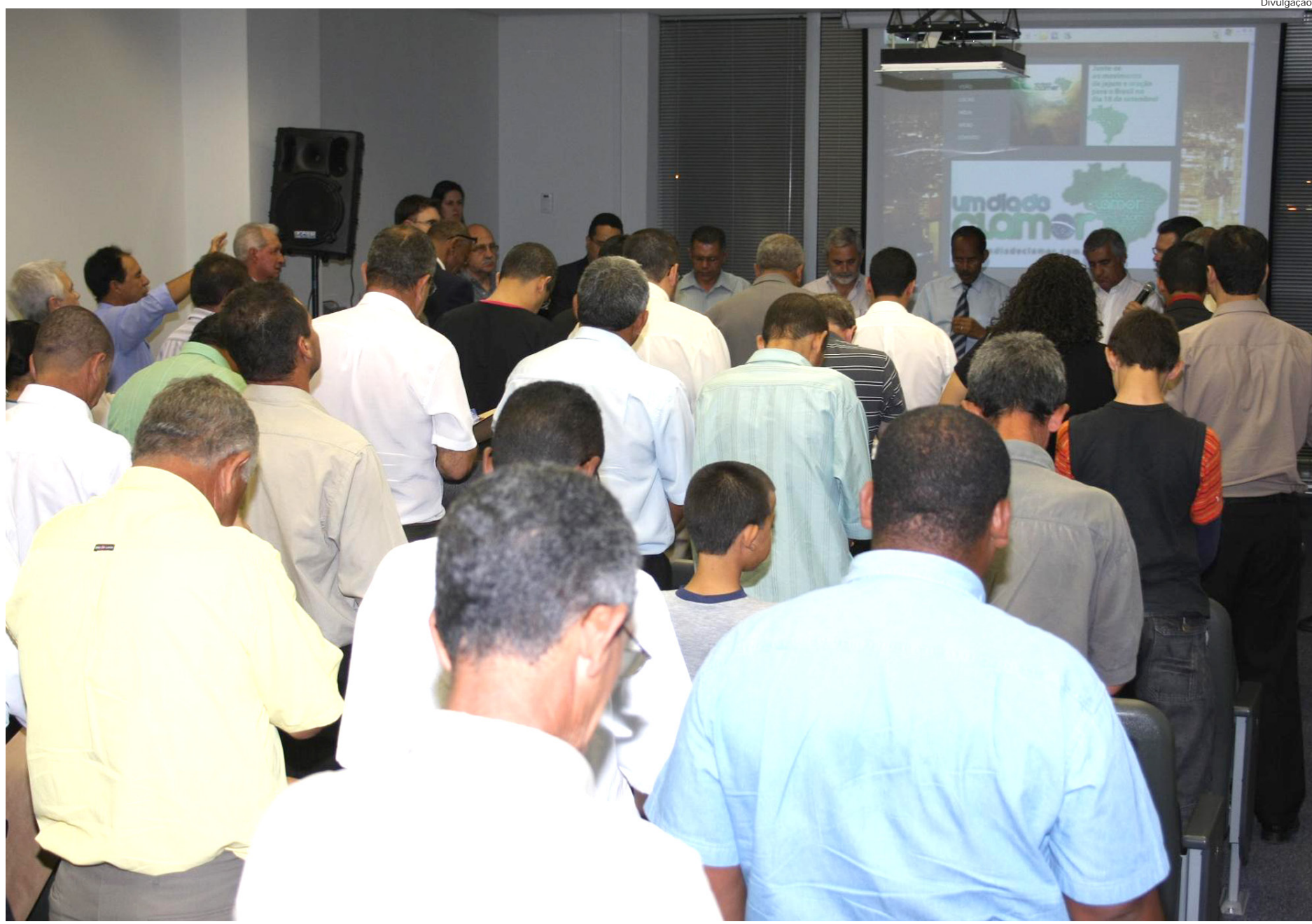
Desde 4 de agosto de 2009, a Prefeitura de Pindamonhangaba promove reuniões sobre alvará com líderes religiosos, trabalho neste sentido é contínuo

Agora, solicita (novamente) aos pastores e padres cujos templos estejam sem alvará, que compareçam à sede do Executivo para tratar da questão.