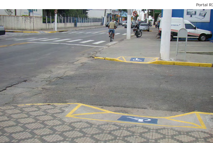
A Prefeitura realizará reformas importantes visando a segurança e o bem estar do munícipe

“São vias importantes da cidade e estas obras devem favorecer tanto aos pedestres, quanto aos motoristas e ao transporte público, facilitando o acesso de todos e oferecendo maior segurança”, declarou o secretário.