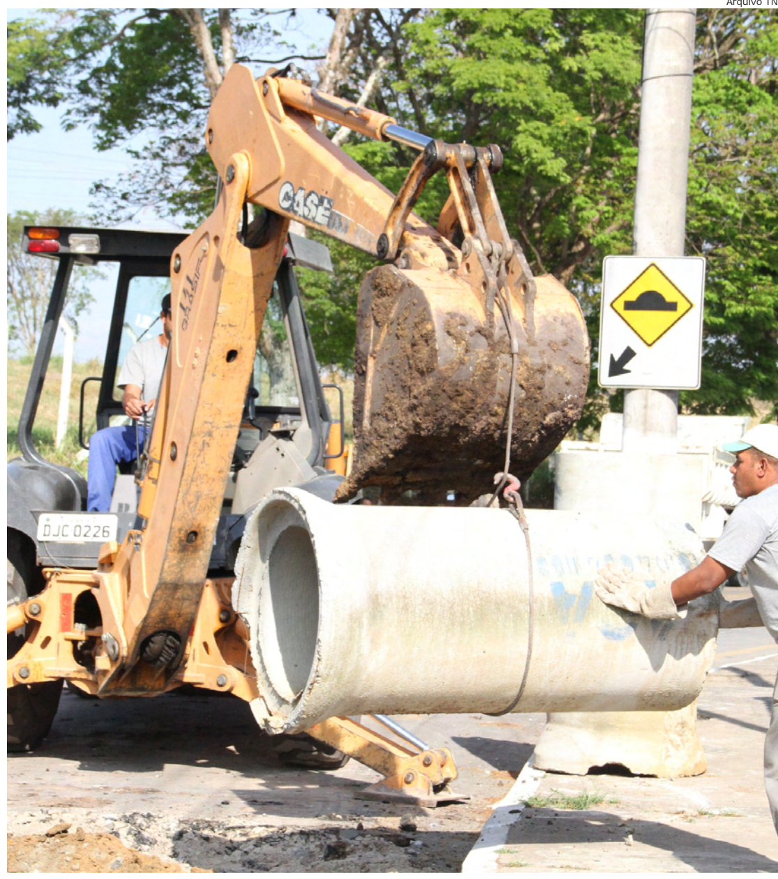
A substituição da tubulação garante maior escoamento das águas pluviais, evitando-se enchentes na avenida Ryoiti Yassuda, no Crispim

“Estas galerias beneficiam a população, evitando enchentes e prejuízos em dias de chuvas, e a manutenção e melhorias faz com que estas galerias funcionem sempre com sua capacidade total”, afirmou o diretor.