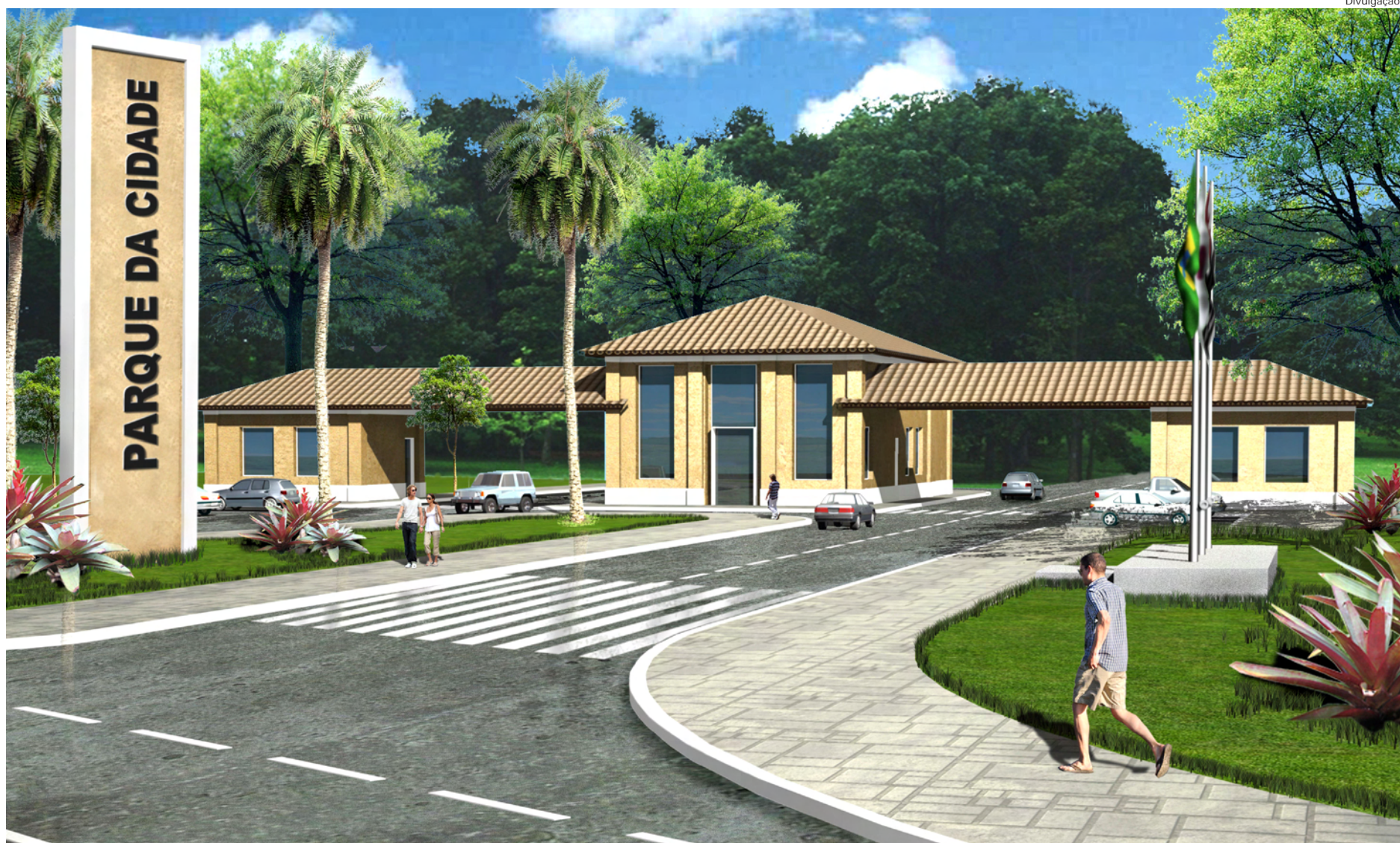
Nova portaria do Parque da Cidade ajudará a organizar o trânsito (eliminando os congestionamentos), e a controlar o acesso ao parque

Segundo o secretário, a construção da nova portaria será a primeira obra de uma série de outras a serem feitas. “Serão feitas outras obras e melhorias. O Parque Aquático será uma das grandes obras a serem feitas no local, já obras de melhorias podemos citar a adequação do auditório, e outros”, disse.