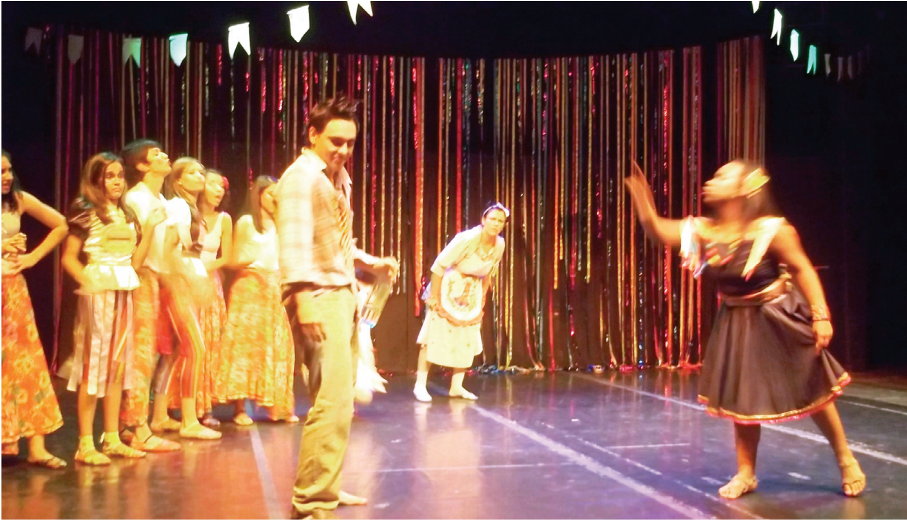
Cena do espetáculo da Cia Mônica Alvarenga, que representou Pindamonhangaba no VI Festival de Teatro de Paraibuna