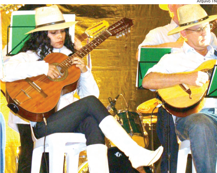
Festival será realizado no próximo fim de semana