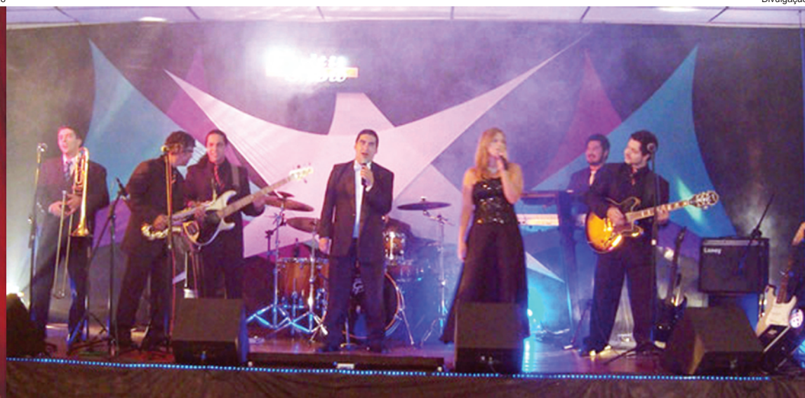
A banda Faroeste animou a noite de sexta-feira (20) na praça Cícero da Silva Prado, na Vila São Benedito. No sábado (21), foi a vez da Multi Band Show