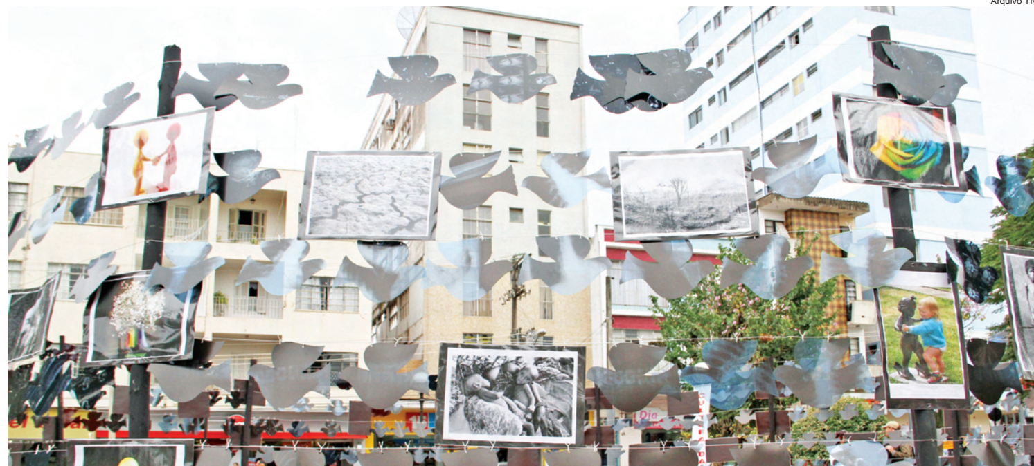
Praça Jorge Tibiriçá: Dia da Cultura e da Paz também foi comemorado em Pindamonhangaba o ano passado

Esta atividade também integra as comemorações dos 307 anos de emancipação política de Pindamonhangaba.