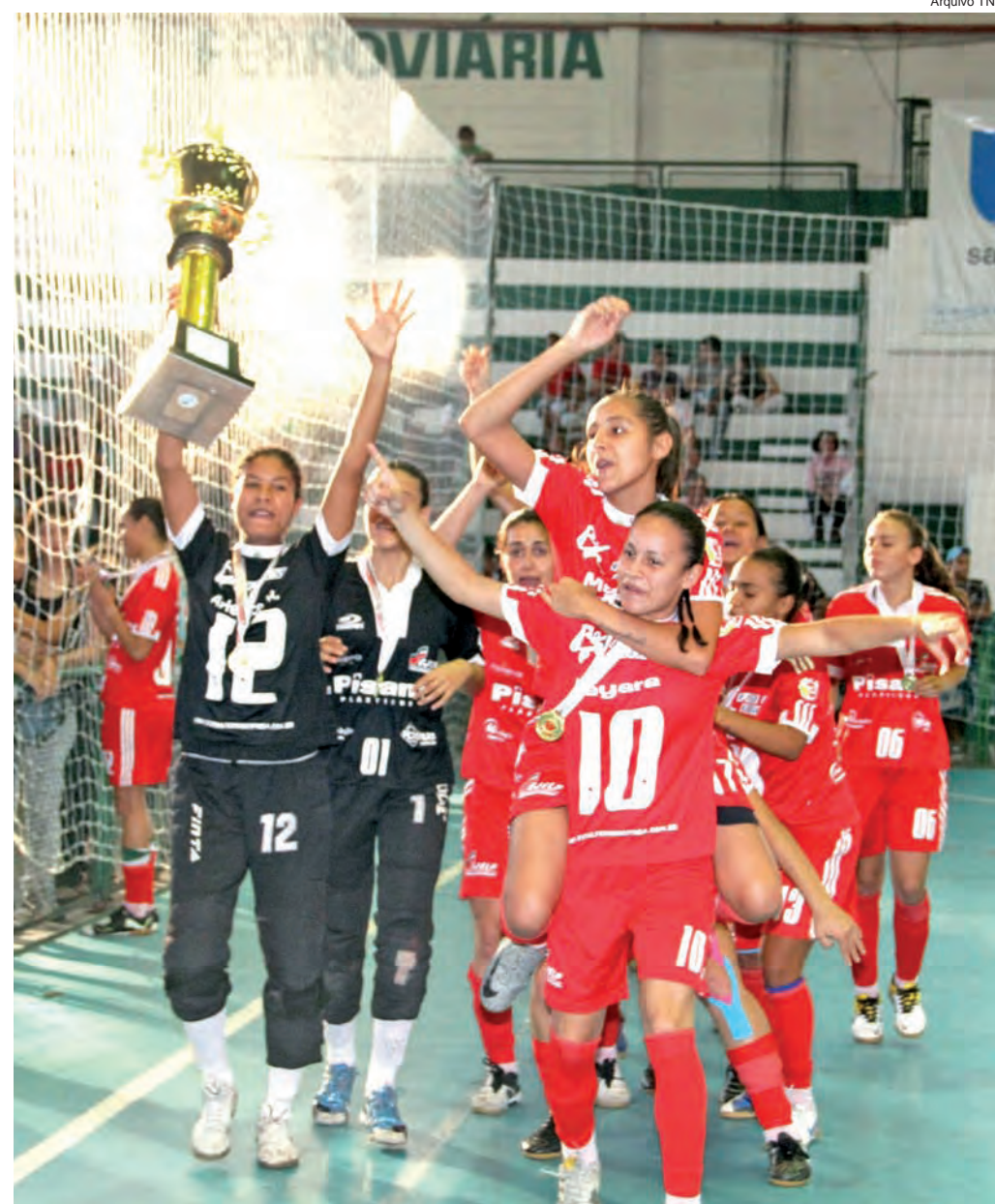
As meninas do futsal foram para Caraguatatuba dispostas a conquistar o tricampeonato da modalidade

Em 2012, oito mil atletas de 42 municípios estão disputando medalhas na cidade do Litoral Norte, que recebe a competição pela quarta vez nos últimos nove anos.