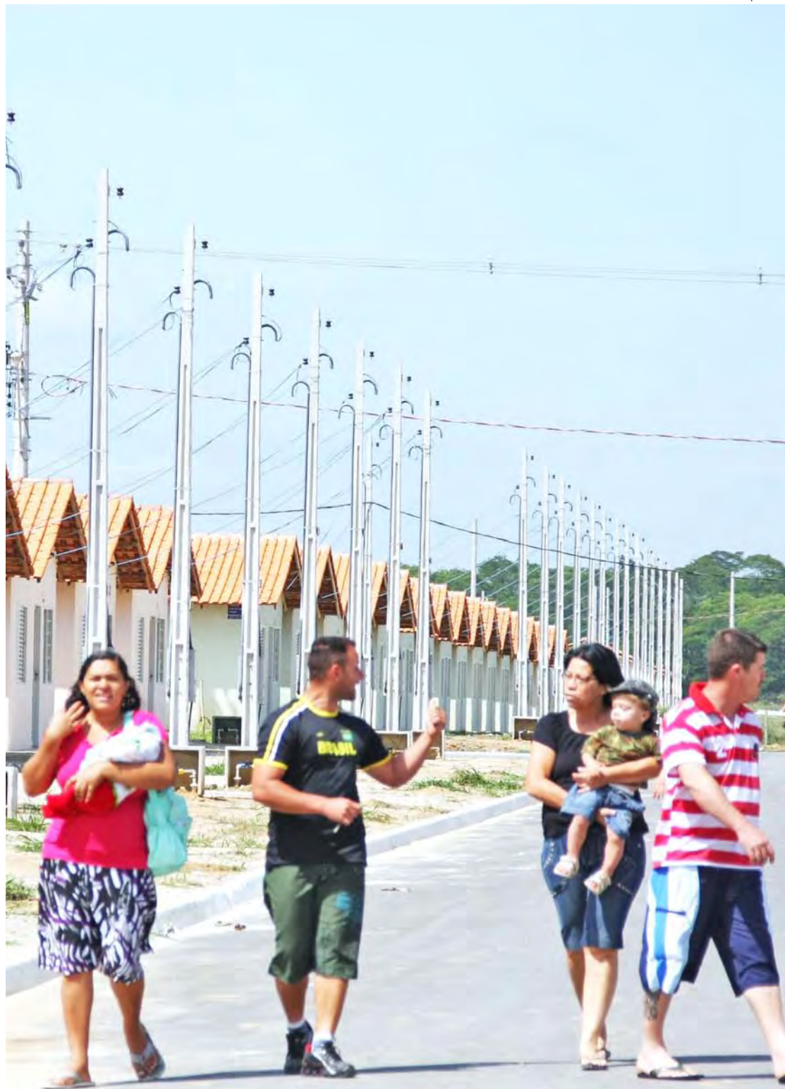
Projeto pretende envolver os moradores do bairro em atividades sociais