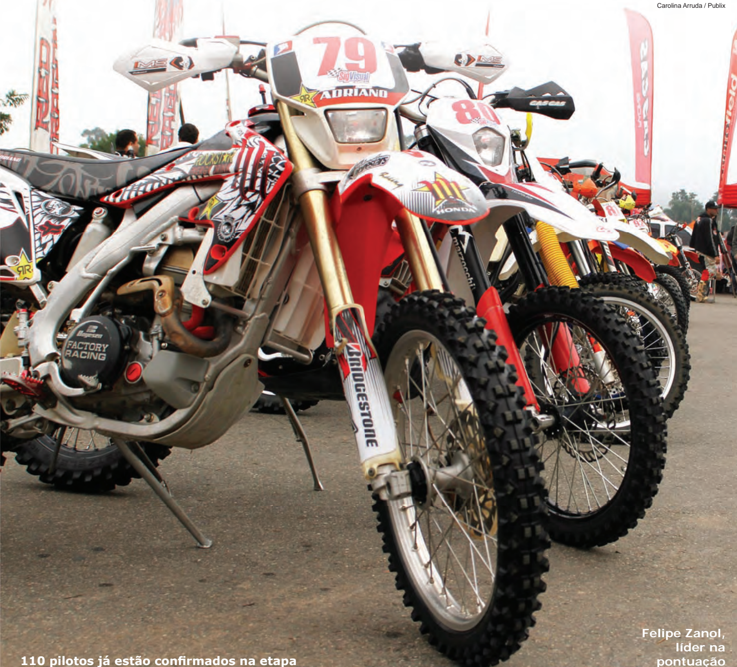
110 pilotos já estão confirmados na etapa