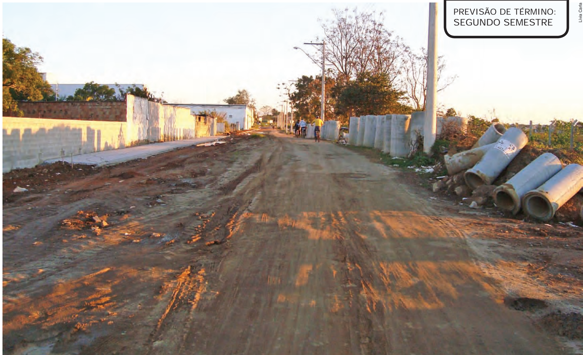
A nova estrada irá proporcionar uma grande melhoria no trânsito da região

A nova estrada irá melhorar o trânsito da região e facilitar o acesso aos bairros, com maior segurança para pedestres, ciclistas e motoristas.