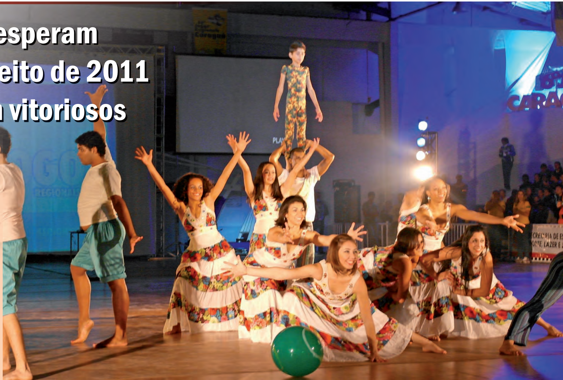
Performance artística que marcou a cerimônia de abertura dos 56º Jogos Regionais, em Caraguatatuba, no Litoral Norte