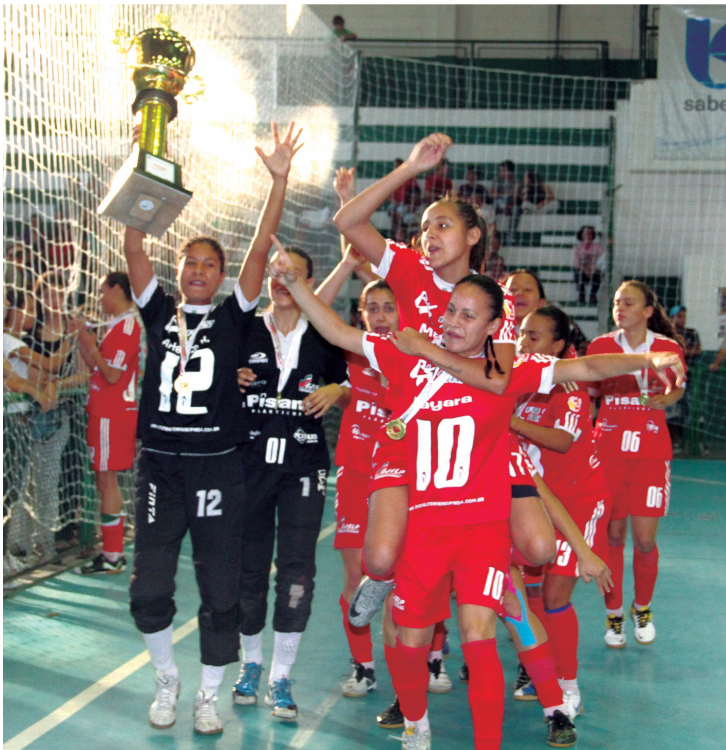
O futsal feminino é uma das forças de Pindamonhangaba na busca pelo bicampeonato nos Jogos Regionais

As crianças podem participar de forma gratuita e ainda têm a oportunidade de estar com os amigos mesmo durante as férias. As aulas nas escolas municipais retornam na segunda-feira (23).