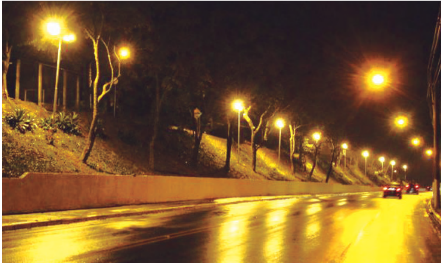
Nova iluminação da avenida Manoel César Ribeiro beneficia também o acesso ao bairro Santa Cecília