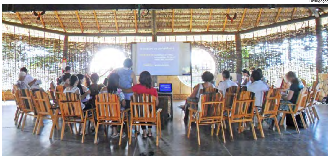
Momento do curso “Cuidando do Cuidador”, ministrado em Fortaleza

O curso trabalhou com vivências diárias e visita ao