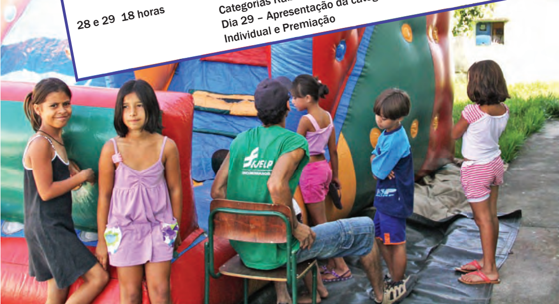
Festival de Férias faz parte dos festejos de aniversário de Pindamonhangaba