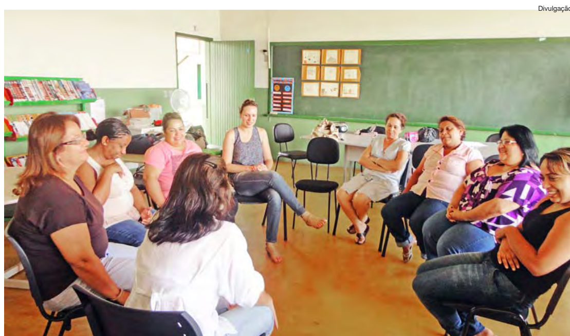
As rodas de conversa constituem uma forma de terapia comunitária

Para mais informações entrar em contato nos telefones 3644-5809 e 3642-2420.