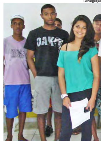
Jovem que participou da Alfabetização Ecológica

Na reunião, os jovens tiveram a oportunidade de expor seus anseios por melhorias no