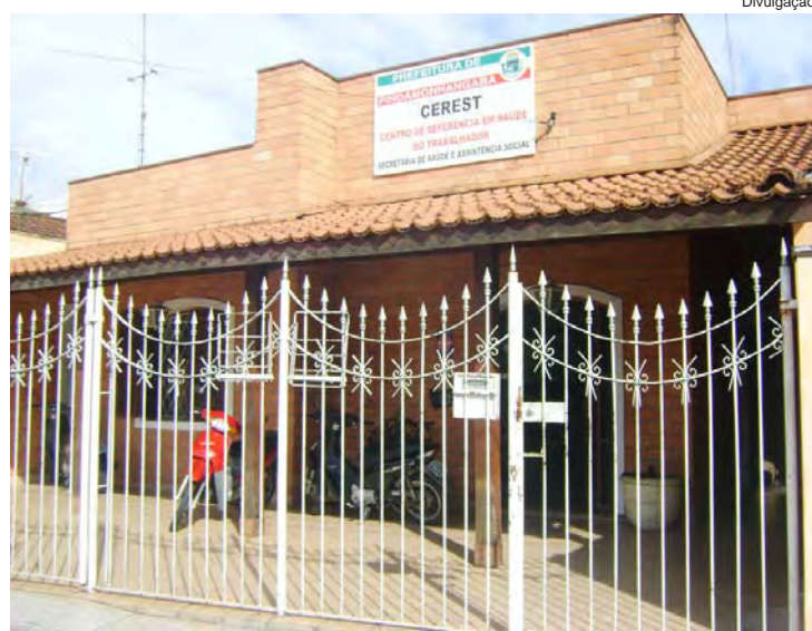
Cerest atende todos os trabalhadores com suporte à assistência de saúde e segurança no local

O atendimento inicial é feito pelo serviço social que fornece as primeiras orienta-