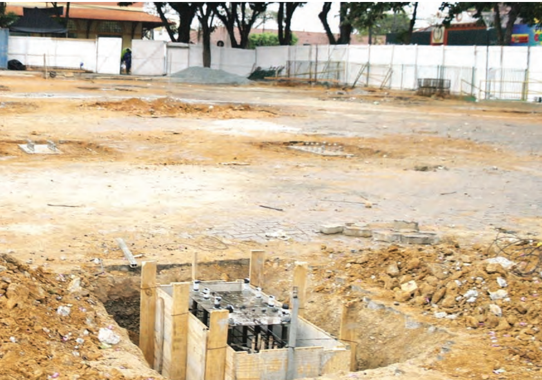
Maquete e construção das fundações da cobertura da Praça da Liberdade