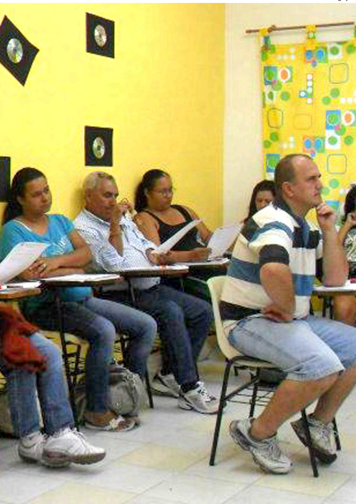
As pessoas maiores de 18 anos e que não tiveram oportunidade de concluir seus estudos podem participar do projeto