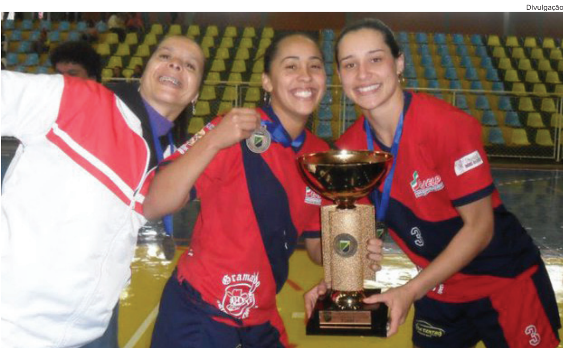
A taça de Campeão Brasileiro de handebol conquistada pelas meninas de Pinda

Marcos Cuba A equipe de handebol feminino, categoria adulto, de Pindamonhangaba, representando o Estado de São Paulo, sagrou-se campeã do Campeonato Brasileiro da 1ª Divisão. O jogo da final ocorreu no dia 7 de junho, em Goiânia, e foi contra a Seleção de Pernambuco. O placar foi 26 a 21 para Pinda.