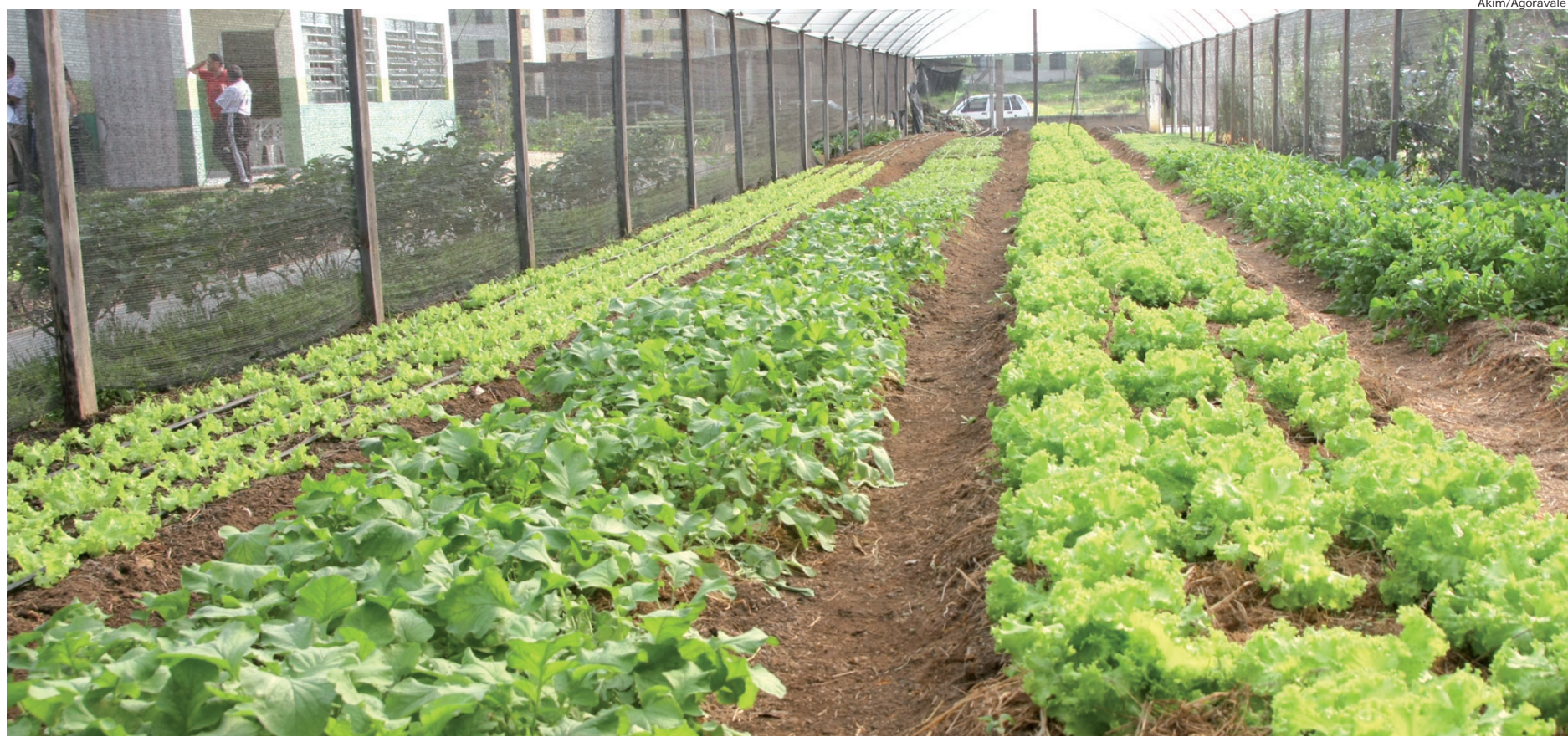
O Hortalimento e um projeto do Fundo Social de Solidariedade

"O cultivo de uma horta orgânica melhora a qualidade de vida das pessoas, além de garantir alimentos saudáveis e nutritivos mais baratos. O cultivo de hortaliças e plantas medicinais previne e até