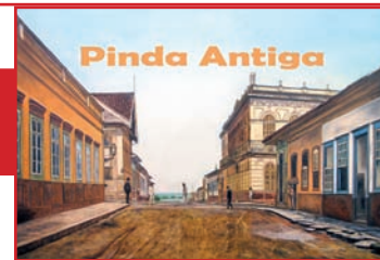
óleo sobre tela de Hélio Hatanaka