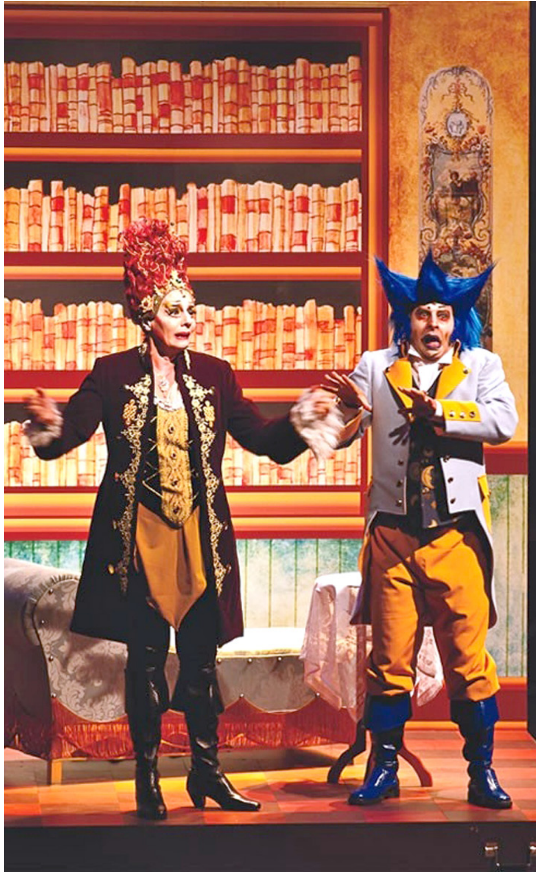
A bruxa Morgana e um representante da família real portuguesa

Pindamonhangaba. O projeto é executado pela Associação Paulista dos Amigos da Arte.