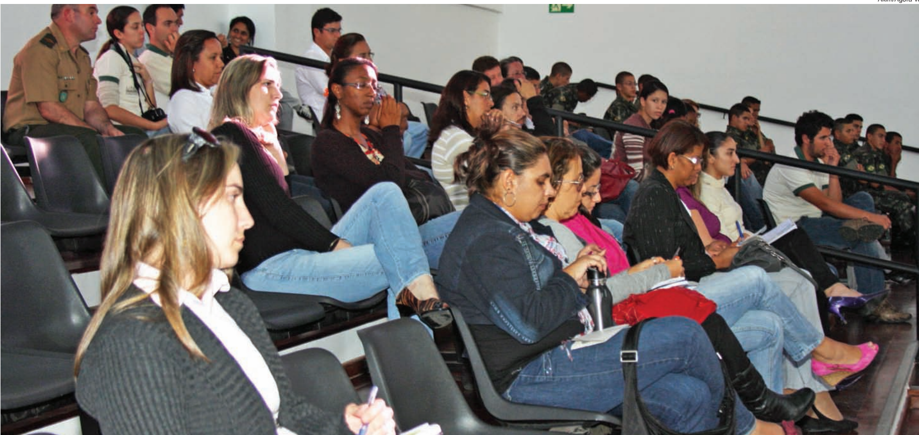
Na parte da tarde, a população que compareceu ao evento pôde fazer perguntas e encaminhar sugestões

A equipe da Pea-Gascar foi trazida a Pindamonhangaba por intermédio da Secretaria de Governo da Prefeitura, via Departamento de Licenciamento Ambiental e Urbanismo.