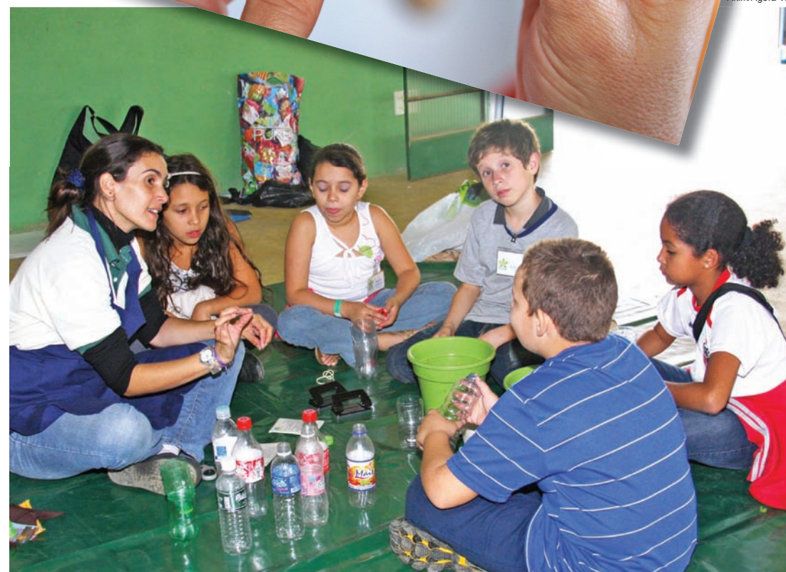
Na parte da manhã o trabalho foi com as crianças. Participaram 200 alunos