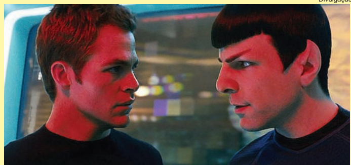
Capitão Kir e Spock juntos em nova aventura

O jogo foca na cooperação entre os dois personagens, que po-