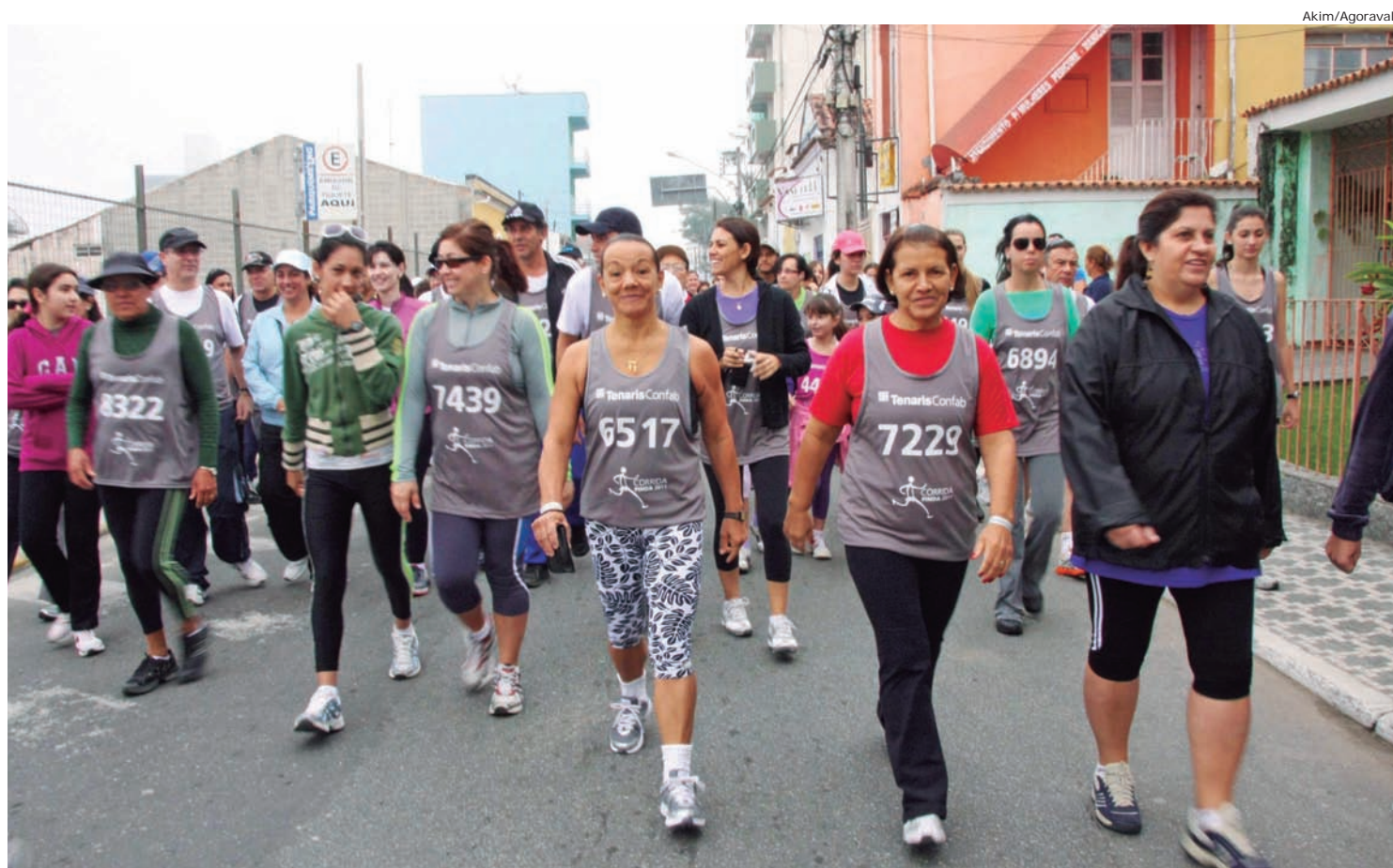
Quem não está preparado para participar das corridas de 4 ou 10 km, pode fazer parte da caminhada PÁGINA 16

A Prefeitura de Pindamonhangaba prorrogou o prazo final das inscrições para bolsas de estudos nos cursos do Colégio Comercial Dr. João Romeiro para o dia 19 de junho. As oportunidades são para cursar