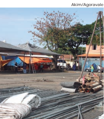
Antiga cobertura está sendo retirada para a instalação da nova, que será metálica