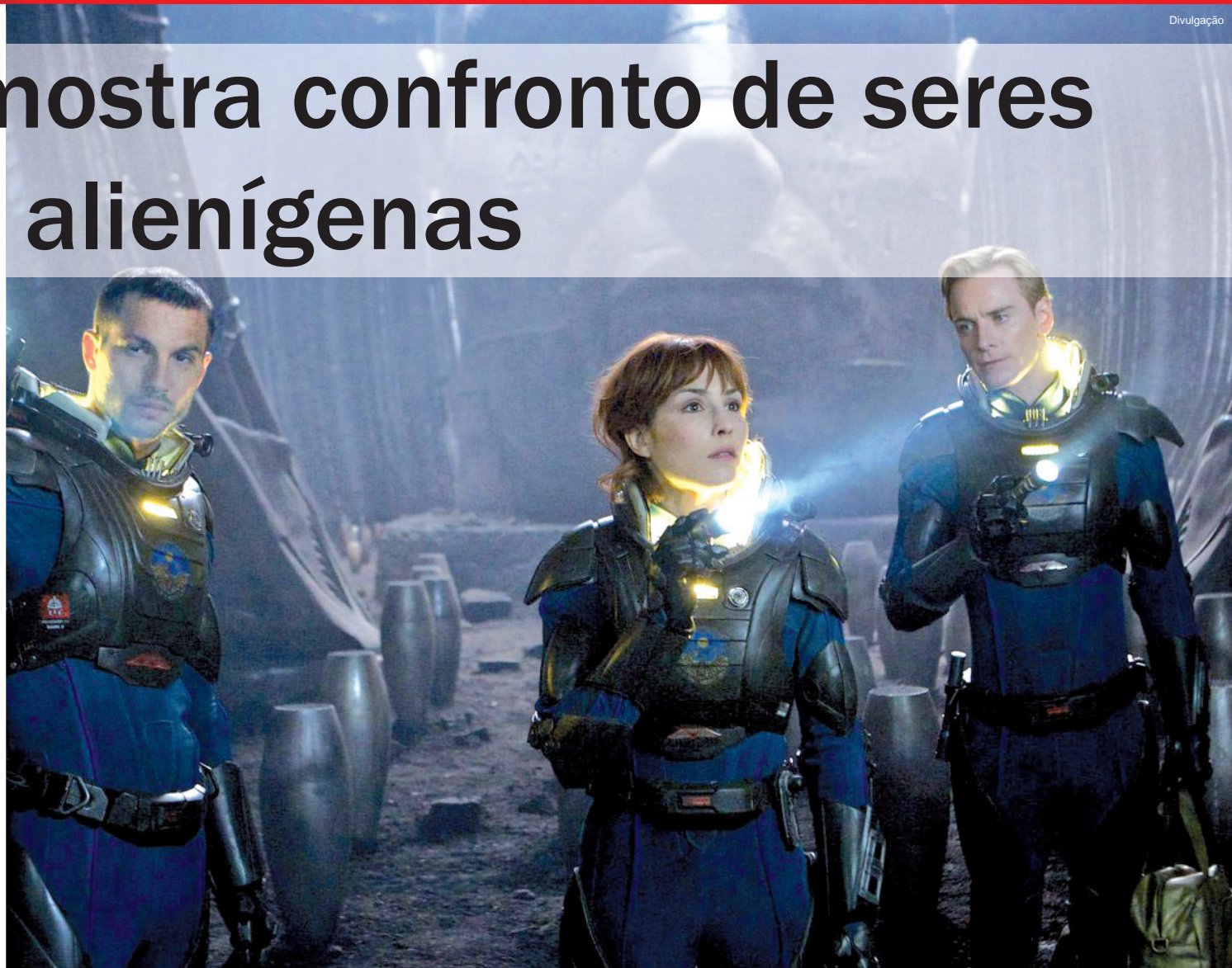
Filme de Ridley Scott é uma ficção científica que mostra seres humanos em busca das origens da Terra

Ao contrário de muitas ficções científicas, "Prometheus" não escancara o seu teor de parábola, não fala da ciência desmedida ou de cientistas malucos e sem limites. Nesse sentido, o filme de Scott é mais sutil, escorrega na sua própria gosma, mas ainda assim, se reencontra em meio a divagações metafísicas.