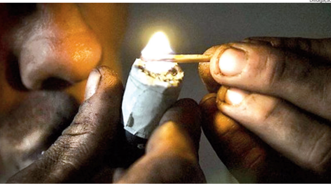
Crack – uma das drogas mais avassaladoras e terríveis de nossa sociedade

O 1º Encontro Regional de Políticas sobre Drogas - Alternativas de Atuações e Coalizões - será realizado na quarta-feira (20), na Câmara de Vereadores de Pindamonhangaba, localizada na rua Alcides Ramos Nogueira, 860, loteamento Real Ville, a partir das 8 horas. O evento está sendo realizado pela Coed - Coordenação de Políticas sobre Drogas, órgão da Secretaria da Justiça e da Defesa da Cidadania da Defesa Estadual. A Prefeitura de Pindamonhangaba está apoiando as ações do movimento Coalizão.