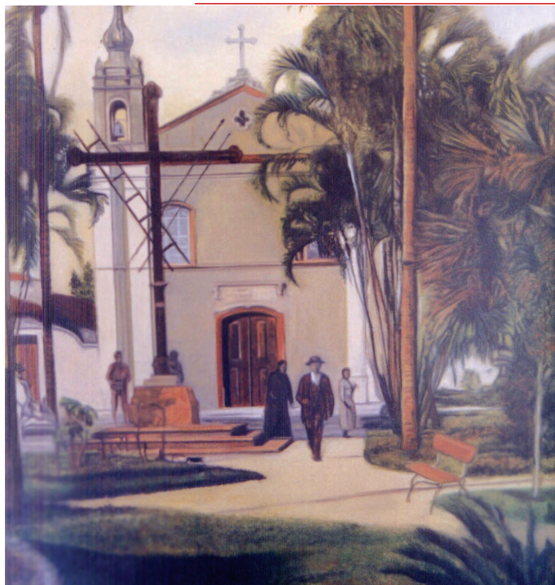
O antigo Largo do Rosário, atual praça Dr. Francisco Romeiro (também popularmente conhecido como Largo do Cruzeiro), com destaque para a igreja demolida em 1927

que rangia, de chão de largas tábuas sempre muito bem lavadas, muito limpas, quase brancas da esfregação. Nos dias da lavação, botavam-me sentado numa beirada de mesa - vasta mesa da sala de jantar - para apreciar a limpeza. Eu acho, cá comigo, que ali me punham era mas para não fazer artes. A sala de jantar, tamanhona, com janelas de guilhotinas que espiavam o jardim, com seu grande repuxo cheio de limos e samambaias, aqui, e o quintalão, além, com suas laranjeiras mexeriqueiras, limoeiros, abacateiros, mamoeiros e, no fundo, bem no fundão, o bosque de aracás, o lugar que eu mais gostava, sossegado, meio sombrio e meio selvagem. Essa sala de jantar, lembrome dela tão bem, era movimentada, vivia sempre cheia de gente, parentes ou visitas. Um puxado que saía que saía da porta dessa sala, calçado de tijolos, levava à cozinha, ladeando o jardim. O jardim era desses de antigamente, intramuros, onde se ficava à vontade e se gozava dum doce repouso, sem perturbações de passantes, jardim como diz Lobato do de Dona Benta, hoje fora de moda, com esporinhas, cristas-de-galo, cravos - que era a flor preferida de minha mãe - maravilhas, rosinhas, dessas de trepadeira, modestinhas, damas-entre-verdades, alecrins, guinés, arrudas..."