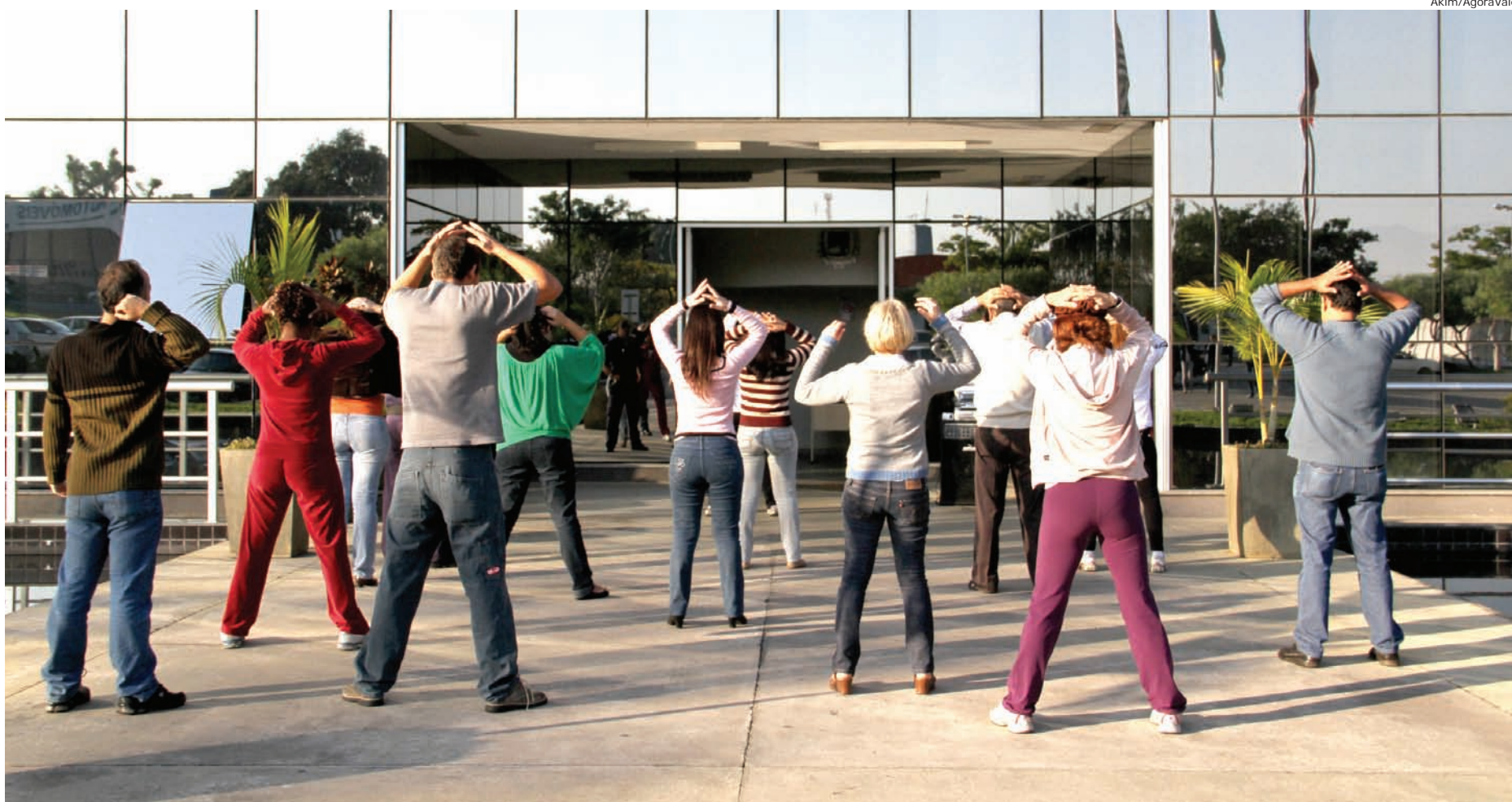
Funcionários praticam atividade física na frente da sede da Prefeitura durante o Dia do Desafio no ano passado

O Caicross será uma forma diferente de passar mensagens educativas de trânsito e ensinaros ciclistas a utilização da bicicleta.