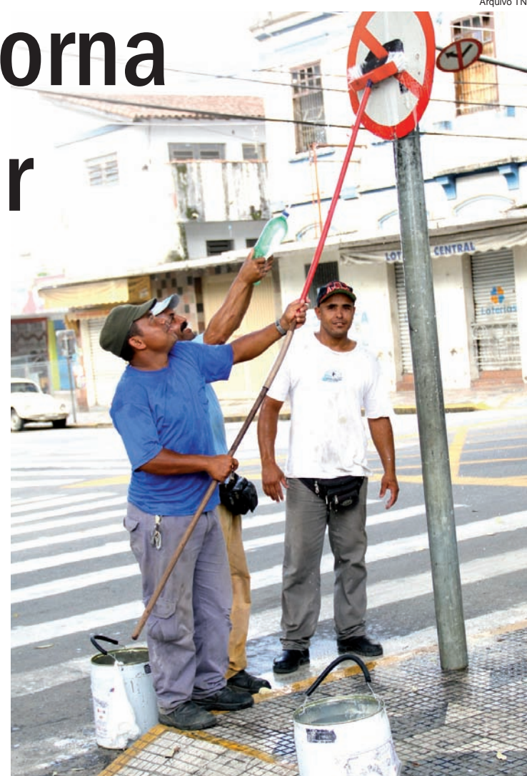
Limpeza de postes e placas de sinalização de trânsito

Para isso, a reciclagem do chamado "lixo seco" (basicamente todo tipo de em-