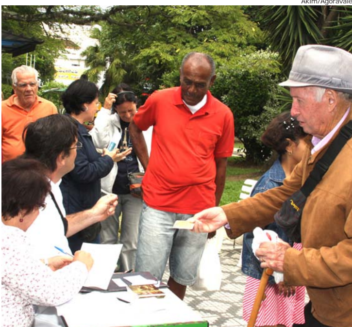
Vacinação continua nas Unidades de Saúde