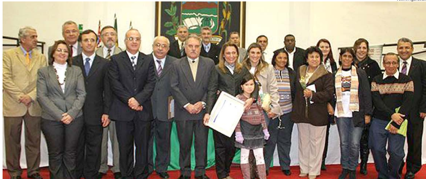
O senac oferece 40% de seus cursos de forma gratuita para a população

A vacinação está disponível nas unidades de saúde do município.