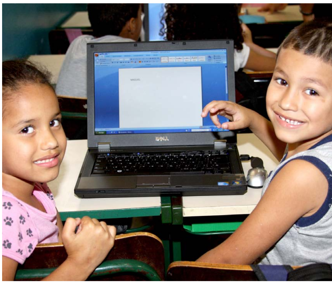
O Programa Informática Educacional leva laptops para as salas de aula

Na Aprendizagem Sistemática os alunos aprendem valores e desenvolvem habilidades socioemocionais por meio de estruturas de sala de aula.