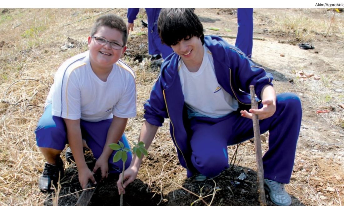
A Prefeitura sempre envolve crianças e jovens em seus plantios

Das 9 às 12 horas: Mesa Redonda: Criação da proposta para Pinda + 20 Das 9 às 12 horas: Exposições no Parque da Cidade