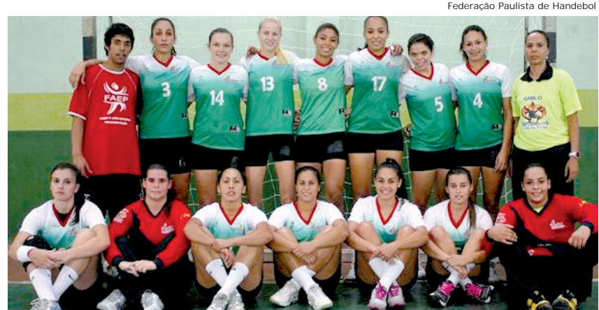
Federação Paulista de Handebol

A equipe local só volta a entrar em quadra no dia 16 de junho, contra o Santo André, novamente no Jardim Eloyna.