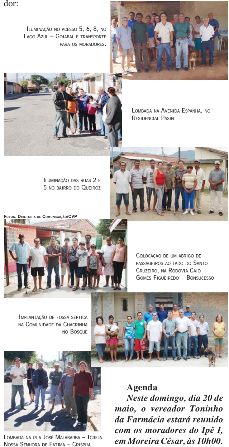
ILUMINAÇÃO NO ACESSO 5, 6, 8, NO LAGO AZUL – GOIABAL E TRANSPORTE PARA OS MORADORES.