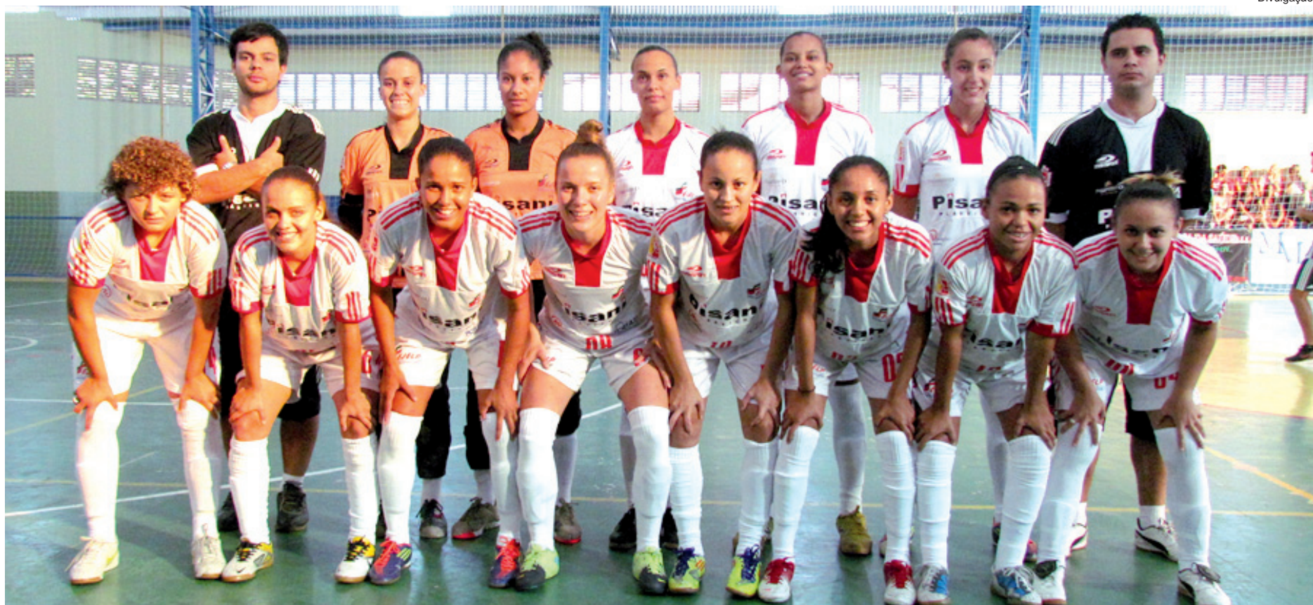
Equipe de futsal feminino, em busca de novos desafios, embarca dia 23 para Vitória (ES), para disputar os Jogos Abertos Brasileiros

As futebolistas enfrentarão fortes equipes, entre elas, a paranaense, mineira, carioca e catarinense. De acordo com Derrico, as expectativas para esta competição são as