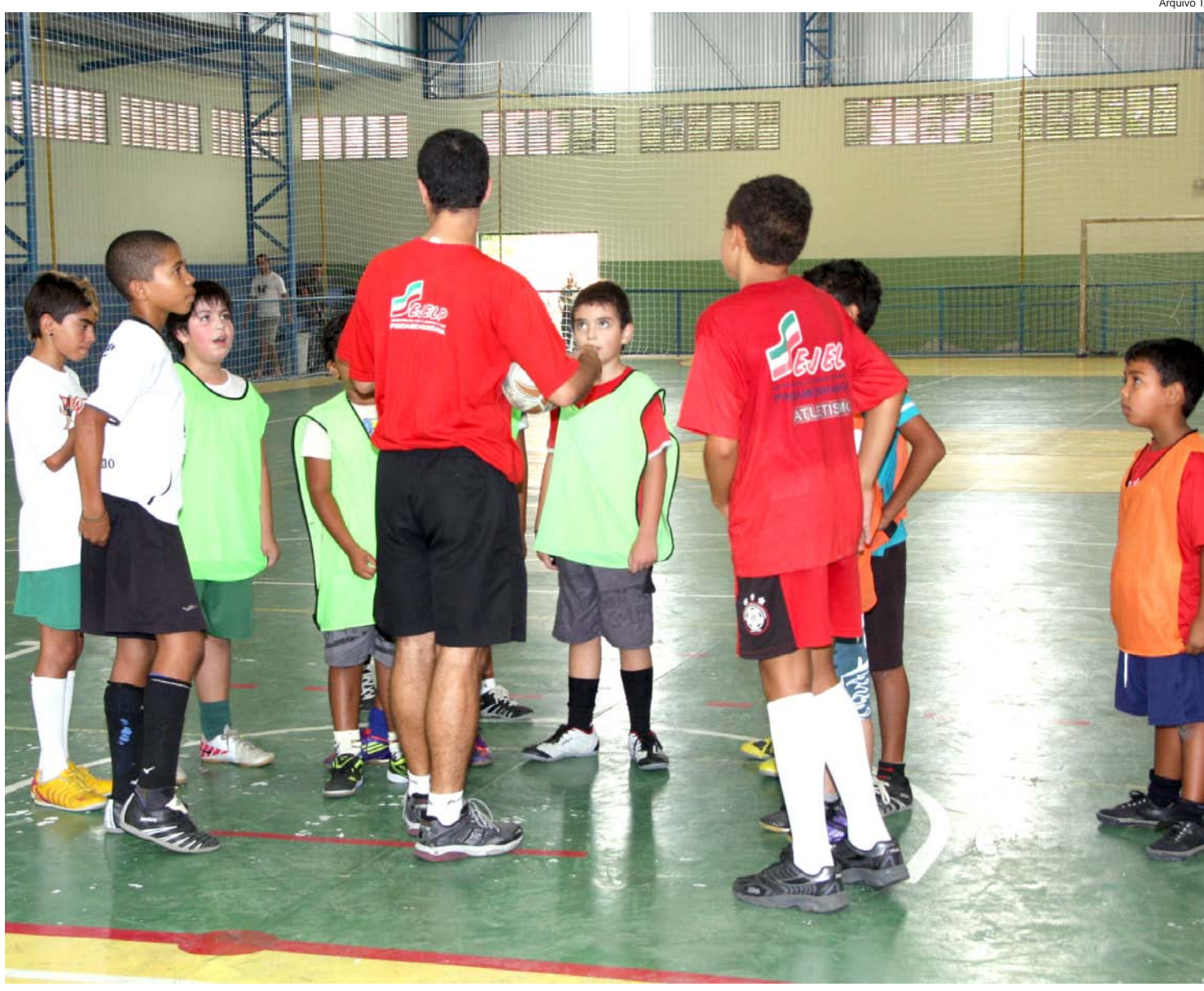
A seletiva será realizada nos centros esportivos da cidade. Serão escolhidas 140 crianças da cidade

As seletivas deste sábado serão realizadas no Centro Esportivo "Zito", em Moreira César, a partir das 8 horas. No domingo (20), das 8 às 11 horas, no ginásio do Araretama; e das 14 às 16h30 no ginásio do Jardim Eloyna. No Centro Esportivo "João do Pulo", os trabalhos serão feitos no dia 26, das 8 às 11h30 e das 13h30 às 16 horas. Poderão participar, crianças matriculadas no 5º e 6º anos das escolas municipais, estaduais ou particulares.