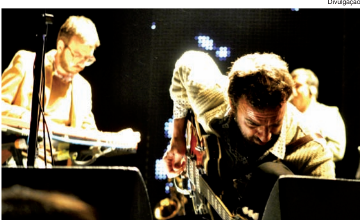
Box do grupo reúne sucessos como "Anna Júlia"

Em 2012, o Los Hermanos comemora 15 anos de carreira e para marcar a data, a banda lança neste mês o Box Los Hermanos. A caixa reúne os quatro bem-sucedidos álbuns do grupo, Los Hermanos (1999), Bloco do Eu Sozinho (2001), Ventura (2003) e 4 (2005), mais o DVD do show na Fundação Progresso, que aconteceu no Rio de Janeiro, em 2007.