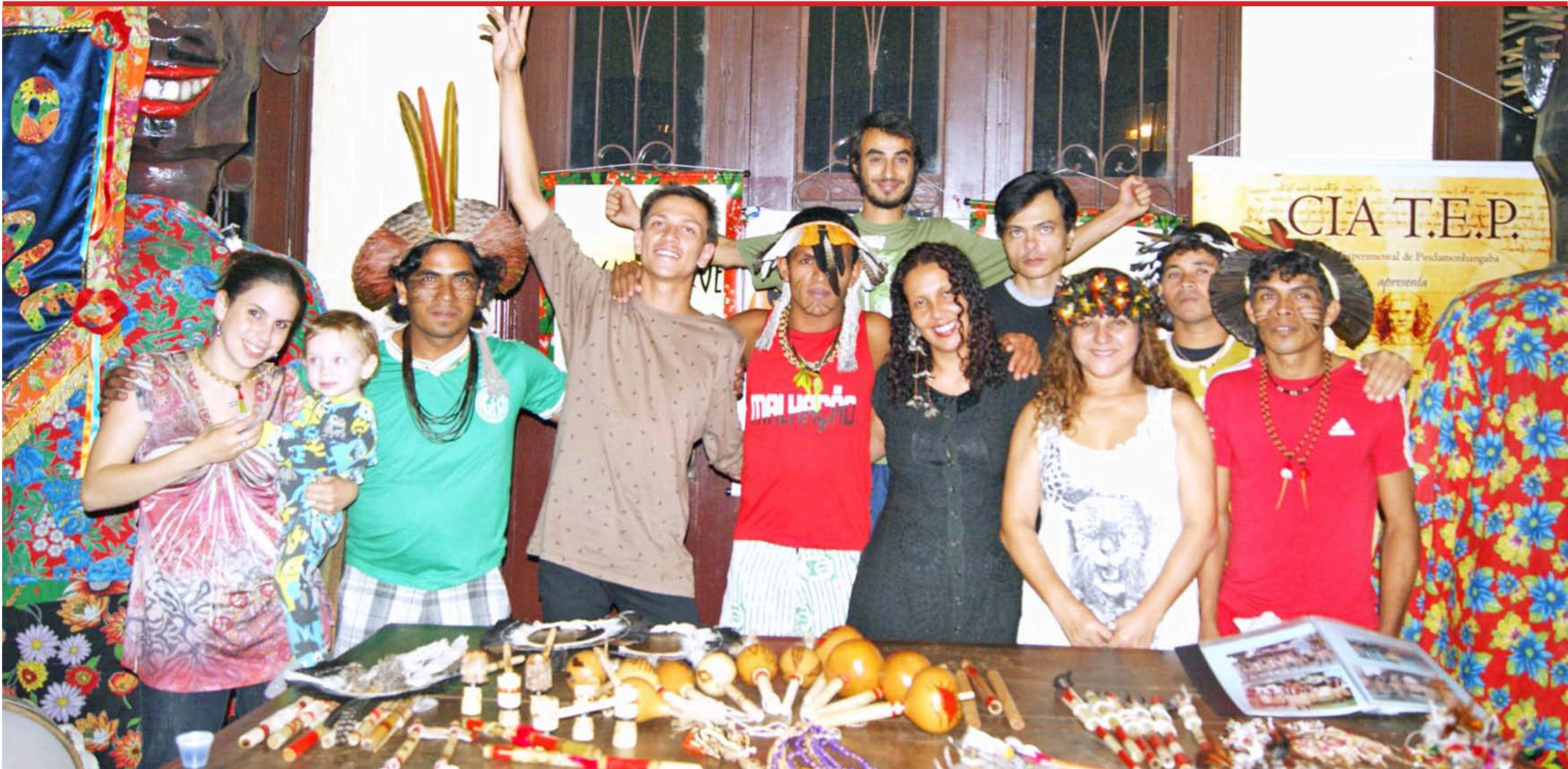
Índios da tribo Kariri Xocó, do Estado de Alagoas, estiveram na Estação Ardeuvale divulgando sua cultura e anunciando o trabalho que realizam por todo o Brasil