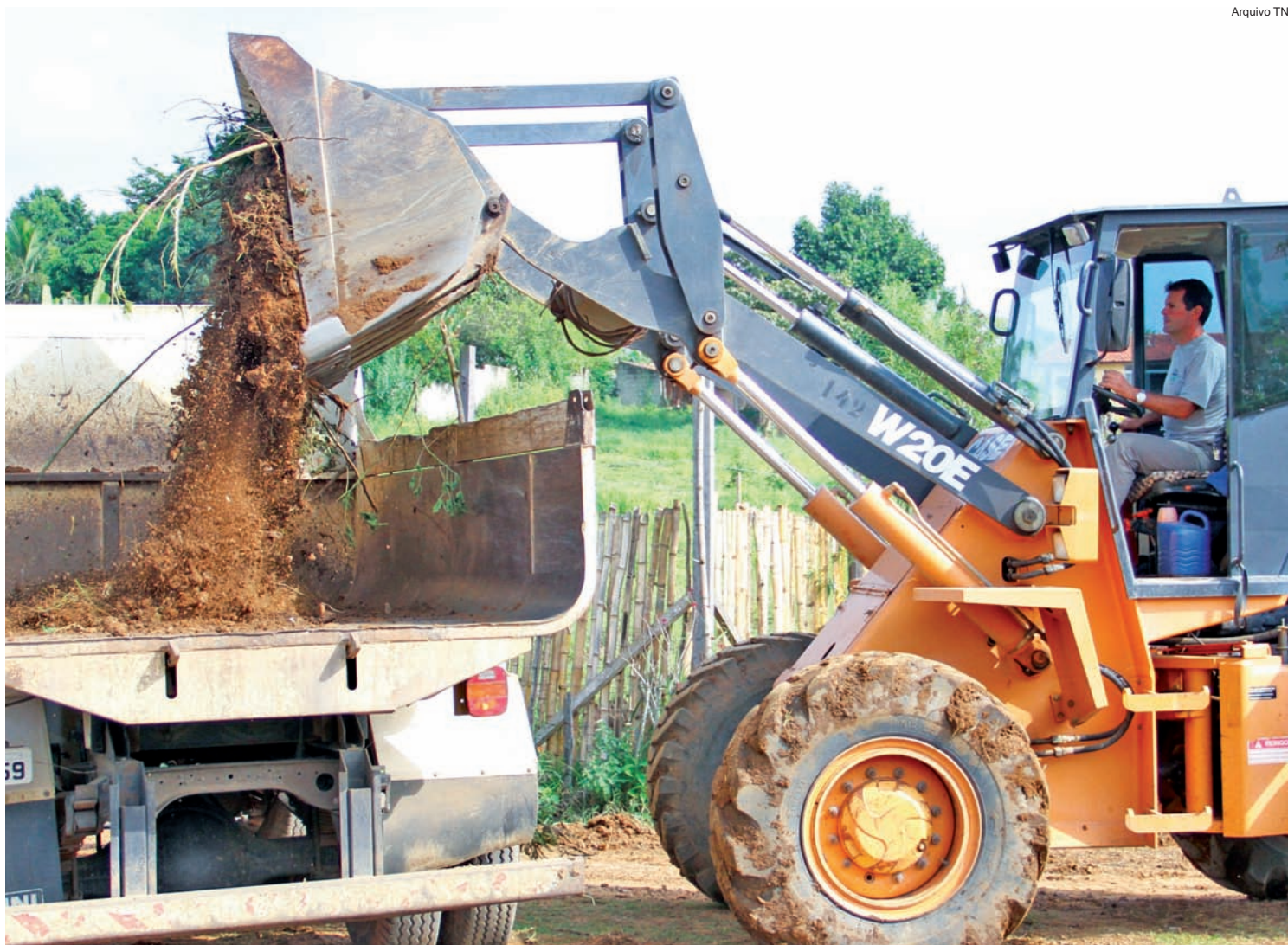
O programa Cata-treco visita todos os bairros de Pindamonhangaba duas vezes por ano

A Subprefeitura de Moreira César também participa do projeto Cidade Limpa.