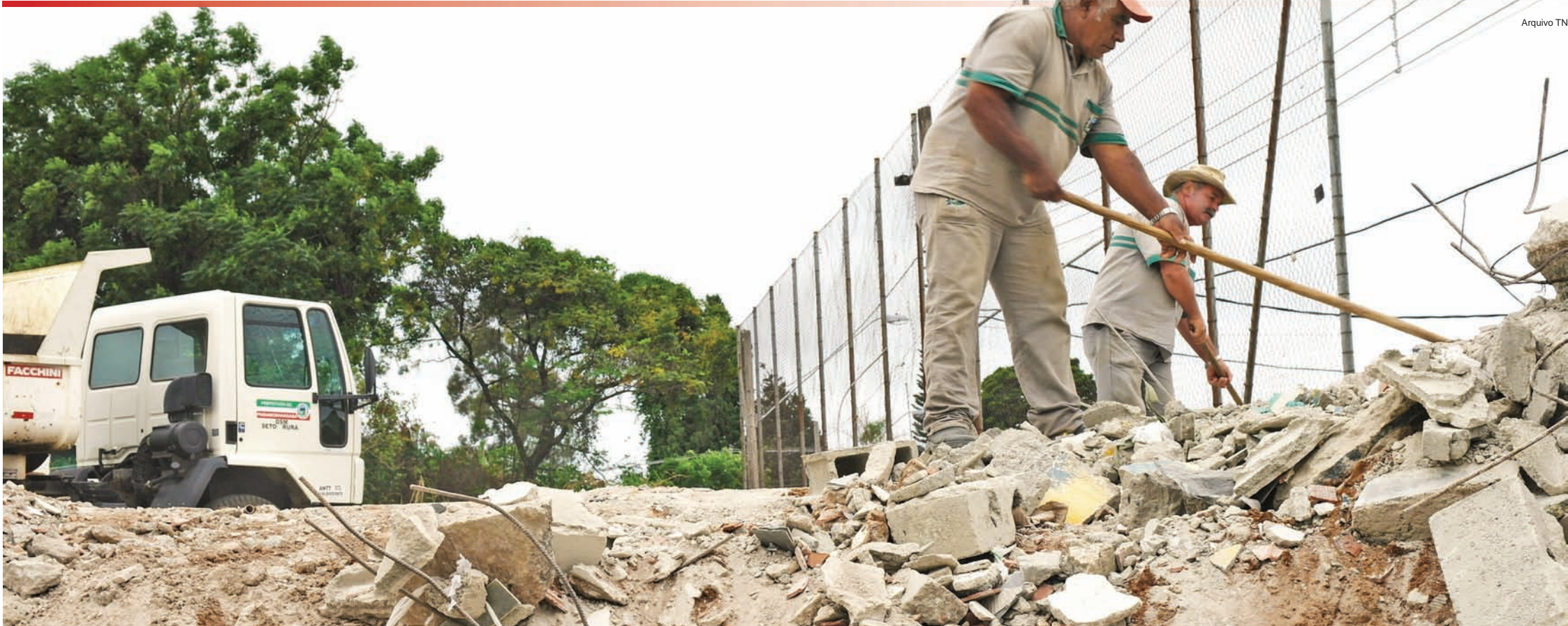
As equipes do programa "Cidade Limpa" da Prefeitura se espalham por todos os pontos da cidade para deixarem Pindamonhangaba mais limpa e bonita