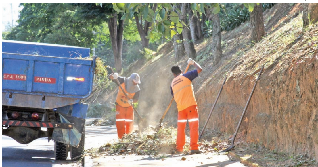
Roçada, capina e manutenção de praças

Atualmente estão sendo montados os PEVs - Pontos de Entrega Voluntária para