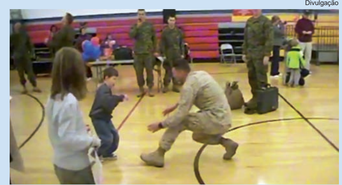
Vídeo foi visto quase 1,5 milhão de vezes

A novidade foi mantida em segredo até que o militar voltasse. O vídeo mostra a emoção do homem ao ver o filho andar pela primeira vez. O vídeo foi publicado há menos de uma semana e já foi visto quase 1,5 milhão de vezes. Você pode conferir o vídeo no Youtube, com o título "6-Year-Old Boy Walks to His U.S. Marine Father for the First Time".