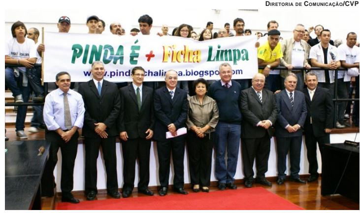
DIRETORIA DE COMUNICAÇÃO/CVP

Lei Orgânica do Município, denominada Ficha Limpa Municipal, prevê alteração no artigo 118, para impedir que pessoas condenadas pela Justiça em segunda instância, por órgão colegiado, transitado e julgado, assumam cargos comissionados como secretários, diretores e assessores, nos Poderes Executivo e Legislativo.