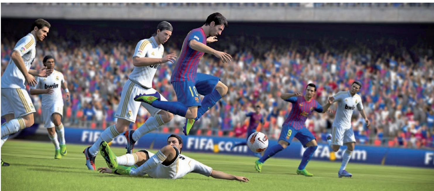
O sistema de dribles foi inspirado no jogador argentino e craque do Barcelona Lionel Messi