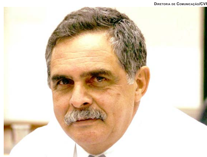
DIRETORIA DE COMUNICAÇÃO/CVP