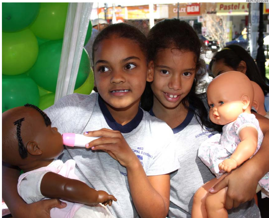
Crianças brincam na praça Monsenhor Marcondes, em 2011

O projeto teve início em 2005, sob à responsabilidade da Secretaria de Educação e Cultura com o nome de