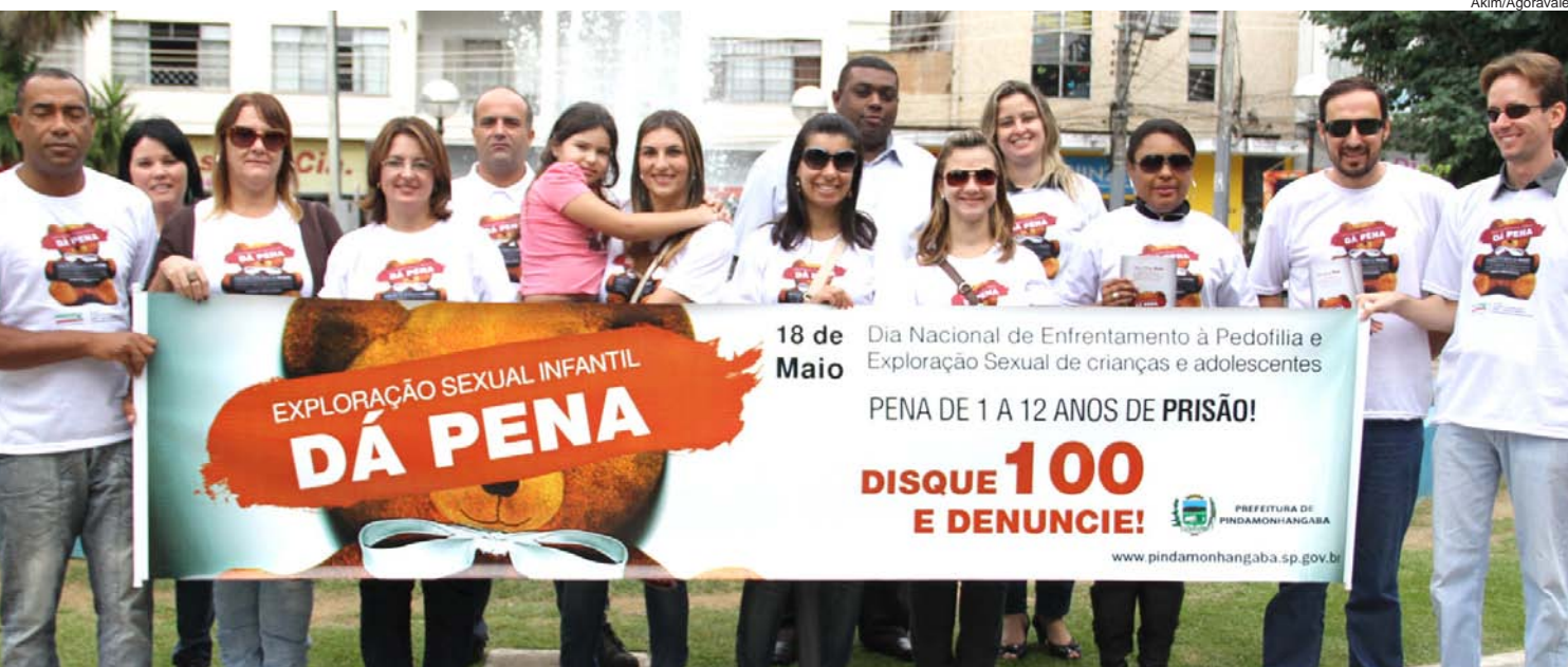
Os voluntários abordaram pedestres e motoristas para conscientização

Pindamonhangaba está com mais uma ação em prol das crianças e adolescentes do município. A cidade sempre incentiva movimentos que visem o bem estar desse público, gerando assim melhor desenvolvimento social.