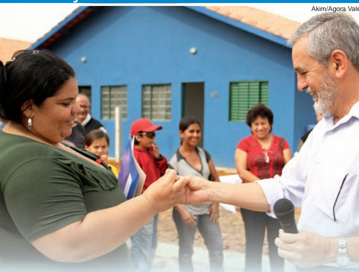
Prefeito entrega chave à nova moradora