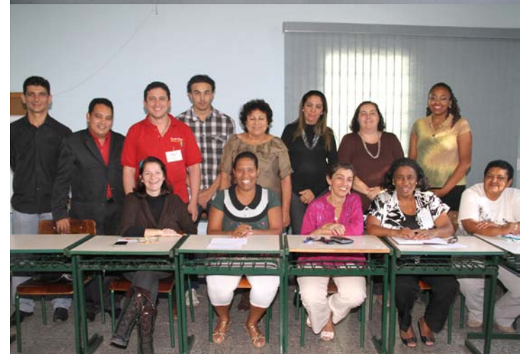
Grupo definiu temas que serão votados