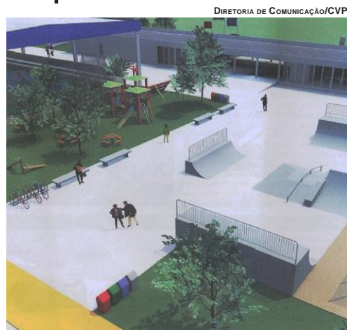
DIRETORIA DE COMUNICAÇÃO/CVP

Cal comenta que o outro projeto refere-se a uma abertura de crédito especial de R$ 2.020.000,00 (dois milhões e vinte mil reais), proveniente do Ministério da Cultura, para a “Praça PEC” (praça dos Esportes e da Cultura), que será construída no Loteamento Liberdade. “A praça terá cineteatro, biblioteca, telecentro, salas multiuso, pista de skate, academia da melhor idade, quadra coberta, pista de caminhada e aparelhos infantis e deve atender a população do Liberdade, CDHU