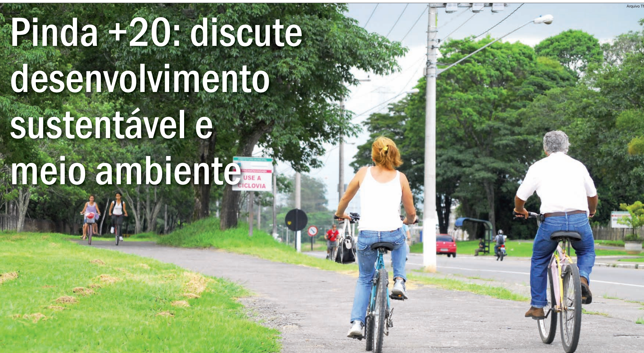
Evento discutirá uma série de temas relacionados à proteção do meio ambiente; o uso da bicicleta é uma das práticas estimuladas pela Prefeitura de Pindamonhangaba

Semana do Meio Ambiente 2012 será “Pinda+20”, de 1º a 6 de junho, no Parque da Cidade