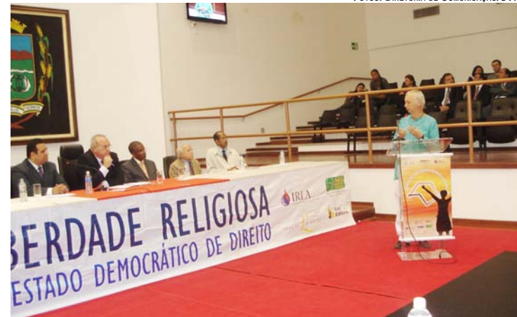
FOTO DO II ENCONTRO SOBRE LIBERDADE RELIGIOSA E CIDADANIA REALIZADO EM MAIO DE 2011