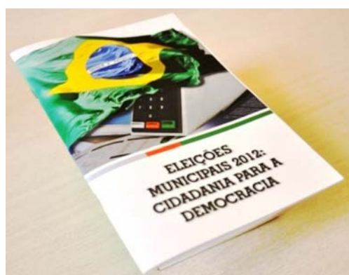
CARTILHA LANÇADA PELA CNBB COM O TEMA “ELEIÇÕES 2012: CIDADANIA PARA A DEMOCRACIA”

O documento, que será utilizado pela Igreja Católica para orientar o voto