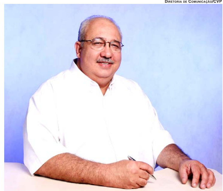
DIRETORIA DE COMUNICAÇÃO/CVP