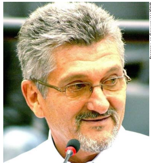
DIRETORIA DE COMUNICAÇÃO/CVP