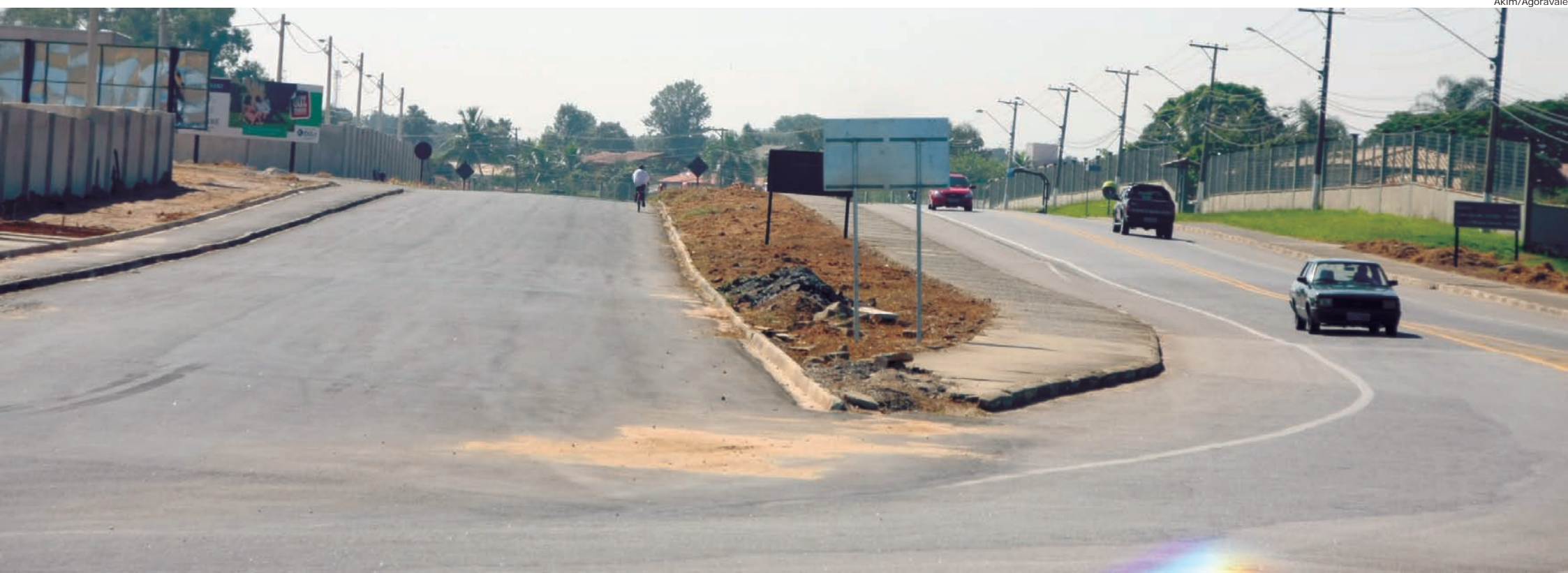
Obras na região do Lessa/Araretama, acesso de Pinda a Taubaté, entram, nos próximos dias, na terceira e última fase. Obras devem estar prontas ainda no primeiro semestre