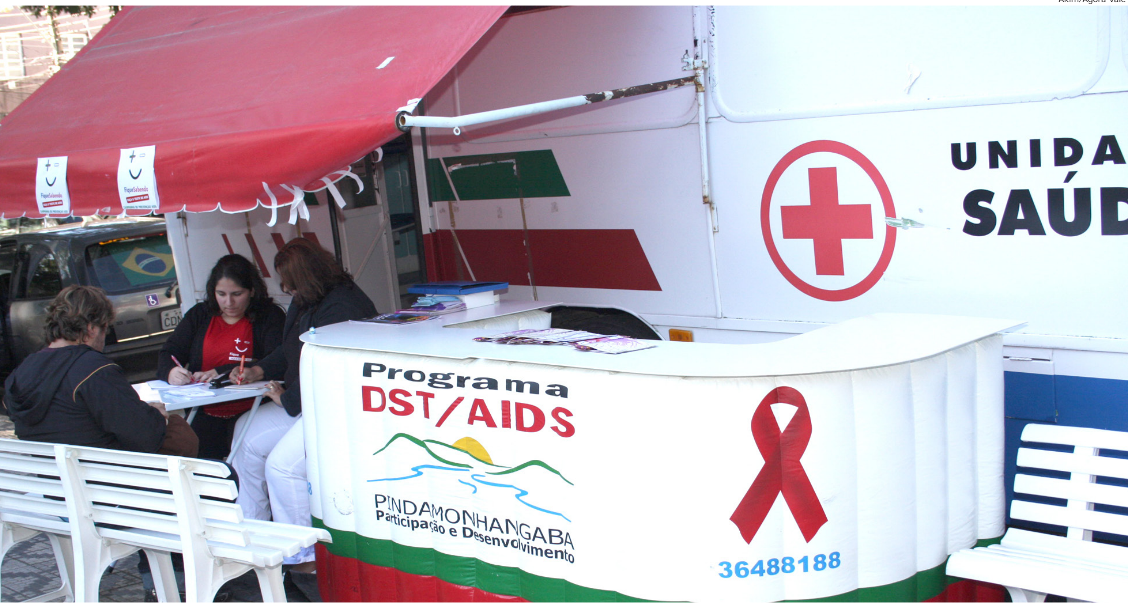
Campanhas como a "Fique Sabendo", buscam esclarecer sobre os perigos da Aids/DST e também iniciar o tratamento o mais rápido possível

A Prefeitura de Pindamonhangaba, através da Secretaria de Saúde e Assistência Social, oferece o serviço de tratamento para pessoas com DST/Aids. Quando a doença é diagnosticada, o paciente é encaminhado para o ambulatório e é feita a matrícula no programa DST/Aids e hepatite viral.