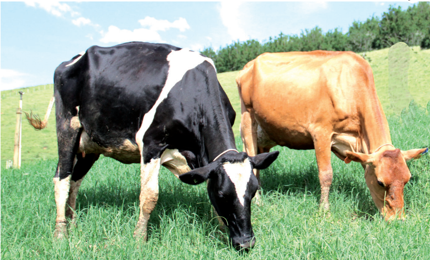
Dia de Campo será sobre o manejo ideal das áreas de pasto