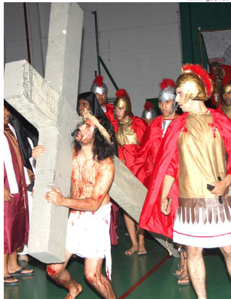
Encenação da Vida e Paixão de Cristo