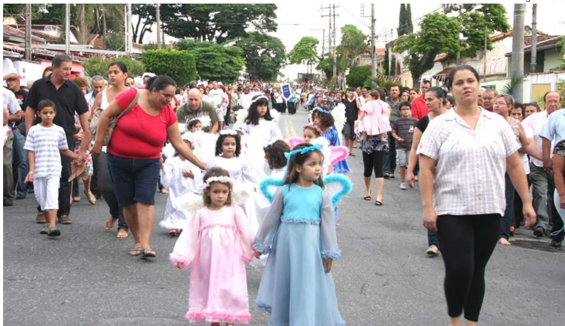
Os anjinhos também participaram da procissão de São Benedito