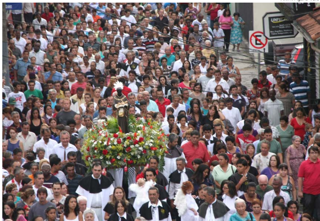
Milhares de fiéis acompanham a procissão de São Benedito pelas ruas centrais