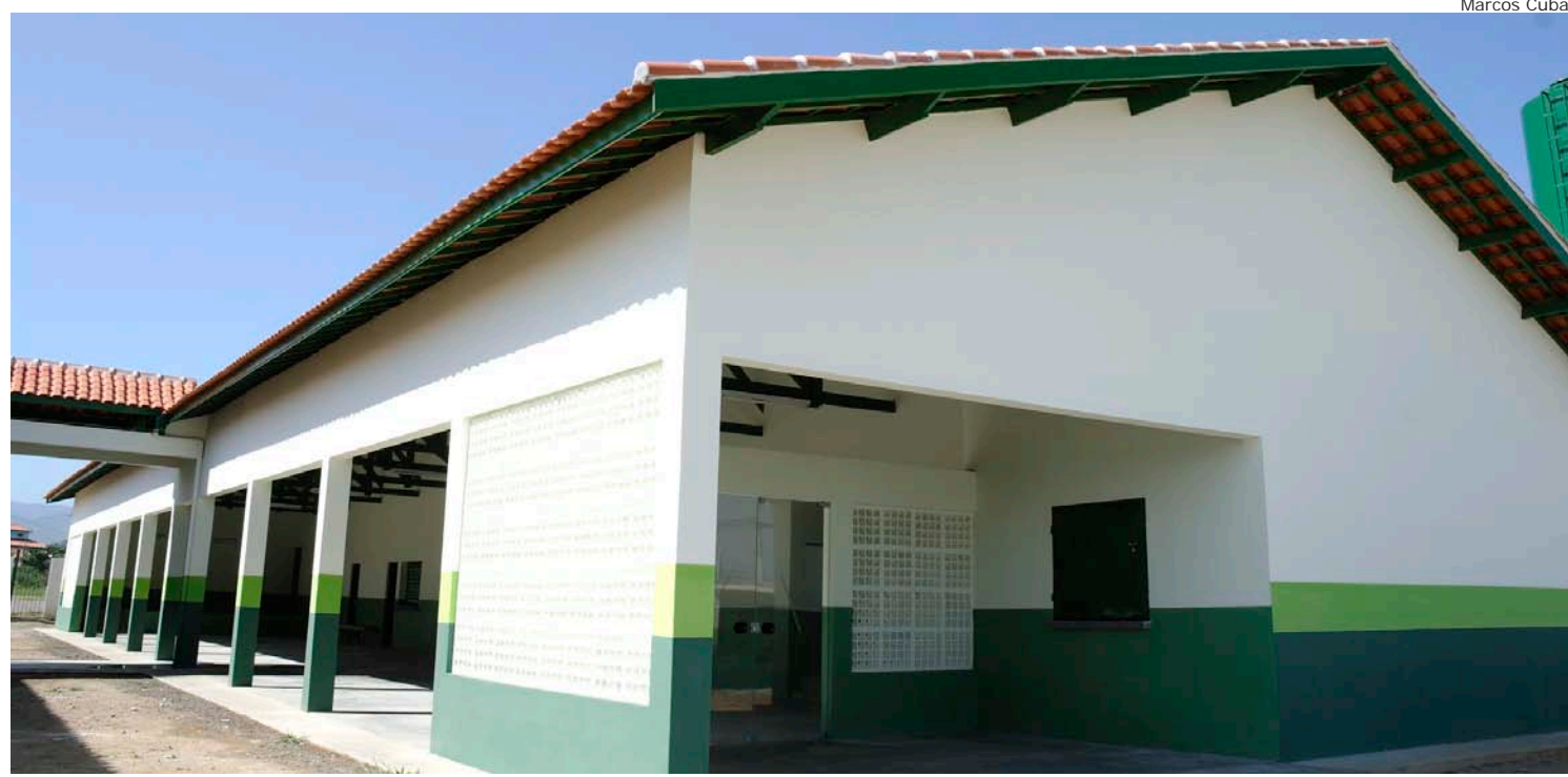
A nova unidade escolar possui 1.300m 2 e conta com oito salas de aula, e atenderá 500 alunos

Funcionarão uma sala de educação infantil, duas de primeiro ano, duas de segundo, uma de terceiro, duas de quarto ano e duas de quinto ano. Já foi instalado um parque da Primeira Infância, os horários para utilização serão estipulados e as brincadeiras serão monitoradas. O horário de atendimento no período da manhã, será das 7 às 12 horas,