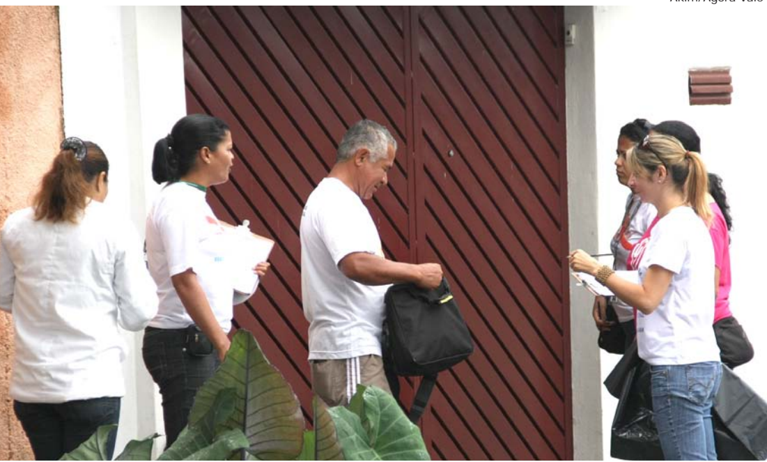
Profissionais da Prefeitura estão visitando as casas no combate a dengue