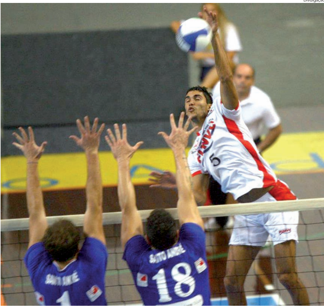
Pinda venceu a primeira partida da semifinal contra a equipe de Santo André