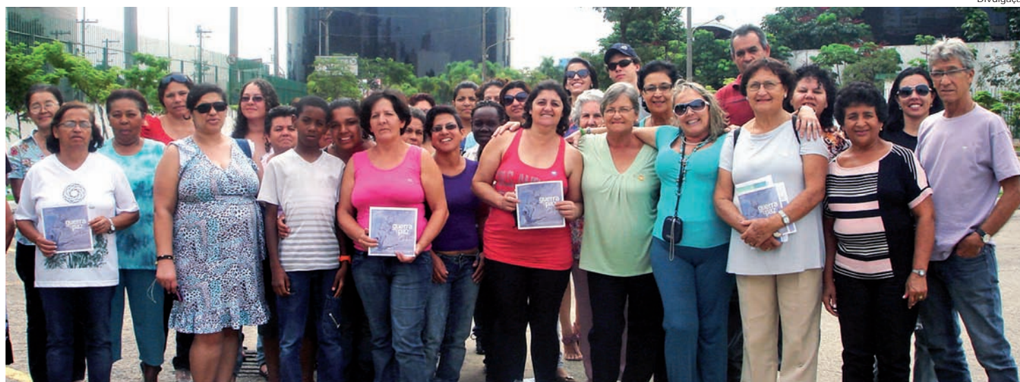
Grupo em Arteterapia de Pinda que participou da visita no Museu da América Latina elogiou o passeio

“A obra de Portinari aborda todos os aspectos da alma humana e da vida social. Da miséria e desgraça dos anseios da bem avenu-