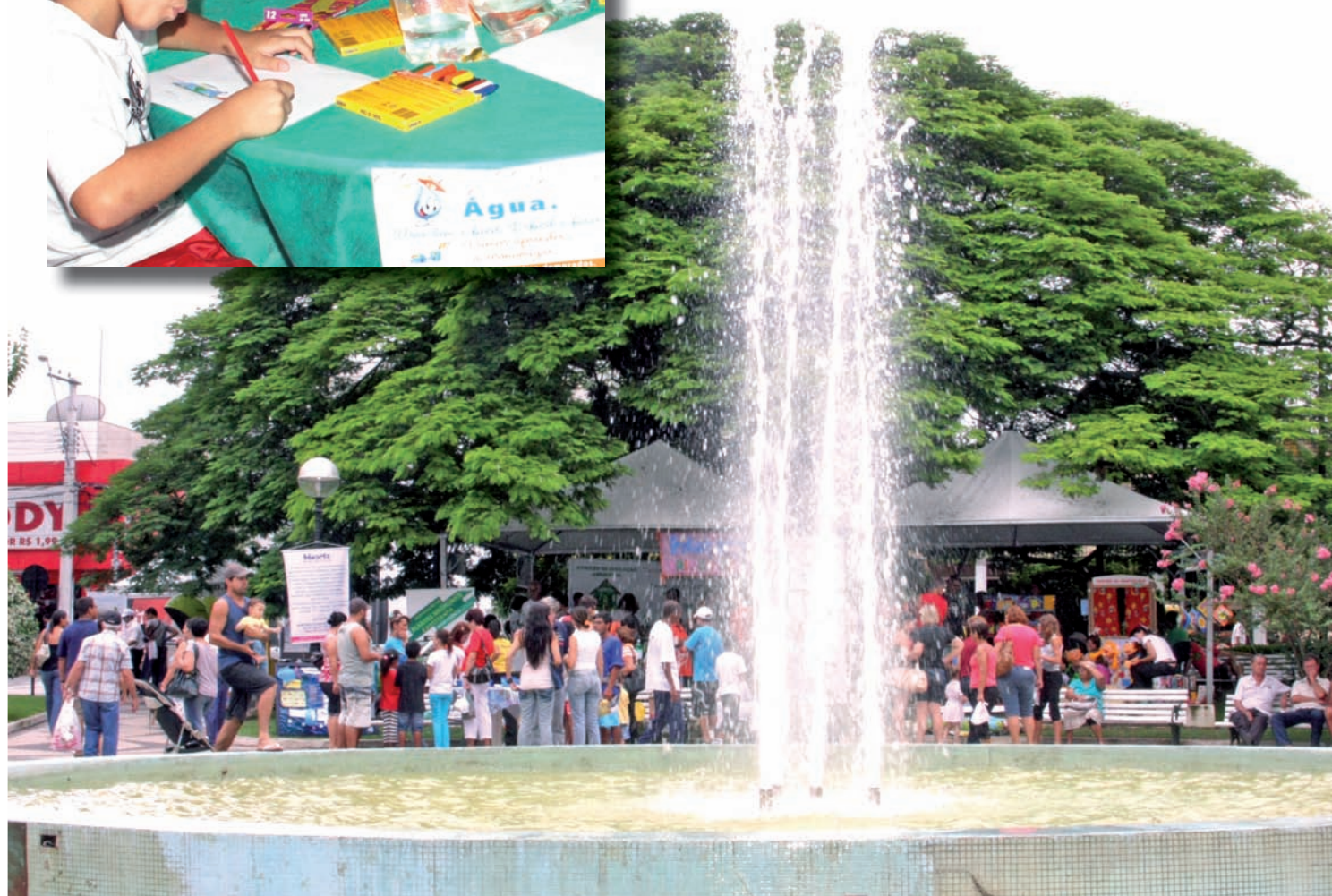
Evento na praça Monsenhor Marcondes, em 2011, comemorou o Dia Internacional da Água. Como parte da programação organizada pela Prefeitura, crianças (no detalhe) desenvolveram diversas atividades relacionadas ao uso racional da água