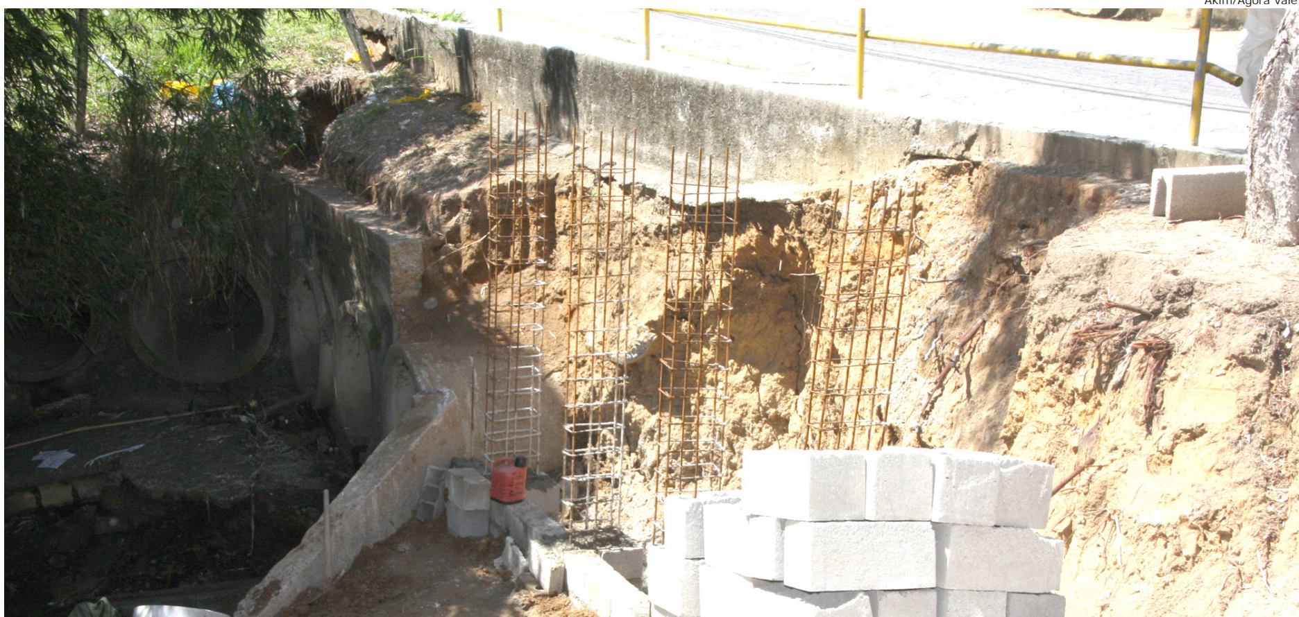
As obras da construção do muro começaram há duas semanas e o término está previsto para os próximos 25 dias úteis