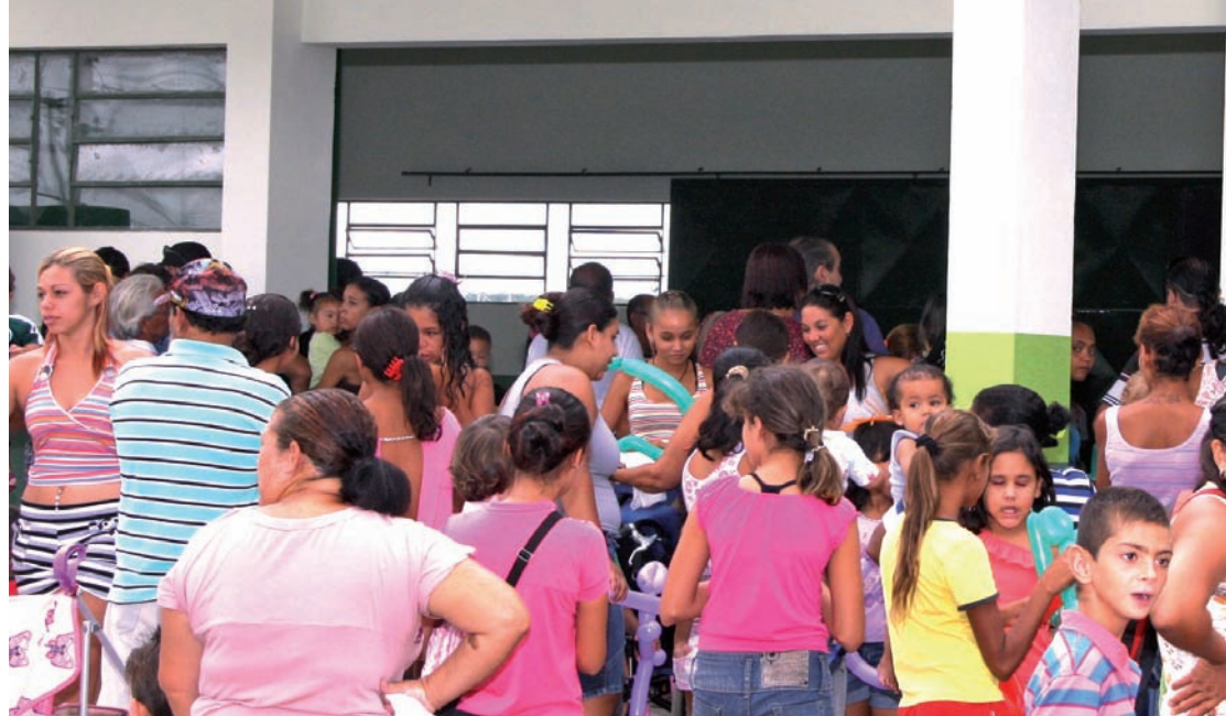
A comunidade marcou presença durante a inauguração de mais uma importante obra

poemas e assistir às performances: "A repercussão não poderia ter sido melhor. O fato de ser pego de surpresa, deixa a pessoa sem reservas e então ela absorve a poesia sem julgamento", comentou um dos artistas.