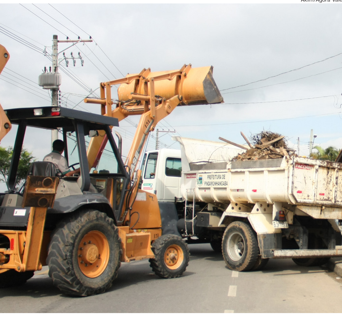
Através do “Cata-treco” a população tem a oportunidade de limpar suas residências e eliminar resíduos