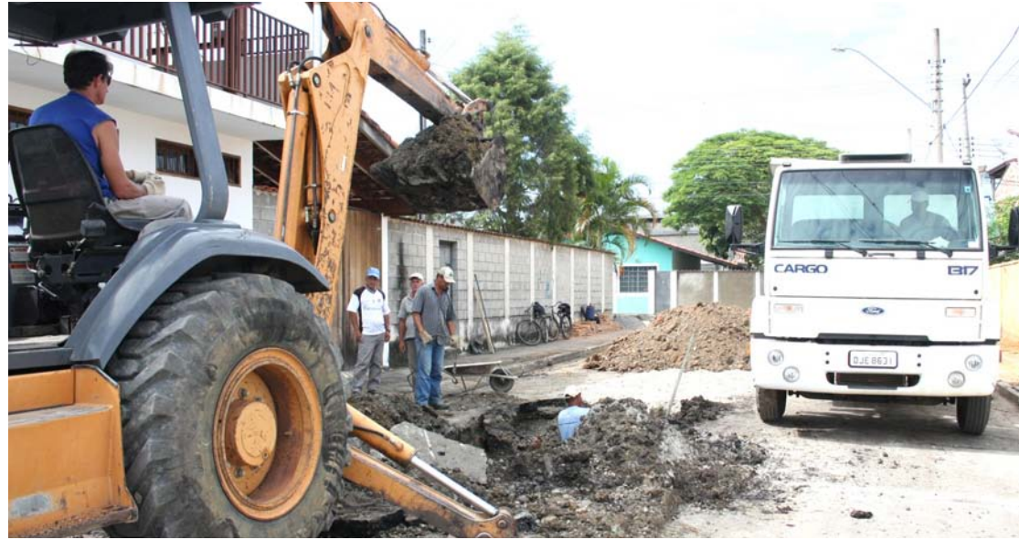
O dinheiro arrecadado com o IPTU é aplicado em obras de infraestrutura por toda a cidade

A Prefeitura de Pindamonhangaba, através do Departamento de Arrecadação, informa que os carnês do IPTU estão sendo entregues pelos Correios. Os munícipes que não o receberam até o dia 26 de março podem ir até a Prefeitura ou Subprefeitura para retirar a 2ª via. O horário de atendimento é das 8 às 17 horas.