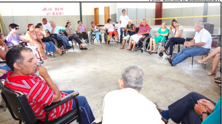
VEREADOR E CONVIDADO PARA PARTICIPAR DE IMPORTANTE REUNIÃO COM A ADEPI