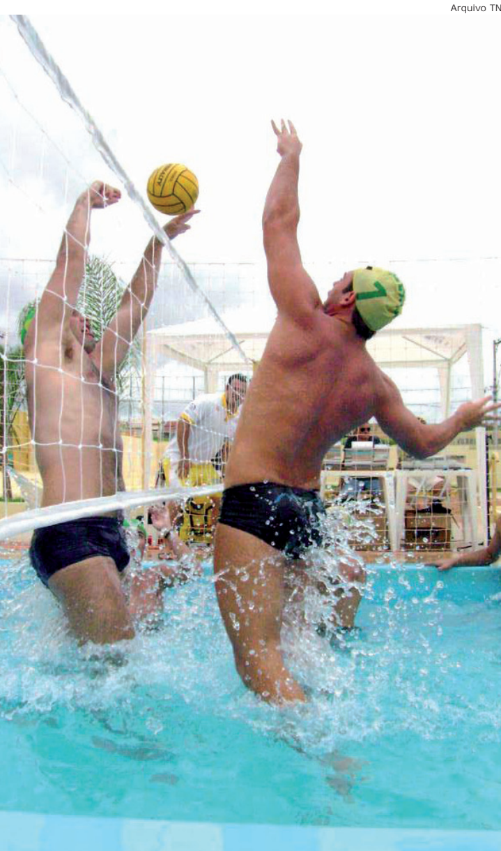
O biribol é uma espécie de vôlei jogado na piscina

Em tempos de calor não há nada melhor do que ficar na piscina. Agora imagine praticar um esporte, e ao mesmo tempo estar dentro da água. A atividade oferecida em Pindamonhangaba, por meio da Secretaria de Esportes, é o biribol. O esporte é uma partida de vôlei dentro da piscina.