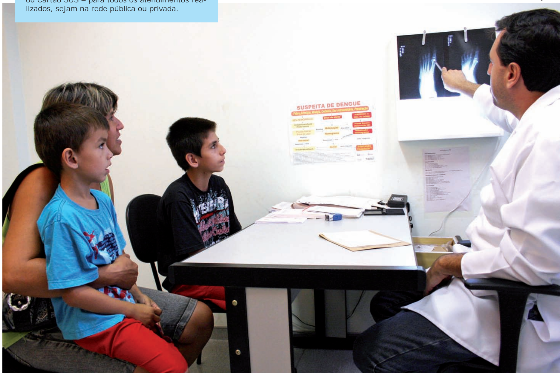
Com o cartão do SUS espera-se agilizar atendimentos e garantir a transparência da aplicação dos recursos destinados à saúde no Brasil