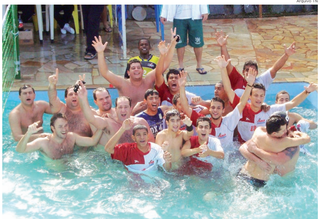
Equipe masculina de biribol de Pinda, campeã dos Jogos Regionais de 2011

As crianças e adolescentes podem praticar a modalidade na Escola de Esportes da Prefeitura de Pindamonhangaba, as aulas acontecem no Centro Esportivo João Carlos de Oliveira, "João do Pulo", as terças e quintas-feiras, nos se-