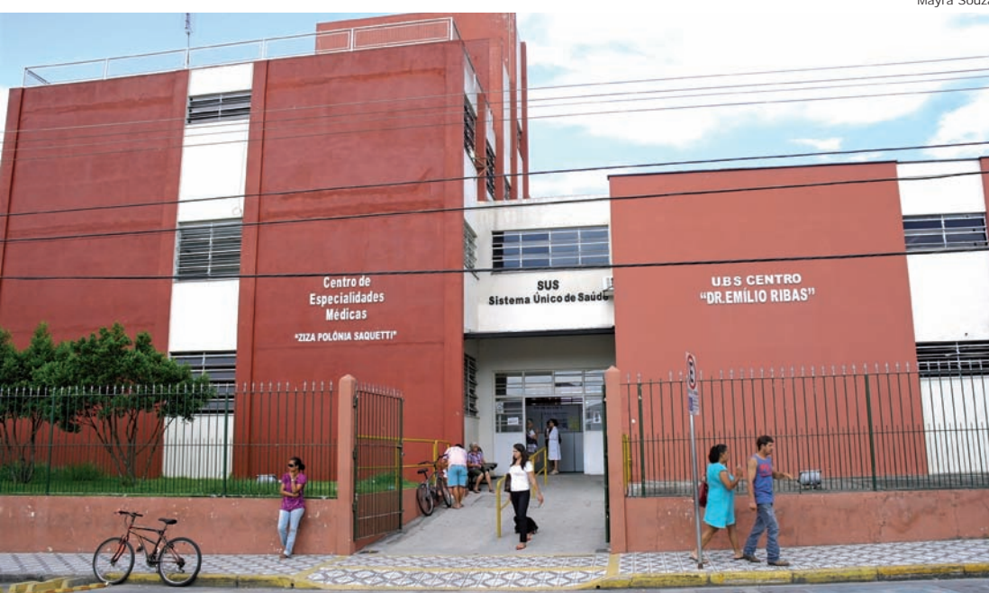
Centro de Especialidades Médicas foi reformado e ganhou equipamentos modernos

A dengue é uma doença séria e mata, portanto é necessário evitar a proliferação do mosquito Aedes Aegypti. Além de realizar visitas em residências, oferecer o serviço do Cata-treco, fazer a coleta de recicláveis, coleta de lixo, a Prefeitura de Pindamonhangaba também conta com um e-mail para que os munícipes possam fazer denúncias sobre a existência de focos de dengue na cidade, o contato é dengue@pindamonhangaba.sp.gov.br . O telefone 3644-5990 está disponível para oferecer informações. No e-mail o munícipe deve informar o nome, endereço, referência do endereço da denúncia e o denunciado.