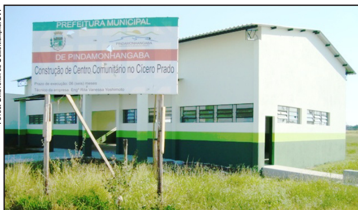
CENTRO COMUNITÁRIO DO BAIRRO CÍCERO PRADO SERÁ INAUGURADO NO DIA 17, SÁBADO, ÀS 10 HORAS

e Assistência Social, por meio do Requerimento nº 08/2012, de 06 de fevereiro de 2012. O órgão encaminhou resposta, informando que a população dos bairros Pinhão do Una, Pinhão do Borba e Borba está sendo atendida desde o dia 10 de fevereiro de 2012.