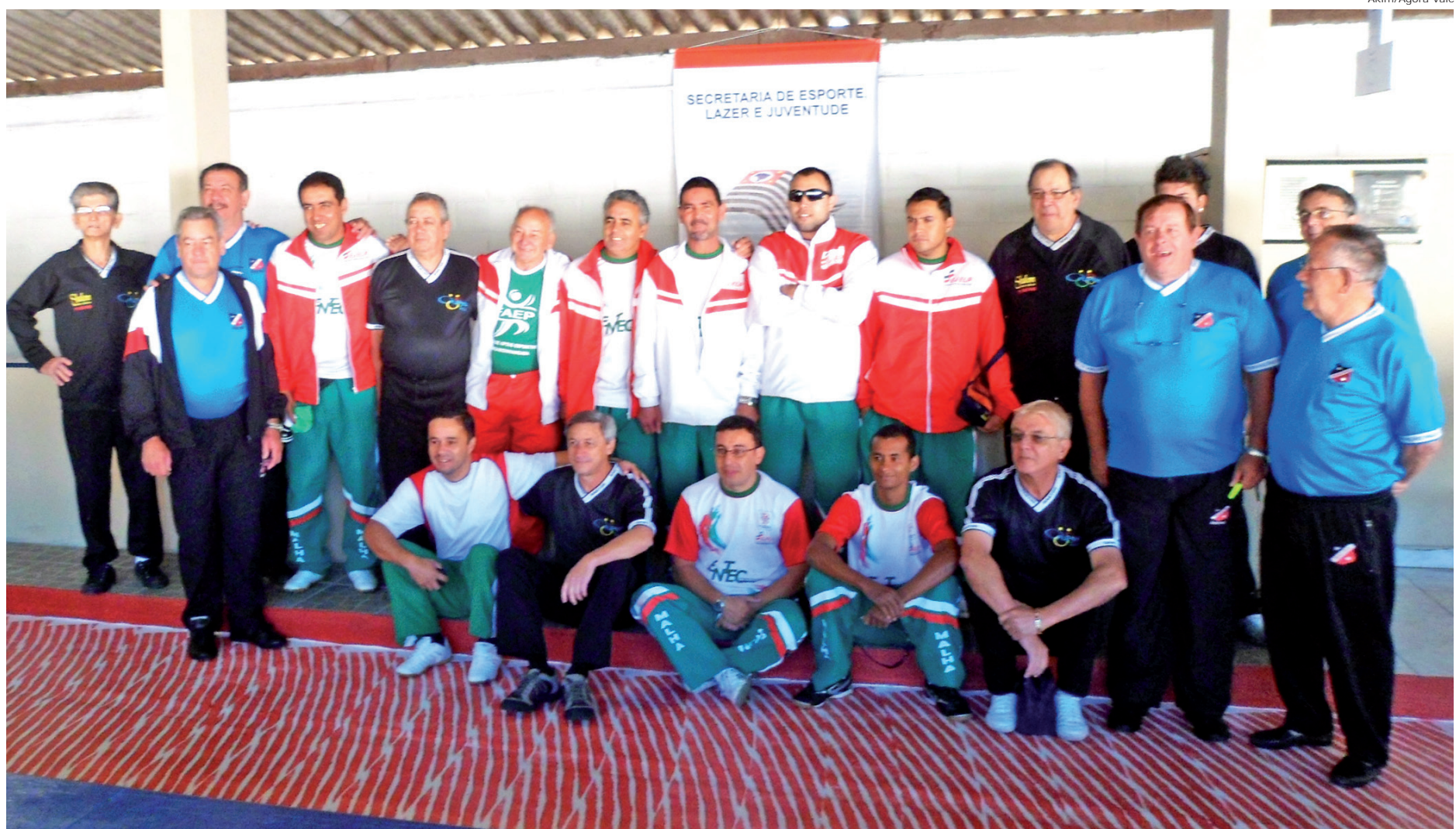
Em sua primeira participação na Taça São Paulo "Toninho Paiva", a equipe de malha de Pindamonhangaba consegue chegar à final

A Liga Municipal de Malha agradece o apoio da Prefeitura, através da Secretaria de Esportes, e ao parceiro Abdala Sport's.