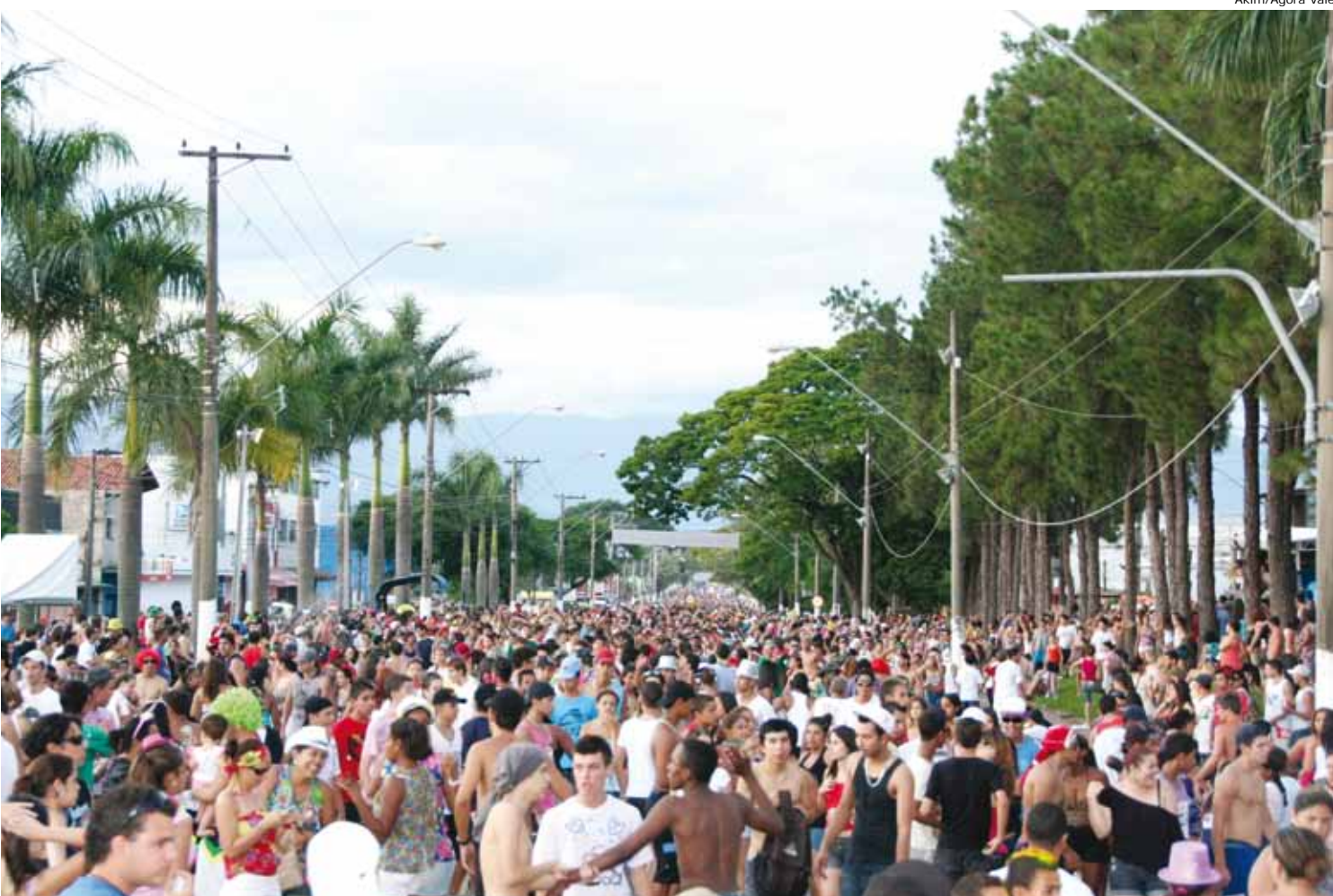
Avenida do Samba ficou completamente tomada pelos foliões durante a apresentação do "Juca Teles"