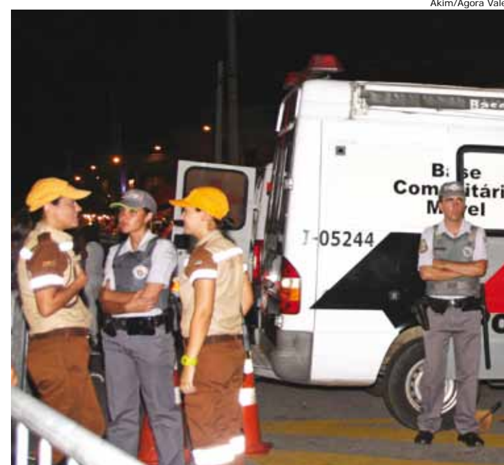
Polícia Militar atuou em parceria com Conselho Tutelar

Na Avenida do Samba havia um estande da Polícia Militar funcionando inclusive para a elaboração de Boletins de Ocorrência.