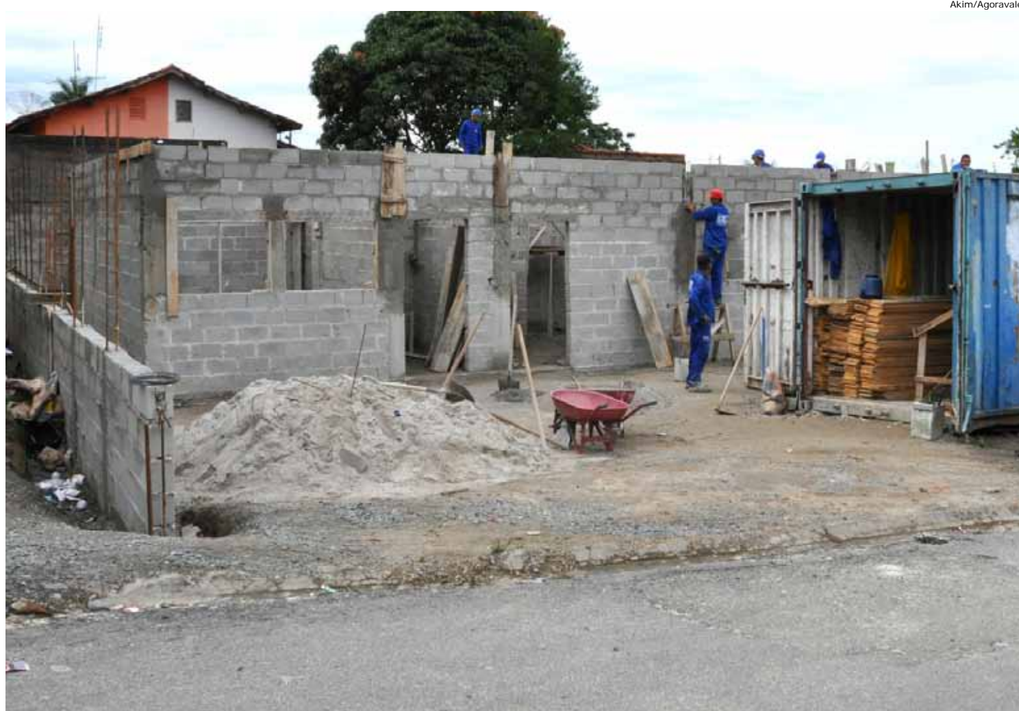
O dinheiro do IPTU é destinado à execução de obras por toda a cidade, como a UBS do Araretama

Com o pagamento do IPTU o contribuinte colabora com o desenvolvimento da cidade, a verba arrecadada é aplicada em saúde, educação, lazer, obras de infraestrutura, entre outras benfeitorias para o município.