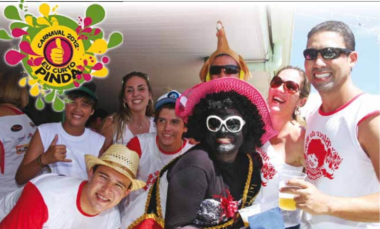
Animação dos componentes do bloco da Nega na concentração para o desfile