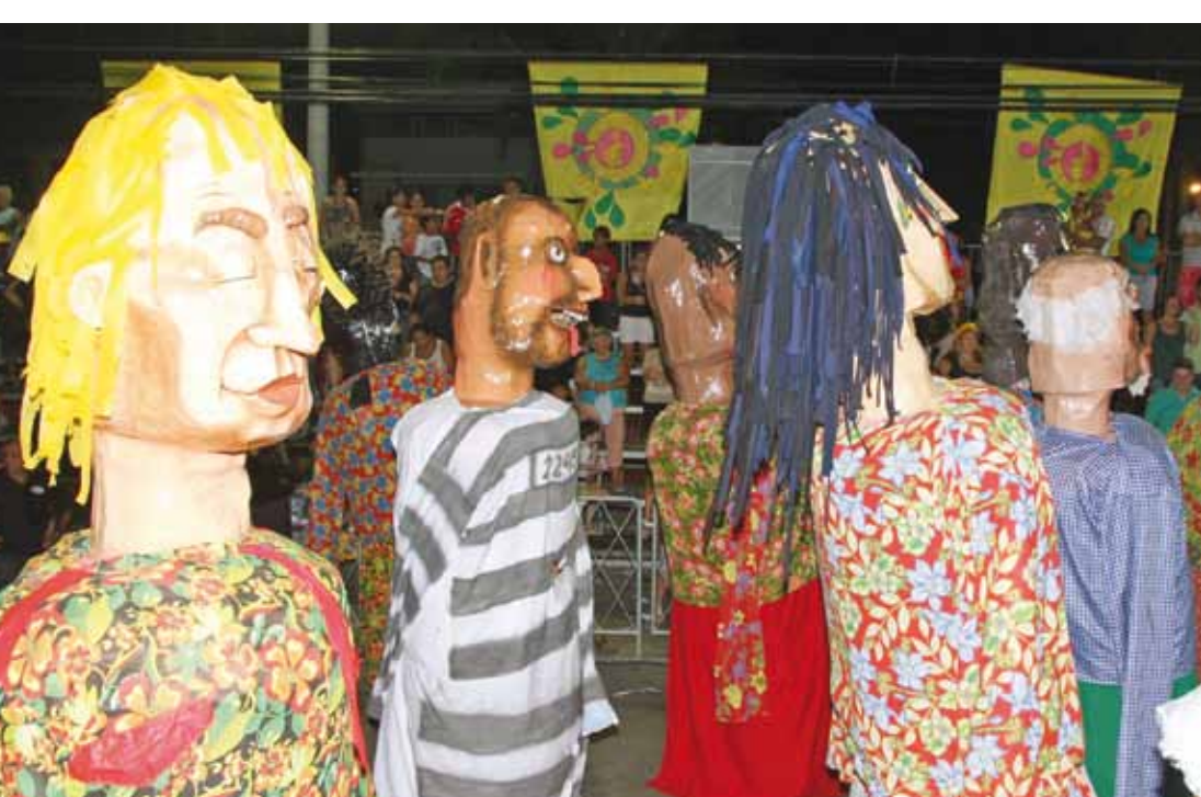
Bonecões do bloco Arteduale na Avenida do Samba

As agremiações integrantes do Carnaval 2012 em Pindamonhangaba receberam troféus de participação, no palanque de autoridades, na Avenida do Samba.