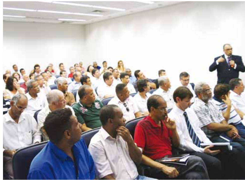
A Prefeitura fez várias reuniões sobre o assunto

A Prefeitura de Pindamonhangaba informa que termina na quarta-feira (29), o prazo para regularização de alvarás. Durante vários dias foram feitas diversas reuniões, no auditório da Prefeitura, para realizar orientações e esclarecer dúvidas. Contadores, corretores, membros de associações de classe, proprietários de imobiliárias, líderes religiosos, comerciantes, entre outros profissionais, participaram das ações.