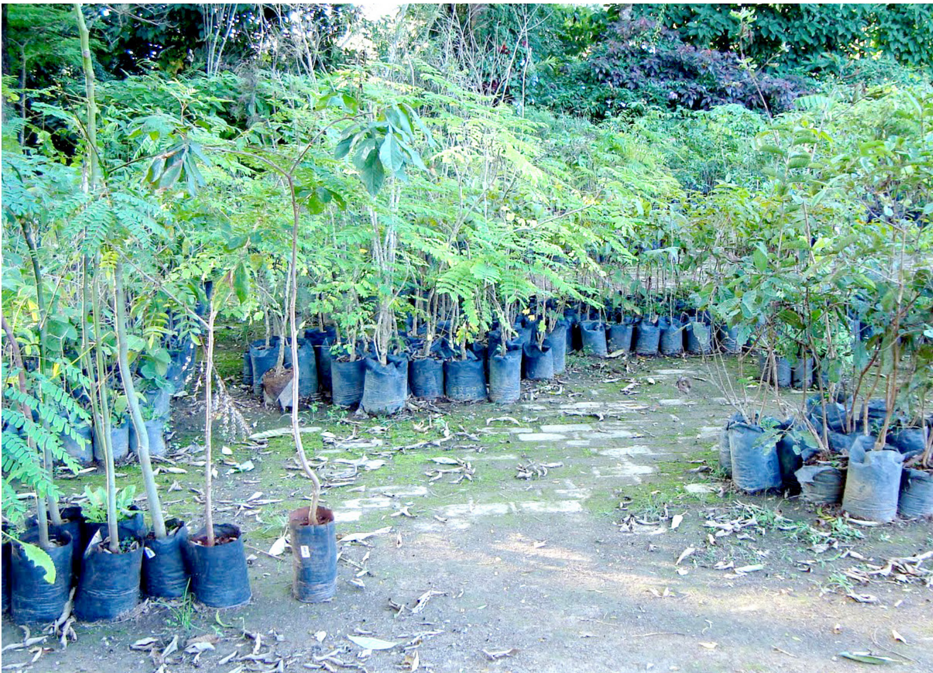
A próxima doação de mudas será nos dias 22 e 29 de março no Viveiro Municipal

Para mais informações, o telefone do Departamento de Meio Ambiente é o 3645-1494.