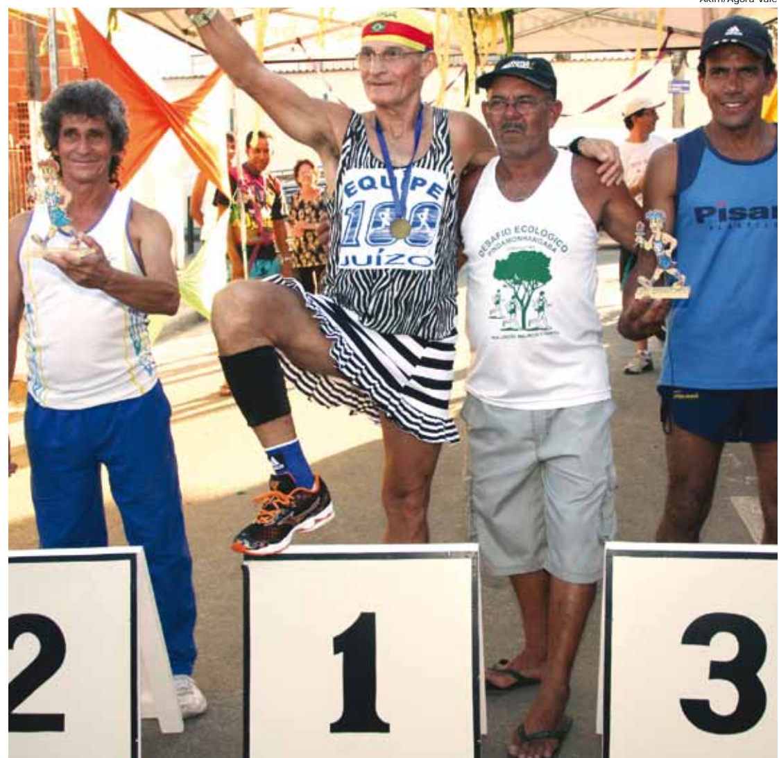
A Corrida das Dondocas também movimentou atletas da chamada Melhor Idade