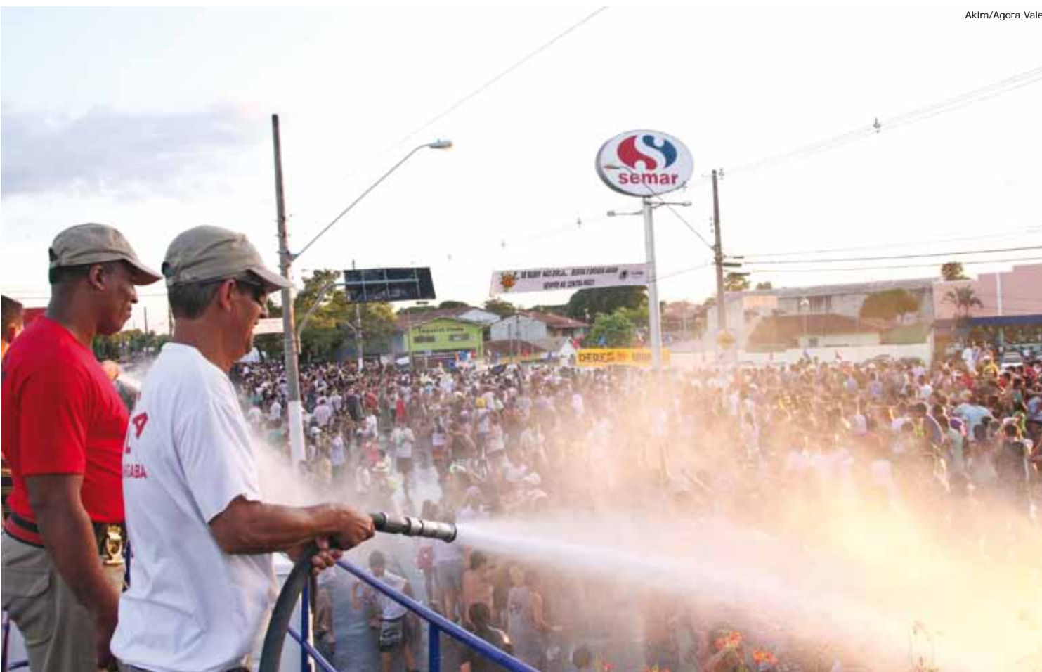
Ducha para refrescar os foliões que brincaram com o bloco Juca Teles debaixo de um sol escaldante