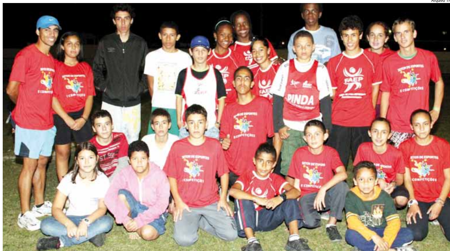
São várias as modalidades oferecidas e as inscrições podem ser feitas nos centros esportivos da cidade

Para mais informações é só entrar em contato pelo telefone 3648-2248.