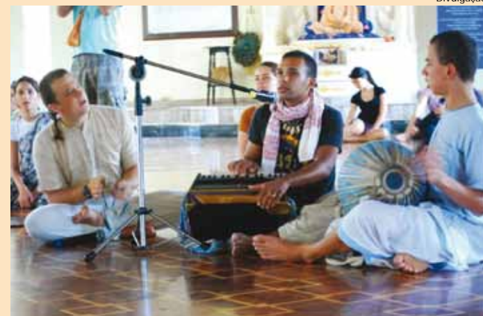
Evento contou com apresentações de música