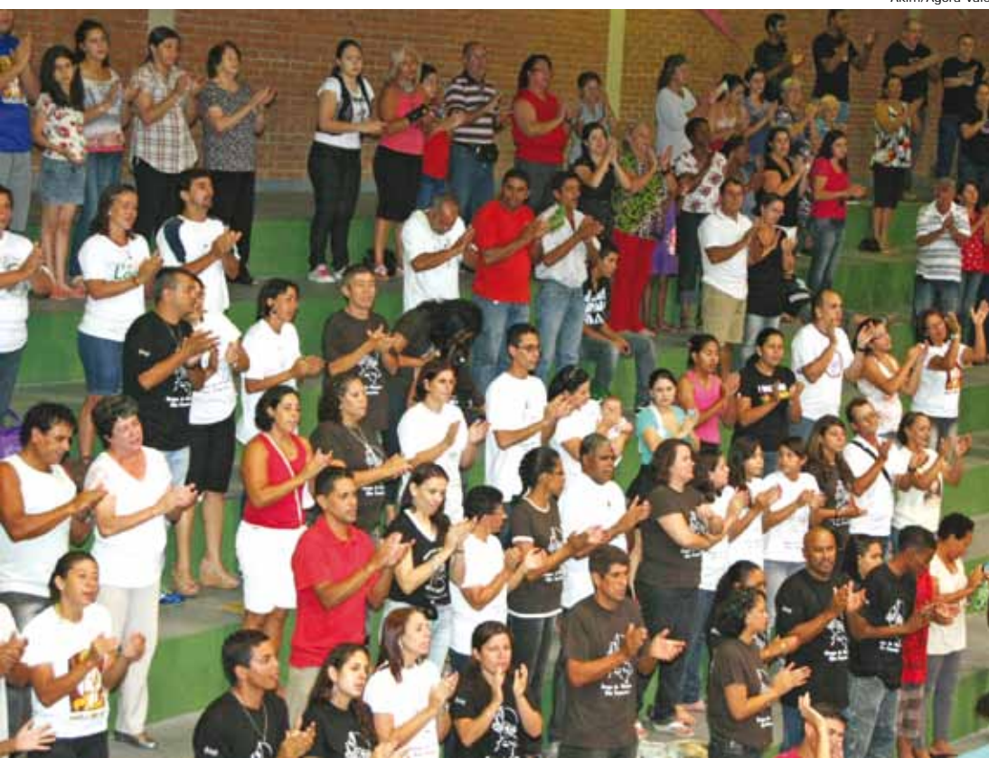
Fieis católicos participam de uma das celebrações do evento