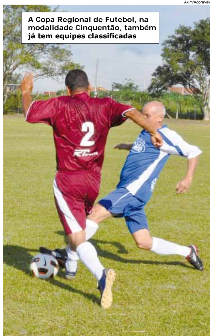
A Copa Regional de Futebol, na modalidade Cinquentão, também já tem equipes classificadas

Grupo A - Vila São José x Força Jovem; Araretama x Parque São Luiz; Santa Luzia x Grêmio Tipês. Grupo B - Floresta x Bela Vista; Independente x Bandeirante; Atlético Rosário x Vila São Geraldo.