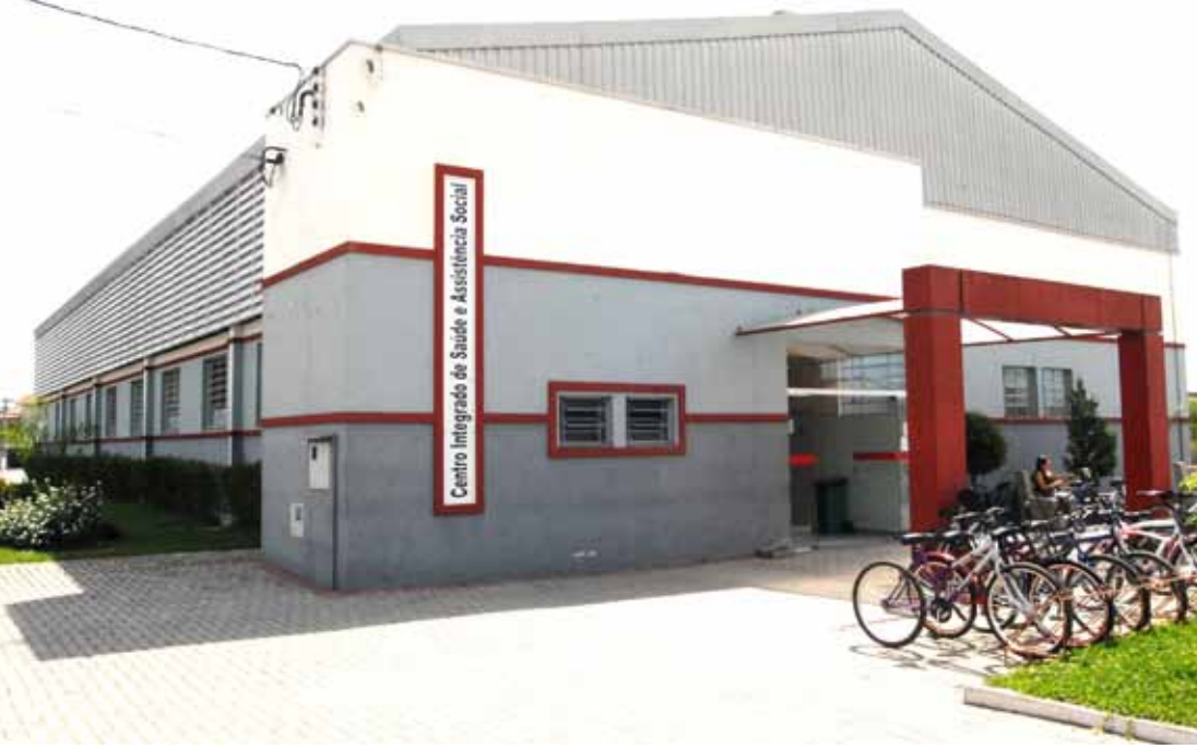
Usuários poderão conseguir o cartão no Cisas, em Moreira César

A Secretaria de Saúde e Assistência Social de Pindamonhangaba realizará nos dias 3, 10, 17, 24 e 31 de março, das 8 às 17 horas, mutirão para que os munícipes que não possuem o Cartão Nacional do SUS – Sistema Único de Saúde possam adquiri-lo.