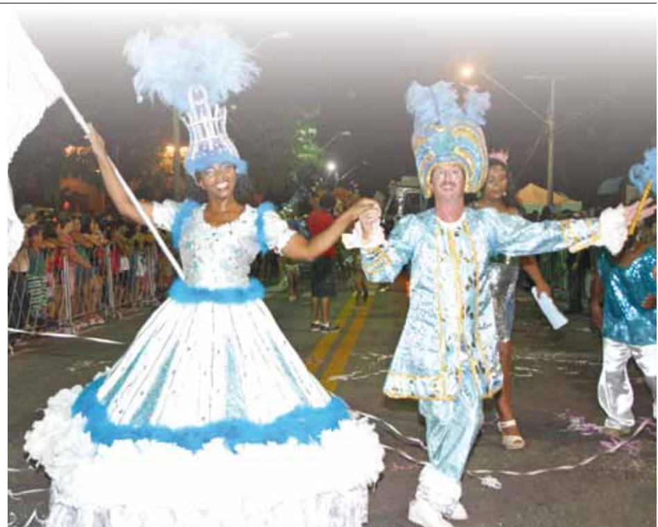
Porta-estandarte da escola Mocidade do Campo Alegre