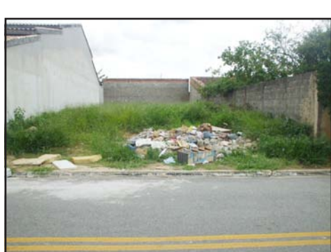
TERRENO UTILIZADO PARA JOGAR ENTULHO