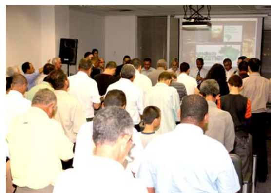
Posteriormente, em 2010, a Prefeitura passou a oferecer mais incentivos a todos