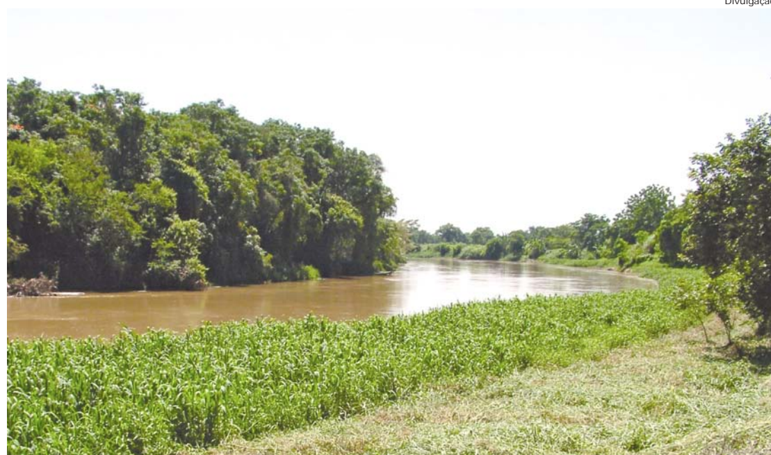
A biodiversidade da região depende das águas do rio Paraíba do Sul

Os Safs podem tornar-se uma das formas mais sustentáveis de restauração da Mata Atlântica, explicou o pesquisador, convertendo-se o ecossistema degradado em outro, com destino e uso distintos, mais produtivo e com baixo uso de recursos externos e de capital.