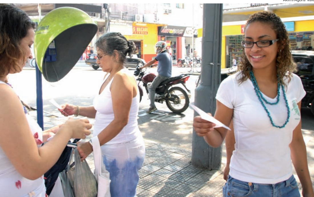
Grupo entregou panfletos com a letra da música sobre prevenção no Carnaval