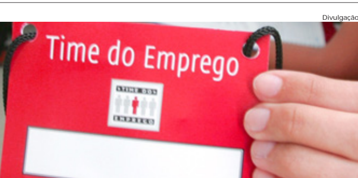
Time do Emprego beneficiou 15 mil pessoas em SP