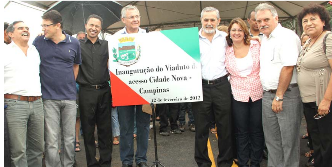
Autoridades celebram inauguração do acesso Cidade Nova/bairro das Campinas