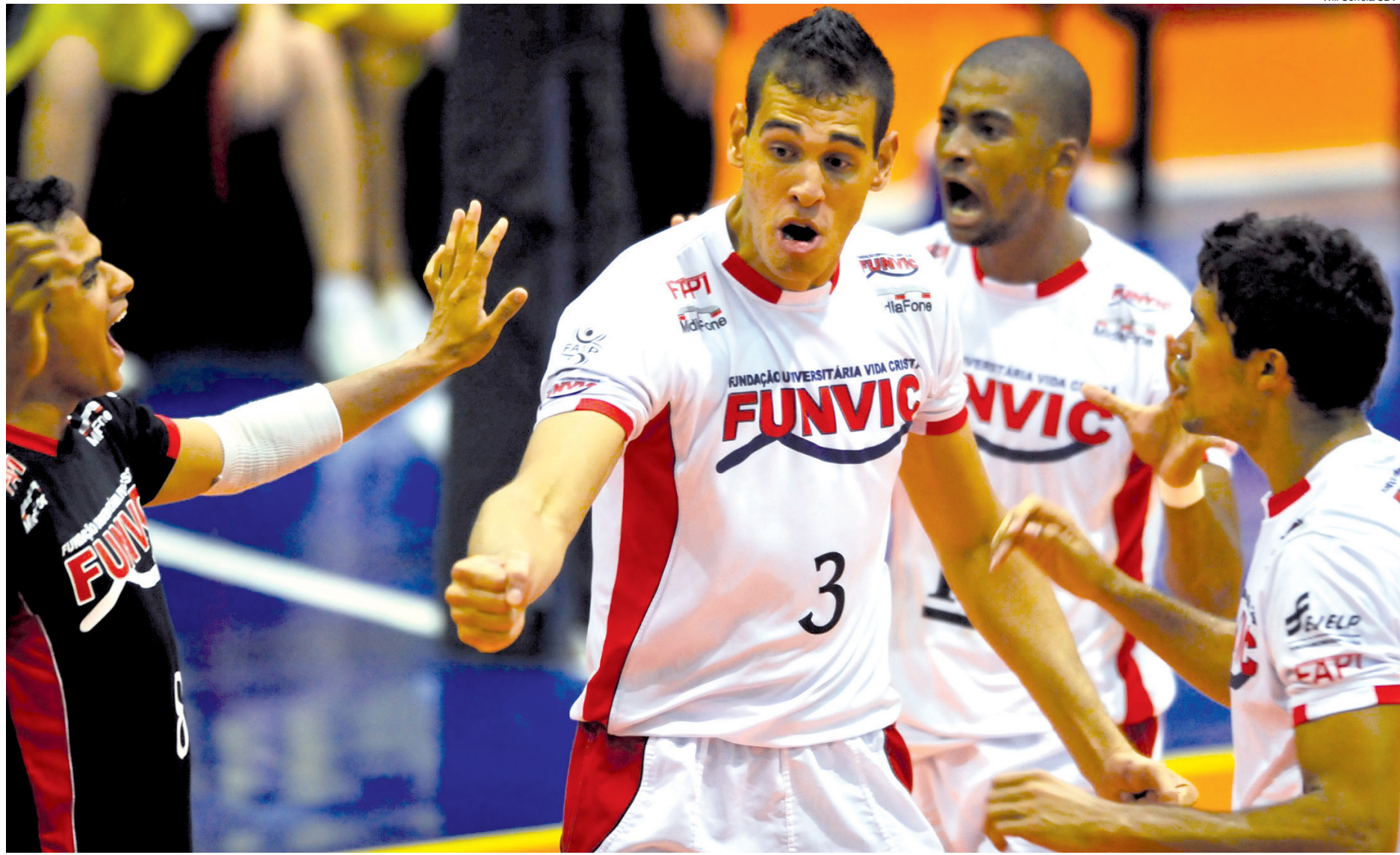
A equipe de vôlei de Pinda garantiu a classificação para a semifinal da Superliga faltando uma rodada para o final desta primeira fase

A Funvic/Mídia Fone volta a jogar no início do mês de março, em Fortaleza-CE. A estreia neste 7º Gran Prix, o quarto do grupo A, será diante da UFC/CE, no dia 1º de março, às 16 horas. No dia 2, a Funvic enfrenta o Sport Recife, também às 16 horas, e no dia 3 será a vez de encarar o Morro da Fumaça, em partida marcada para às 11 horas. Os jogos acontecerão no ginásio Náutico Atlético Cearense, com transmissão