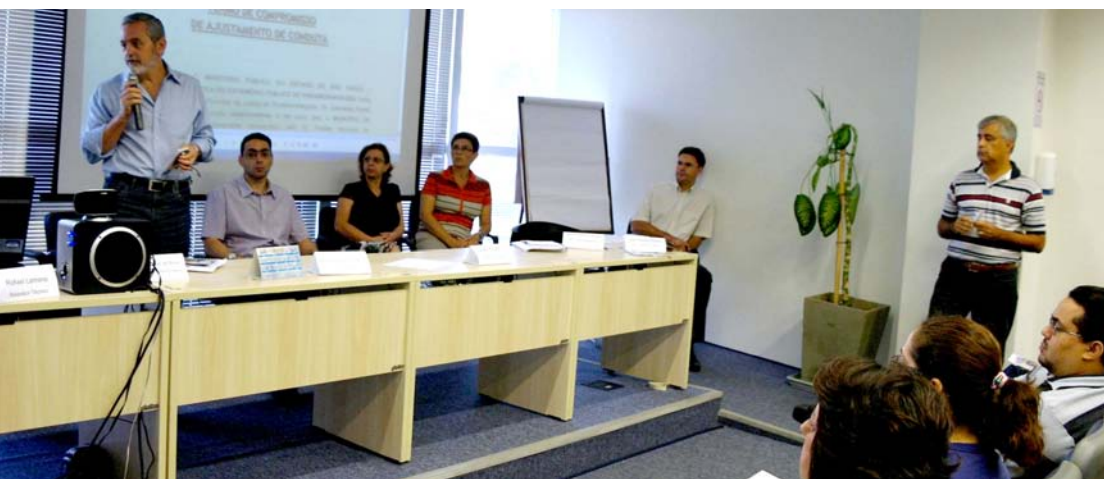
Ainda no dia 9, Prefeitura explicou novamente os procedimentos de regularização