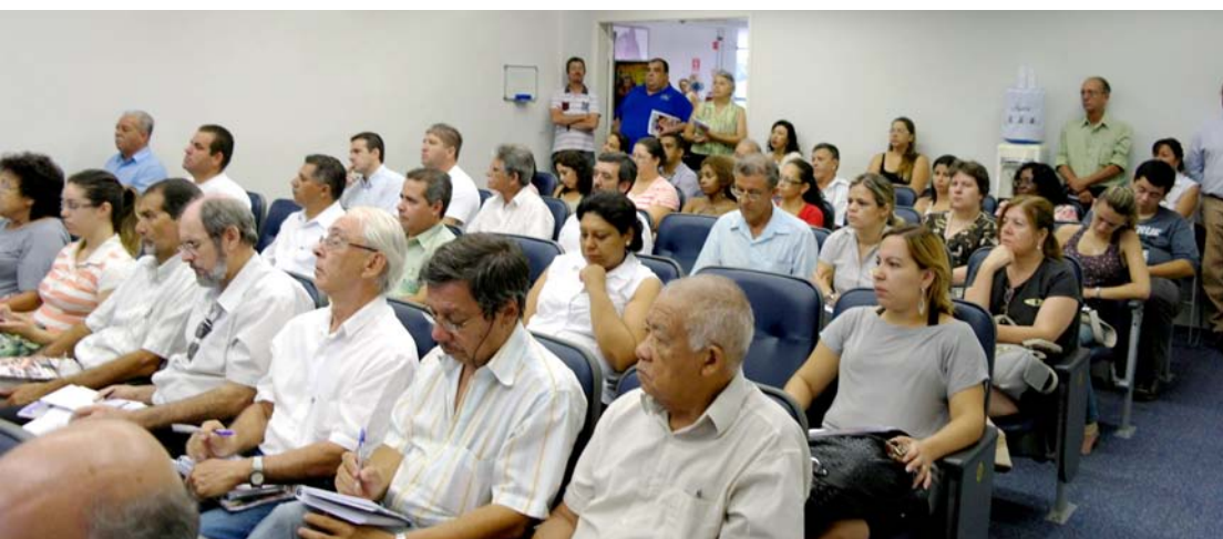
Entre contadores, engenheiros e profissionais de classe, cerca de 80 pessoas compareceram à reunião do dia 9 de fevereiro de 2012, na Prefeitura