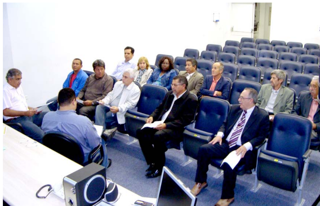
Primeiras reuniões esclareceram dúvidas dos interessados e detalhes da regularização no dia 4 de agosto de 2009

De agosto de 2009 até hoje foram realizados vários encontros com representantes de instituições de classe, comerciantes, engenheiros, contadores, líderes religiosos, dentre outros.