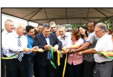
DESENLAÇE DA FITA INAUGURAL