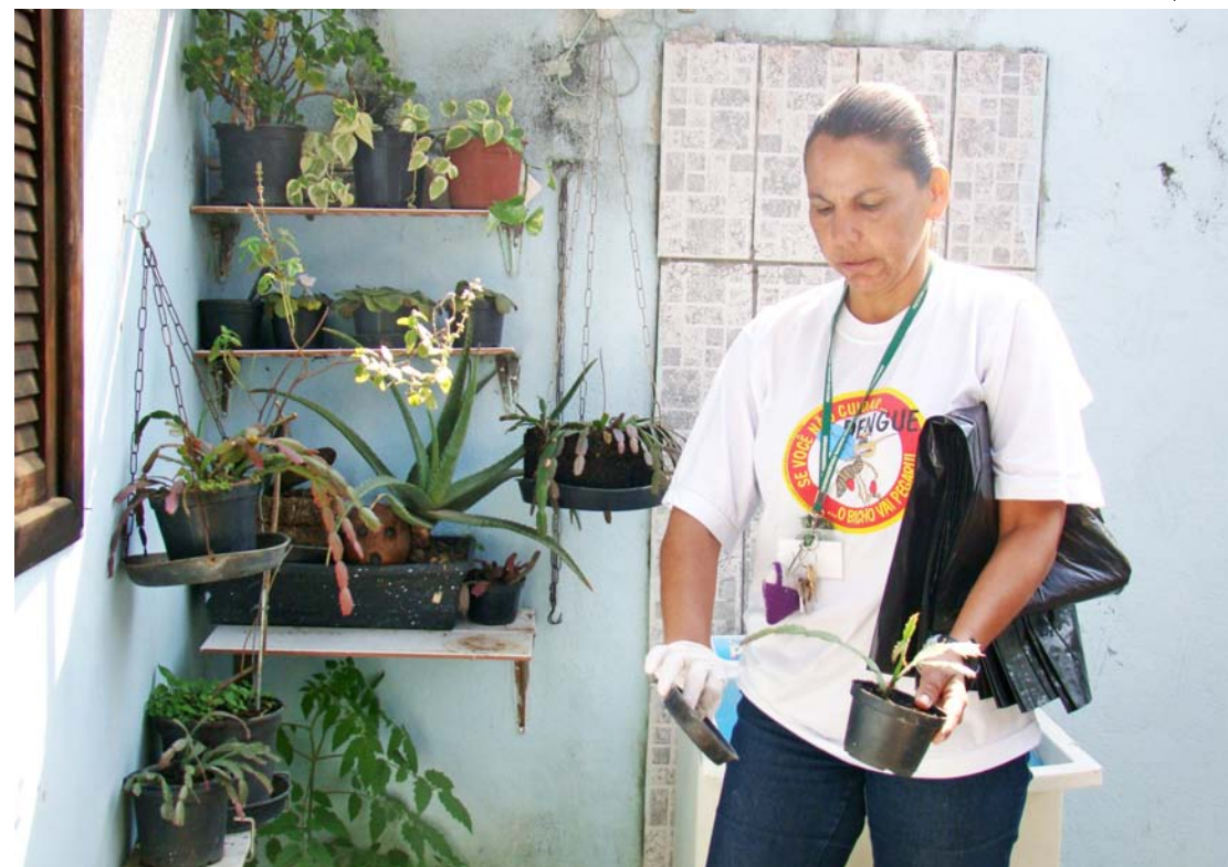
Vasos de plantas são vistoriados pelas equipes que fazem o arrastão contra a dengue

A melhor forma de evitar a dengue é combater os focos de acúmulo de água, locais propícios para a criação do mosquito transmissor da doença. Para isso, é importante não acumular água em latas, embalagens, copos plásticos, tampinhas de refrigerantes, pneus velhos, vasilhinhos de plantas, jarros de flores, garrafas, caixas d’água, tambores, latões, cisternas, sacos plásticos, lixeiras, entre outros.