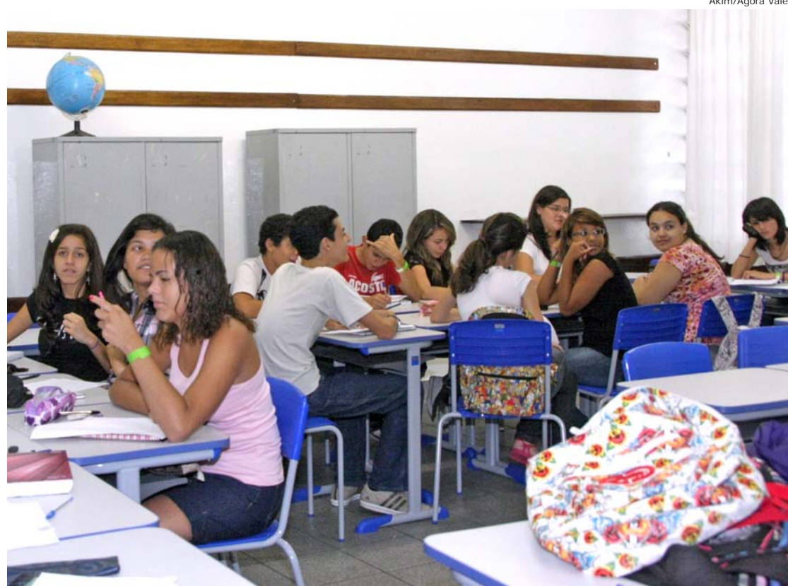
O programa apresenta uma estrutura que conta com salas temáticas de português, história, arte e geografia e salas de leitura e informática.