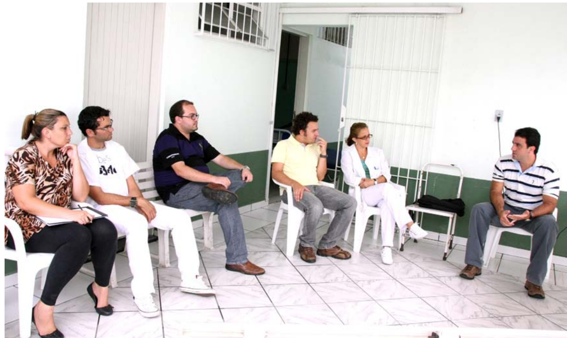
Treinamento visa melhorar o atendimento a pacientes com transtornos mentais

Esse encontro tem como objetivo a atualização de novas técnicas terapêuticas de emergência psiquiátrica com pacientes portadores de transtornos mentais, propiciando uma capacitação técnica de profissionais ao atendimento de pacientes