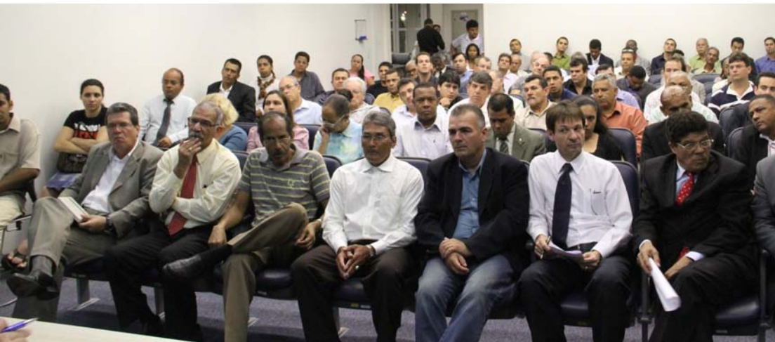
Em setembro de 2011, Prefeitura promoveu mais um encontro com religiosos

A Prefeitura procurou o Ministério Público e conseguiu prorrogar o prazo para 29 de fevereiro de 2012. Agora, esta data é definitiva. Os estabelecimentos que estiverem sem alvará terão que ser multados e interditados.