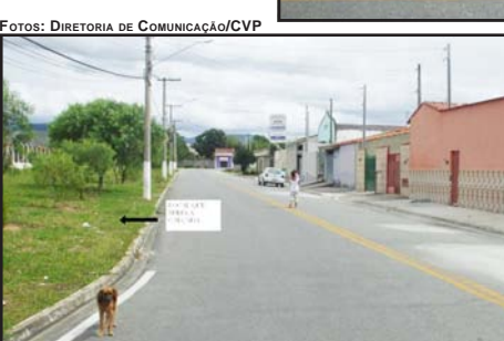
LOCAL DA CALÇADA