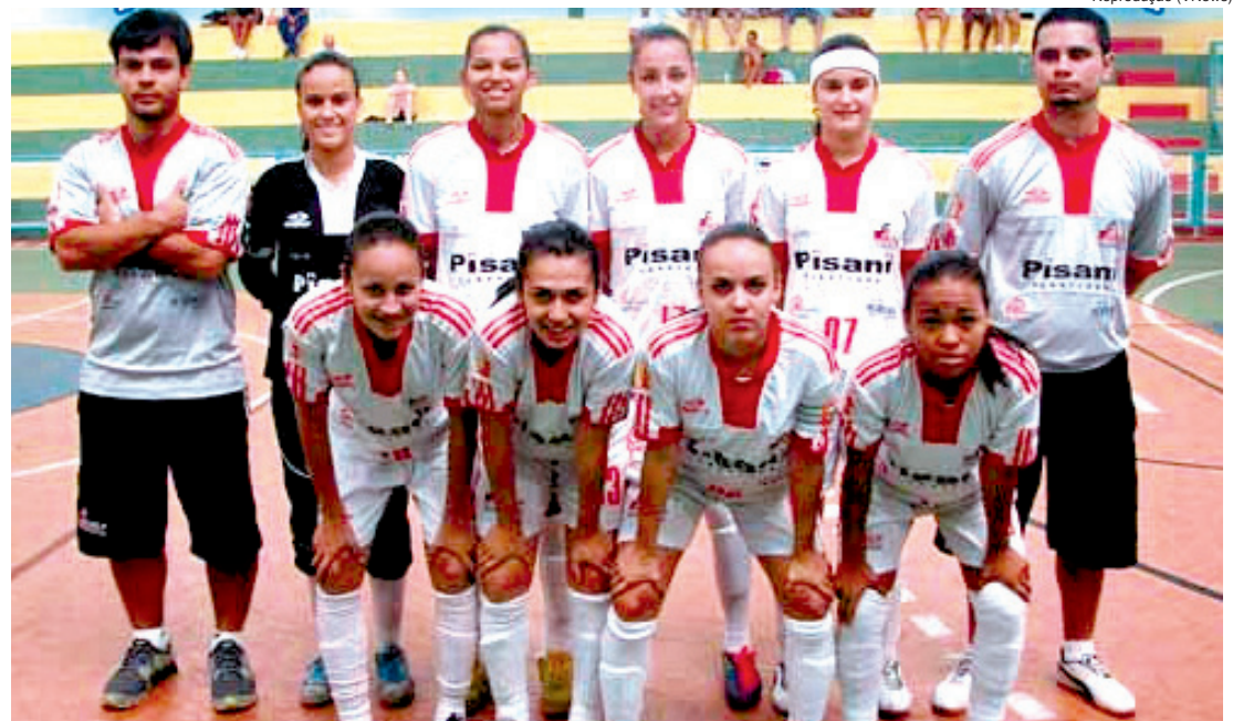
Equipe de futsal feminino de Pinda ficou em 3º lugar na classificação geral