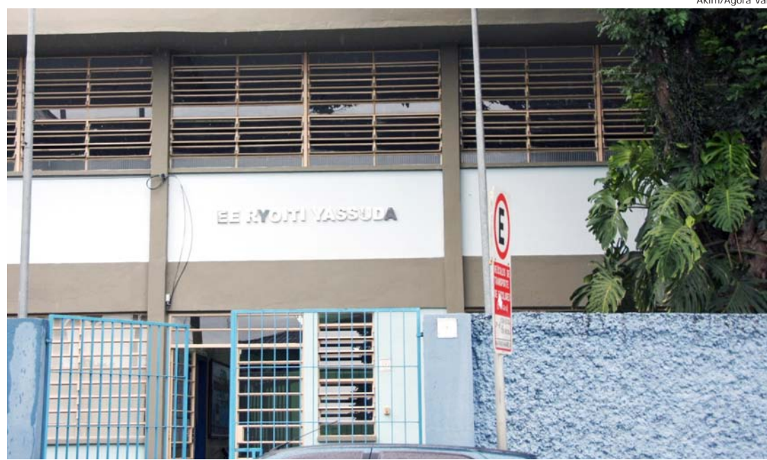
Fachada da escola Ryoiti Yassuda, que terá sua jornada de ensino ampliada

Além das disciplinas obrigatórias para o Ensino Mé-