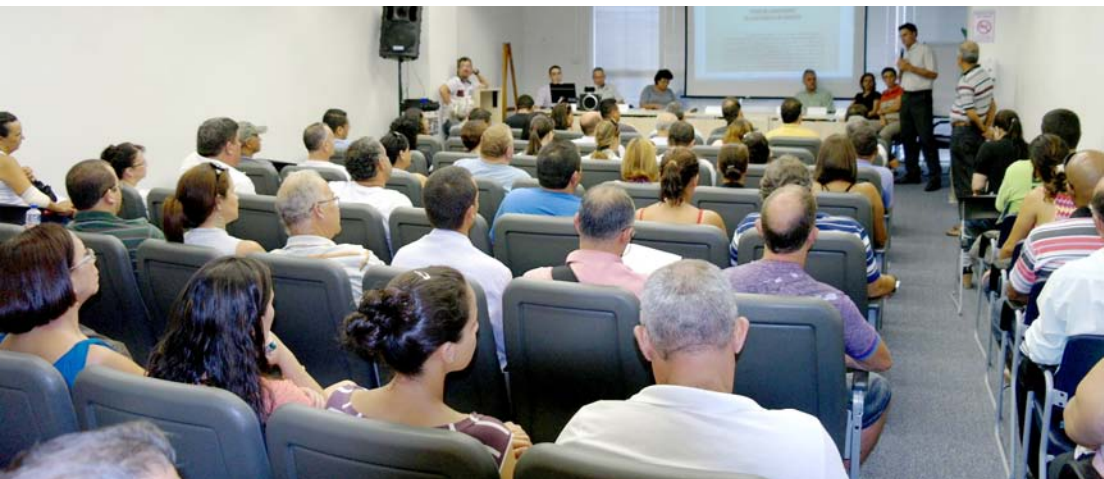
Comerciantes participaram da reunião e esclareceram dúvidas sobre regularização com representantes da Prefeitura, no dia 9 de fevereiro de 2012

A Prefeitura de Pindamonhangaba vai continuar com o ciclo de palestras e orientações sobre regularização de alvarás, iniciados em agosto de 2009 e intensificados em 2010, 2011 e 2012. A intenção da Prefeitura é oferecer nova oportunidade e mais esclarecimentos às pessoas com estabelecimentos em situação irregular.