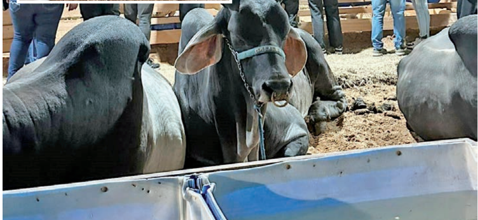
Os animais em exposição foi uma atração à parte para a garotada

O 'Festival do Tropeiro 2024' reuniu um público de mais de 60 mil pessoas nos quatro dias do evento, com muitas atrações musicais, comidas deliciosas, brinquedos e um espaço kids, além de uma fazendinha para a garotada.