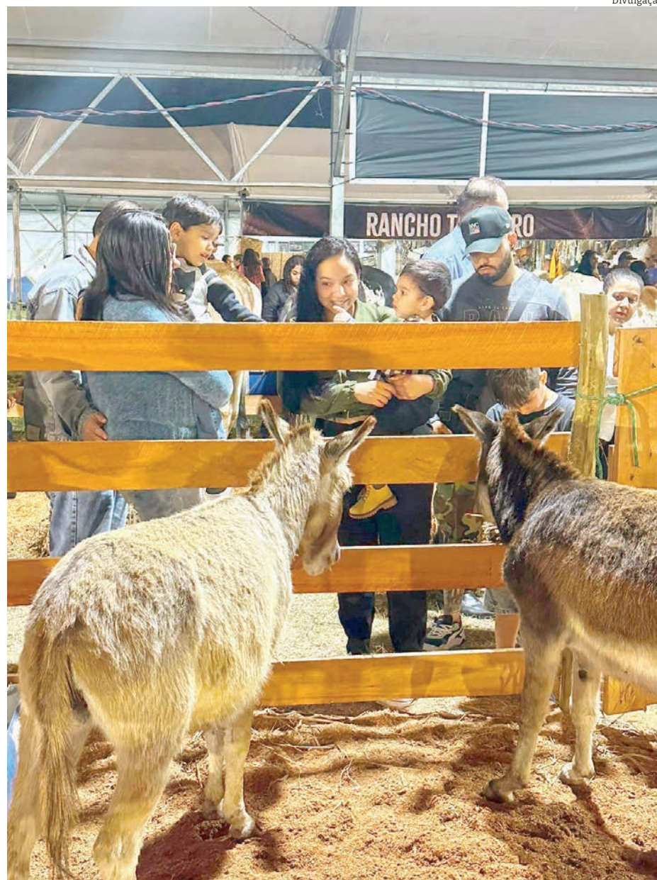
As crianças puderam interagir com os animais na fazendinha do espaço kids