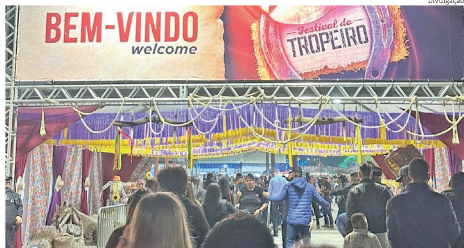
O 'Festival do Tropeiro' atraiu mais de 60 mil pessoas, inclusive crianças

Vale destacar aqui o cuidado dos proprietários dos animais e o carinho das crianças. Valeu!