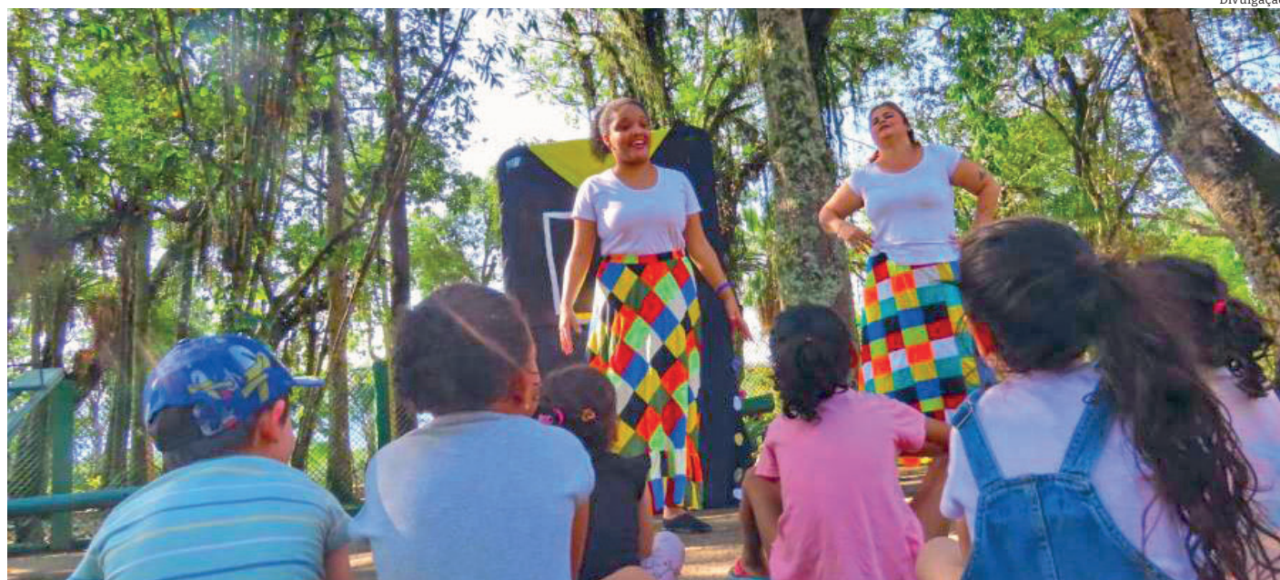
No Bosque da Princesa, serão realizadas contação de histórias às 15 horas, nos dias 14, 18, 20, 23 e 26 de julho