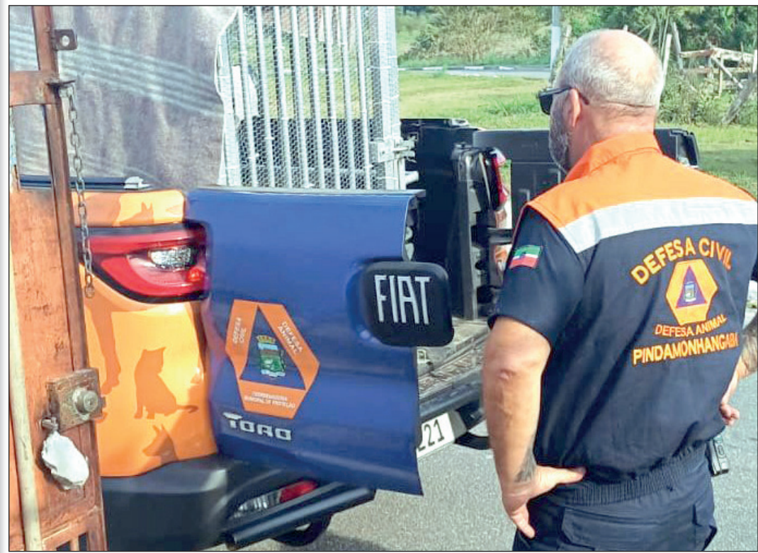
O tutor perdeu a guarda do animal, que foi encaminhado ao Cepatas

O tutor perdeu a guarda do cachorro, que foi encaminhado ao Cepatas. A operação contou com a participação da Polícia Militar Ambiental e o apoio da Secretaria de Meio Ambiente e Defesa Animal e da Secretaria de Segurança Pública.